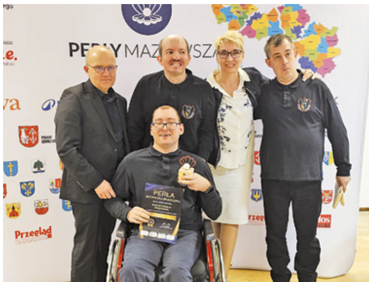
Na zdjęciu Perła Aktywności Społecznej Miasta i Gminy Piaseczno – Drużyna Pożarnicza Anioły Floriana

To często miesiące przygotowań, prób, uzgodnień, pracy logistycznej i promocyjnej, której nie widać. Robimy to wszystko z pasją, ale też z dużym po-