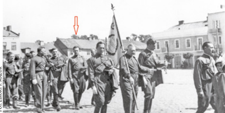
Rok 1938, defilada Towarzystwa Gimnastycznego „Sokół”, w tle budynek, który zniknął w pierwszych latach wojny. Należał do gminy żydowskiej, tak jak mykwa i synagoga

Anny. Tu jest dopiero zagadka. Jak wiemy do roku 1794 zmarli w Piasecznie byli chowani na cmentarzu dookoła kościoła. Zwyczaj mieszczanie na pewno tak, ale były też osoby z piaseczyńskiej arystokracji, niektórych z nich grzebano w Warszawie, ale nie wszystkich. I tu przyszło mi na myśl, że zapewne są w