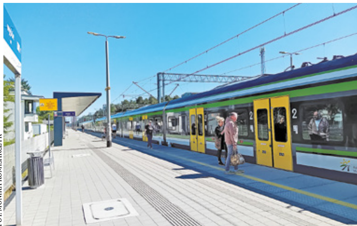
Mieszkańcy korzystający z komunikacji publicznej nie będą musieli kupować osobnych biletów na pociąg i środki warszawskiego transportu miejskiego

To rozwiązanie oznacza, że posiadając ważny bilet ZTM, można podróżować pociągami KM i WKD w granicach 1. i 2. strefy biletowej, bez konieczności zakupu dodatkowych biletów. Dotyczy to m.in. trasy Warszawa Jeziorki – Zalesie Górne oraz przesiadek na komunikację miejską w stolicy.