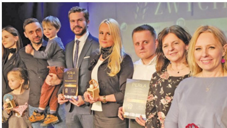
Tegoroczna Gala odbyła się 8 kwietnia w Hugonówce w Konstancinie-Jeziornie

kowski, grodziski, otwocki, zachodni warszawski oraz garwoliński. Do kategorii dołączyły nowe wyróżnienia, takie jak Perła Energii i Natury oraz Perła Aktywności Społecznej.