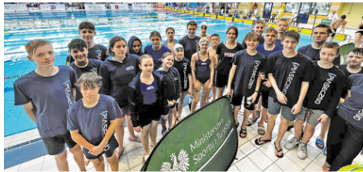
Mocna reprezentacja sekcji pływackiej MKS Piaseczno

– Warto podkreślić, że porównanie wyników do życiówek z basenu 25-metrowego nie oddaje w pełni realnej progresji z pływalni 50-metrowej, dlatego tym większe brawa dla tych, którzy na długim basenie poprawili swoje re-