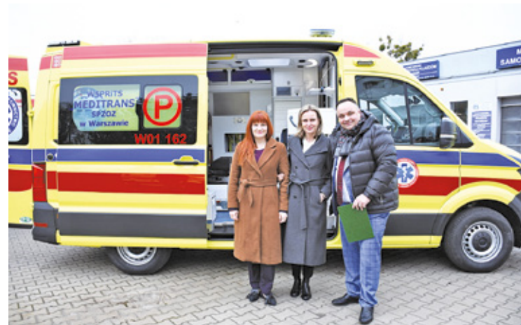
Nowoczesna karetka będzie służyła w Piasecznie i okolicach przez następne kilka lat