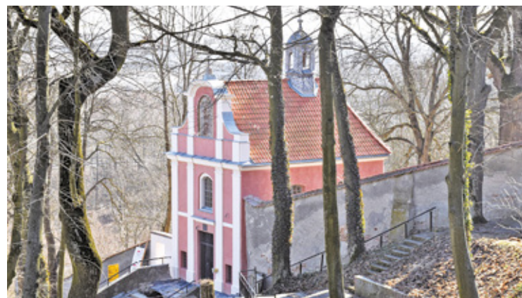
Prace dotyczące wyglądu kaplicy poprzedziła kwerenda zbiorów archiwalnych, która pomogła w ustaleniu dawnego wyglądu budynku

– Za sprawą funduszy przyznanych parafii przez Ministerstwo Kultury i Dziedzictwa Narodowego przeprowadzono konserwację elewacji zachodniej (wraz ze ścianami zakrystii) oraz elewacji południowej. Z kolei dzięki dotacji otrzymanej od Wojewódzkiego Urzędu Ochrony Zabytków w Warszawie remont przeszły elewacje wschodnia i frontowa, a przypory budynku poddano odbudowie. Dodatkowo, za