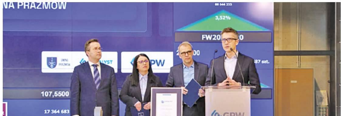
Rada Gminy zdecydowała o emisji obligacji na łączną kwotę 30 mln złotych

Jak wspominałem, debiut był pokłosiem podjętej decyzji o emisji obligacji. Dzięki temu bank zaoferował niższą marżę. To plus. Jednocześnie nazwa naszej gminy będzie się przewijać na parkiecie, co też jest pozytywnym w kontekście przedsiębiorstw, które są notowane na poszczególnych rynkach (ewentualnego pozyskania inwestorów). Natomiast - jest to emisja w trybie zamkniętym, bank PKO BP nie przewiduje w najbliższej przyszłości sprzedaży posiadanych obligacji Gminy Prażmów, zatem nie ma co liczyć na obrót i różnice kursowe. Dodatkowo,