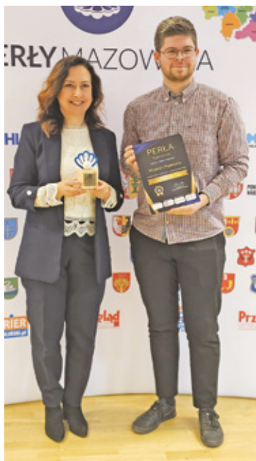
Muzeum Piaseczno – Perła Turystyki

kowski, grodziski, otwocki, zachodni warszawski oraz garwoliński. Do kategorii dołączyły nowe wyróżnienia, takie jak Perła Energii i Natury oraz Perła Aktywności Społecznej.