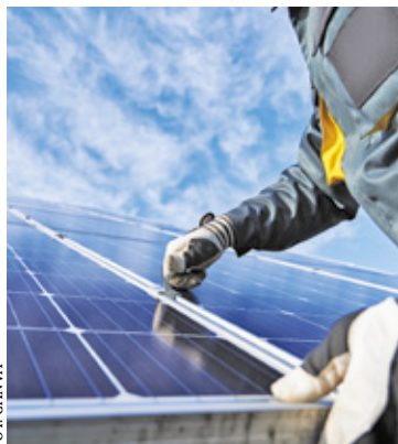
Zostaną zamontowane pompy ciepła, systemy fotowoltaiczne wraz z magazynami energii, kolektory słoneczne i podgrzewacze wody

W ramach projektu zamontowane zostaną pompy ciepła, systemy fotowoltaiczne wraz z magazynami energii, kolektory słoneczne i podgrzewacze wody. Oprócz tego mają pojawić się