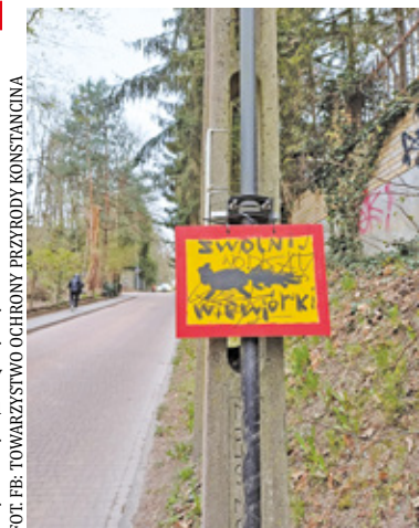
Do wpisu dołączono zdjęcie, na którym widać narysowaną wiewiórkę. Umieszczono ją na żółtym tle i otoczono czerwoną ramką

Do wpisu dołączono zdjęcie, na którym widać narysowaną wiewiórkę.