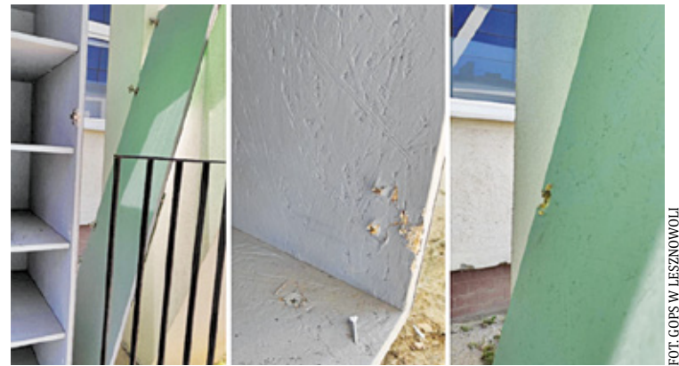
Zniszczenie jadłodzielni szkodzi wszystkim, którzy mogliby z niej skorzystać

– Z wielkim smutkiem informujemy, że w ostatnich dniach doszło do zniszczenia jadłodzielni w Nowej Iwicznej. To miejsce, które zostało stworzone