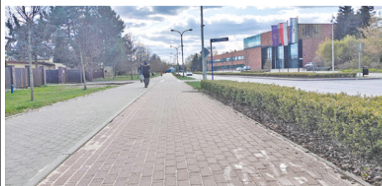
W planie jest budowa 5,8 km ścieżek

W projekcie zaplanowano także powstanie zadaszonych wiat rowerowych. Mają one zostać ulokowane w