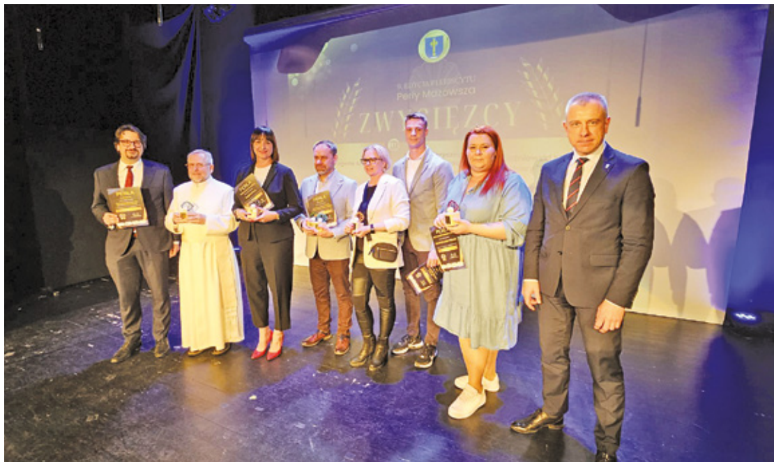
Tegoroczna edycja odbyła się pod honorowym patronatem Marszałka Województwa Mazowieckiego

– W imieniu Stowarzyszenia Dziki Zryw dziękujemy za każdy oddany na nas głos w plebiscycie Perły Mazowsza. To ogromne wyróżnienie i wielka mo-