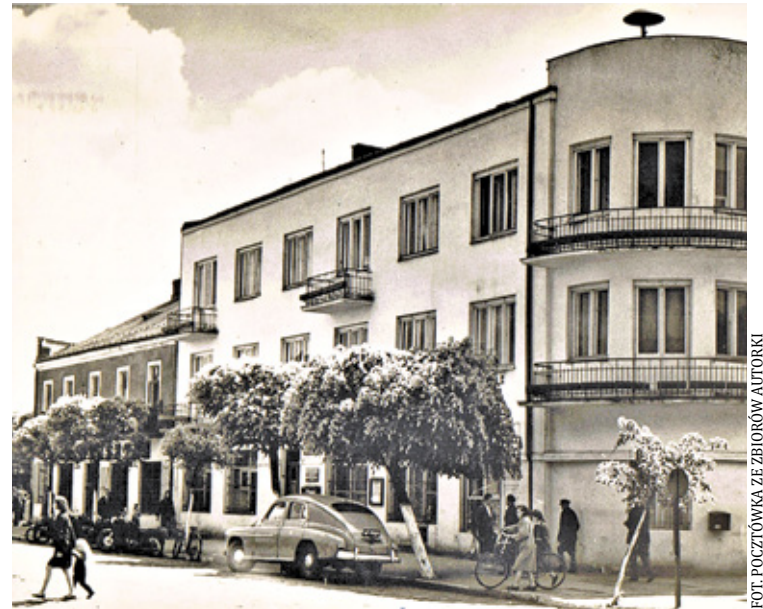
Dom Bendera w latach 60. jeszcze przed przebudową