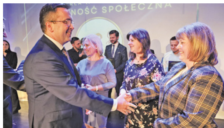
Podczas gali poznaliśmy laureatów z powiatu piaseczyńskiego, których pasja i zaangażowanie zostały docenione przez lokalną społeczność

mentem całej akcji. Nominacja do Perły Mazowsza była dla mnie ogromnym zaszczytem i przyjemnością. Postanowiłam połączyć tę inicjatywę z promowaniem wolontariatu, co zaowocowało wspaniałą współpracą z mieszkańcami oraz super wolontariuszami ze Szlachetnej Paczki. Dzięki ich wsparciu oraz zaangażowaniu, udało nam się nie tylko zebrać głosy, ale również zintegrować naszą społeczność. Dzień wręczenia nagród był wyjątkowym zwieńczeniem tej wspaniałej zabawy. Atmosfera radości, wzajemnego wsparcia oraz dumy z osiągnięć w naszym powiecie sprawiła, że czuliśmy się jedną wielką rodziną. Wspólnie świętowaliśmy nasze małe i duże sukcesy, które są wynikiem ciężkiej pracy i determinacji nominowanych w różnych kategoriach. Dziękuję wszystkim, którzy przyczynili się do tego sukcesu – to dzięki Wam mogłam zrealizować swoje pasje i wspierać innych. Liczę na to, że ten tytuł będzie inspiracją dla kolejnych osób do dzia-