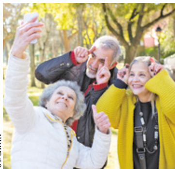
Seniorzy mogą składać swoje kandydatury do 22 kwietnia

Podobne rady z powodzeniem działają w Piasecznie i w Konstancinie-Jeziornie. W gminie Tarczyn będzie to pierwsza tego typu inicjatywa dla najstarszych mieszkańców. Seniorzy mogą składać swoje kandydatury do 22 kwietnia.