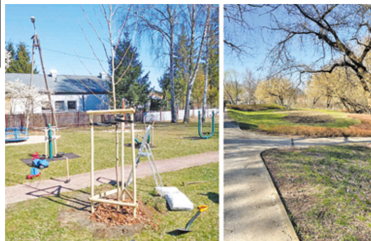
Nowe nasadzenia pojawiły się nie tylko w mieście, ale również w sołectwach: Obręb, Wincentów, Wólka Dworska, Podgórze, Czachówek, Solec i Brzeście

To jednak nie wszystko, co kwitnie w Górze Kalwarii. Od początku roku na terenie gminy trwa intensywne sa-