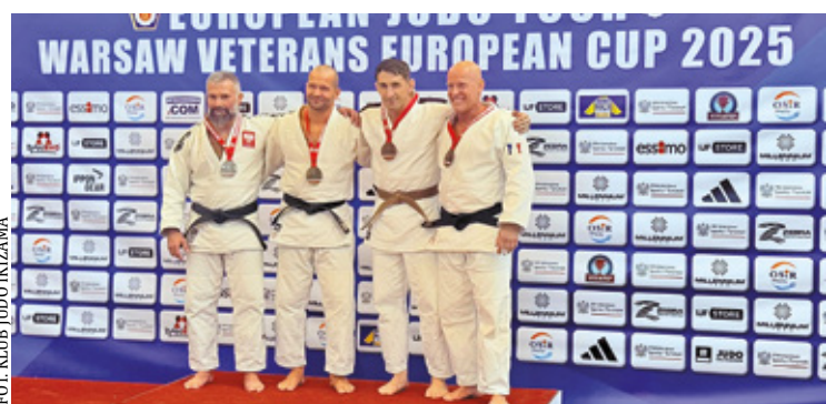
Medaliści mistrzostw w Warszawie