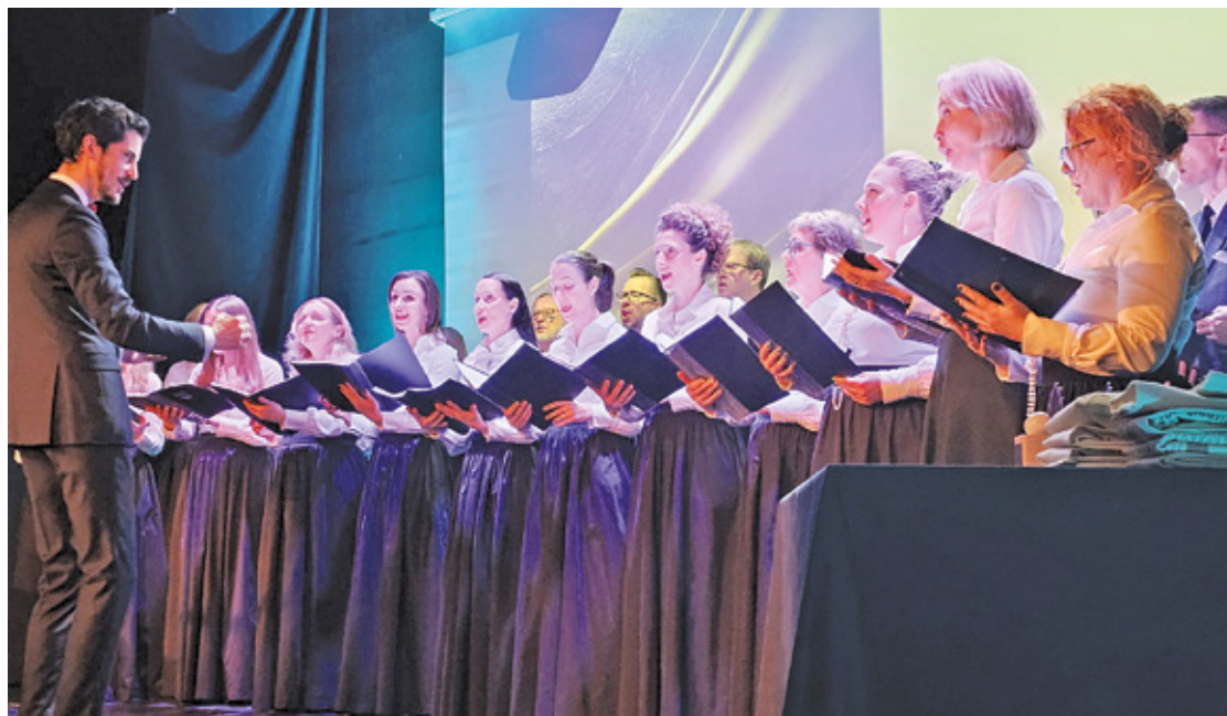
Konstanciński Chór Kameralny

coś więcej niż tylko prestiżowe wyróżnienia – to przede wszystkim wyraz społecznego uznania dla tych, którzy swoją pasją, zaangażowaniem i ciężką pracą zmieniają swoje otoczenie na lepsze. Laureaci, reprezentujący różne dziedziny życia – od kultury i sportu po