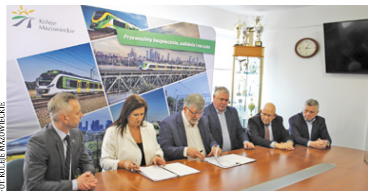
Wspólny bilet ZTM-KM-WKD obowiązuje do końca marca 2028 roku