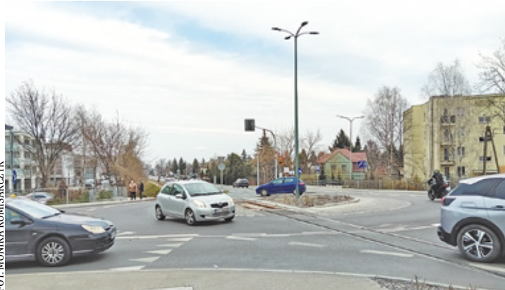
Zapytaliśmy Powiatowy Wydział Inwestycji, Remontów i Drogownictwa o sytuację, dotyczącą ronda

– Budowa rond z założenia ma na celu usprawnienie ruchu w ich otoczeniu. Rondo samo w sobie nie jest przyczyną utrudnień, o których wspomina Pani Radna – informuje Wydział Inwestycji, Remontów i Drogownictwa Starostwa Powiatowego.