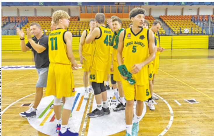
Czekamy na występy zawodników Znicza Pruszków w II lidze

Kibice stęsknieni za koszykówką mogli obejrzeć w akcji swoich ulubieńców w minioną sobotę 9 września w