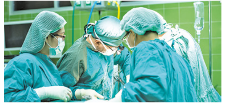
Do zawodów cieszących się największym zaufaniem społecznym należą lekarze i pielęgniarki

Badania dotyczyły także naszych relacji w pracy i zaufania, jakim darzymy spotykanych tam ludzi. Wynika z nich, że ponad połowa z nas, bo aż 69 proc. respondentów darzy zaufaniem współpracowników. Nie ufa im tylko 15 proc. badanych. Także ponad połowa, bo 60 proc. Polaków deklaruje