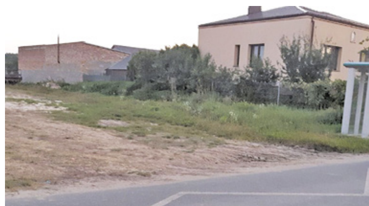
Chodnik i przejście dla pieszych do przystanku – tego domagają się mieszkańcy Suchego Lasu