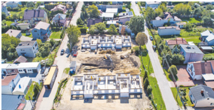
Baraki przy Ułańskiej już zniknęły

Rozpoczęła się budowa trzech budynków mieszkalnych przy ulicy Ułańskiej 18. Znajdzie się w nich 35 mieszkań w tym sześć przystosowanych dla potrzeb osób z niepełnosprawnościami. Koniec inwestycji nastąpi w maju 2025 roku.