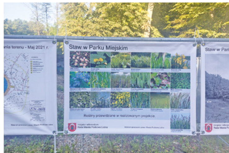
Na siatce okalającej staw jest wystawa zachęcająca do referendum oraz ilustrująca historie stawu i rewitalizacji

Na razie Podkowie Leśną czeka referendum w sprawie sposobu re-