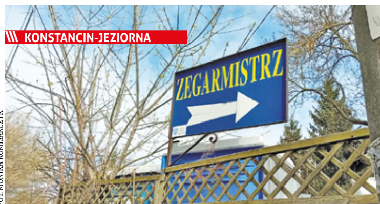
Charakterystyczne „zobaczymy, co da się zrobić” na stałe wpisało się w pamięć klientów

||| Nowe Wierzbno - SUW rośnie w oczach s. 6