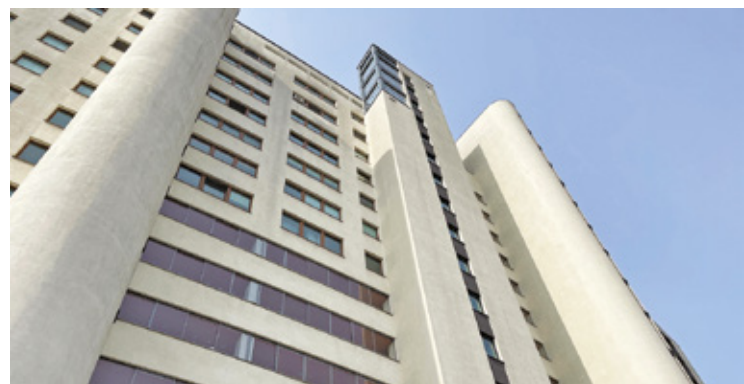
Ratownicy podjęli działania niezwłocznie po przybyciu, jednak obrażenia okazały się na tyle poważne, że życia mężczyzny nie udało się ocalić

Zgłoszenie wpłynęło 30 marca około godziny 17:00. Na miejsce przy ulicy Młynarskiej 39 skierowano liczne służby – straż pożarną, zespół ratownictwa medycznego, policję oraz