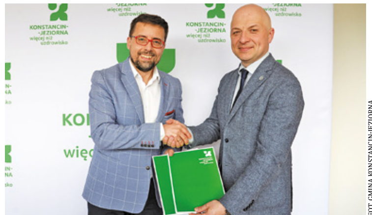
Planowana inwestycja obejmuje budowę ul. Działkowej oraz powiązanych dróg

Piaseczno i Konstancin-Jeziorna planują wspólną inwestycję drogową w rejonie ul. Działkowej w Kierszku. Burmistrzowie obu gmin podpisali list intencyjny, który określa zasady współpracy i finansowania przedsięwzięcia. Ostateczna decyzja o realizacji należy jednak do rad miejskich.