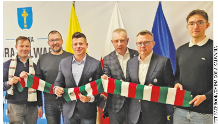
Pierwszy trening odbędzie się na orliku przy basenie w Górze Kalwarii

– Cieszę się, że projekt realizujemy we współpracy z Gminą i MKS Korona Góra Kalwaria - miastem i klubem, z którym jestem związany od lat. Połączenie doświadczenia Legii z lokal-