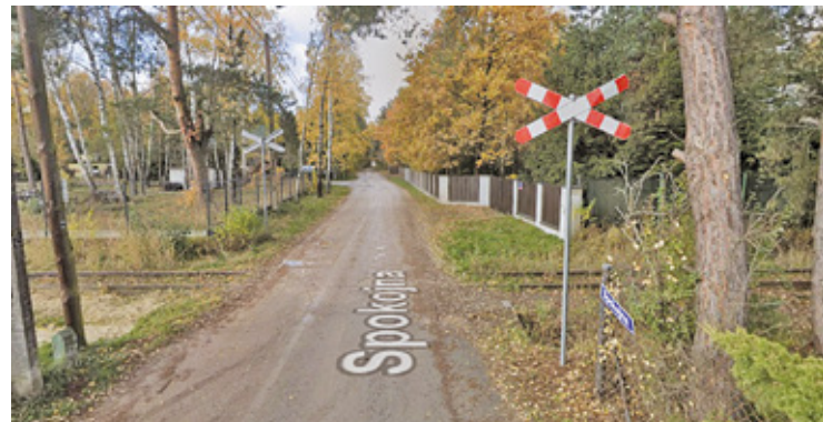
Radna zwróciła uwagę, że obecny stan drogi jest bardzo zły