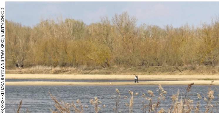
Łachy rzeczne mogą wyglądać na bezpieczne, jednak w rzeczywistości stwarzają poważne ryzyko

Podczas patrolu ratownicy zauważyli osoby przebywające na piaszczystej łasze rzecznej. Miejsce to może stwarzać poważne zagrożenie dla zdrowia i życia. Służby apelują o ostrożność i unikanie takich obszarów.