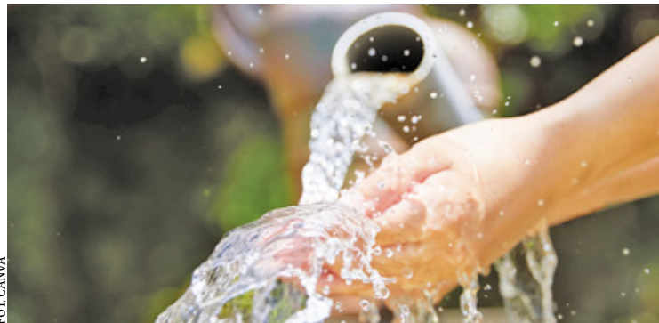
Wdrożenie systemu umożliwi szybsze wykrywanie wycieków i awarii, co skróci czas ich usuwania i ograniczy przerwy w dostawie wody

Zbierane dane pozwolą również lepiej planować inwestycje i remonty, wskazując najbardziej awaryjne lub