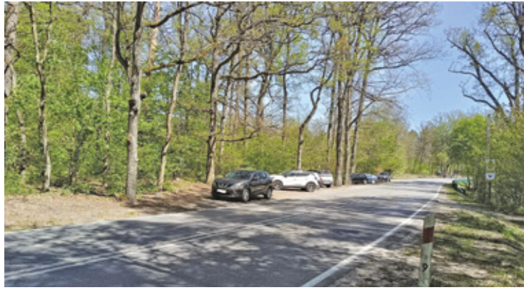
Problem dotyczy fragmentu drogi w rejonie oznaczeń kilometrażowych między 2 a 9

Problem dotyczy fragmentu drogi w rejonie oznaczeń kilometrażowych między 2 a 9. W sytuacji, gdy zaparkowany pojazd próbuje włączyć się do ruchu, musi cofać, a nadjeżdżający kie-