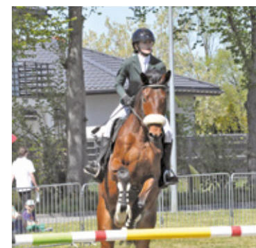
Podczas zawodów rozegrano sześć konkursów towarzyskich

Na trybunach i wzdłuż ogrodzenia nie brakowało kibiców – całe rodziny śledziły kolejne przejazdy. Na terenie