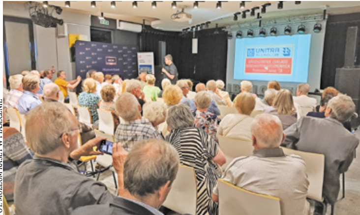
Muzeum Kaset wraz z Muzeum Piaseczna zapraszają na trzecią edycję Piaseczyńskich Post-Industrialiów. Patronat medialny nad tym wydarzeniem sprawuje „Przeład Piaseczyński”

Początek Piaseczyńskich Post-Industrialiów planowany jest na godzinę 15:30. Głównym punktem programu będzie panel dyskusyjny, poświęcony historii nieistniejących już przedsiębiorstw Zelos, Polkolor i Lamina oraz ich znaczeniu dla mieszkańców Piaseczna w okresie PRL-u. Równolegle grono specjalistów podejmie się identyfikacji zgromadzonych przez ostatni rok pamiątek dotyczących wspomnianych zakładów, które to pamiątki systematycznie trafiają do zbiorów Muzeum Kaset i Muzeum Piaseczna. Co więcej, uczestnicy Post-Industrialiów będą mo-