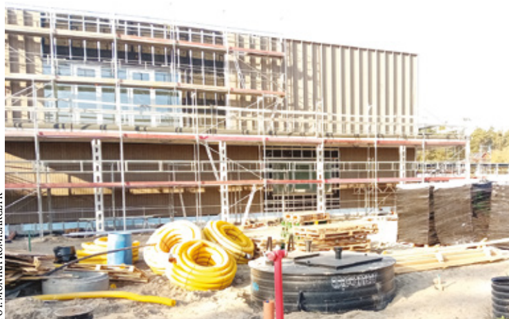
Trwają prace przy elewacji zewnętrznej oraz roboty wykończeniowe wewnątrz. Równolegle prowadzone są prace przy trybunach

sportowców, ale także miejsce spotkań dla mieszkańców – dzieci, młodzieży i seniorów.