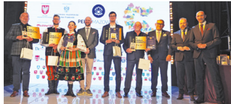
GALERIA ZDJĘĆ: www.przeглядpiaseczynski.pl, www.przeглядregionalny.pl, www.przeглядotwocki.pl, www.przeглядzachodni.pl

Stowarzyszenie Dziedzictwa Kulturowego i Krajobrazowego Mała Wspólnota: – To, co wydarzyło się przez ostatnie dwa lata przeszło nasze najsmielsze oczekiwania. 13 tys. przeniesionych