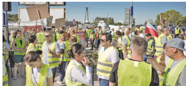
Protest zgromadził mieszkańców gmin Prażmów i Tarczyn oraz okolicznych samorządów, leżących na południe od Warszawy, w tym Grójca, Chynowa i Pniew