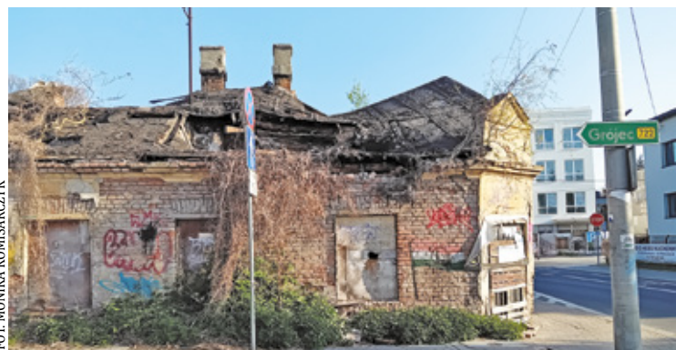
25 kwietnia 2026 – tuż przed rozbiórką

Mijałam dom z tajemniczą czeluścią bramy i dochodziłam do bohatera naszej opowieści, naroznego domu stojącego u zbiegu ulic Żabiej i ul. Kilińskiego. Zanim do niego doszłam musiałam przejść na drugą stronę ulicy, bo między domem krawca i „naszym”