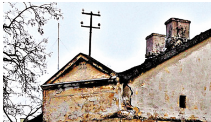
Dekoracja ponad dachem nad wejściem frontowym z datą budowy

Nasz narozny domek u zbiegu ulic to była perła obyczajów dawnego Piaseczna. Mieszkania były ciasne, w małym domku mieszkało sporo rodzin i wiele działało się na podwórku i na ulicy.