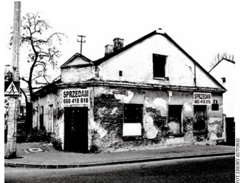
Zdjęcie z 2012 r.

Pomyślałam, że taki stary dom, co był wybudowany w 1911 roku, powinien mieć swojego ducha, a jeśli nawet nie ducha to jakąś przypowieść