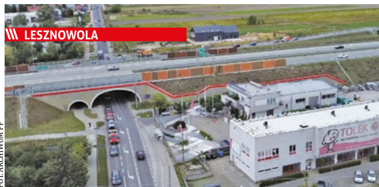
LESZNOWOLA Codziennie rano i po południu na skrzyżowaniu przy Przychodni „Tolek” tworzą się gigantyczne korki

||| Nowa Wola - Premier odwiedził druhów s. 8