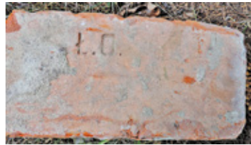
Cegła z budynku przy ul. Żabiej