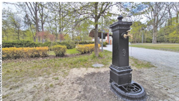
Woda dostępna w źródłach pochodzi z miejskiego wodociągu

Poidelka ustawiono w trzech punktach Parku Zdrojowego: w pobliżu pomnika św. Jana Pawła II, przy tężni solankowej oraz przy amfiteatrze. To miejsca chętnie odwiedzane, dzięki