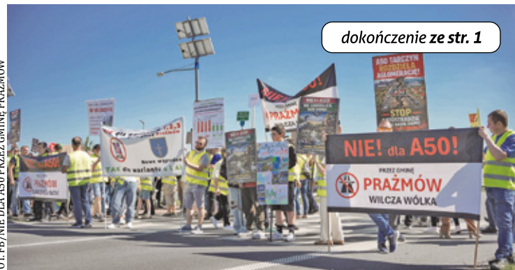
FOT. FB / NIE DLA A50 PRZEZ GMINĘ PRAŻMÓW

Głównym powodem protestu był sprzeciw wobec tzw. Podwariantu Tar-