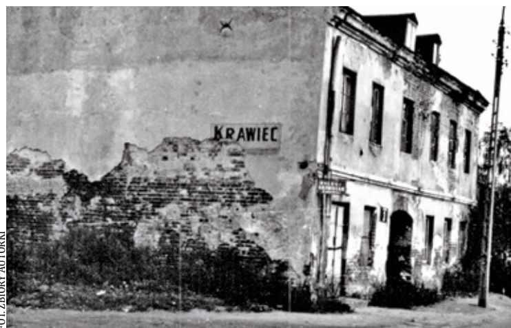
Dom, gdzie była pracownia krawiecka pana Zalewskiego

cza, Kościuszki, skręcałam w krótką ul. Żabią, wychodziłam na ul. Kilińskiego. A potem marsz ulicą Gruzową i w końcu dochodziłam do pięknego, nowego budynku przedszkola przy ul. Kauna. Musiałam się tej trasy nauczyć na pamięć już w wieku 5 lat, na wypadek gdybym się zgubiła w „wielkim mieście” i ktoś mnie zapyta o to dokąd zmierzam, to powinnam mu wyrecytować dokąd.