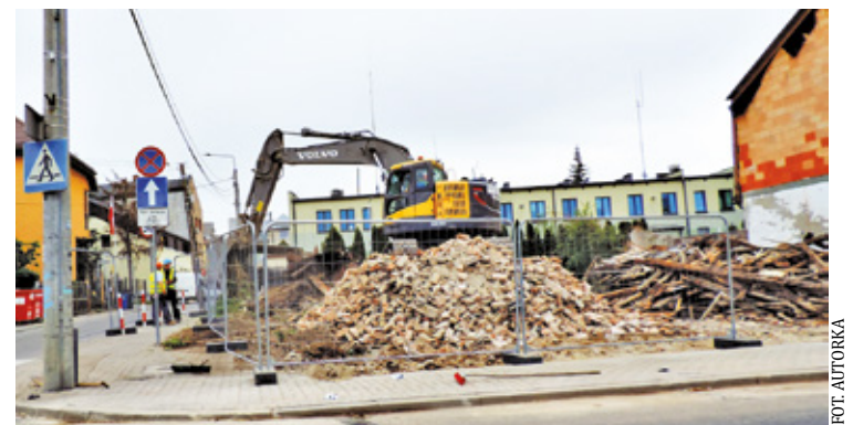
Dzień po rozbiórkę