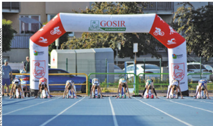
W Piasecznie wystartują zawodnicy z licencjami PZLA, sportowcy masters oraz uczestnicy części memoriałowej