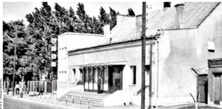
Kino Mewa z lat 60. widoczny stojak do podtrzymania szlabanów

Lokalizacja „gmachu rozrywki”, jak postrzegali mieszkańcy Piaseczna dom kultury, budziła ciche oburzenie. Nie było akceptowane przez miejscowych wybudowanie gmachu vis a vis cmentarza. Plotka krążąca po mieście „informowała”, że są zakusy na likwidację zabytkowego cmentarza i zrobienie w tym miejscu parku miejskiego. Klub w końcu powstał. Powstały w nim biblioteki dla dzieci i dorosłych świetnie wyposażone. Klub skupiał w bibliotece dzieci z całego miasta, które