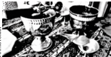
Naczynia z kawiarni Darskich