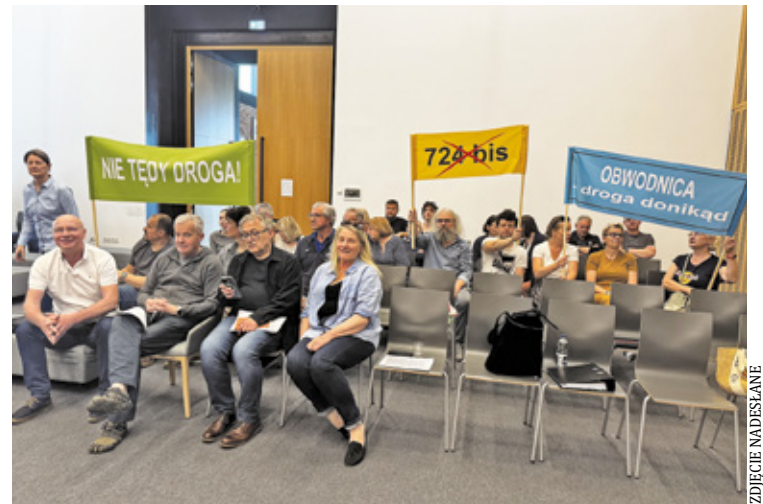
Mieszkańcy Parceli i Cieciszewa podczas posiedzenia komisji dotyczącej zmian w projekcie Strategii Rozwoju Gminy Konstancin-Jeziorna 2040+. Protestują przeciwko wpisaniu przebiegu planowanej drogi „724 bis” do dokumentów strategicznych gminy

Mieszkańcy kwestionują także komunikacyjny sens inwestycji w dotychczasowym wariantcie. Ich zdaniem największe problemy z korkami w Konstancinie-Jeziornie wynikają przede wszystkim z ruchu od strony Pia-