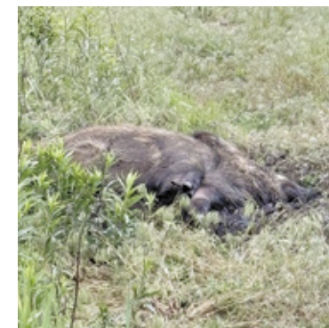
Dzik nie był w stanie się podnieść, a jego stan wskazywał na ciężkie obrażenia

W związku z opisywaną sprawą skierowaliśmy pytania do Urzędu Miasta i Gminy Góra Kalwaria oraz do PKP Polskich Linii Kolejowych. Pytamy m.in., czy instytucje otrzymały zgłoszenie dotyczące potrąconego dzika, kiedy wpłynęła informacja, jakie działania podjęto i ile czasu minęło od pierwszego zgłoszenia do zakończenia interwencji.