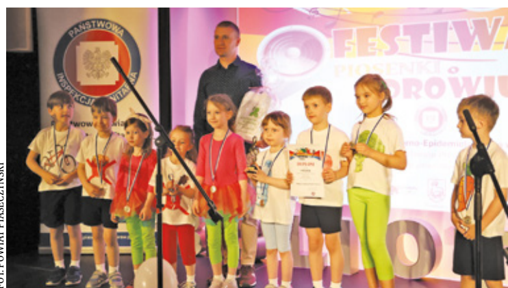
Na scenie wystąpili najmłodsi uczestnicy, przyciągając uwagę widowni energią i kolorowymi strojami