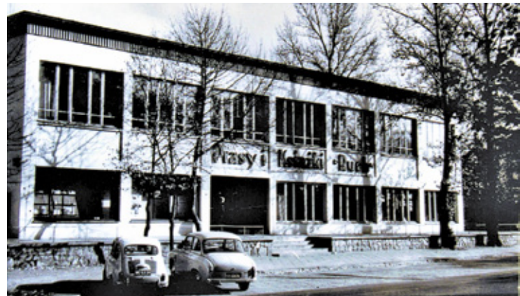
Zdjęcie budynku Klubu Prasy i Książki przy ul. Kościuszki