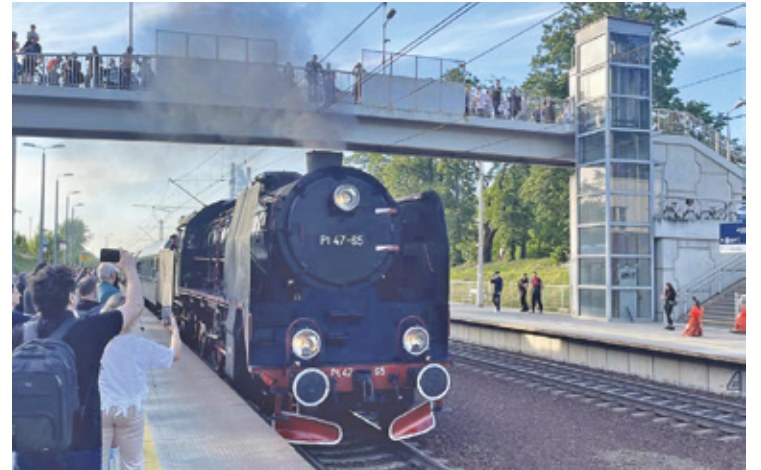
Dla wielu była to niepowtarzalna szansa, by zobaczyć tę maszynę w akcji na żywo

Szczególny wymiar miał przejazd pociągu retro przez stary most kolejowy w Górze Kalwarii, tzw. „most na Urzeczcu”, będący rozpoznawalnym motywem na zdjęciach miłośników kolei. Konstrukcja ma zostać rozebrana w związku z budową nowej przeprawy, a rozpoczęcie prac planowane jest już