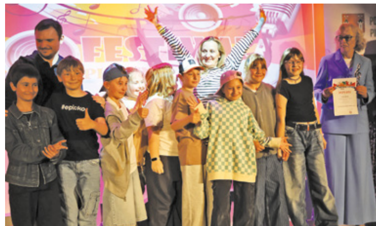
Konkurs odbył się pod patronatem starosty piaseczyńskiego, a finansowo wsparły go samorządy z powiatu

Najstarsza grupa uczestników, czyli uczniowie klas VI-VIII, skupiła się niemal wyłącznie na zagadnieniach zdrowia psychicznego. Ich występy miały osobisty charakter, a część utworów