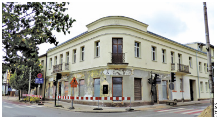
Szyld od strony ul. Nadarzyńskiej

N apisy na kamienicy Rowińskich przy ulicy Nadarzyńskiej odśłaniają następny fragment historii Piaseczna.