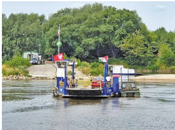
Pieniądze przeznaczono m.in. na wymianę liny stalowej, zakup wyposażenia ratunkowego, prace remontowe oraz przygotowanie przystani

– Chcemy bardzo podziękować wszystkim osobom, które wsparły zbiórkę. To dzięki nim mogliśmy doprowadzić do uruchomienia przeprawy w tym sezonie. Nadal jednak stoimy przed wyzwaniem finansowym, dla-