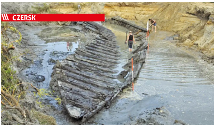
Historia czerskiej szkuty sięga lat 80.

||| Piaseczno - Pamięć i walka o medale s. 8