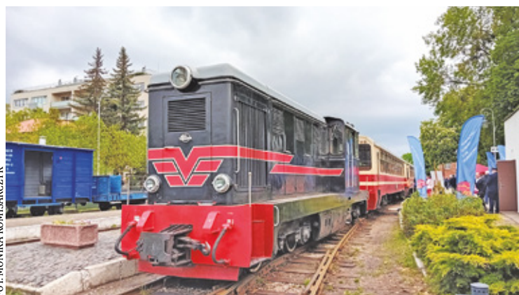
Kolejka wąskotorowa od lat jest jednym z najbardziej rozpoznawalnych symboli Piaseczna

na modernizację. Na liście inwestycji dofinansowanych przez samorząd województwa mazowieckiego znalazło się zadanie pod nazwą „Modernizacja zespołu budynków kolejki wąskotorowej wraz z zagospodarowaniem terenu”.