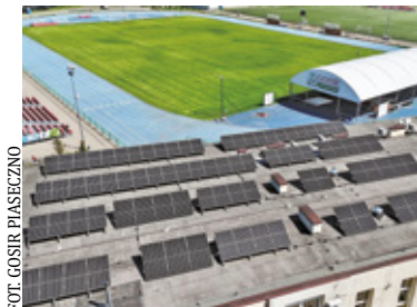
FOT. GOSIR PIASECZNO

Panele fotowoltaiczne, nowoczesne oświetlenie LED i niższe rachunki za prąd. GOSiR Piaseczno rozwija energooszczędne rozwiązania na swoich obiektach sportowych.