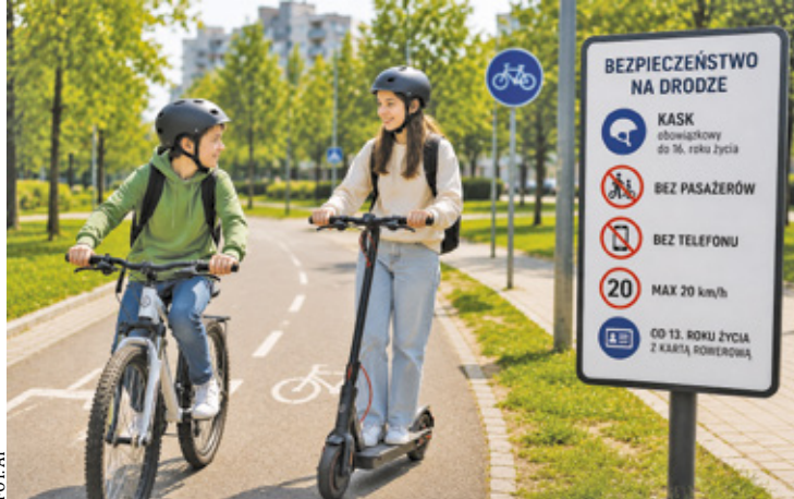
Nowelizacja ma poprawić bezpieczeństwo najmłodszych użytkowników jednośladów i hulajnog elektrycznych

Obowiązek obejmuje także dzieci do 7 lat przewożone rowerem, wózkami rowerowymi lub w przyczepce. Wyjątkiem są konstrukcje wyposażone fabrycznie w pasy bezpieczeństwa, gdy użycie kasku nie jest możliwe albo wymagane przepisami.