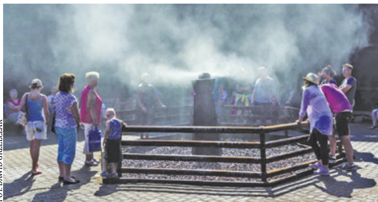
Nowa tężnia przy parafii św. Urszuli Ledóchowskiej w Chylicach