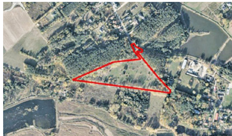
Teren objęty procedurą ZPI w Głoskowie. Gmina Piaseczno przekonuje, że obszar nie obejmuje stawów i jest od nich odsunięty

Mieszkańcy podnosili również problemy infrastrukturalne: stan dróg, obsługę komunikacyjną, dostęp do wody, kanalizacji, energii, a także obciążenie szkoły i przedszkola. Obawy dotyczyły zarówno etapu budowy, jak i późniejszego funkcjonowania nowego osiedla w sąsiedztwie terenów przyrodniczych.