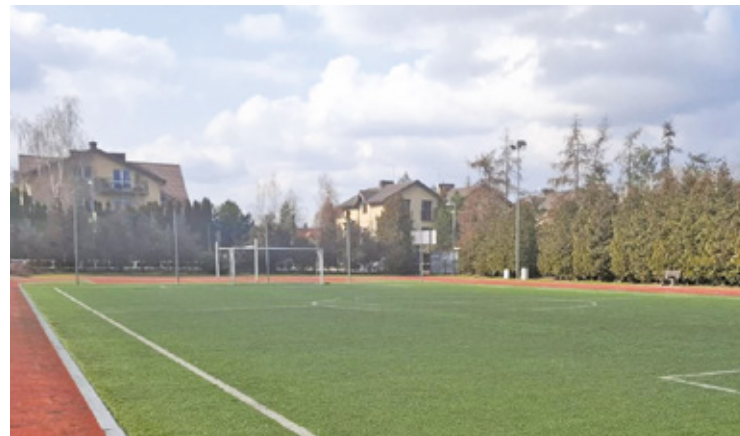
Najważniejszym elementem inwestycji będzie wymiana zużytej nawierzchni z trawy syntetycznej

Zakres prac obejmuje również remont systemu drenażowego znajdującego się pod boiskiem. Dzięki