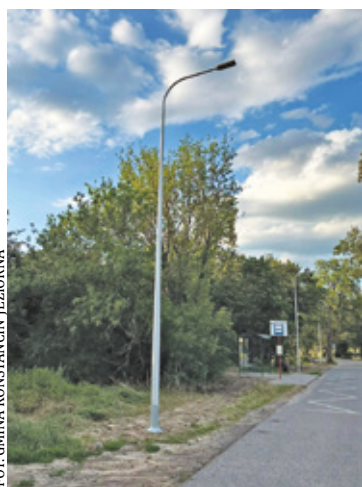
Oświetlenie objęło rejon przystanku autobusowego

Przy ul. Literatów w Oborach powstało nowe oświetlenie drogowe. W ramach inwestycji wykonano 119 metrów linii, ustawiono pięć słupów i zamontowano oprawy LED. Lampy doświetlają m.in. okolice przystanku autobusowego. Jak informuje urząd, prace zakończyły się przed planowanym terminem.