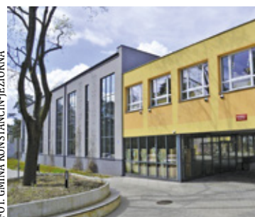
Szkoła Podstawowa nr 1 w Konstancinie-Jeziorna

Podstawą do przygotowania projektów będą przeglądy przeprowadzone w 2025 roku we wszystkich trzech placówkach. Analizy miały ocenić możliwość dostosowania wybranych przestrzeni do funkcji schronienia zgodnie z obowiązującymi przepisami dotyczącymi ochrony ludności i obrony cywilnej.