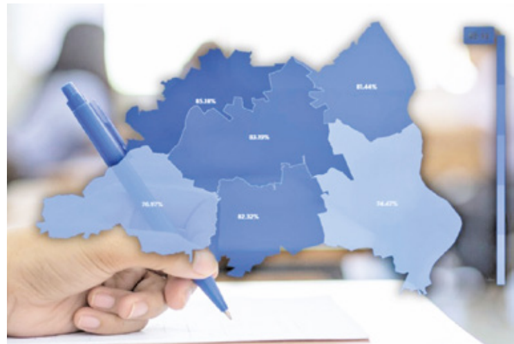
W skali województwa mazowieckiego powiat piaseczyński zajął 7. miejsce z języka polskiego, 3. miejsce z matematyki i 2. miejsce z języka angielskiego

W skali województwa mazowieckiego powiat piaseczyński zajął 7. miejsce z języka polskiego, 3. miejsce z matematyki i 2. miejsce z języka angielskiego. W skali całego kraju to odpowiednio 28., 5. i 5. miejsce wśród 380 powiatów i miast na prawach powiatu.