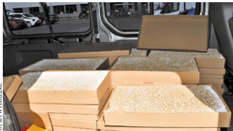
Wstępne ustalenia wskazują, że przez brak akcyzy budżet państwa mógł stracić blisko 200 tys. zł

Według ustaleń śledczych, wprowadzenie do obrotu takiej ilości nieopodatkowanych wyrobów tytoniowych mogło narazić budżet państwa