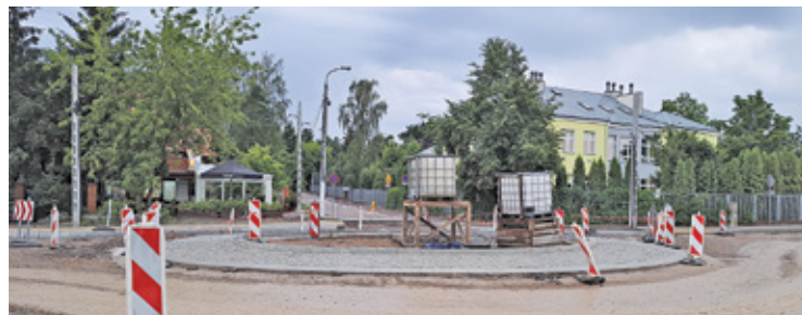
Obrys ronda jest już gotowy

odcinka – od Nadrzecznej do Starochylickiej powiat planował realizować od razu po zakończeniu pierwszego etapu przebudowy ul. Dworskiej. Niestety, pierwszy przetarg został unieważniony ze względu na zbyt wysoką ofertę, a