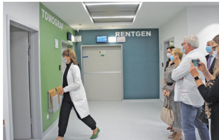
Prezentacja pomieszczeń i sprzętu, przekazanego szpitalowi

salę konferencyjną, zmodernizowano drogi dojazdowe i parkingi, a także sieci kanalizacji: deszczowej, sanitarnej, wodociągowej i elektroenergetycznej.