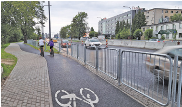
Barierki poprawiają bezpieczeństwo rowerzystów pod wiaduktem

Obawy te były jednak przedwcześnie. W piątek 29 lipca barierki oddzielające ruch pieszych i rowerzystów od