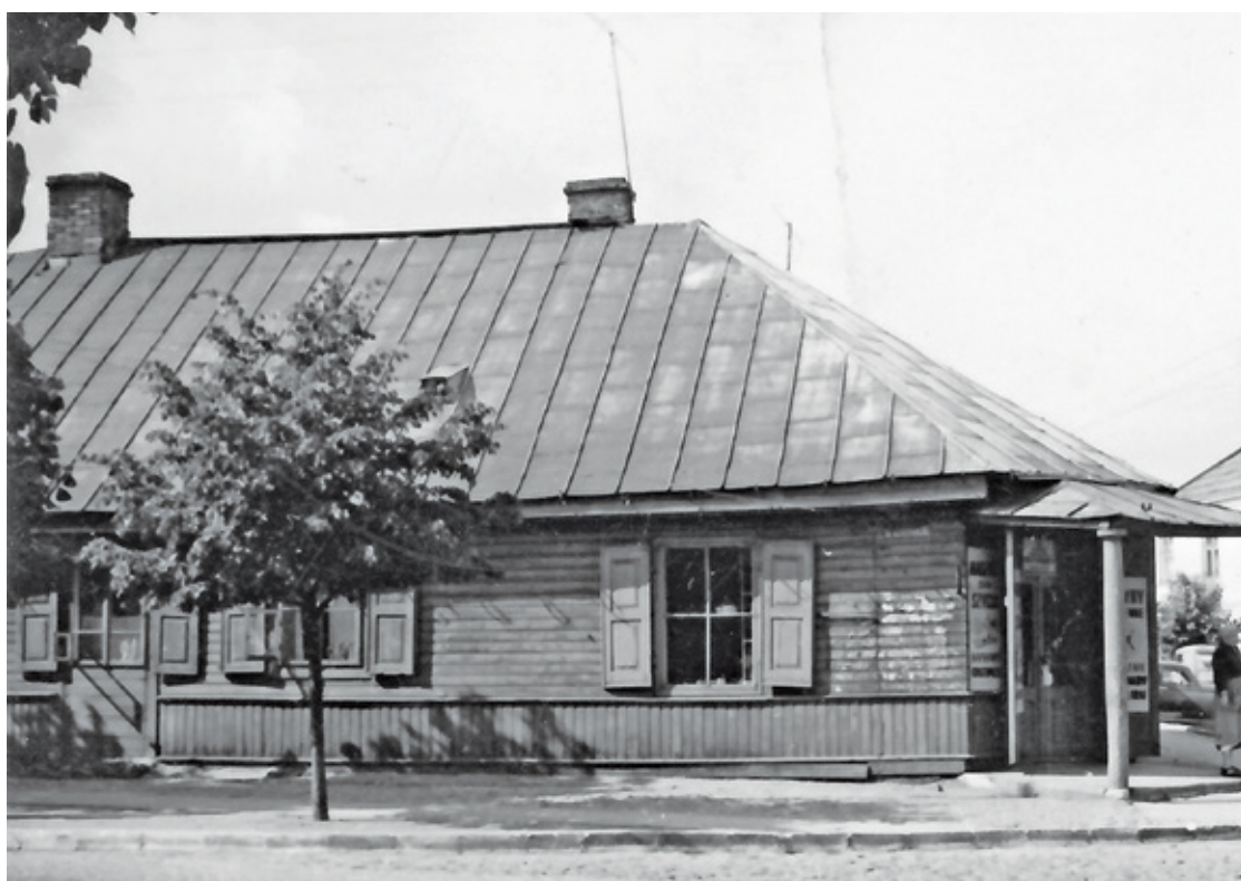
Piaseczno 1965 r., dom rodziny Szymańskich stojący na skrzyżowaniu ul. Kościuszki i ul. Sienkiewicza, dziś tu stoi sklep Biedronka