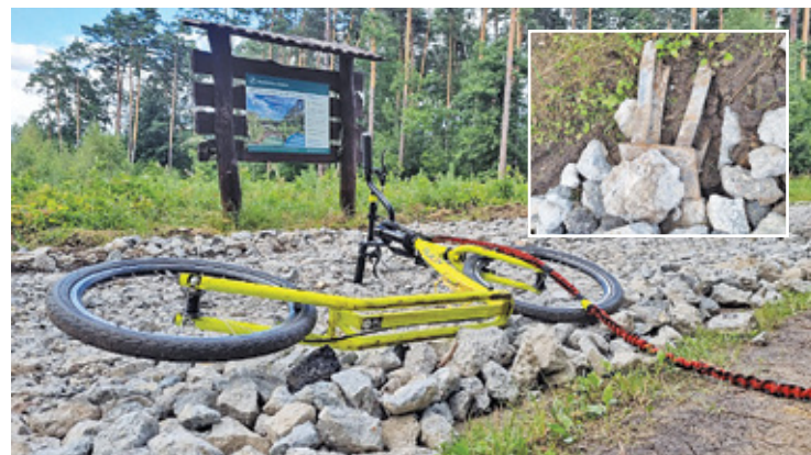
Niebezpieczne elementy pośród kruszywa leżały na drodze, z której korzysta nadleśnictwo i mieszkańcy