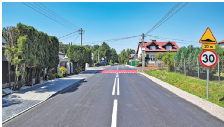
Skrzyżowanie w Jaroszewej Woli

R emonty, przebudowy i budowy nowych dróg, w które od kilku lat bardzo inwestujemy, mają na celu poprawę komfortu, ale przede wszystkim bezpieczeństwa wszystkich użytkowników naszych dróg.