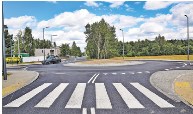
Rondo w Stefanowie

Na ulicy Dworskiej w Chylicach powstanie ścieżka rowerowa, chodnik i nowa nawierzchnia, ale wcześniej konieczna była przebudowa sieci energetycznej, telekomunikacyjnej oraz oświetleniowej, a także budowa gigantycznej kanalizacji deszczowej. Na skrzyżowaniu Dworskiej i Staro-