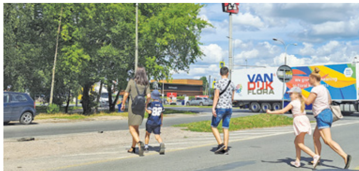
Zadaniem rodziców jest dbać o bezpieczeństwo dzieci i uczyć je bezpiecznych zachowań

Korzystający ze skateparku nastolatki notorycznie narażają się na niebezpieczeństwo przechodząc przez ul. Wojska Polskiego. Okazuje się jednak, że takiego zachowania rodzice uczą również swoje kilkuletnie dzieci.