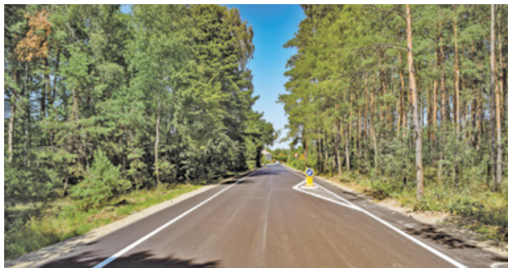
Droga przez Kiełbaskę łącząca Julianów z Sułkowicami

Zakończyliśmy też poważną inwestycję jaką była przebudowa drogi od ronda w Gołkowie do skrzyżowania ul. Postępu ze Stoneczną czyli DW 721.