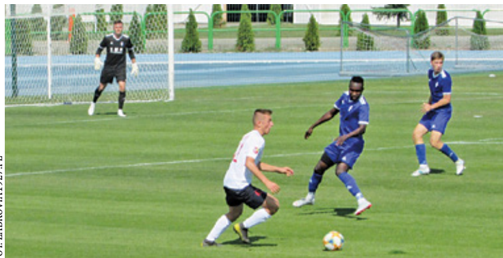
Poziom rozgrywek powinien być bardzo wyrównany

Ligowymi przeciwnikami drużyn z powiatu piaseczyńskiego – MKS Piaseczno i Orzeł Baniocha – będą: AP Marcovia Marki, Escola Varsovia War-