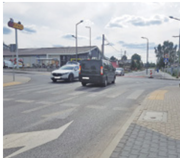
Budowa ronda ma poprawić bezpieczeństwo na skrzyżowaniu

Urząd Miasta i Gminy Piaseczno zdecydował się na takie rozwiązanie, zamiast budowy sygnalizacji świetlnej, właśnie w obawie o zaburzoną płynność ruchu w tej części miasta.