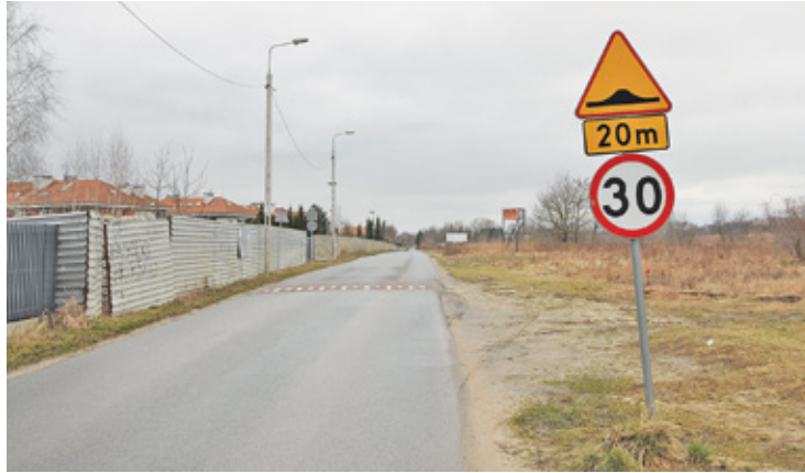
Droga zyska chodnik i ścieżkę rowerową

Decyzję ZRID dla tej inwestycji gmina otrzymała pod koniec 2021 roku. Szacowane jednak na około 14 mln złotych zadanie nie trafiło ani do budżetu na rok 2022, ani do WPF. Samorząd zgłosił je jednak do kolejnej edycji programu rządowych dotacji Polski Ład i właśnie na tę inwestycję ma