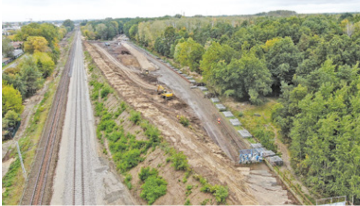
Inwestycja kolejowa na wysokości Wawra weszła w zaawansowany etap

T rwa modernizacja trasy z Warszawy w kierunku Otwocka. Na jakim etapie jest inwestycja? – Kursowanie pociągów zapewnia bąpas na odcinku Warszawa Wschodnia-Warszawa Wawer – podkreśla Karol Jakubowski z zespołu prasowego PKP PLK. – Ułożone są dwa nowe tory w obszarze rezerwatu Olszynka Grochowska. Przy