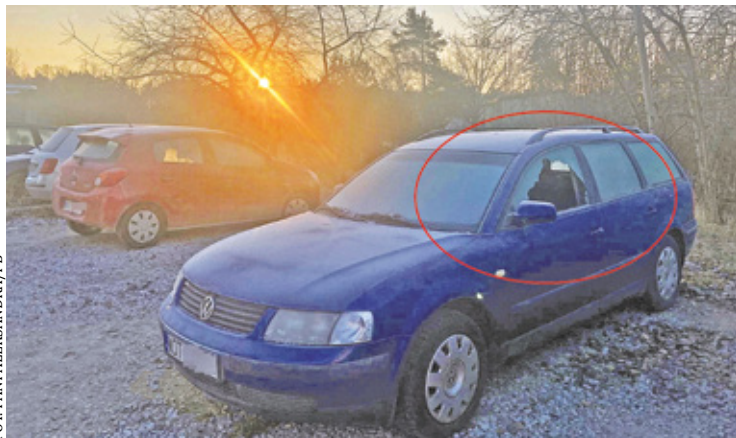
Właściciele uszkodzonych samochodów zgłosili sprawę na policję

gani. Na jednym z lokalnych forów w mediach społecznościowych opublikowano post ze zdjęciami uszkodzonych samochodów. Ich właściciele zgłosili sprawę na policję.