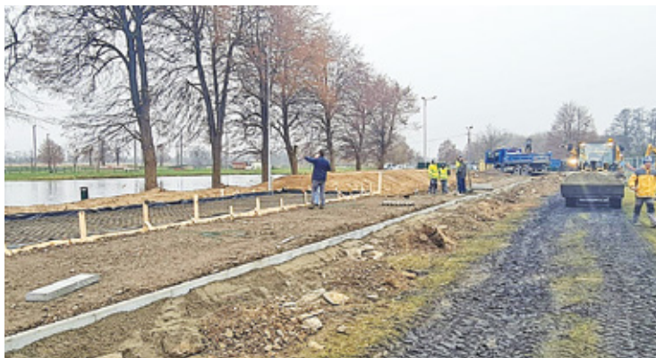
W listopadzie rozpoczęła się budowa nowej trybuny na stadionie miejskim