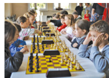
KLUB SZACHOWY KRÓL BATORY OTWOCK

Wbrew pozorom turnieje szachowe to nie tylko cisza i koncentracja, ale także prawdziwe emocje, rywalizacja, nowe przyjaźnie, a czasem nawet łzy. Kilka dni temu młodzi miłośnicy szachów spotkali się na turnieju, w którym uczestniczyli m.in. zawodnicy z Klubu Szachowego Król Batory Otwock.