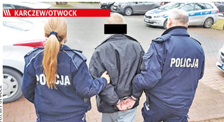
W sprawie serii przestępstw na osiedlu Ługi stróżę prawa w ciągu kilkunastu godzin zatrzymali dwóch nastolatków i 19-latkę

/// Historia - Zamach w Otwocku w 1906 roku s. 6