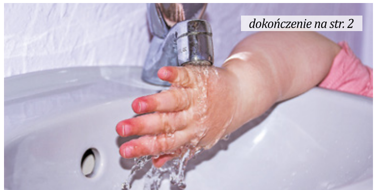
dokończenie na str. 2

O gólna ocena jakości wody z wodociągów w powiecie otwockim jest pozytywna, ale czasami w próbkach zdarzają się przekroczenia dopuszczalnych norm bakterii z grupy coli. Bywa też, że woda jest mętna albo ma przykry zapach, na co często narzekają mieszkańcy m.in. Otwocka.