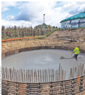
Roboty na terenie oczyszczalni w Piwoninie od kilku miesięcy idą pełną parą

Roboty na terenie oczyszczalni w Piwoninie od kilku miesięcy idą pełną parą. W ramach projektu oczyszczalnia mechaniczno-biologiczna zostanie rozbudowana, zmodernizowane będą m.in. pompownia główna i reaktor biologiczny osadu (drugi będzie wybudowany), dwukomorowy zbiornik magazynowy osadu. Wykonawca wymieni na nowe m.in. urządzenie, które odwadnia osad i stację wapnowania osadu odwodnionego. W ramach inwestycji zostanie wybudowany m.in. punkt zlewny ścieków i osadów, które są dowożone np. szambarkami, powstanie też obiekt, gdzie wstępnie oczyszcza się ścieki, oraz