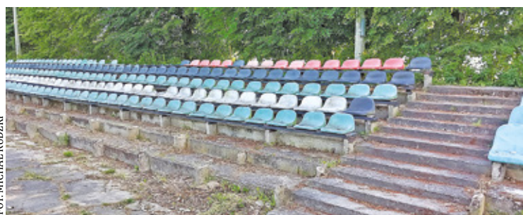
Na tę inwestycję czekali kibice Mazura Karczew i mnóstwo fanów piłki nożnej

Wykonawca w pierwszej kolejności zdemontował istniejącą skarpe