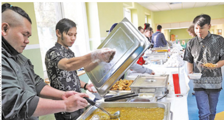
Obcokrajowcy przygotowali dla uczestników m.in. narodowe i tradycyjne specjały