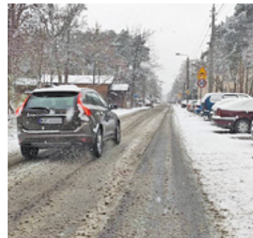
Nie wszystkie samorzady są gotowe na zimowe utrzymanie dróg

Kierowcy i piesi zmagali się już z pierwszym większym śniegiem. Wiele samorządów ma jednak kłopot z szybkim odśnieżaniem dróg, chodników czy parkingów.