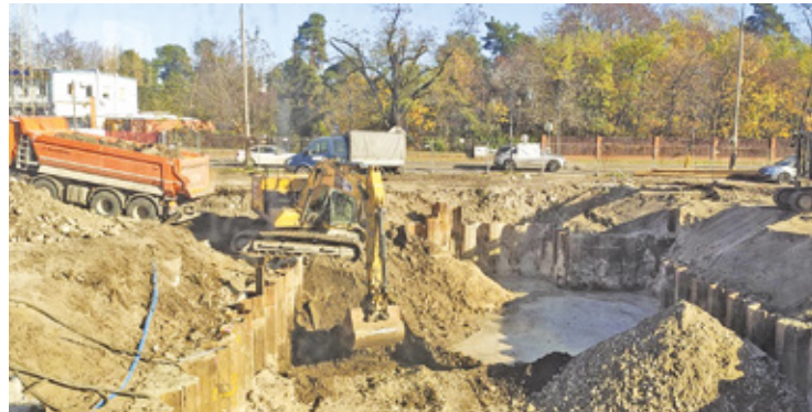
Przy stacji kolejowej powstał m.in. bąpas, który zapewnia kursowanie pociągów, a także nowy budynek nastawni (docelowo znajdzie się tam lokalne centrum sterowania)