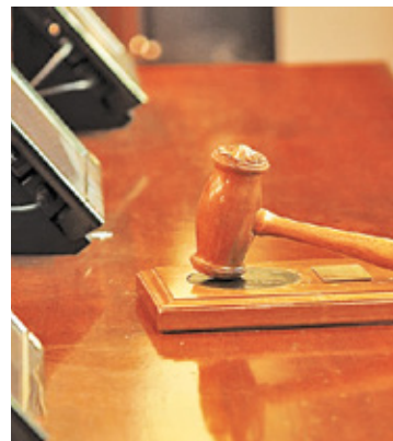
Otwocka spółka miejska nie zgadza się z wyrokiem sądu

– W 2018 r. Józefów złożył pozew do Sądu Cywilnego o zapłatę odszkodowania z tego tytułu. Proces, który trwał 4 lata, zakończył się w czwartek, 10 listopada wyrokiem, który jest korzystny dla miasta. Sąd orzekł, że Zarząd Województwa Mazowieckiego ma zapłacić