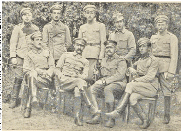
Marszałek Józef Piłsudski w Otwocku w 1915 r.

małe pałacyki wśród zieleni ogrodów były azylem dla warszawskich bogaczy. Jedni mieszkali tu wakacyjnie inni na stałe. Generał miał prawdopodobnie