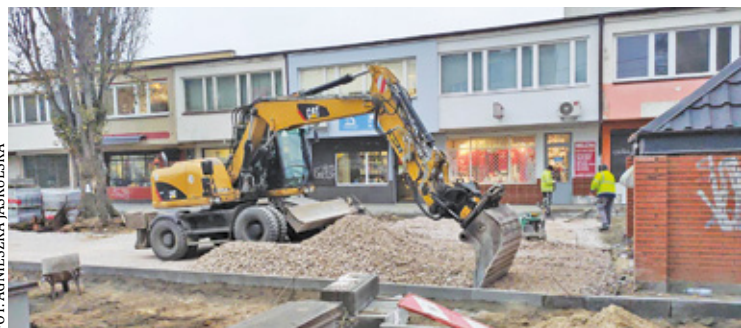
Modernizacja drogi „bis” jest istotna dla planowanego zagospodarowania tzw. „białego bazarku” przy ul. Pod Zegarem i ul. Orlej

Pod koniec listopada rozpoczęły się roboty na krótkim odcinku uliczki, która jest istotną częścią planów związanych z przyszłym zagospodarowaniem bazarku na terenie pomiędzy ulicami: Andriollego, Pod Zegarem i Orlej.