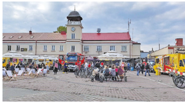
Na placu przed remizą strażacką często są organizowane różne wydarzenia

Nowy projekt rewitalizacji przewiduje wiele zmian. Koncepcja uwzględni m.in. zaprojektowanie strefy parkowania samochodów osobowych i strefy rekreacyjnej, rewitalizację istniejącej zieleni, zaprojektowanie nowych nasadzeń (drzew, krzewów ozdobnych) oraz klombów, a także oświetlenia parkowego wraz z oświetleniem ulicznym. Podczas projektowania uwzględniono również zalecenia konserwatora zabytków, bowiem układ urbanistyczny Karczewa – na wniosek mieszkańców – został włączony do wojewódzkiej ewidencji zabytków, dlatego nie bę-