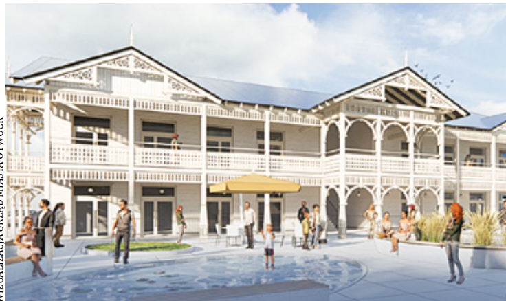
Koncepcja nr 1 zakłada powstanie reprezentacyjnego budynku w stylu świdermajer

W ramach miejskiego programu funkcjonalno-użytkowego zagospodarowania centrum, pracownia przygotowała dwie koncepcje. – Dotychczasowa i historyczna funkcja handlowo-usługowa tego miejsca zostanie zachowana, choć zostaną do niej dodane elemen-