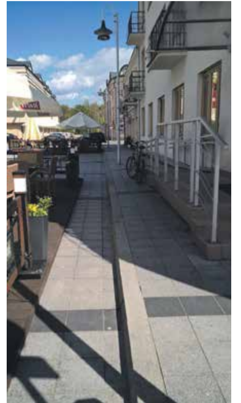
Ogródek na rynku, do którego nie wjedzie nikt na wózku inwalidzkim

Większość tych utrudnień istnieje z powodu niewiedzy oraz tego że osoby pełnosprawne nie zauważają drobnych szczegółów, które dla osób na wózkach są absolutną blokadą normalnego funkcjonowania. Napotkany przez nas na pętli autobusów L pracownik firmy Polonus stwierdził, że nigdy mu się nie zdarzyło, żeby osoba