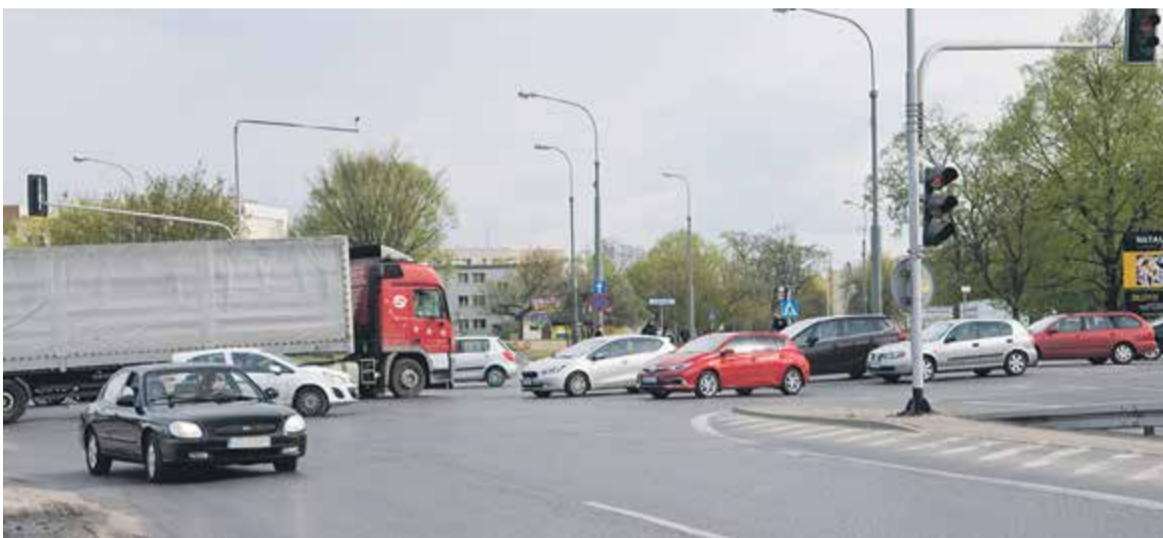
Newralgiczne skrzyżowanie ul. Puławskiej z ul. Okulickiego

Szczegółowe informacje na temat miast, tabele i wykresy znajdziemy pod adresem www.polskawliczbach.pl .