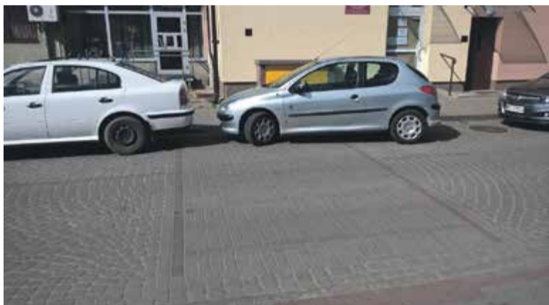
Jedyny wjazd/zjazd na chodnik koło apteki dostosowanej dla niepełnosprawnych zastawiony przez samochód