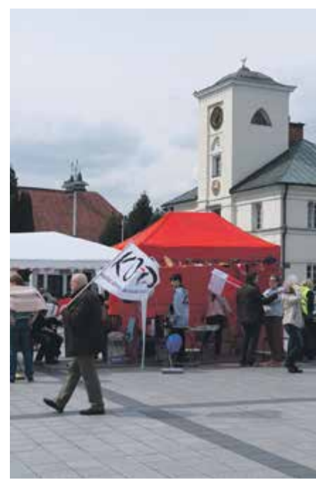
Na rynku w sobotę powiewała też flaga KOD-u