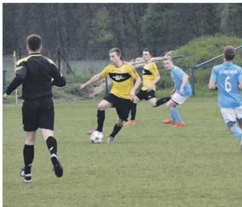
Sędzia pozwalał na ostrą grę