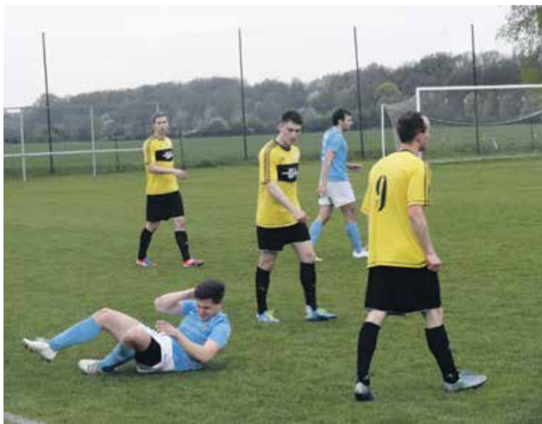
Ofensywna akcja Sparty Jazgarzew