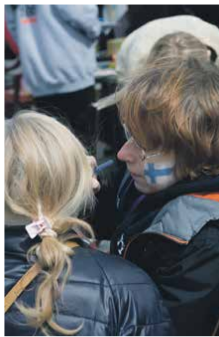
Najmłodzi mogli sobie wybrać dowolną flagę do namalowania na policzku