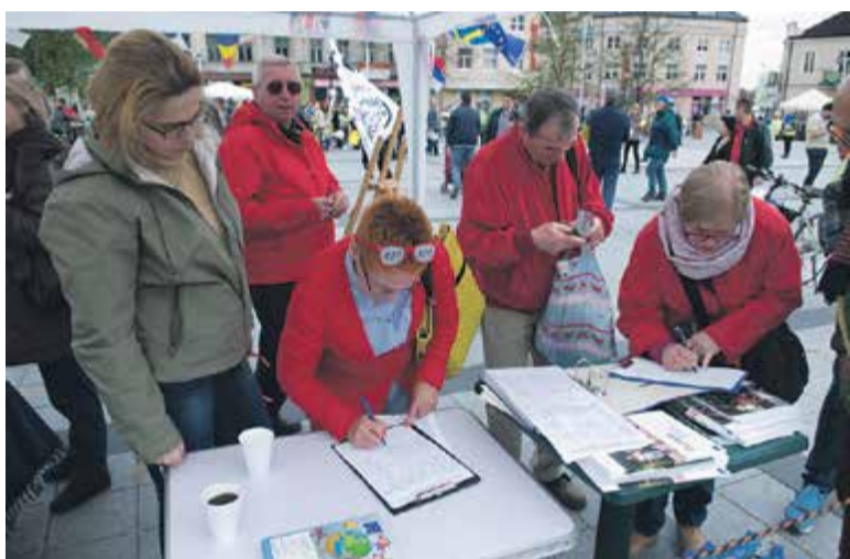
Mieszkańcy chętnie podpisali się pod petycją do starosty