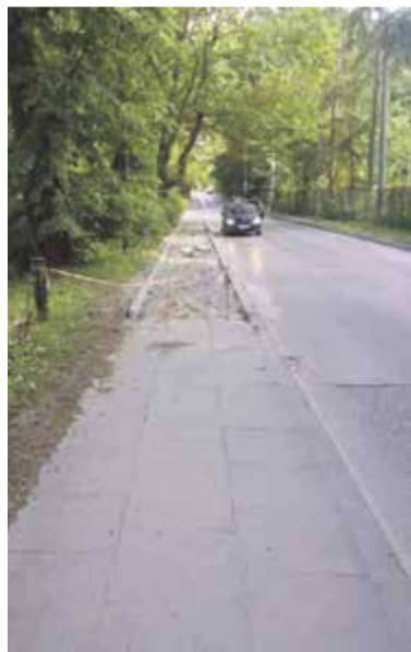
Zdjęcie chodnika, które przestali nam organizatorzy akcji bezpiecznych przejść

kwietnia w Starostwie, a także nie zwlekając, udaliśmy się na miejsce, oceniając sytuację w terenie. Podczas spotkania zadeklarowałem wstępnie, że niektóre postulaty są do spełnienia, inne wymagają sprawdzenia. Sprawy formalne i techniczne, a także pomiary ruchu rozeznaliśmy w ciągu tygodnia od spotkania. 26 kwietnia rozpoczęliśmy prace na ul. Chylickiej polegające na wymianie nawierzchni starych betonowych płyt na kostkę brukową, na odcinku od ul. Oborskiej