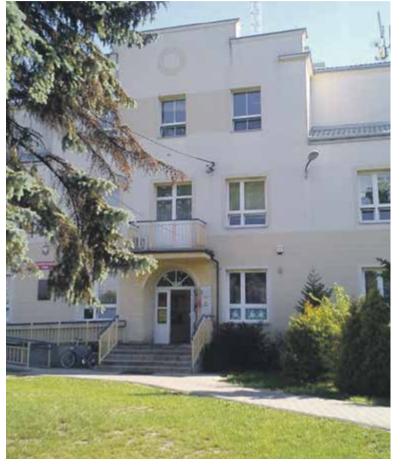
Szkoła w Kątach

z wieloma interesującymi atrakcjami. W Kątach jest wiele pięknych tras do spacerowania i jeżdżenia rowerem, trasy są utwardzone. Kąty stają się osadą – niby wieś, a nie mamy rolników, wiele osób sprowadza się z Piaseczna czy Warszawy. Jeśli zaczniemy się integrować, robić imprezy dla mieszkańców, niczego nie będzie nam już brakować.