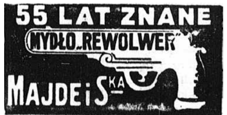
Reklamy z 1930 roku