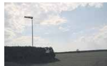
Prywatne lotnisko w Imielinie

Jadąc dalej drogą 868 dojedziemy do trasy Konstancin – Góra Kalwa-