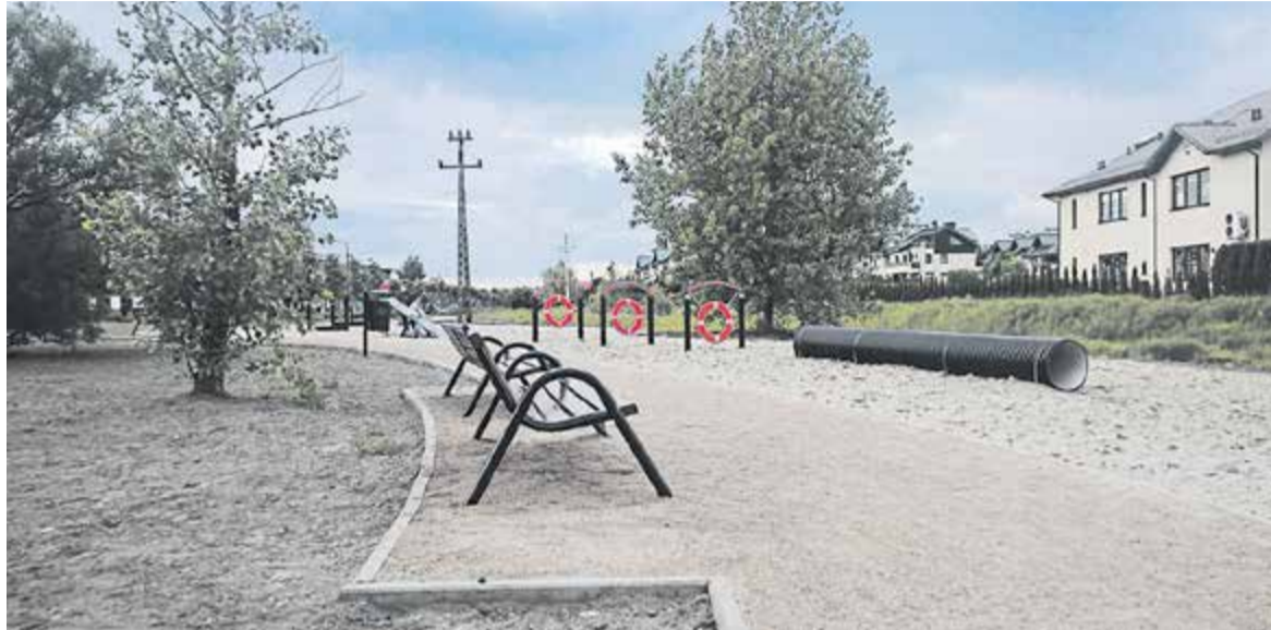
Psi wybieg w rejonie skrzyżowania Wilanowskiej i Cyraneczki

Rejon ulic Cyraneczki, Ogrodowej i Osiedlowej, wg koncepcji powinien pełnić funkcje publiczne podkreślone odpowiednią dominantą przestrzenną. Zaprojektowano więc tutaj interesujący architektonicznie Dom Kultury oraz miejski park.