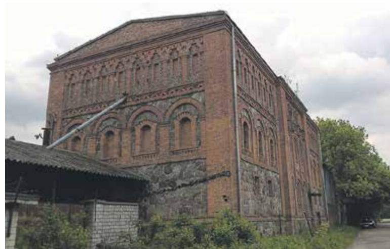
Magazyn zbożowy w Oborach