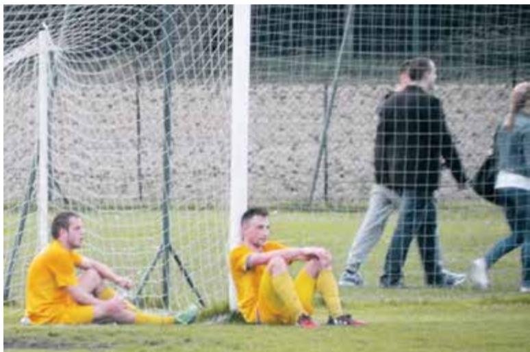
Smutne miny zawodników KS Konstancin

nego ćwiczenia/zabawy piłkarskiego polegającego na odbijaniu piłki – będziemy ją odbijać od IV Ligi do Klasy A, opisując pokrótce, co wydarzyło się w trakcie minionego tygodnia. Mam nadzieję, że ta formuła spotka się z dobrym odbiorem Czytelników i na jednym artykule się nie skończy.