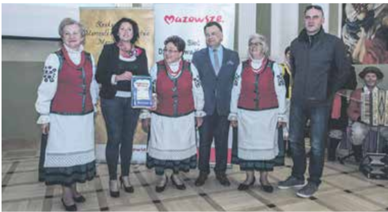
Łurzycka sytocha i barszcz chrzanowo-buraczany otrzymały certyfikat