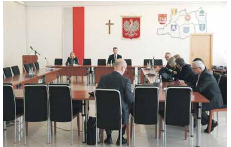
W czwartek na sesji stawiała się głównie opozycja