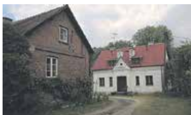
Zabudowania folwarczne w Oborach