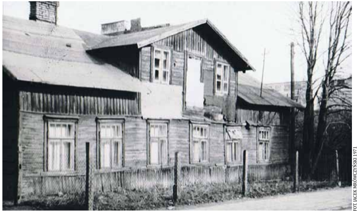
Budynek ul. Czajewicza 5 (dawniej Leśna)

Wszystkim wiadomo, że miasto rozwija się dzięki zakładom pracy dającym zatrudnienie. Zerknijmy na zakłady, fabryki i fabryczki istniejące