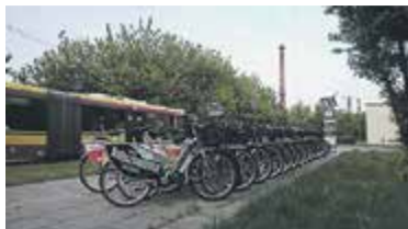
Stacja Veturilo w Mirkowie

Na rondzie Jana Pawła II kierujemy się w stronę Góry Kalwarii. Zaraz za rondem, za Bankiem Spółdzielczym, skręcamy w lewo i przez garaże docieramy do leśnej ścieżki, która poprowadzi nas do dworu w Oborach. Przed dworem wyjedziemy