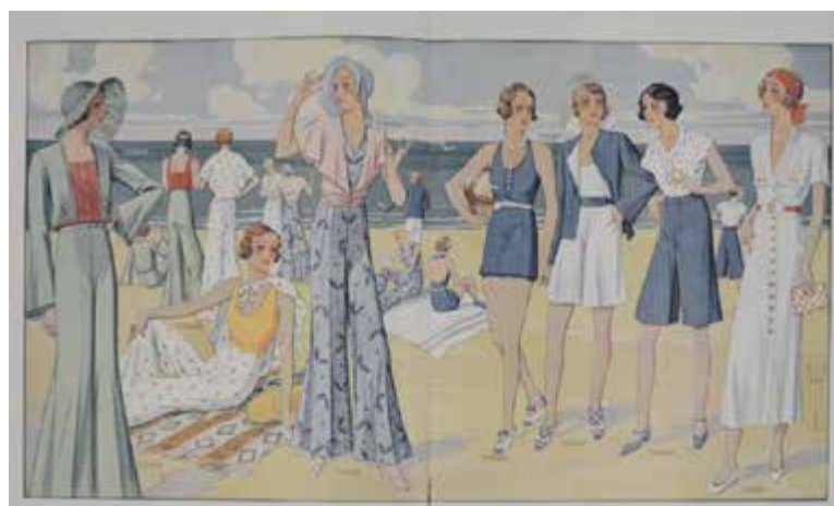
„Przegląd Mody” z 1932 r.