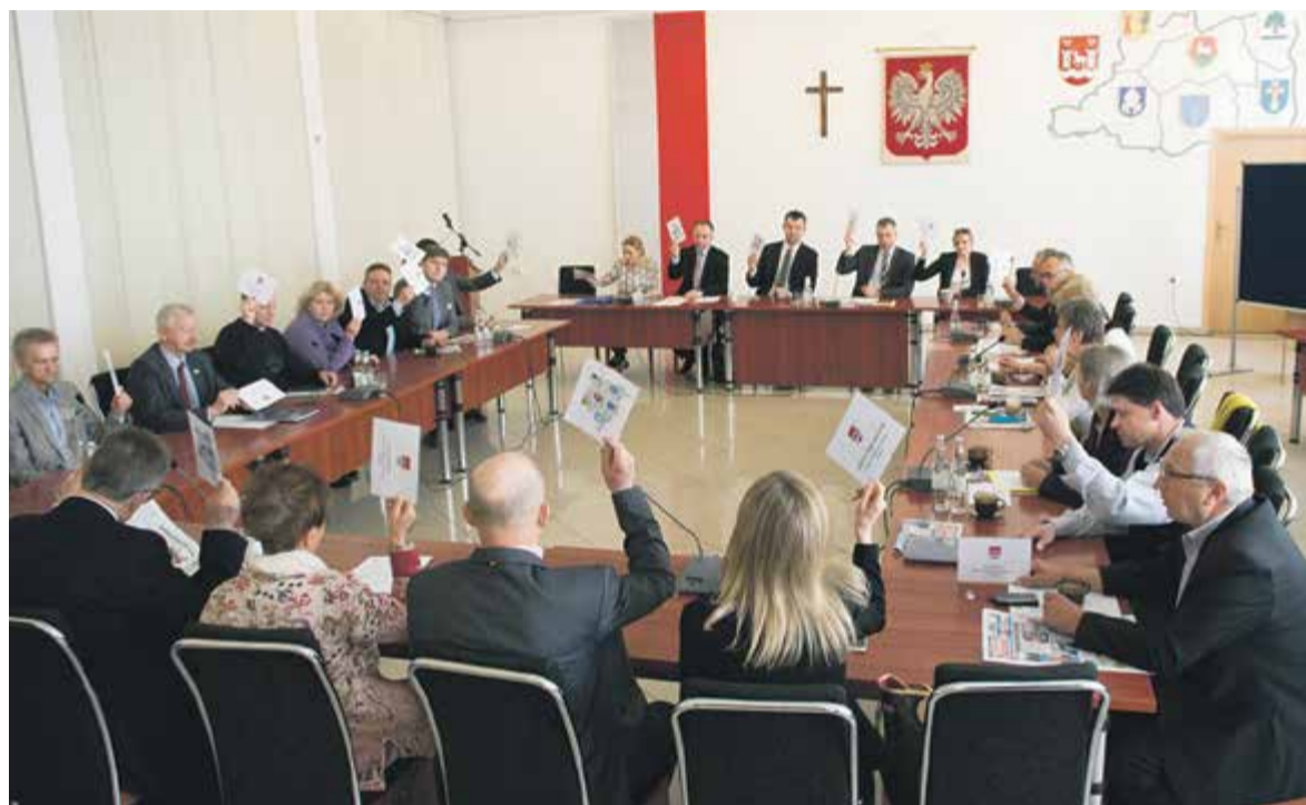
W piątek pojawił się już prawie pełny skład rady