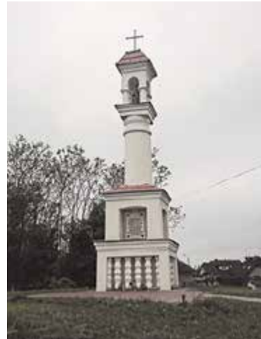
Grób Ryxów i kolumna z figurką św. Heleny

Na skrzyżowaniu koło Urzędu Gminy i kościoła możemy skrócić w prawo w ulicę Czolchańskiego, gdzie po chwili dojedziemy do cmentarza, na którym stoi między innymi odnowiony niedawno grób rodziny Ryxów, który jest integralną częścią kolumny z figurką św. Heleny, wzniesionej na pagórku na końcu cmentarza, na pamiątkę zniszczeń Prażmowa podczas potopu szwedzkiego.