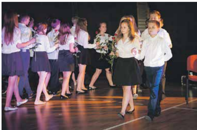
Polonez w wykonaniu uczniów SP nr 5

Marka Grechuty, wystąpił szkolny chór, zatańczyły szkolne zespoły. Obejrzelśmy występ grupy uczniów w ramach szkolnego koła teatralnego. Zatańczył także zespół Grawitacja, który w świecie tańca jest prawdziwą wizytówką Piaseczna, a który założyła absolwentka szkoły Urszula