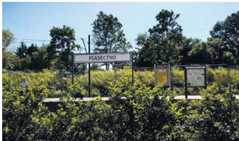
Peron w Piasecznie