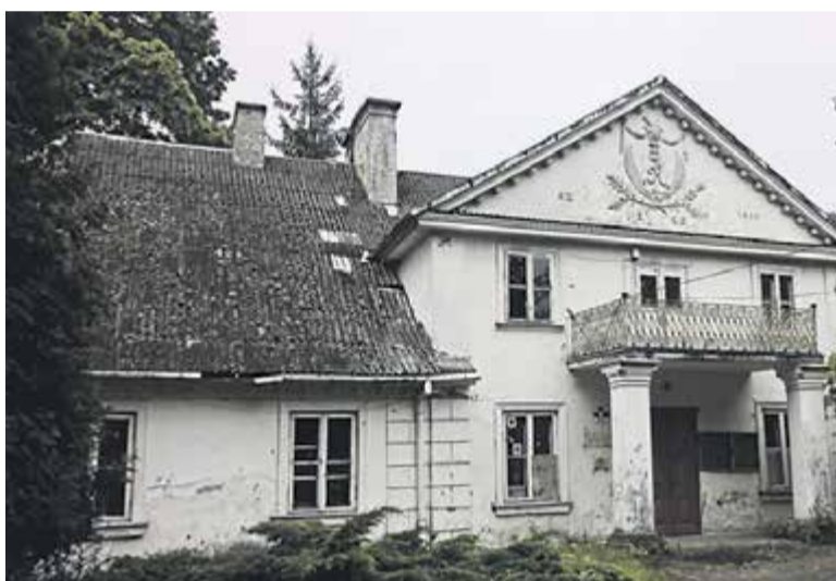
Dwór Ryxów w Prażmowie