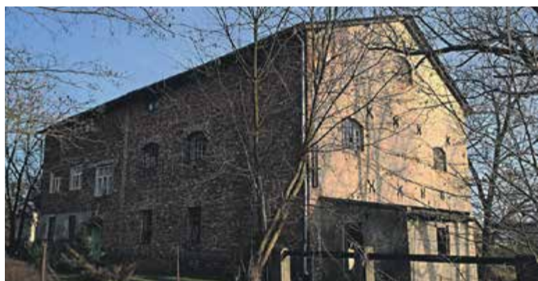
Młyn w Gołkowie