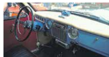
Wnętrze FSO Warszawy