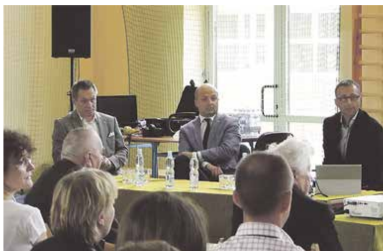
Seminarium edukacyjne w Józefosławiu o planowaniu przestrzennym

Seminarium odpowiedziało po części na to pytanie, miało ono na celu