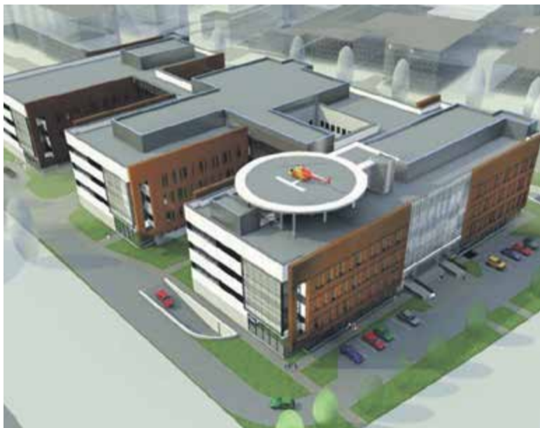
Wizualizacja bryły Szpitala Południowego.