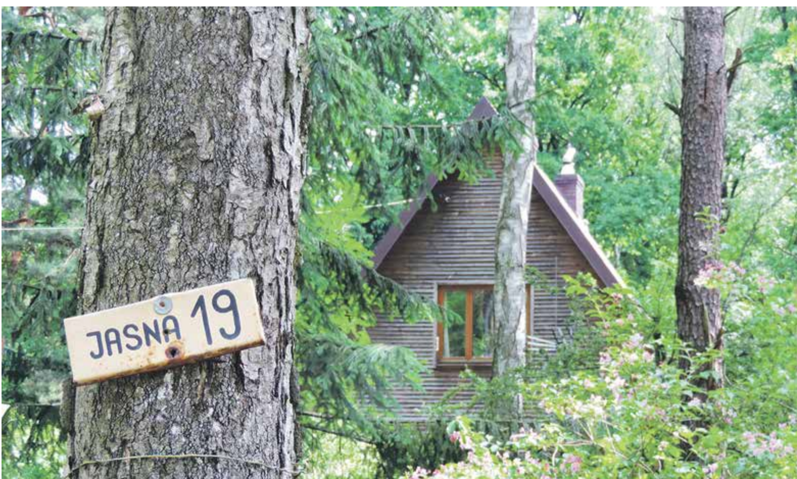
Dom przy ul. Jasnej 19 w Zalesiu Górnym