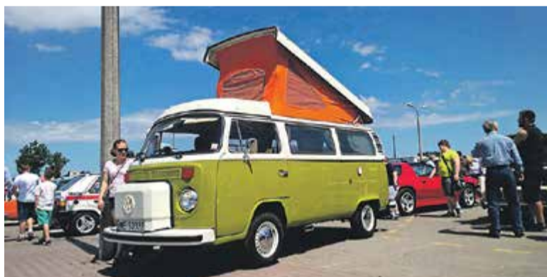
Tak zwany ogórek kempingowy

Piaseczyńskie złoty klasyków to nowa świecka tradycja, która przyciąga coraz więcej wspaniałych samochodów (oraz jednoślądów). Duża