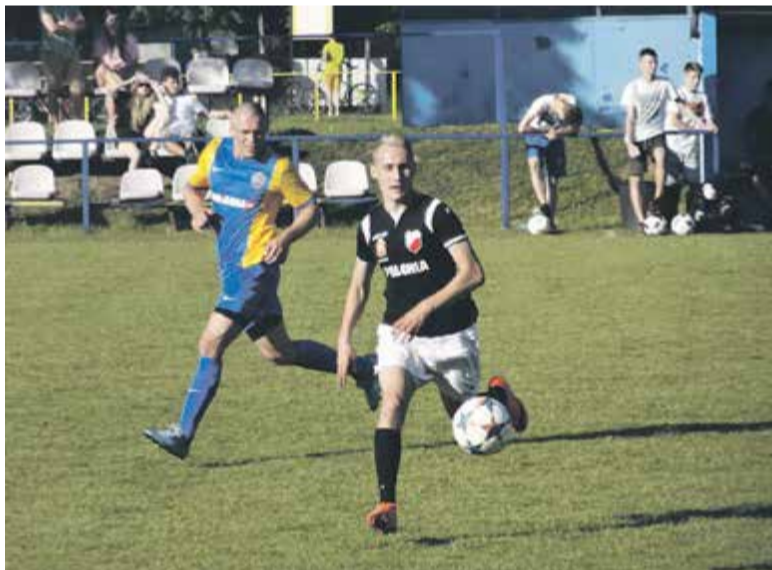
Piłkarze Polonii Warszawa zawitali do Konstancina

Zając” – wołali przeciwnicy. Zając „nie dokicał” i Polonię stać było tylko na jednego gola, choć w drugiej połowie szans mieli wiele. Nie ma to jak zdobyć komplet punktów, wygrać mecz z szanowanym klubem i jeszcze do tego zjeść coś na ciepło z grilla.