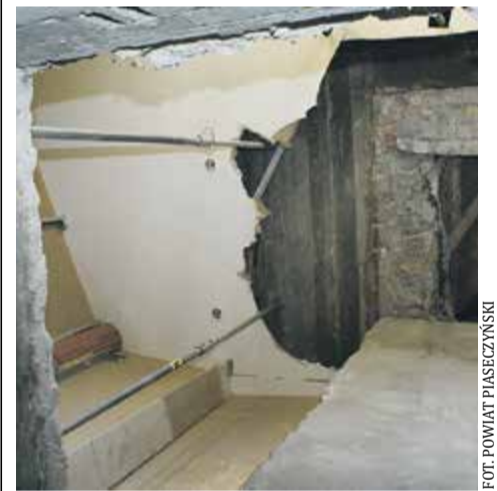
Szyb kominowy jest przygotowywany do zainstalowania windy