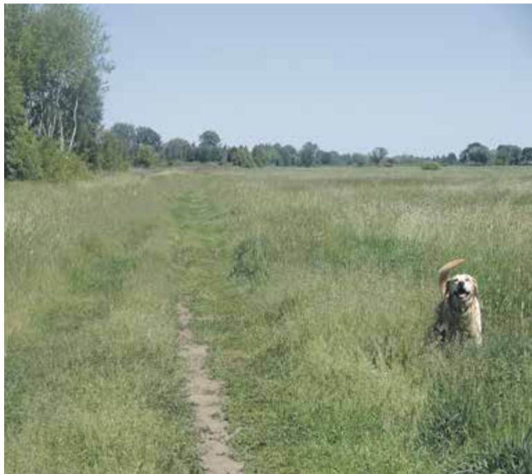
Czy na łąkach w Konstancinie powstanie targowisko

Wszystko rozbija się o ochronę środowiska. Miejsce, w którym miałyby powstać targowisko, znajduje się na terenie Chojnowskiego Parku Krajobrazowego, w sąsiedztwie dwóch rezerwatów przyrody. Prace związane z powstaniem targowiska, choć gmina nie zamierza stawiać tam budynków, mogłyby poważnie naruszyć walory krajobrazowe, a także spowodować niekorzystne zmiany w obszarach leśnych. W związku z tym radni i mieszkańcy zaczynają się zastanawiać, czy