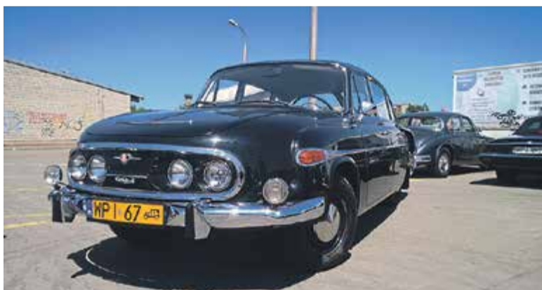
Czechosłowacka Tatra 603