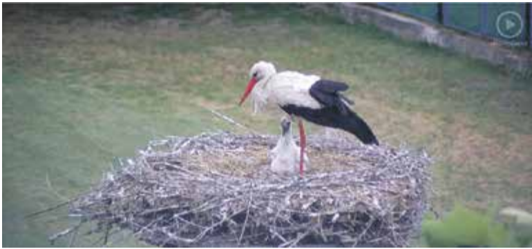
Bociany uchwycone dzięki kamerom online