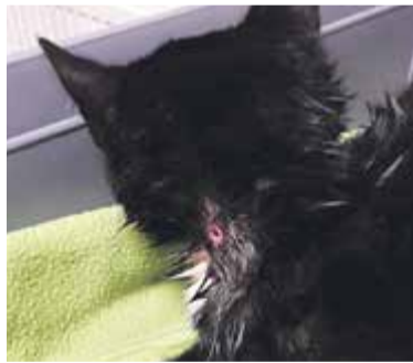
Kot pana Krzysztofa z dziurą po strzale z wiatrówki