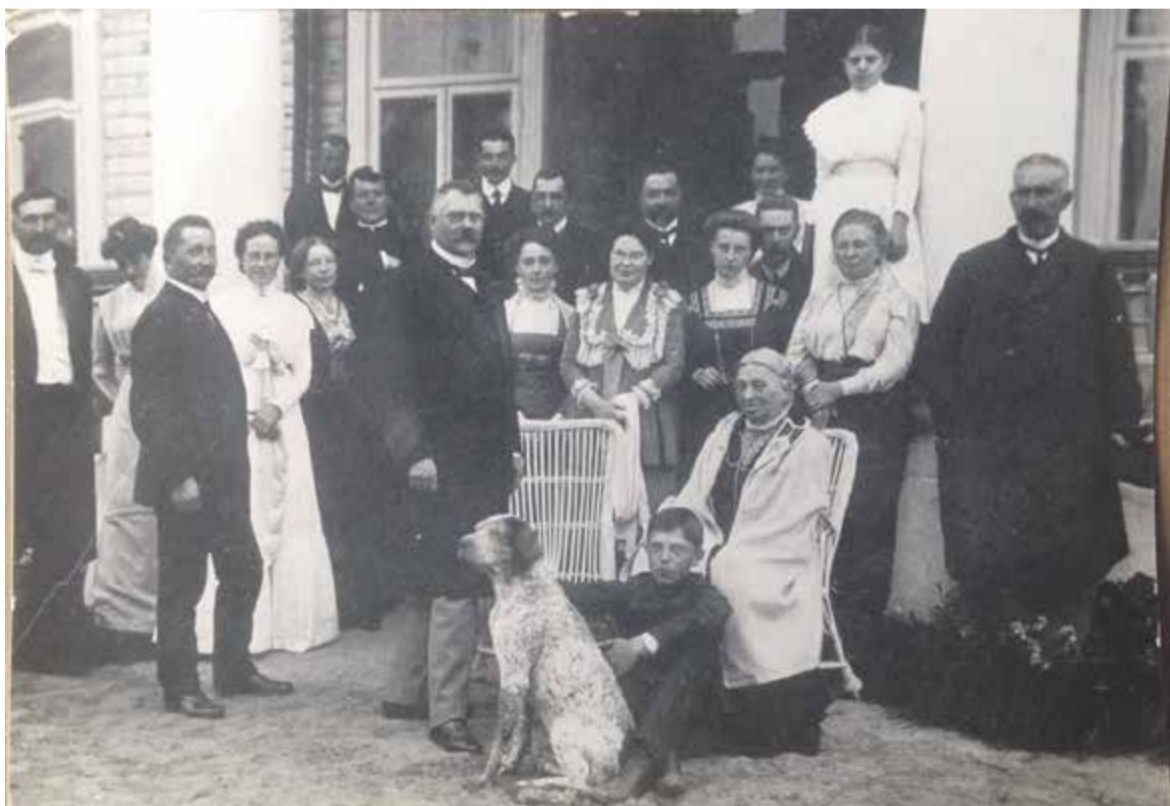
Korcozowicze przed dworem w Trościeńcu