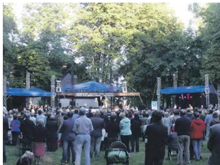
Tłumy wiernych na uroczystościach