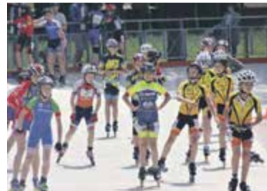
Torowe Mistrzostwa Polski w Jeździe Szybkiej na Wrotkach

nowali. Na torze przy Zespole Szkół nr 4 o puchary walczyli wrotkarze z całej Polski. Organizatorem zawodów byli Polski Związek Sportów Wrotkarskich oraz UKS Zryw, którego zawodnicy znani są z odnoszenia sukcesów. Impreza przyciągnęła duże zainteresowanie. Trzy dni mistrzostw transmitowane były również na żywo w internecie. Sportowcy rywalizowali w wielu różnych kategoriach. Wyniki zawodów dostępne są na stronie PZSW.