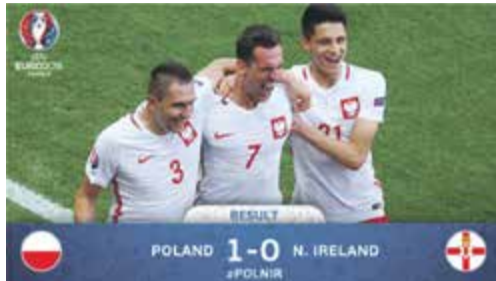
Piłkarze kadry świętują gola (źródło: UEFA EURO 2016)

Ten 19-latek może być jednym z największych odkryć Euro 2016. Imponował spokojem w grze. Był widoczny zarówno w defensywie, jak i ofensywie. Nie odpuszczał żadnej piłki, po prostu harował za dwóch. Młody