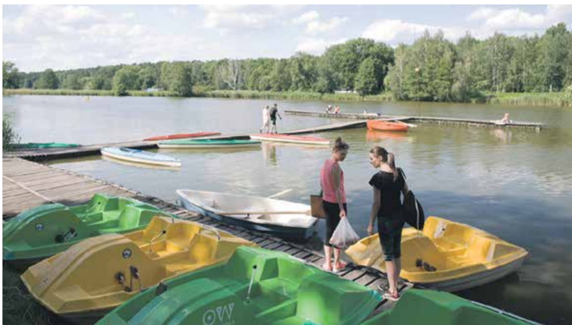
Dla ceniących spokojny wypoczynek na wodzie są rowery wodne