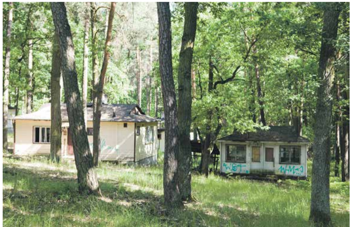
Dzierżawcy chcieliby m.in. wyremontować domki campingowe