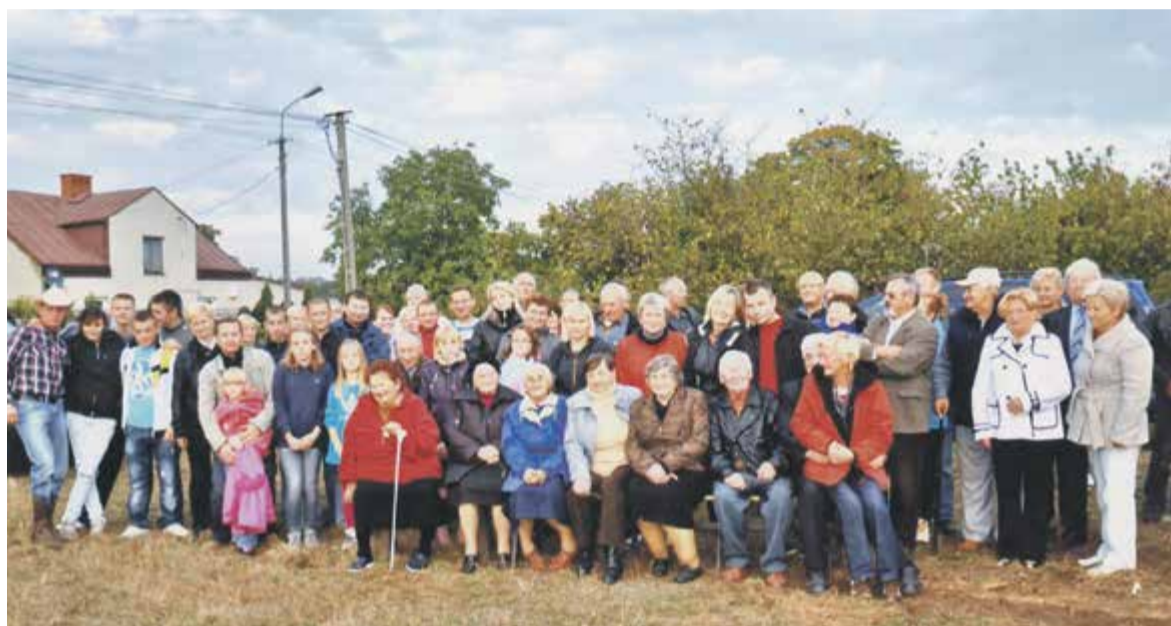
Mieszkańcy sołectwa na obchodach 102. rocznicy powstania miejscowości

Mamy ciszę, spokój. Wielu mieszkańców chce tu zostać, prawie nikt mi nie ucieka. Ci młodzi budują się tutaj, chcą tu mieszkać, zakładać rodziny. W ciągu ostatnich lat zbudowano u nas aż osiem nowych domów, a patrząc na to, jak niewielka jest nasza miejscowość, to dużo. I nie ma się co dziwić, u nas jest naprawdę pięknie.