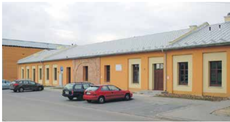
Ośrodek Kultury w Górze Kalwarii zmodernizowano w 80% ze środków unijnych

Gmina Piaseczno zajęła 198 miejsce z kwotą 324 mln złotych. Na 324 pozycji uplasowała się Góra Kalwaria z 215 mln złotych dofinansowania. Konstancin-Jeziorna zajęła 580 miejsce ze 155 mln złotych, Lesznowola 637 – 102 mln, Tarczyn dopiero na miejscu 1 438 z kwotą 40 mln zł unijnego wsparcia, a Prażmów pod koniec stawki – na 2 243 miejscu z sumą zaledwie 6,4 mln złotych.