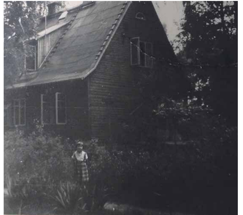
Zalesie Górne. Zdjęcie domu z lat sześćdziesiątych

do ogrodowego pawilonu. Tam pisał. W czasie urlopu też był czas na pisanie. Pisał odręcznie. Pierwsze maszynopisanie i korektę robiła żona. Pisarz sprawdzał maszynopis i robił jeszcze swoje poprawki. Poprawiony maszynopis „szedł” na maszynę i po-