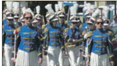
|| Wystrzałowe święto gminy s. 7