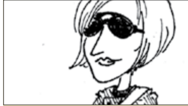
|| Patrzę na ciebie KOD-zie s. 8