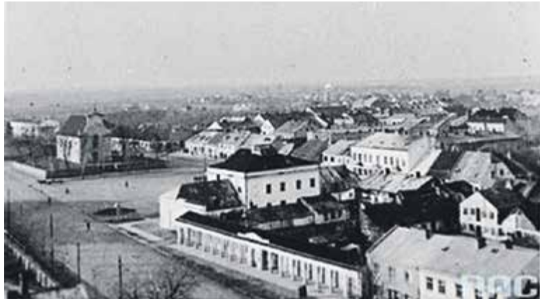
Panorama miasta 1939-1945

Górę Kalwarię poznałam w latach 80. XX wieku z dość prozaicznej przyczyny – warto było udać się do Góry po zakupy. W latach 80. ładne ubrania dla małych dzieci były nieosiągalne, a w Górze Kalwarii istniał sklep, w którym zawsze coś ciekawego „rzucano” na półki sklepowe. Z dworca Mokotów, mieszczącego się przy parku gen. Orlicz-Dreszera w Warszawie, odjeżdżały autobusy jadące przez Piaseczno do Góry. W Piasecznie na przystanku przy starym cmentarzu obok kamienicy Sikorskich na ulicy Kościuszki wsiadaliśmy do niebieskiego autobusu PKS. W godzinach szczytu komunikacyjnego można było zapomnieć o podróży, bo kierowcy często nie zatrzymywali pojazdu na przystankach. Autobus był wypełniony pasażerami, ugniecionymi jak radzieckie szprotki w puszcze. Niestety skończyła