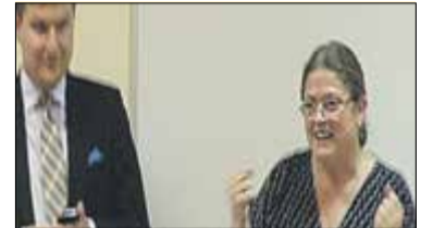
|| Król Europy - zamieć, pozamiataj s. 18