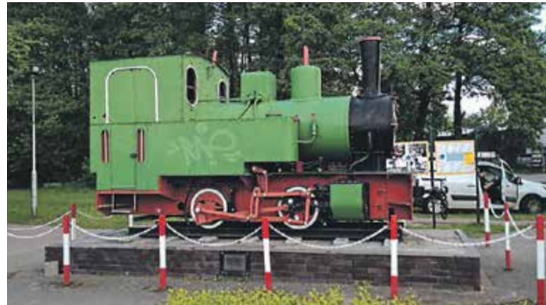
Pomnik kolejki wąskotorowej w Karczewie

u zbiegu ulicy Mickiewicza i Czerwonej Drogi stoi pomnik Kolejki Jabłonowsko-Karczewskiej – mały parowóz. Tylko tyle zostało w tym mieście z kolejki wąskotorowej, choć jej historia jest podobnie bogata do grójcekiej.