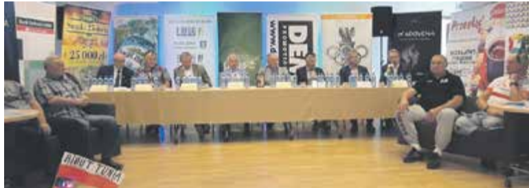
Konferencja z okazji II Biegu im. Piotra Nurowskiego

– Jest mi bardzo miło, że mogę państwa powitać właśnie tutaj w Kon-