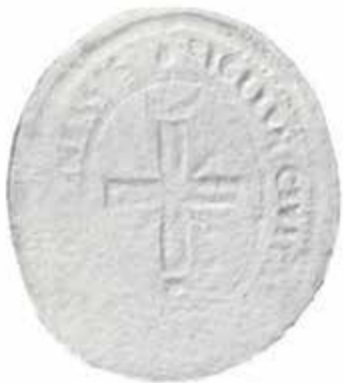
Pieczęć owalna (dokument z 1777 roku) na niej krzyż równoramienny z promieniami, nad górnym ramieniem krzyża korona, pod koło. Napis: Sigilvm Ciuwitatıs. W czasach późniejszych -nad górnym ramieniem krzyża księżyc, poniżej oko opatrności)