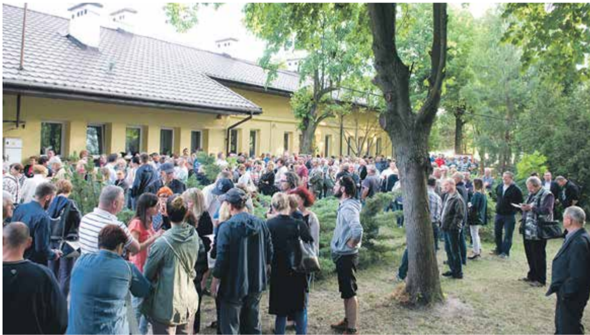
Frekwencja na spotkaniu wskazuje na to, że temat planowanej inwestycji żywo interesuje mieszkańców.