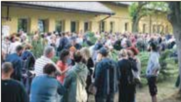
|| Protest w Tarczynie s. 2

PIASECZNO || GÓRA KALWARIA || KONSTANCIN-JEZIORNA || LESZNOWOLA || PRAŻMÓW || TARCZYN