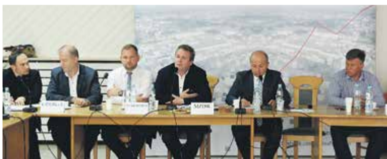
Na spotkaniu w sprawie DK79 pojawili się m.in. przedstawiciele GDDKiA, MZDW, oraz Zarządu Powiatu Piaseczyńskiego

MATURZYSTO, LICEALISTO co dalej? czytaj s. 12-13