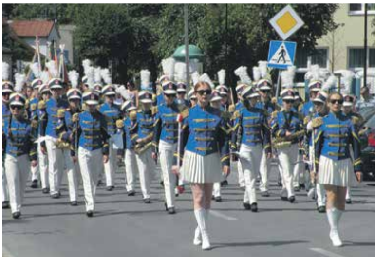
Parada ulicami miasta