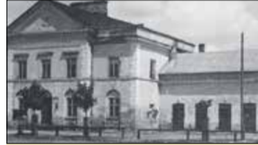
|| Nowe Jeruzalem s. 9