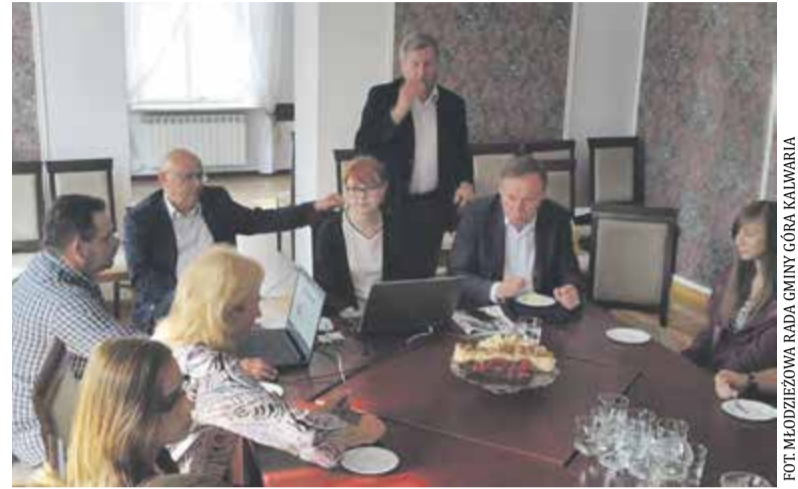
Burmistrz Góry Kalwarii odpowiadający na pytania internautów

– Rozpoczęte inwestycje będą sukcesywnie realizowane. W tej chwili jednocześnie prowadzonych jest na terenie miasta i gminy około 70 inwestycji. Myślę, że każda z nich