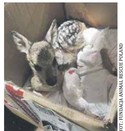
Mała sarna po odebraniu jej od myśliwego, który zamierzał przechować ją w garażu do rana w tym stanie