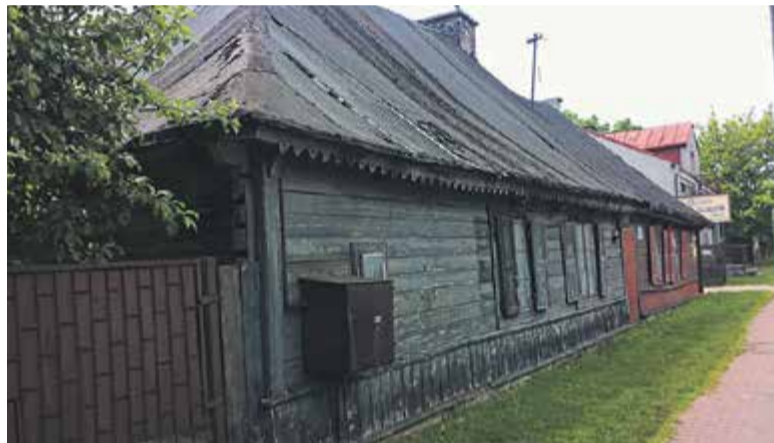
Karczma z XIX wieku w Karczewie

budynek z XIX wieku, będący niegdyś karczmą. Budynek nie przeszedł wielkich zmian, zachowały się nawet drewniane okiennice. Wejść do niego nie można, ponieważ aktualnie jest budynkiem mieszkalnym.