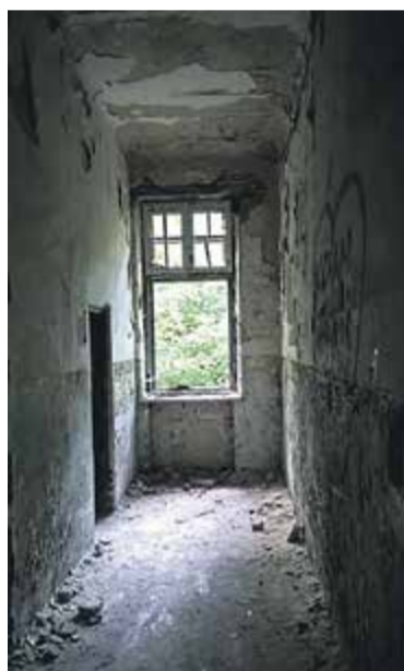
Zakład dla Psychicznie i Nerwowo Chorych Żydów Zofiówka

Jadąc dalej Otwocką i skręcając w prawo w Krakowską, dojedziemy do ulicy Mickiewicza zamieniającej się w ulicę Karczewską, którą możemy dojechać do Otwocka. Natomiast