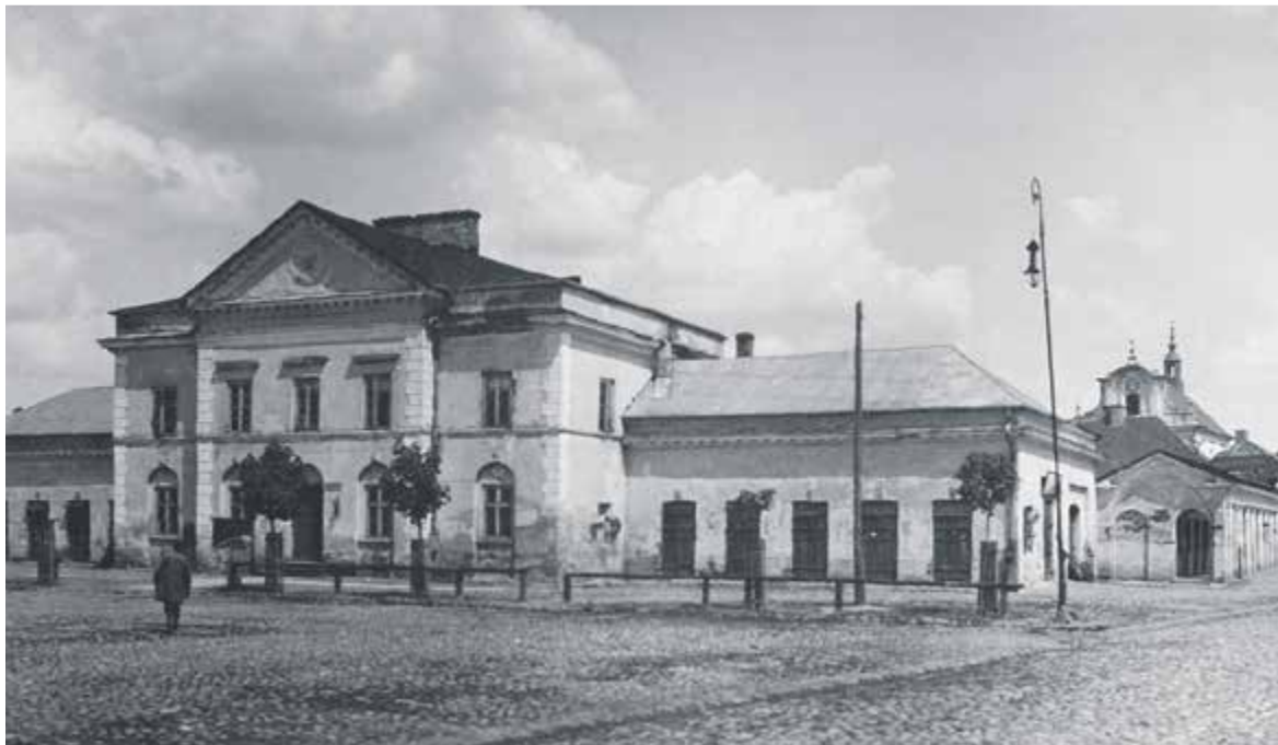
Ratusz w Górze Kalwarii rok 1917