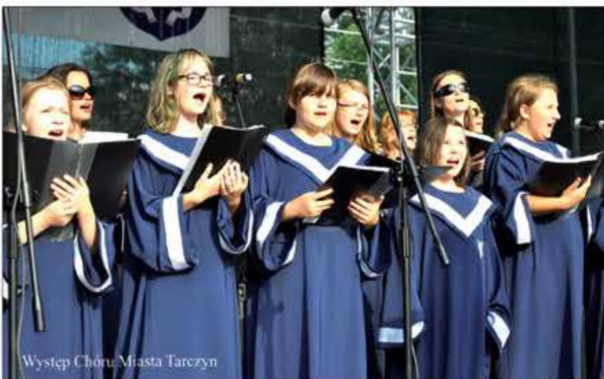
Występ Chóru Miasta Tarczyn