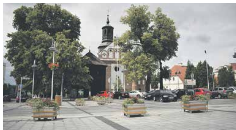
W parafii św. Anny w dn. 26-27 lipca będzie przebywać 500 Włochów

Dla uczestników ŚDM zostanie także zorganizowana wycieczka kolejką wąskotorową, koszt Gminy to 1,8 tys. zł.