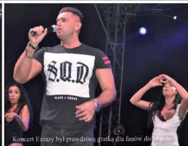
Koncert Extazy był prawdziwą gratką dla fanów disco polo