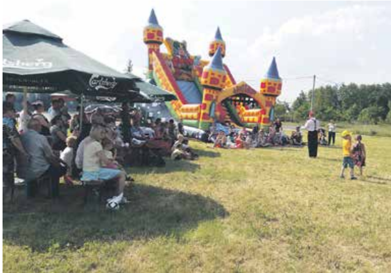
Dzień Dziecka w Cendrowicach

B.M.: Organizujemy wiele imprez. Dla najmłodszych obowiązkowo Mi-