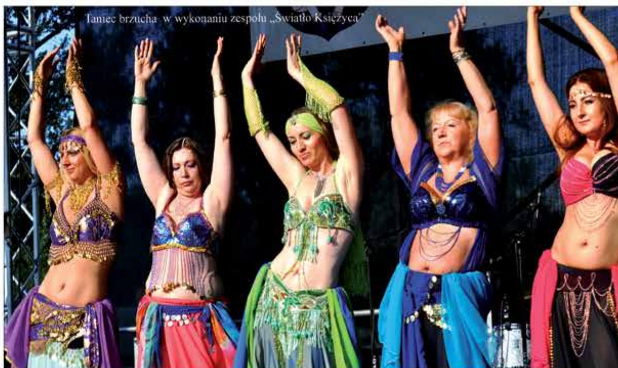
Taniec brzucha w wykonaniu zespołu „Światło Księżycy”