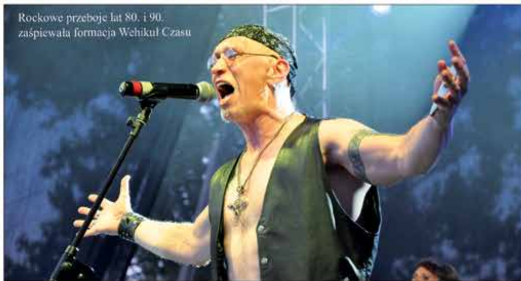
Rockowe przeboje lat 80. i 90. zaśpiewała formacja Wehikuł Czasu