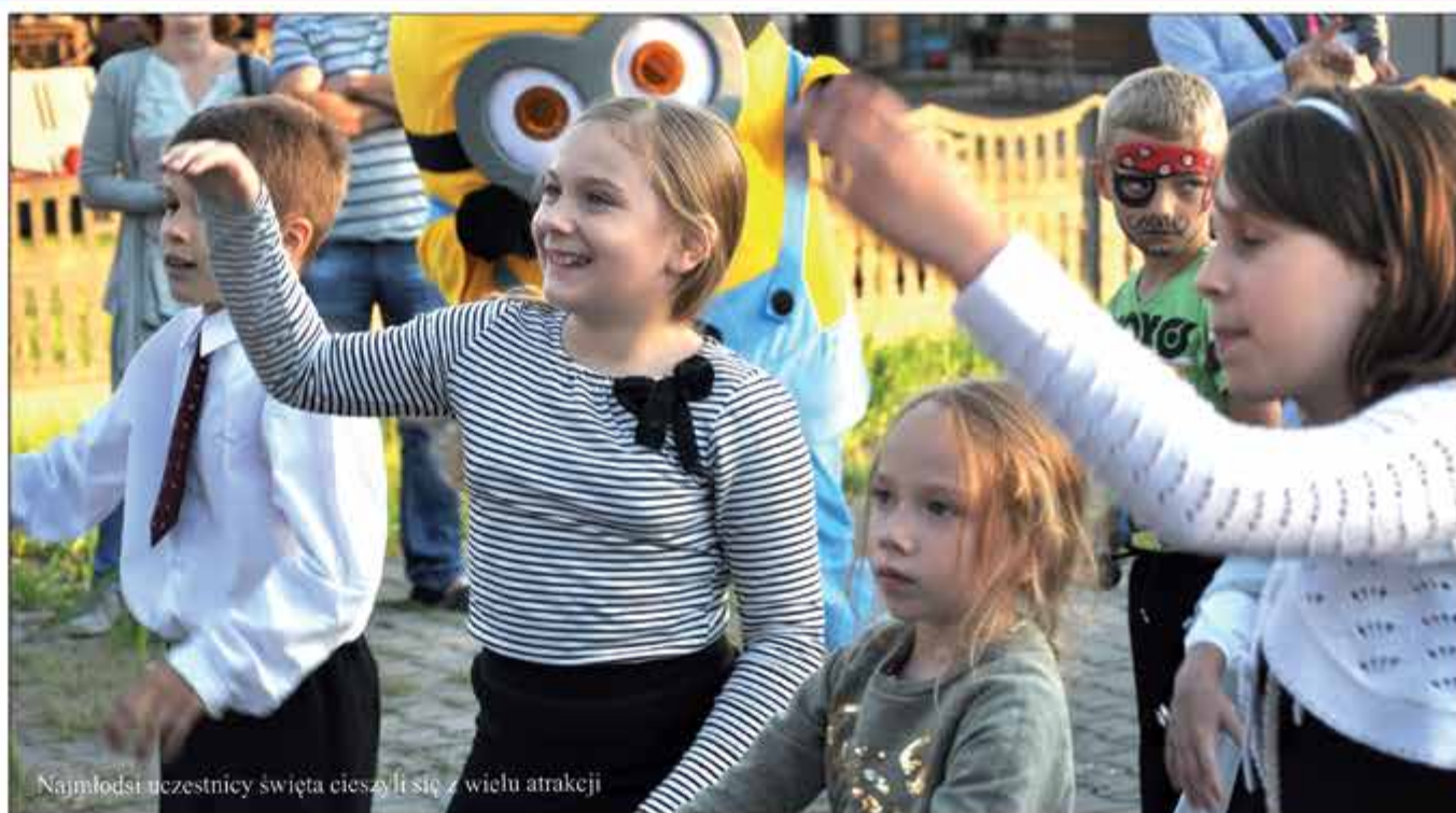
Najmłodsi uczestnicy święta cieszyli się z wielu atrakcji