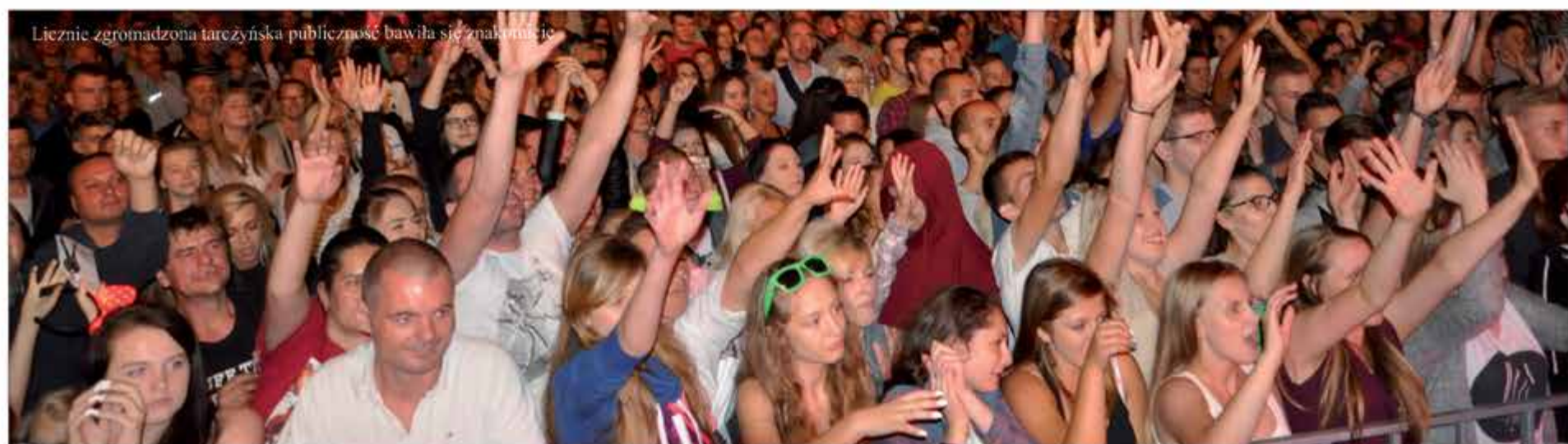
Licznie zgromadzona tarczyńska publiczność bawiła się znakomicie