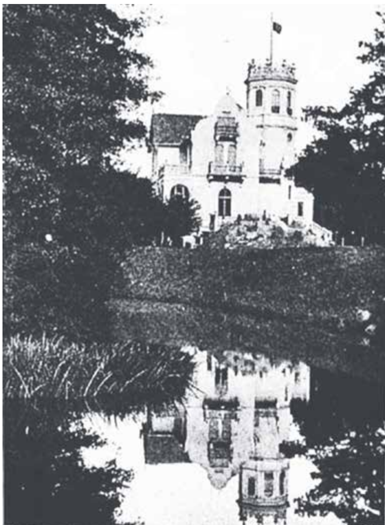
Zagłobin („Świat” 1911)

napisz do autorki m.szturowska@przeładpiaseczynski.pl