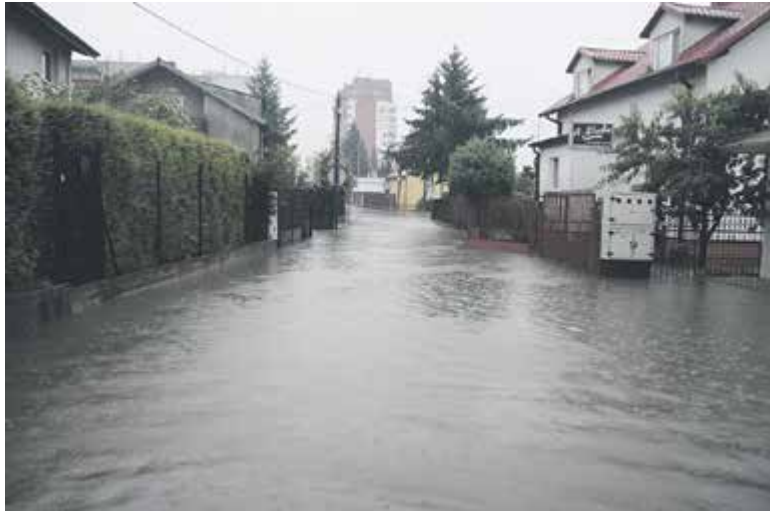
Zalana ulica Fabryczna

Efektom takiego przejazdu w najlepszym wypadku mogła być zdarta przez wodę tablica rejestracyjna pojazdu. Tych znaleziono tu kilkanaście.