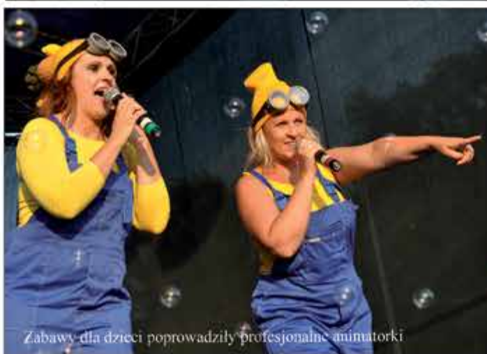
Zabawy dla dzieci poprowadziły profesjonalne animatorki