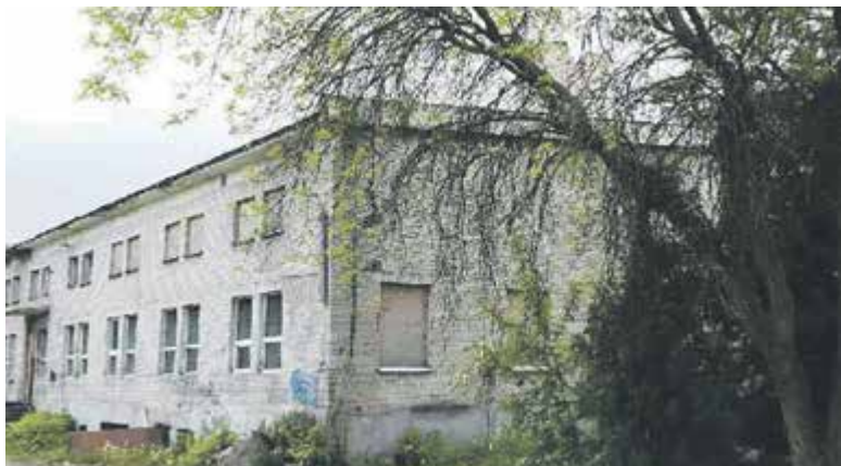
Obecny stan budynku stołówki