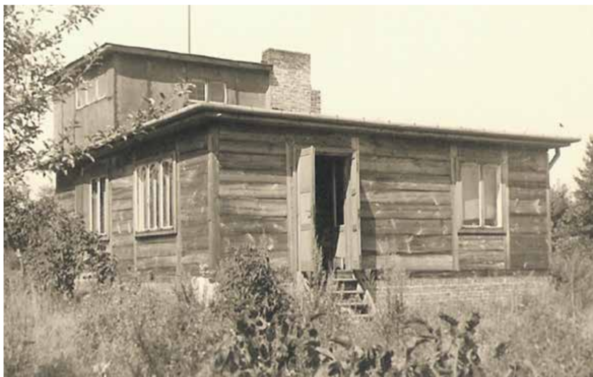
Dom Hassów w Piasecznie ul. Staropolska (dom już nie istnieje)