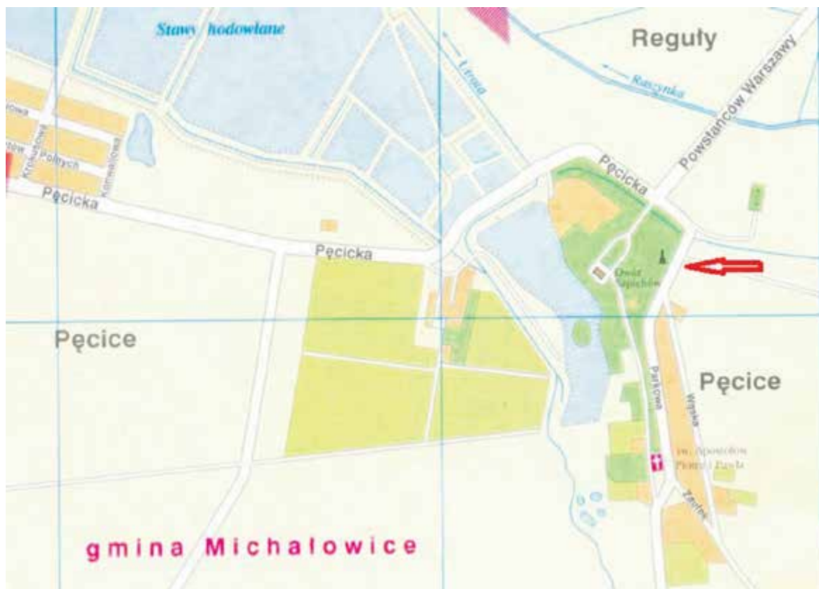
Mapa Pęcic z zaznaczonym dworem Sapienhów.