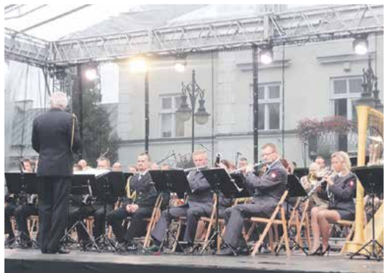
Orkiestra Reprezentacyjnego Zespołu Artystycznego Wojska Polskiego

– Potrafił być nie tylko wymagający na linii frontu, ale również potrafił otoczyć opieką swoich żołnierzy. Po wydarzeniach sierpniowych 1920 roku tu w Górze Kalwarii uhonorował najlepszych z najlepszych. Uhonorował 133 kawalerzystów. Było to nie-