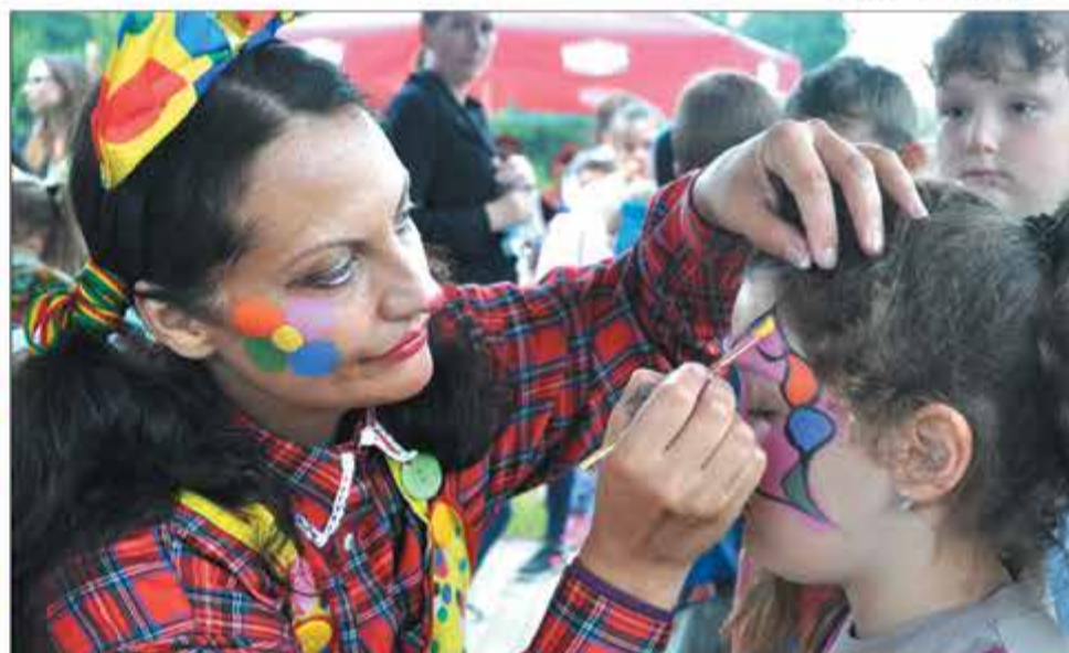
Oblegane przez najmłodszych uczestników imprezy było stanowisko malowania buziek