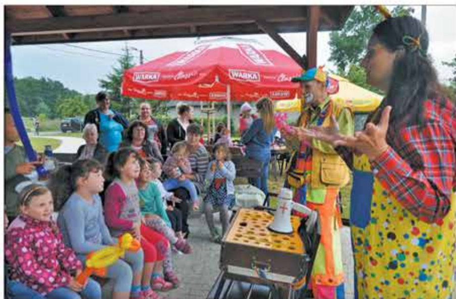
Podczas pikniku dzieci mogły uczestniczyć w różnego rodzaju konkursach.