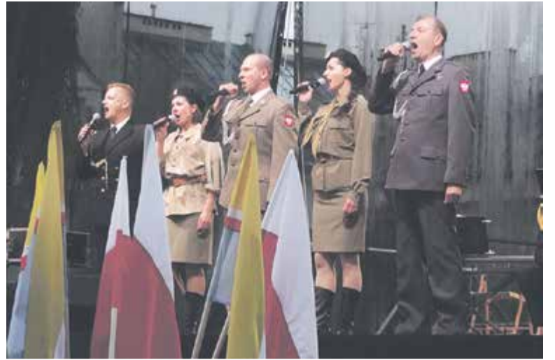
Występ Reprezentacyjnego Zespołu Artystycznego Wojska Polskiego

O godzinie 17.45 przed ratuszem miała miejsce zbiórka pocztów sztandarowych, które wyruszyły prosto do kościoła parafialnego, w którym została odprawiona msza w intencji żołnierzy poległych za ojczyznę. Na-