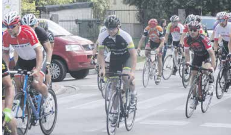
ŻTC BIKE RACE w Górze Kalwarii

Start zawodów znajdował się przy ulicy Księdza Zygmunta Sajny. Następnie trasa skręcała w lewo w ulicę Szpitalną i Pijarską, po czym zawodnicy kierowali się w prawo w stronę ulicy Kardynała Stefana Wyszyńskiego. Po opuszczeniu miasta uczestnicy wyścigu jechali drogą 724 przez Moczydłów, Brzeście do Kawęczyna, w którym skręcali do miejscowości Dębówka, a potem przez Podłęcze oraz Wólkę Dworską kierowali się z powrotem do Góry Kalwarii. Meta wyścigu usytuowana była na ulicy Lipkowskiej. Długość jednego okrążenia liczyła