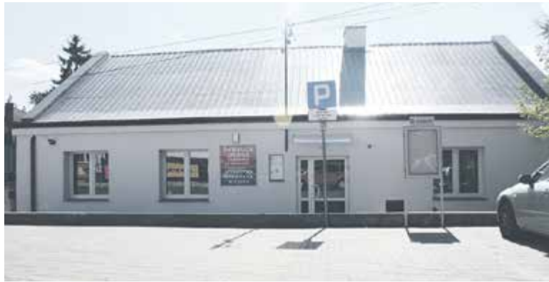
Wyremontowana świetlica w Gołkowie

W kwietniu rozpoczęły się prace na zewnątrz budynku, związane z termoizolacją świetlicy, budową