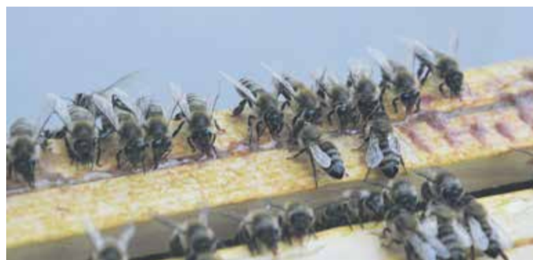
Pszczoły na ramkach z plastrami miodu

Pszczoły giną z kilku powodów. Ich śmiertelnym wrogiem są roztozcy warrozy pasożytujące na pszczołach i larwach. Pszczelarze mogą leczyć