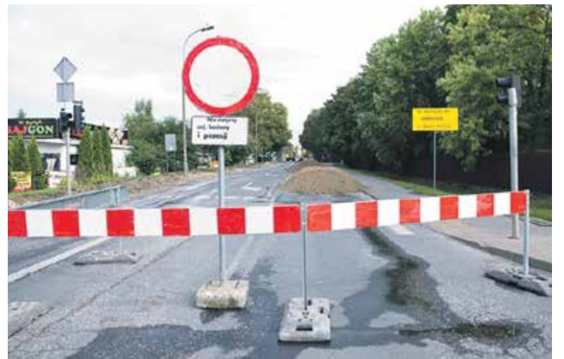
Ekipa budowlana rozpoczęła prace zgodnie z planem 3 sierpnia

Dodatkowo obecnie trwają też prace wodociągowe w ul. Nadarzyń-