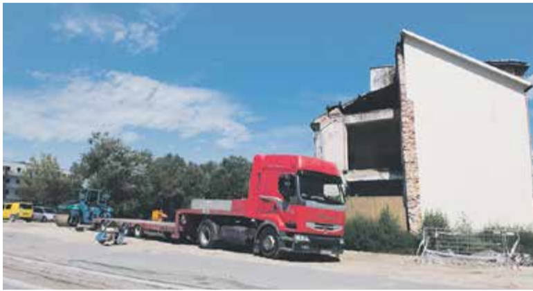
Obecnie na ul. Nadarzyńskiej parking jest nieformalny