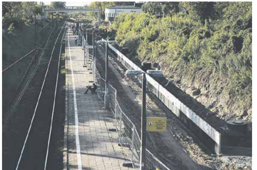
Budowa peronu na stacji w Piasecznie

– Na wszystkich stacjach i przystankach do Czachówka trwają prace modernizacyjne. Trwa wymiana torów i modernizacja przejazdów kolejowo-drogowych na 27 km odcinku linii kolejowej – podaje w komunikacie