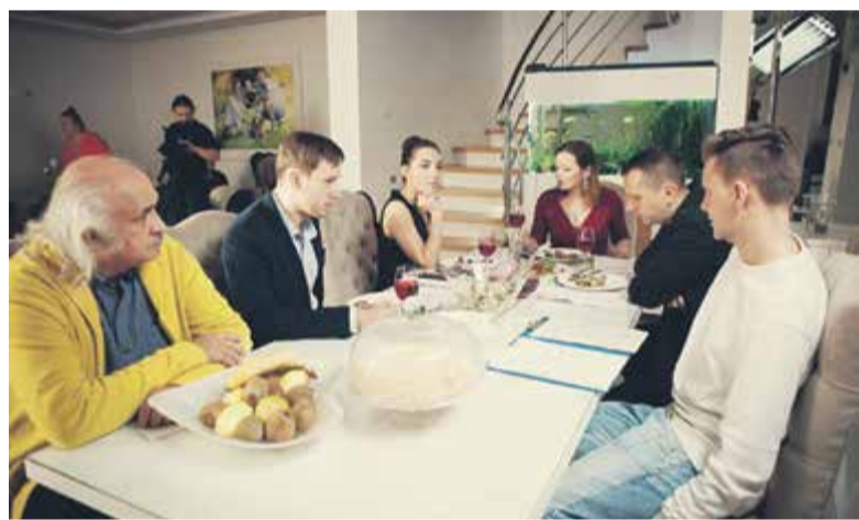
Kadr z planu filmowego „Przystanek do nieba”

MK: Szukałem lokalizacji do filmu, duży budynek, który będzie udawał dom opieki. Kiedy tam pojechałem i go zobaczyłem, wiedziałem, że to jest to miejsce. Ale w sierpniu menedżer poinformował mnie, że dwór pod koniec października zostanie oddany spadkobierczyni. Pomyślałem, że trzeba szybko działać. Kiedy zadzwoniłem do aktorów i zrobiłem kalendarzówkę, okazało się, że mam tylko tydzień na nakręcenie wszystkich zdjęć, czyli 7 ostatnich dni października, bo już