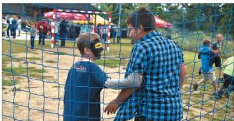
..... i grały w piłkę