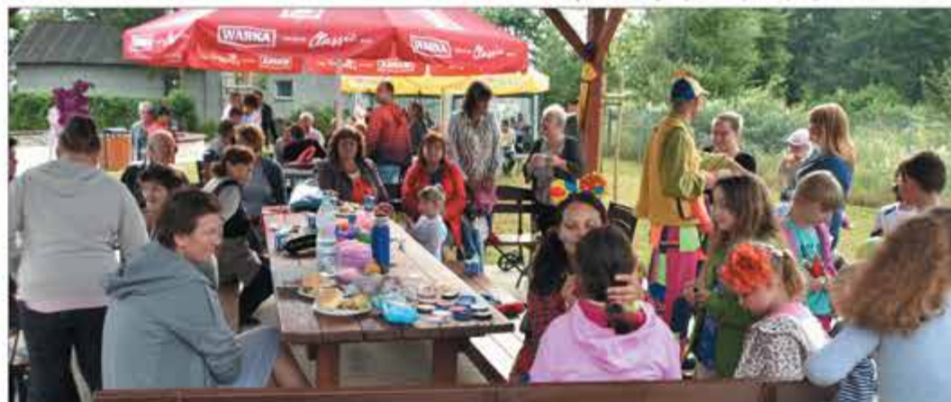
Impreza spotkała się z całkiem sporym zainteresowaniem

Burmistrz Tarczyna pragnie serdecznie podziękować osobom zaangażowanym w przygotowanie pikniku oraz wszystkim obecnym podczas imprezy.