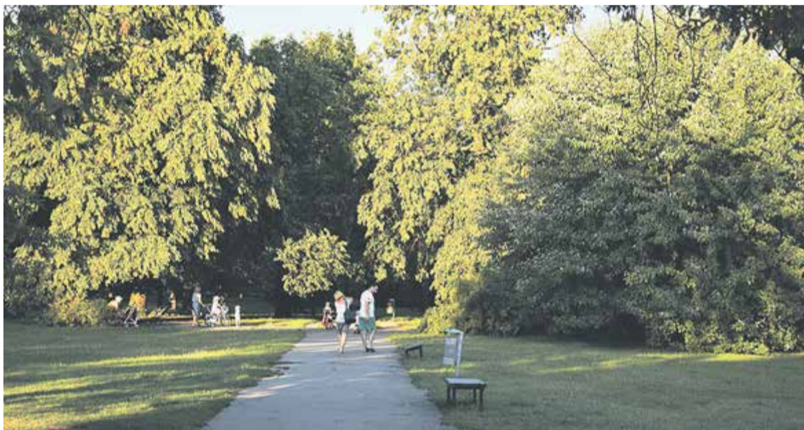
W budżecie gminy na rewitalizację parku przeznaczono blisko 1,5 mln zł

z oparciem i 47 bez oparcia, 72 kosze na śmieci i 6 stojaków na rowery oraz 45 ławek.