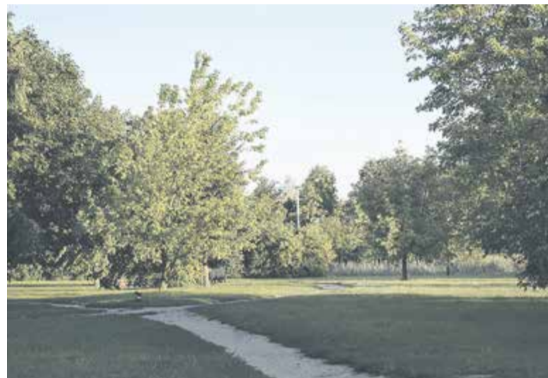
Park do końca roku zyska nowe alejki, oświetlenie oraz ławki

Gmina ogłosiła właśnie przetarg na realizację pierwszego etapu rewitalizacji parku chylickowskiego. Podzielono go na trzy odrębne zadania. Pierwsze obejmuje rozbiórkę i wykonanie nowych alei parkowych, drugie wykonanie i montaż tzw. małej architektury, czyli ławek, koszy na śmieci, stojaków na rowery oraz trybun przy boisku, trzecie zaś dotyczy wykonania oświetlenia i monitoringu. W parku ma stanąć 88 sztuk ławek