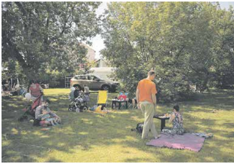
Mieszkańcy w rytmie slow relaksują się w Parku Miejskim