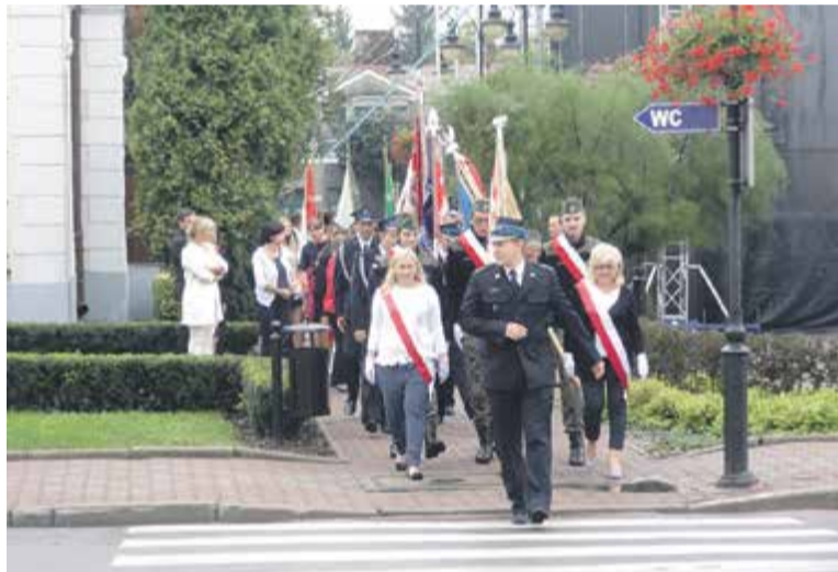
Wyprowadzenie pocztów sztandarowych