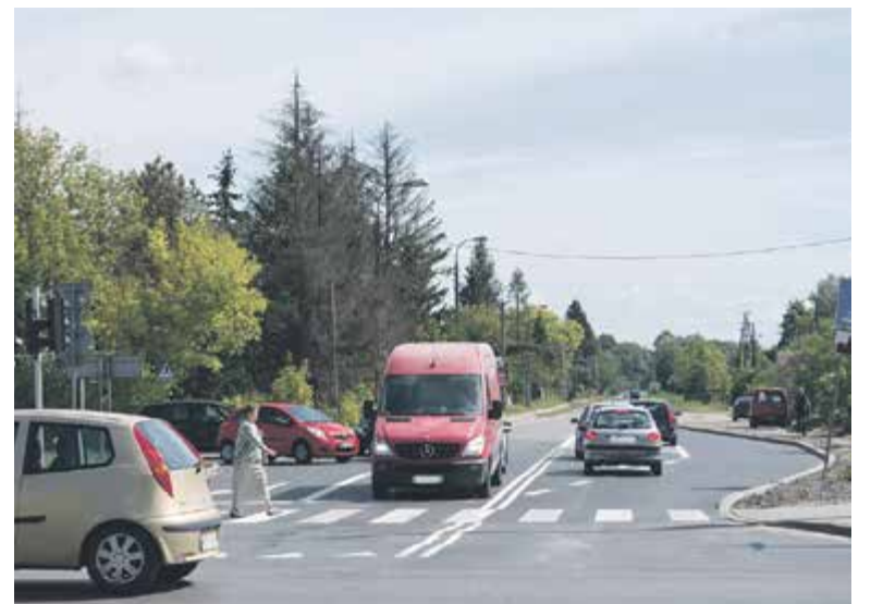
Kiedyś omijanie skręcających samochodów odbywało się poboczem, teraz zostało to ucywilizowane