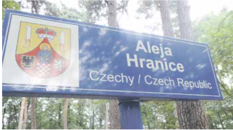
Aleja Hranice w Parku Zdrojowym

Na ostatniej sesji rady miejskiej (29 czerwca) rada podjęła uchwałę