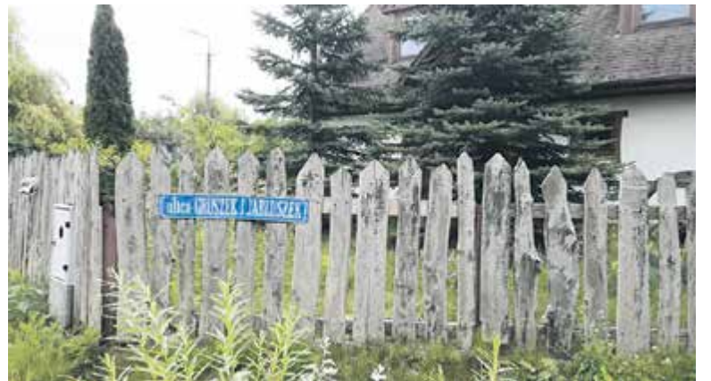
Ulica Gruszek i Jabłuszek w Wólce Kozodawskiej

Ważne, by propozycje nazw nie były wcześniej wykorzystywane w nazewnictwie ulic w gminie Piaseczno – dzięki temu nie będzie problemów z dostarczaniem poczty czy dojazdem karetki pod właściwy adres.