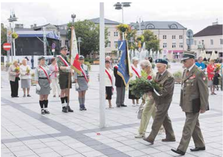
Kwiaty złożono pod tablicą upamiętniającą przywódcę Wojska Polskiego podczas Bitwy Warszawskiej – Józefa Piłsudskiego