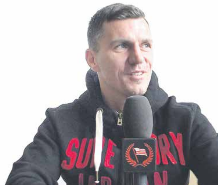
Odpinamy pasy i... wracamy na boisko

I Edycja rodzinnej imprezy Off-Road o Puchar Przeządu Piaseczyńskiego