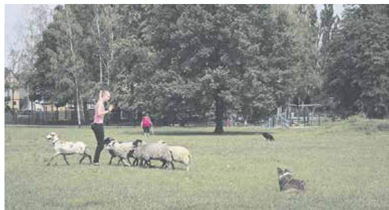
Trening psów pasterskich przy Ogrodowej

Grupa kobiet, które hobbistycznie trenują psy pasterskie, od sołtysa wsi Józefosław dostała kontakt do dziedzika PW i przekonała go, aby móc na