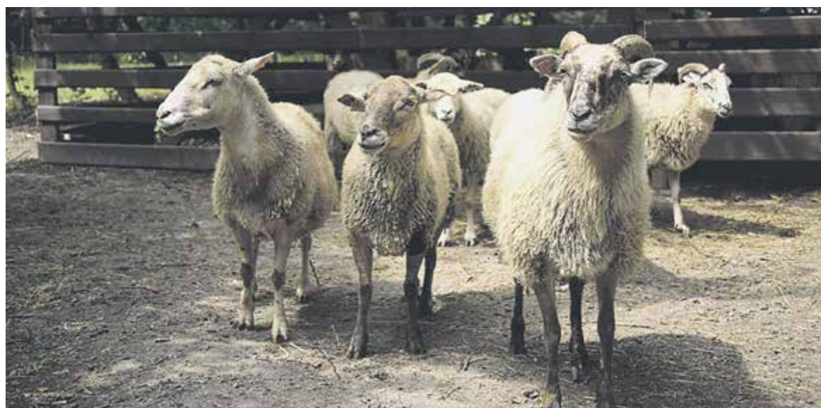
Stado owiec na terenie Politechniki Warszawskiej w Józefosławiu

Przyjechałam do Józefosławia w niedzielę, kiedy dziewczyny trenu-