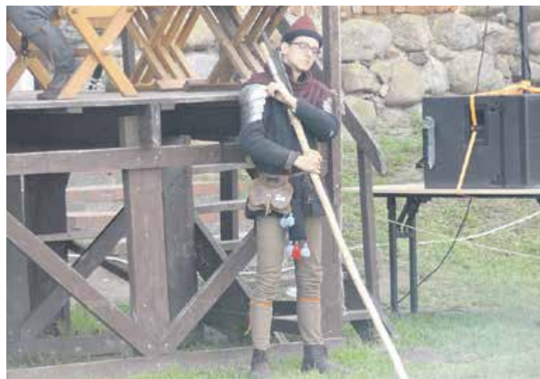
Ciężkie jest życie strażnika...