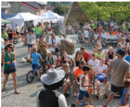
Tarczyńskie Owocobranie zgromadziło wielu mieszkańców Tarczyna i okolic