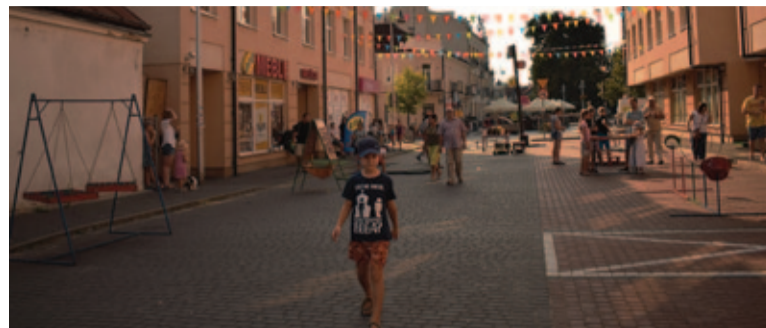
Wagabundowy Plac Zabaw na ulicy Rynkowej