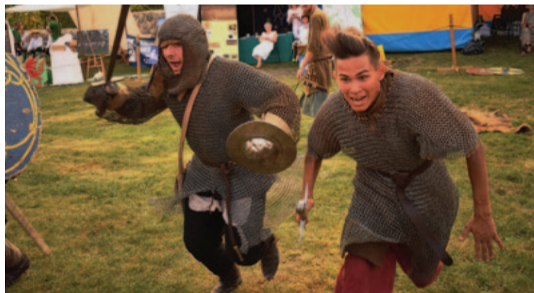
Publiczność miała okazję z bliska obejrzeć ubranie oraz uzbrojenie Słowian z wczesnego średniowiecza