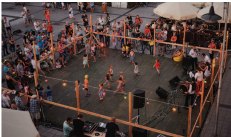
Jarmarczna potańcówka „na dechach”