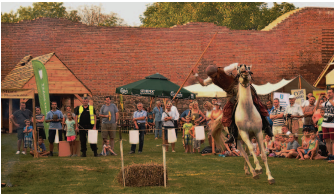
Nie zabrakło turnieju oraz pojedynku konnego