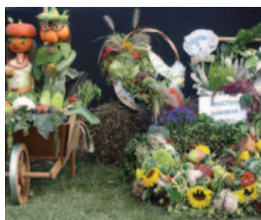
Na święcie plonów nie zabrakło... plonów