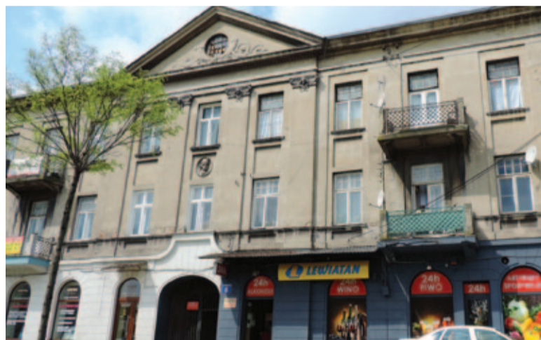
Kamienica 2016 r.

tem roślinnym. W centrum frontu kamienicy medalion z portretem Tadeusza Kościuszki. Na piętrach cztery symetrycznie rozmieszczone balkony z metalowymi, kratowanymi balustradami.