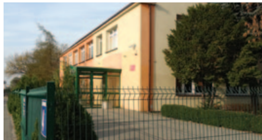
Przedszkole mieści się przy ul. Osiedlowej w Mysiadle