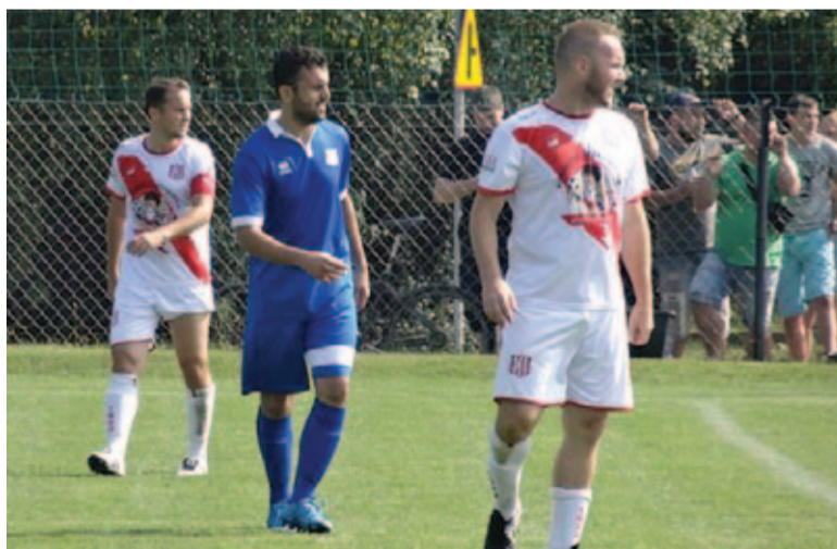
Piłkarze Laury i Jedności Żabieniec