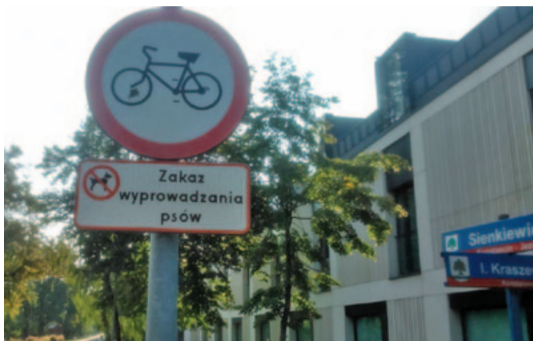
Tabliczka informująca o zakazie wyprowadzania psów w Konstancie

Ostatnio pisaliśmy o rajdowcach w Piasecznie, którzy za nic mają sobie zasady bezpieczeństwa i na jednym z parkingów próbują swoich sił w driftingu. Swoich kierowców ma również i Góra Kalwaria, aczkolwiek tam sytuacja wygląda nieco inaczej. Otóż niezwykle często późnym wieczorem na ulice miasta wyjeżdżają oni – „lokalni obserwatorzy”. W sportowych samochodach, z których zazwyczaj wydobywa się muzyka, patrolują rejon centrum. Ich „praca” polega na powolnej jeździe i dokładnej analizie każdej napotkanej osoby. Droga, którą zwykle przemierzają, tworzy prostokąt składający się z ulic: Piłsudskiego, Księdza Sajny, 3 Maja i Dominikańskiej. Trasę tę pokonują zazwyczaj dużą liczbę razy, w międzyczasie, gdy nie ma kogo obserwować, popisując się wydajnością silnika swojego auta. Taki oto pomysł na spędzenie wolnego wieczoru.