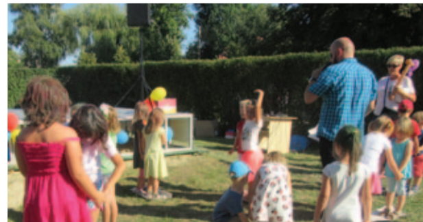
Zabawy przy muzyce