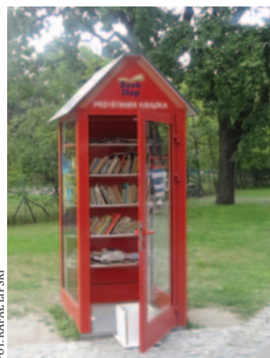
FOT. RAFAŁ LIPSKI

Na terenie powiatu działa kilka miejsc, w których możemy pozostawić swoje książki i znaleźć nowe lektury. W budynku Biblioteki Miasta i Gminy Piaseczno od wielu lat istnieją specjalne półki, na które trafiają lektury do wy-