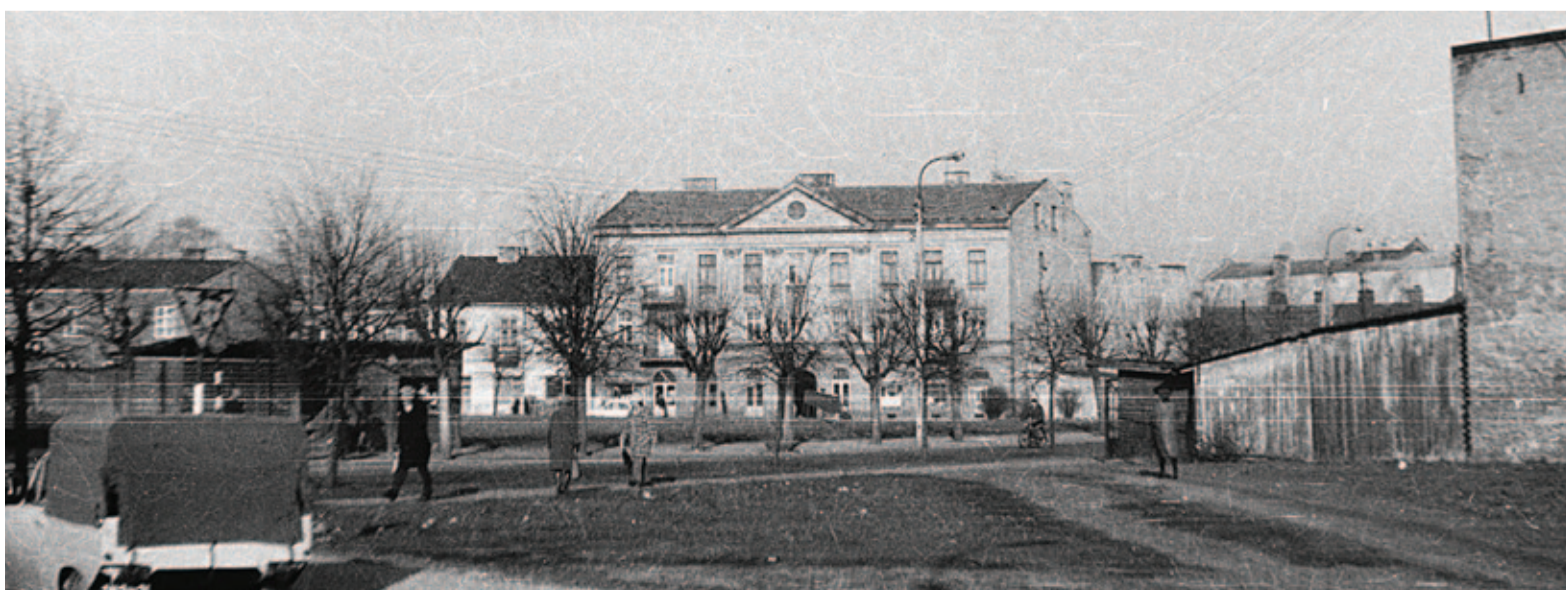
Widok z lat 70. XX w.

napisz do autorki m.szturowska@przeładpiaseczynski.pl