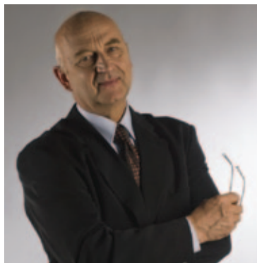
Burmistrz Zdzisław Lis

Jakie są ulubione zajęcia naszych włodarzy? Które miejsce w swojej gminie oceniają jako najpiękniejsze? Odpowiedzi na te oraz inne pytania możemy poznać dzięki naszej ankiecie!