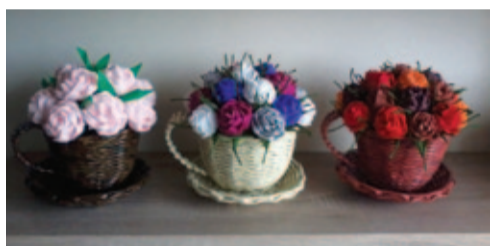
Filizanki zrobione z papierowej wikliny

A R T Y K U Ł S P O N S O R O W A N Y O G L O S Z E N I E