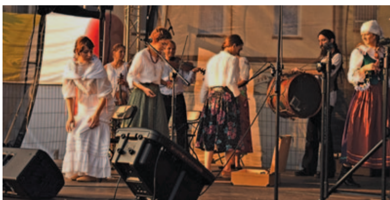
Obrzęd wesela sandomierskiego