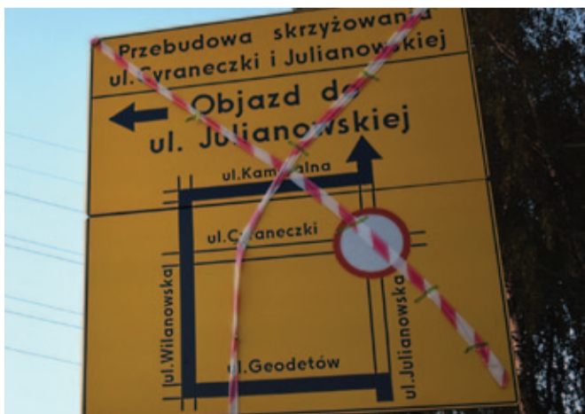
Objazdy dla samochodów zostały wytyczone ulicami Geodetów, Wilanowską i Kameralną.