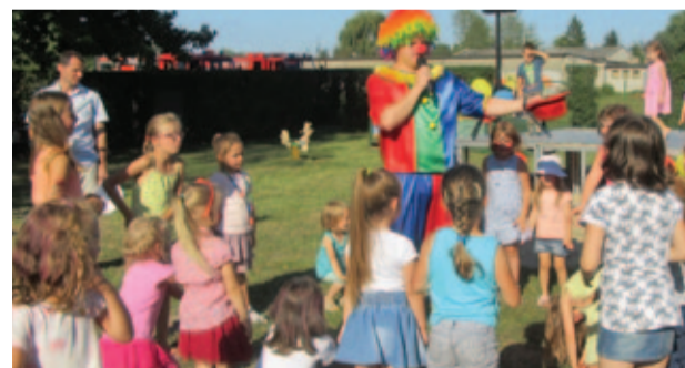
Spotkanie z klaunem