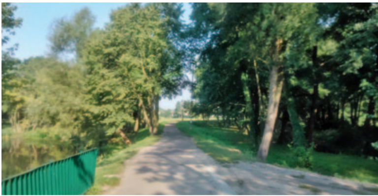
Droga prowadząca od parku do ulicy Elektrycznej