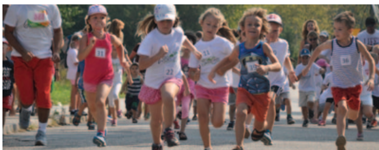
W biegach towarzyszących wystartowali najmłodszy