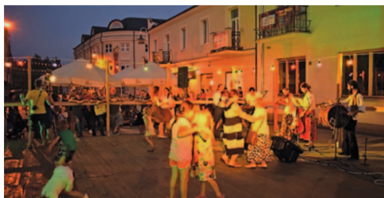
Do tańca przygrywała Kapela z Innej Struny

Na ulicy Rynkowej przez cały dzień Teatr Wagabunda zabawiał najmłodszych. W parku mogliśmy także podzi-