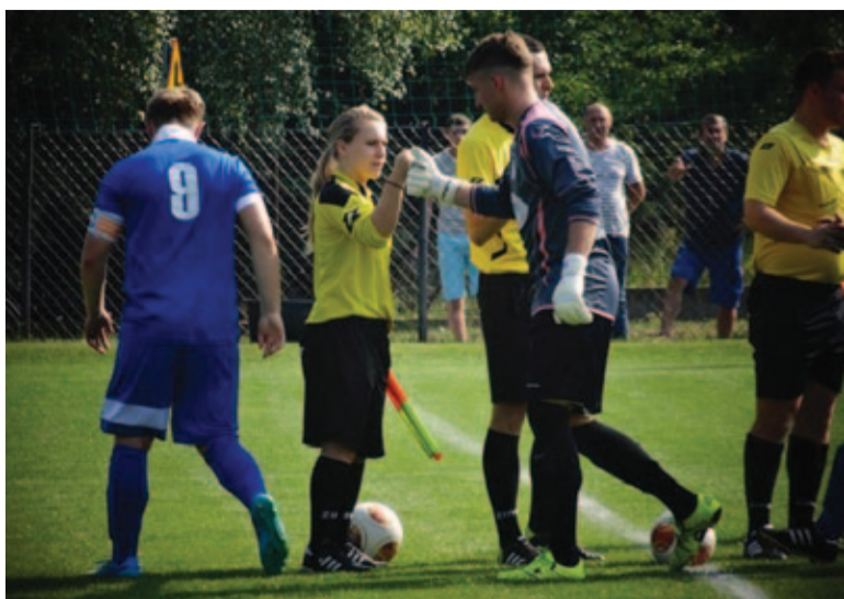
Początek spotkania w Chylicach