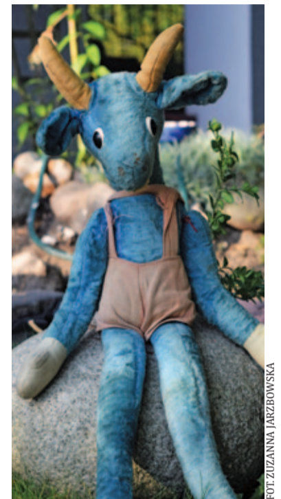
Koziołek Matołek zabawka z lat 70. XX w.