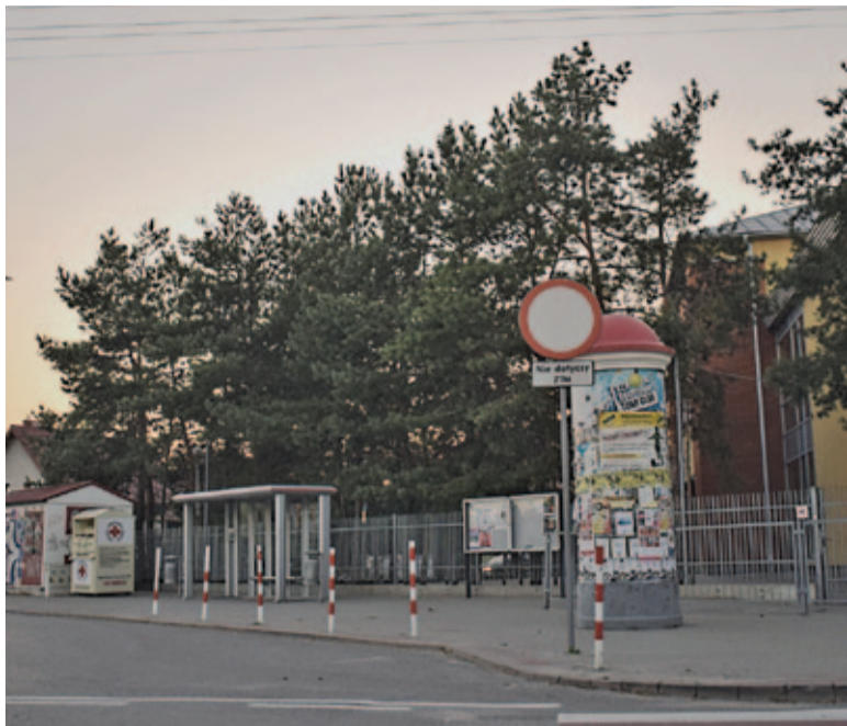
Dawna, a zarazem nowa lokalizacja przystanku pod szkołą przy Kameralnej