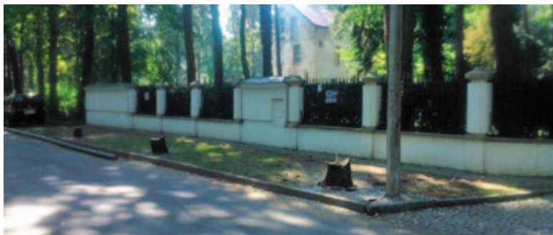
Po obu stronach ulicy Piotra Skargi wycięto drzewa