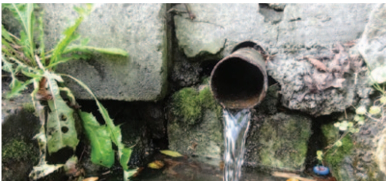
Skażone źródło św. Antoniego

||| Martwi mnie kapinkę to, jakie wartości niosą ze sobą te wykony s. 13