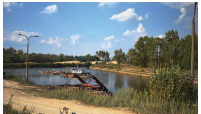
Port Piaskarnia dzisiaj