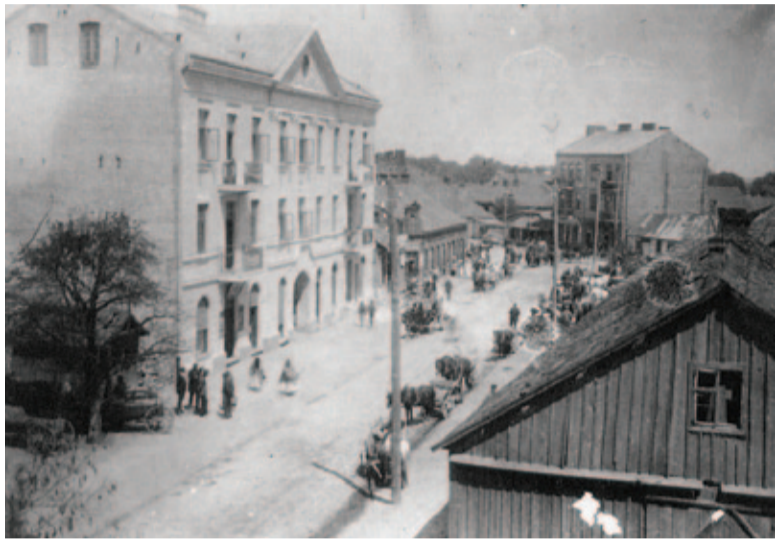
Kamienica w latach 30. XX w.