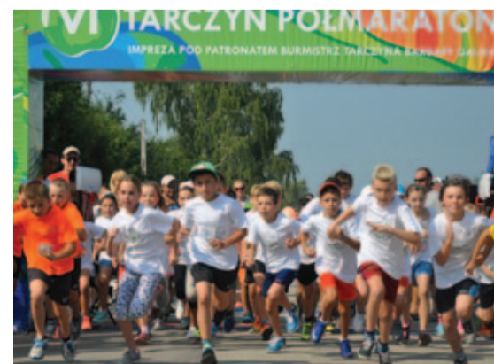
...i trochę starsi