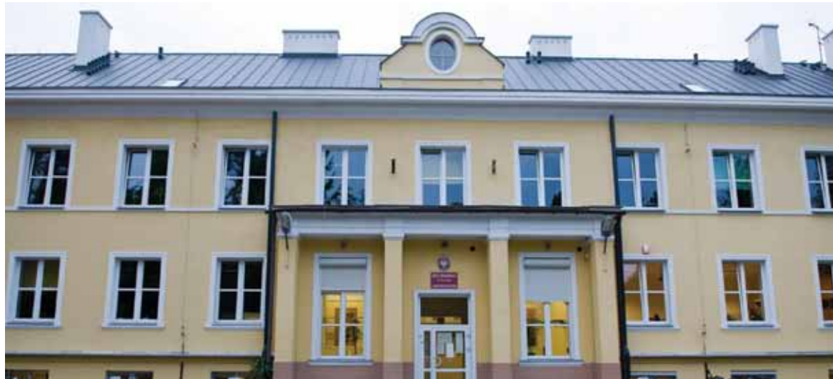
Podstawówka w Zalesiu Dolnym po rozbudowie powinna pomieścić dwa dodatkowe roczniki

roku na złożenie w Kuratorium Oświaty projektu uchwały dostosowującej dotychczasową sieć szkół do potrzeb reformy. Jeśli KO pozytywnie zaopiniuje (na co ma czas do 11 marca 2017)