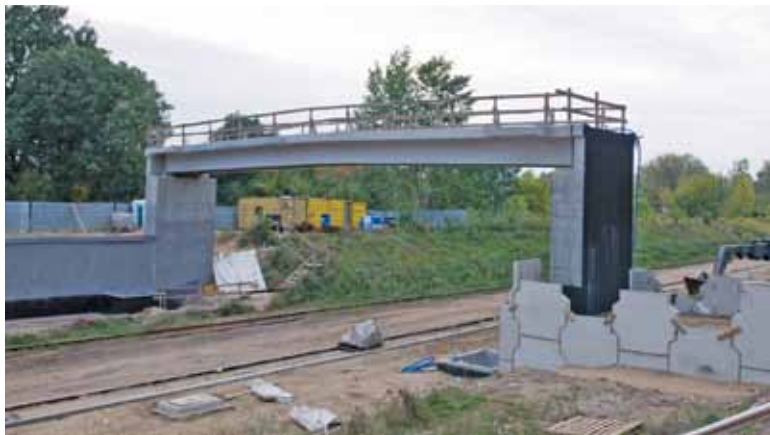
Nowa kładka czeka na zejścia i prace wykończeniowe

Konstrukcja nowej kładki przy piaseczyńskim dworcu pojawiła się już na początku czerwca, jednak od razu zapowiedziano, że na jej otwarcie