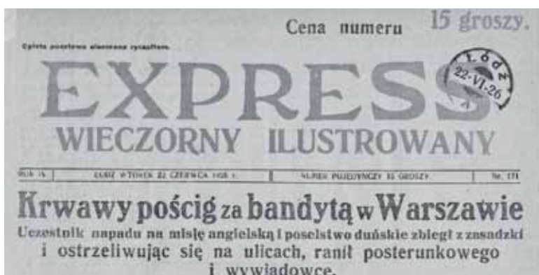
Tytuł z dziennika Expressu Wieczorny Ilustrowany

napisz do autorki m.szturowska@przelegpiaseczynski.pl