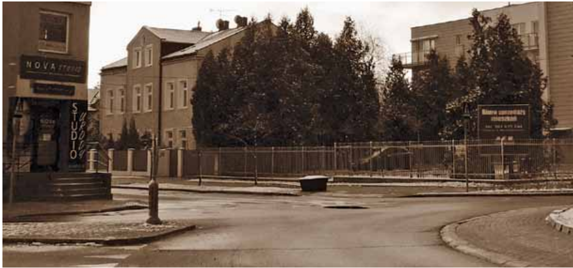
Rondo Solidarności w Piasecznie, środkowy budynek w 1926 roku pełnił funkcję posterunku policji

W dniu 30 września 1926 roku nadal trwał pościg za groźną bandą Zielińskiego, szajką rewolwerowców i złodziei, napadającą na mieszkania, domy i sklepy w okolicach Piaseczna.