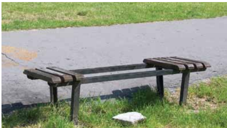
Na nowe ławki jeszcze trochę poczekamy