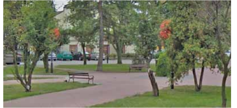
Czy na rynku w Górze Kalwarii będzie mogła powstać fontanna?