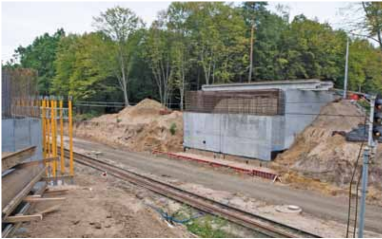
Prace nad nowym peronem w Piasecznie trwają