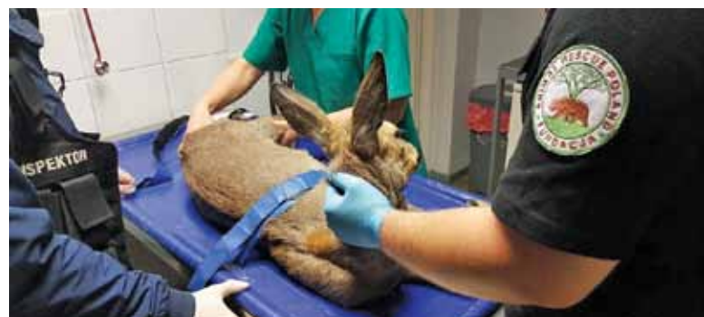
Wolontariusze Fundacji Animal Rescue Poland w trakcie interwencji

DF: Według ustawy należą one do skarbu państwa. Mamy jednak interpretacje prawne, które mówią o tym, że skoro według ustawy o samorządzie gminnym do gminy należy ochrona przyrody, to można przyjąć, że udzielanie pomocy dzikim zwierzętom