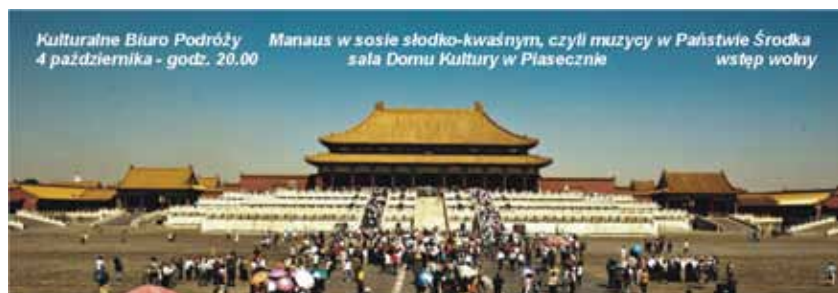
Kulturalne Biuro Podróży 4 października - godz. 20.00 Manaus w sosie słodko-kwaśnym, czyli muzycy w Państwie Środka sala Domu Kultury w Piasecznie wstęp wolny

I KONSTACIŃSKI PIKNIK ROTARIAŃSKI STOP UDAROM MÓZGU 1.10.2016 godz. 10.00-14.00