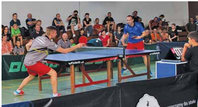
Zawody w tenisie stołowym