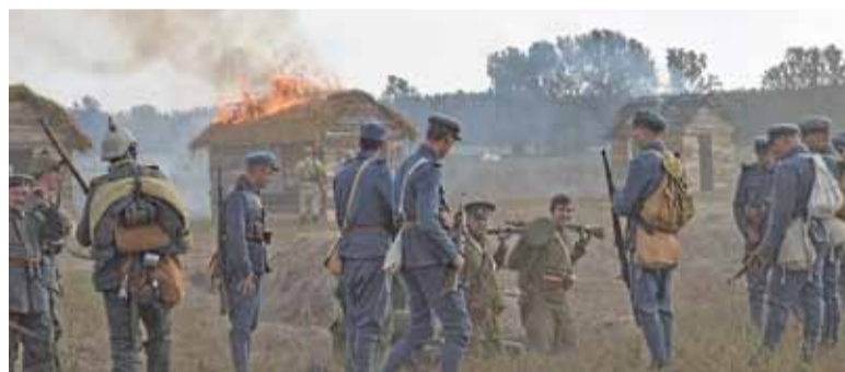
Pojmanie rosyjskich jeńców, a w tle płonąca chata