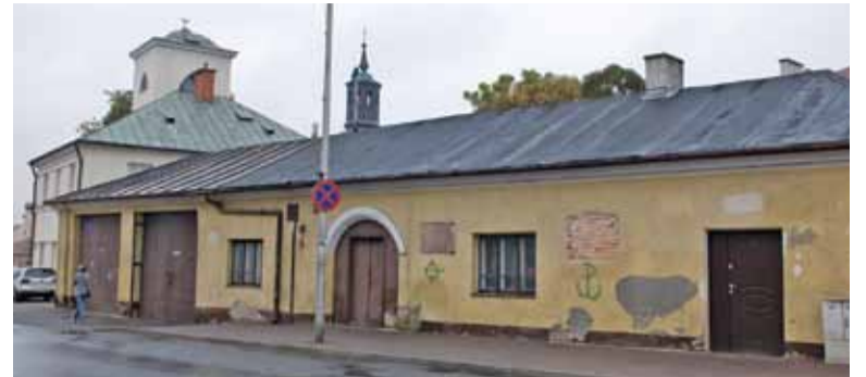
Ruina dawnej remizy strażackiej raczej nie stanowi ozdoby miasta

Jeśli chodzi zaś o dawną remizę OSP Piaseczno, to nie ma jeszcze ostatecznych planów jak to miejsce wykorzystać w przyszłości. Z konsultacji z mieszkańcami wynika, że chcieliby przeznaczyć budynek na cele kulturalne z uwzględnieniem jakiegoś lokalu gastronomicznego. Zanim zapadną decyzje, istotne