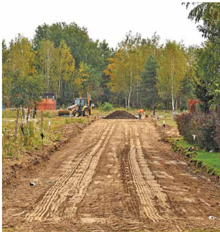
Udrażniana 3KDD w Józefosławiu