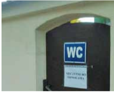
Obecnie nieczynna toaleta przy rynku w Górze Kalwarii