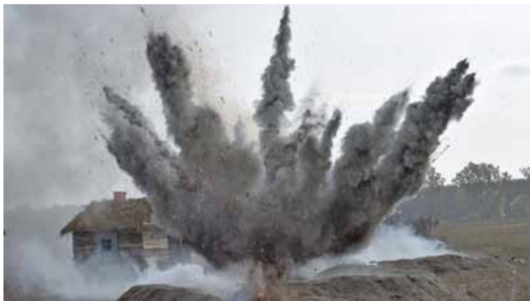
W inscenizacji bitwy nie zabrakło spektakularnych wybuchów