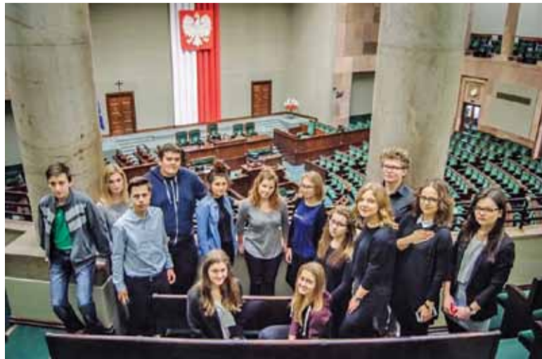
Młodzieżowa Rada Gminy w Sejmie RP

Podczas parostopniowego procesu młodzi ludzie wybrali projekty, które