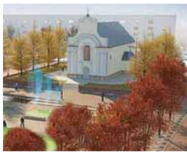
Wizualizacja rynku w Górze Kalwarii

wprowadzenie trawników i zakrzewień w strefie zadrzewionej, co pozwoliłoby zaistnieć tzw. „enklawom relaksu” dla mieszkańców. Oprócz tego planowane jest między innymi ograniczenie wokół rynku ruchu samochodowego i nadanie priorytetu rowerzystom oraz pieszym, a także udostępnienie mieszkańcom publicznej toalety w mało ekspozycyjnym miejscu. Planowany koszt wynosi 70 tysięcy złotych.