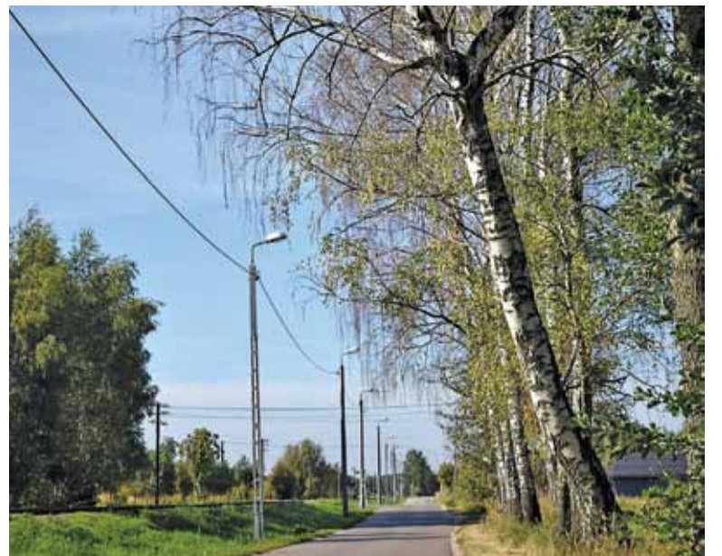
Jedna z 10 brzoź przeznaczonych do wycięcia wyraźnie chyli się ku upadkowi