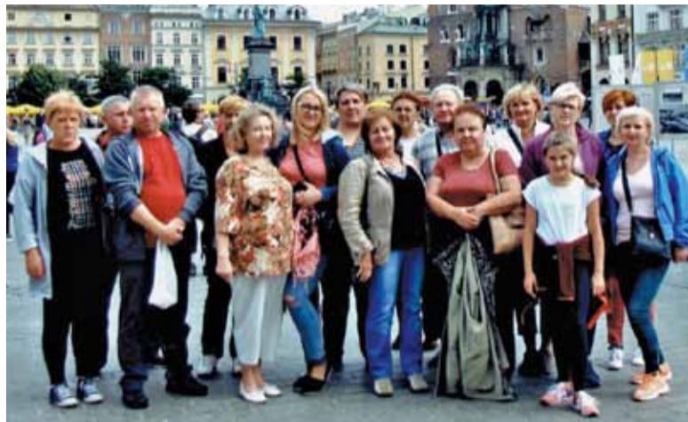
Mieszkańcy na wspólnej wycieczce...