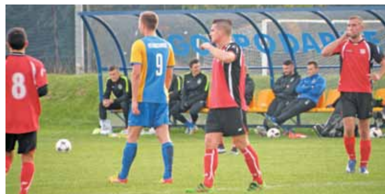
Spotkanie KS Konstancin kontra KS Raszyn

łowej edycji cyklu maratonów rowerowych Mazovia MTB. Organizuje go Cezary Zamana – legenda polskich sportów rowerowych. Współorganizatorami imprezy byli Gmina Piaseczno oraz Gminny Ośrodek Sportu i Rekreacji w Piasecznie. Baza zawodów znajdowała się przy ulicy Leśnej w Żabieńcu, a zapisy trwały od piątku. Mieszkańcy gminy, którzy zapisali się na maraton tego dnia, byli zwolnieni z opłaty startowej.