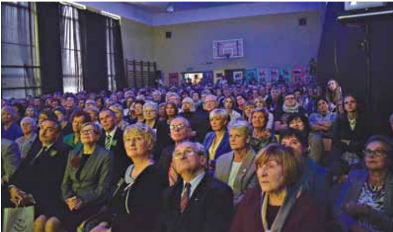
Absolwenci i dawni nauczyciele wypełnili salę gimnastyczną w LO