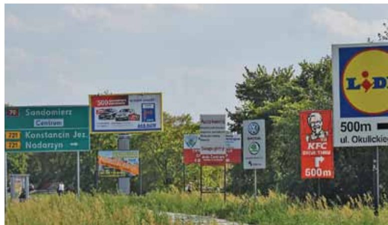
Reklamowy chaos w Piasecznie