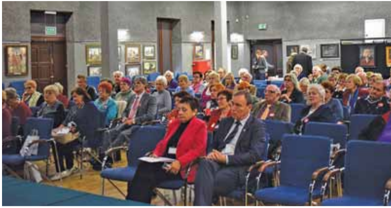
I Lotna Szkoła Rad Seniorów w Górze Kalwarii