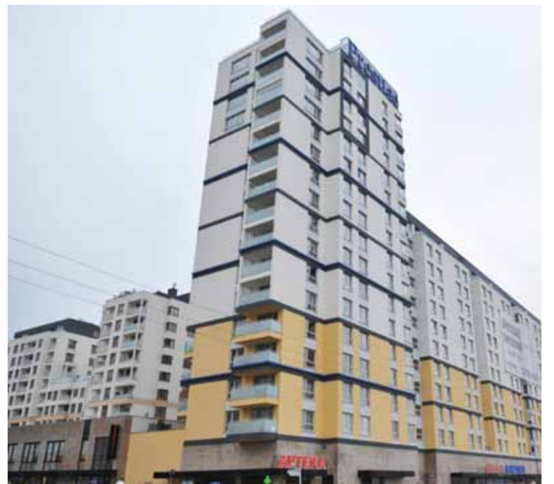
Wieżowiec przy ul. Jarząbka liczy 228 lokali

– Pozwolenie na budowę mówi o wysokościowcu, a ten powinien mieć kotłownię na dachu. Tymczasem deweloper wykonał tam mieszkanie, które oferuje za 2 miliony złotych – mówi