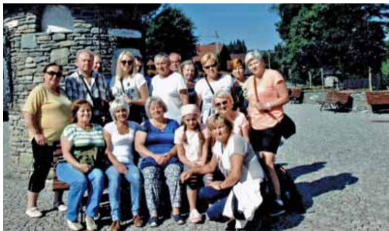
...chętnie pozują do wspólnych zdjęć

K.R.: Oczywiście. Nie wyobrażam sobie pracy bez współpracy z mieszkańcami.