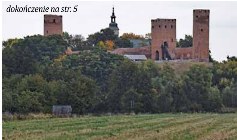
Miejsce, w którym odnaleziono cmentarzysko sprzed 2000 lat