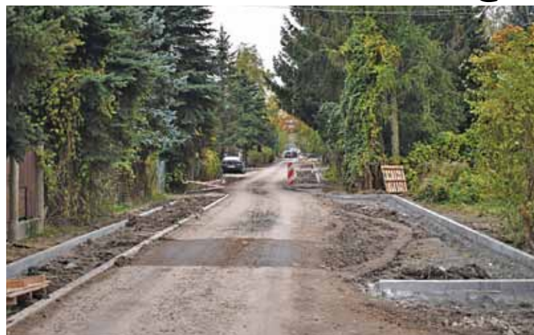
Ulica Osiedlowa w trakcie remontu