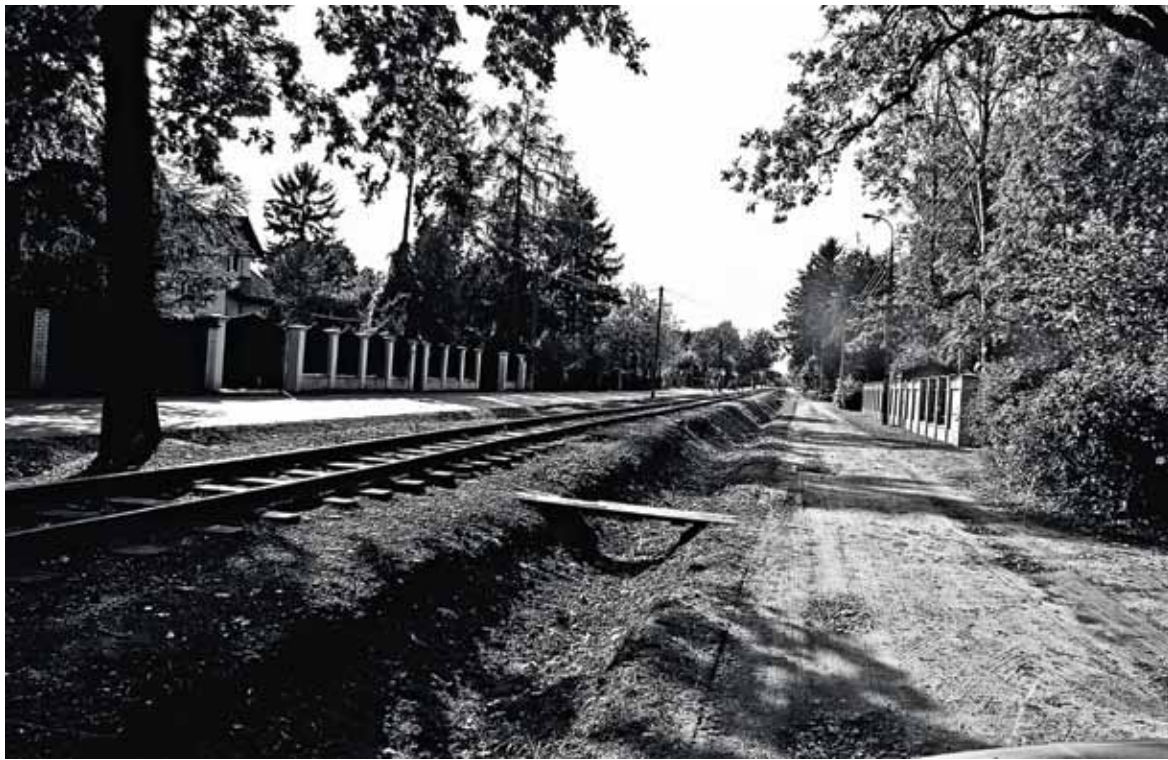
Zalesinek – tory grójeckiej kolejki wąskotorowej. Dziś dzielnica Piaseczna.