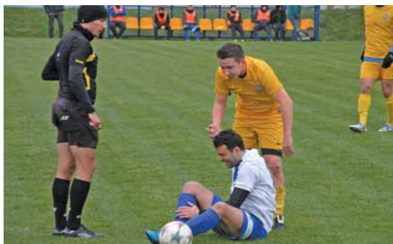
Na murawie nie brakowało walki