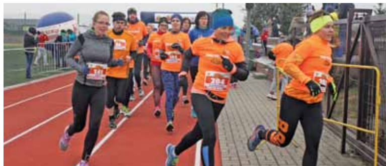
Bieg główny na 5 kilometrów