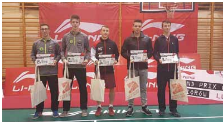
Medaliści zawodów w Lubinie

Turniej Tenisa Stołowego w Górze Kalwarii: 22-10-2016 od 9.30 na sali ZSZ im. F. Bielińskiego (Budowlanka)