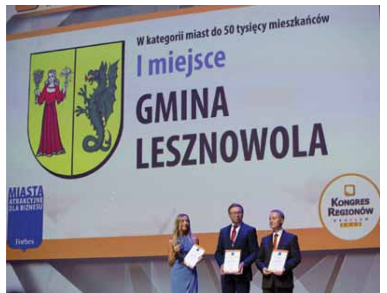
Kongres Regionów we Wrocławiu, ranking magazynu Forbes – na scenie laureaci kategorii miast do 50 tys. mieszkańców.

Opracowała Agnieszka Adamus, UG Lesznowola