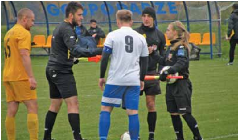
Początek derbów powiatu w A Klasie