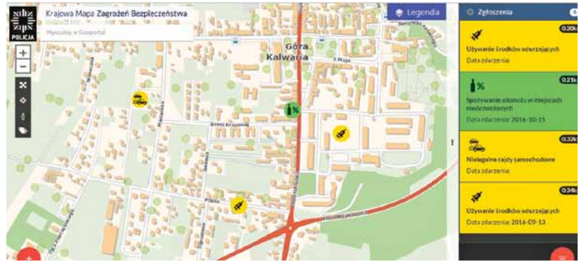
Krajowa Mapa Zagrożeń Bezpieczeństwa