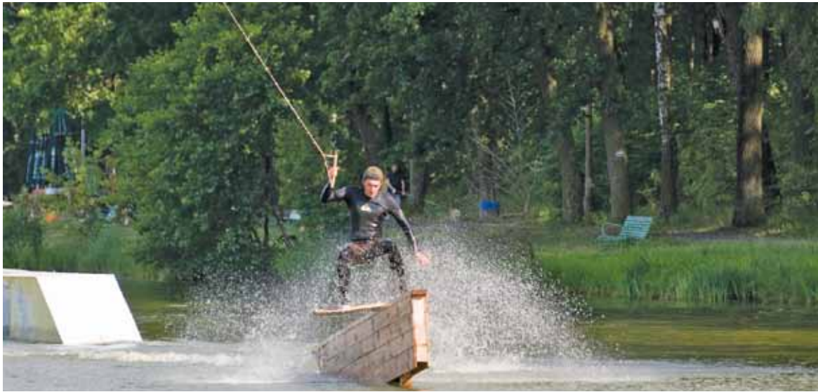
Półki co w Ośrodku Wisła postawiono przede wszystkim na sporty wodne