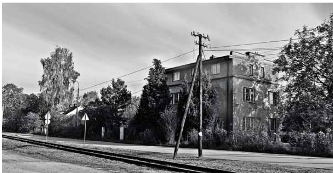
Piaseczno Zalesinek tory grójeckiej kolejki wąskotorowej. Okolice dawnej stacji kolejki.

Nie znam jej losów wojennych, tego tematu u nas w domu przy mnie nie poruszano. Przez kilkanaście lat po wojnie była niezamężna i dopiero