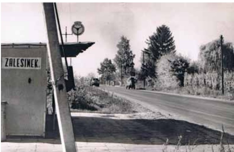
Rok 1970 szosa Piaseczno - Gołków przystanek w Zalesinku

w większości parterowymi domami w dużych ogrodach. W niewielkiej odległości od stacji została postawiona nowa willa, skromna na ze-