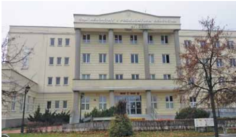
Sąd skierował sprawę do ponownego rozpatrzenia