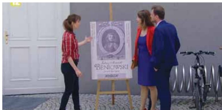
Aktorzy z serialu „Na Wspólnej” przed wejściem do Hugonówki

– Dekoracje i inne prace budowlane buduje pijacek. W bufecie mają panią Elwirę i ma kawę po turecku, i nic więcej. A nie, przepraszam – ma jeszcze jajka w majonezie. Księgowa chodzi na