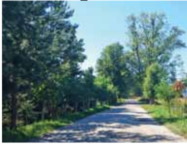
Wieś w letniej odświeżeniu