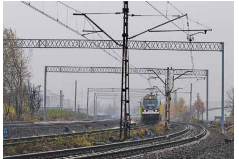
Trwający remont linii nr 8 wymusza na wykonawcy chwilowe zamknięcia przejazdów