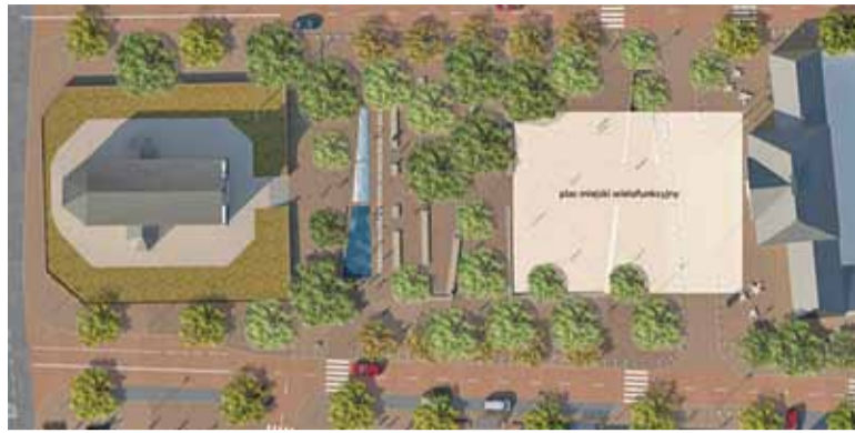
Projekt przebudowy rynku z uwzględnieniem proponowanych zmian