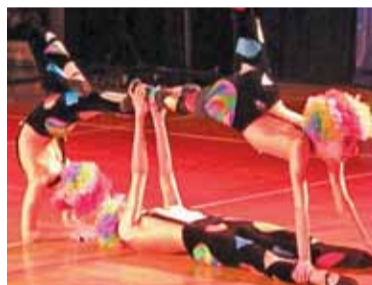
Zawodnicy niejednokrotnie popisali się kreatywnością