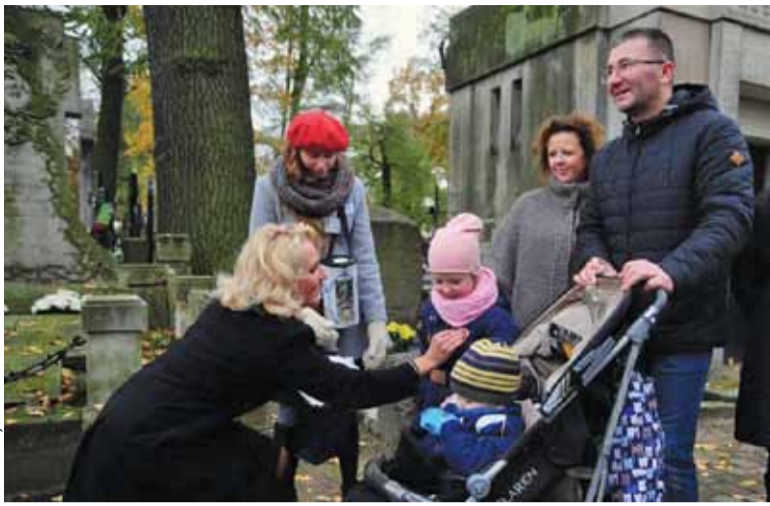
Wolontariusze zbierali datki i rozdawali okolicznościowe naklejki