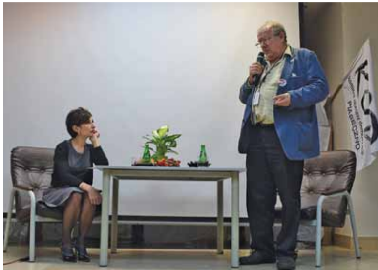
„Nie da się powiedzieć, że Polska jest krajem bez demokracji”