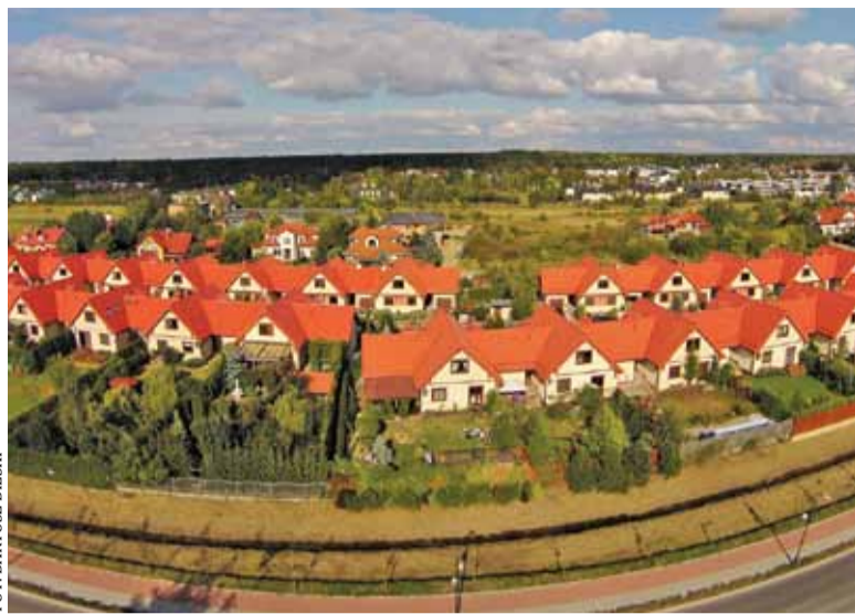
Okolice Rowu Jeziorki z lotu ptaka