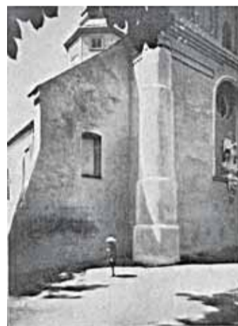
Kościół w Piasecznie w 1914 roku