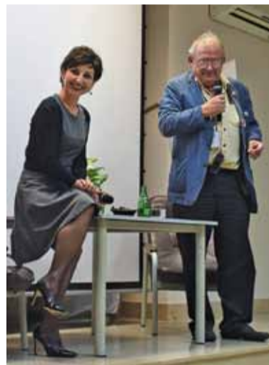
„Instytucje demokratyczne będą dekoracjami”