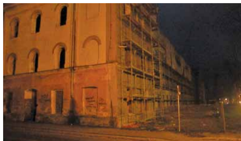
Budynek koszarowy na terenie dawnej jednostki wojskowej