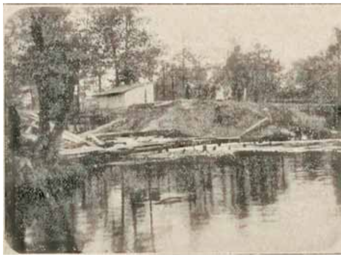
Ruiny mostu przy młynie w Skolimowie

napisz do autorki m.szturowska@przełompiaseczynski.pl