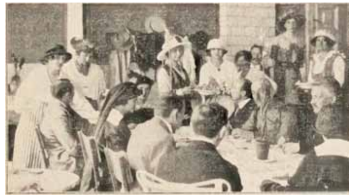
Tania kuchnia dla inteligencji ul. Szpitalna 12

i Żabiańca błędzą wykwintne damy i panowie, najbardziej pożądaną rzeczą jest pikielhauba, ci co mają mniej szczęścia w szukaniu muszą zadowolić się odłamkami granatów i szrapneli. W Dąbrówce dach i komin cegielni uszkodzony, w Mysiadle z folwarku ocalał tylko jeden budynek, most na rzece Jeziorce zniszczony.