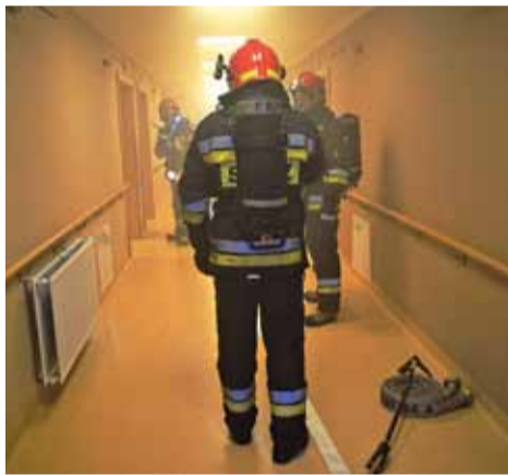
Czad może powstać również w wyniku pożaru

C zemu tlenek węgla jest tak niebezpieczny? Przede wszystkim jest bezwonny i bezbarwny, kiedy więc wypełnia pomieszczenie, w którym przebywamy, nie możemy o tym wiedzieć. Jest silnie trujący, dostaje się do organizmu przez układ oddechowy, a następnie jest wchłaniany do krwiobiegu, w nim natomiast uniemożliwia prawidłowe rozprowadzanie tlenu, co może skutkować uszkodzeniem mózgu oraz innych narządów.