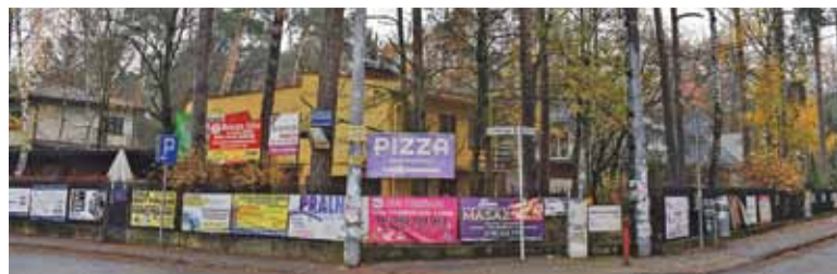
Płot naprzeciwko kościoła w Zalesiu Dolnym

napisz do autorki j.grela@przeleczpiaseczynski.pl