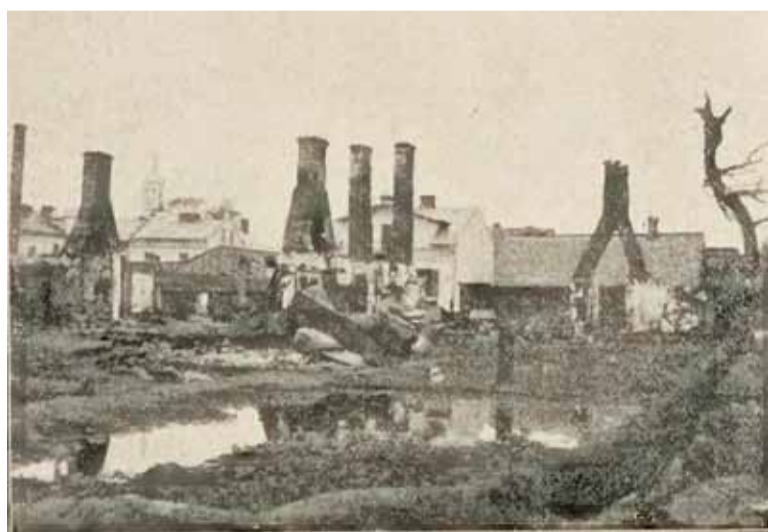
Zniszczone miasto Piaseczno