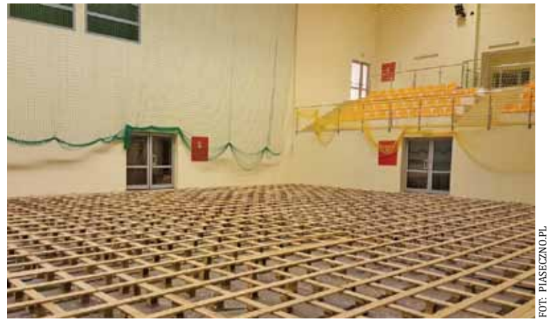
Parkiet już zdjęto.