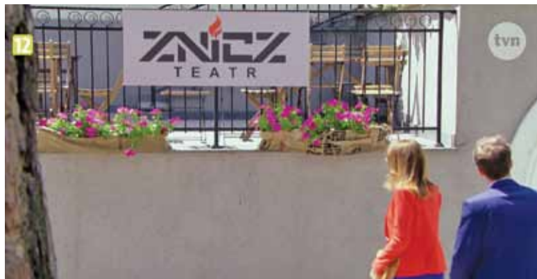
Teatr „Znicz” w willi „Hugonówka”