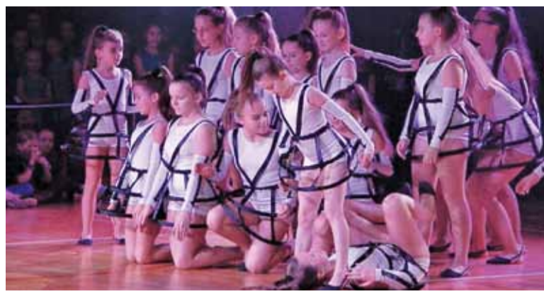
Wymyślne stroje przykuwały uwagę widzów