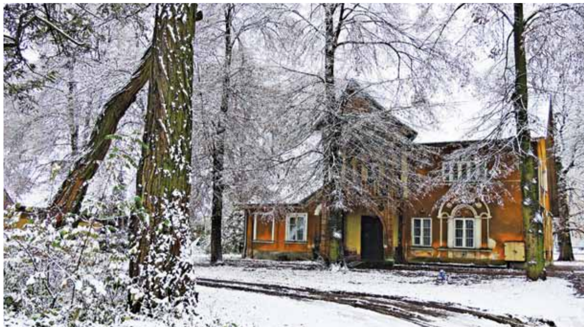
Poniatówka w dniu 11.11.2016 – Narodowe Święto Niepodległości

Wydawało się, że cykl artykułów dotyczących wydarzeń w Piasecznie w październiku 1914 roku zakończy się na dwóch opowiadaniach, gdy zupełnie przypadkowo w „Gazecie Świątecznej” z 1914 roku odnalazłam dwa bardzo ciekawe listy. Dla śledzących uważnie historię miasta bezcenne. Listy swoją treścią dające wzruszające świadectwo czasu.