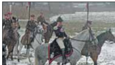
|| Konstancin-Jeziorna - Święto Niepodległości s. 6