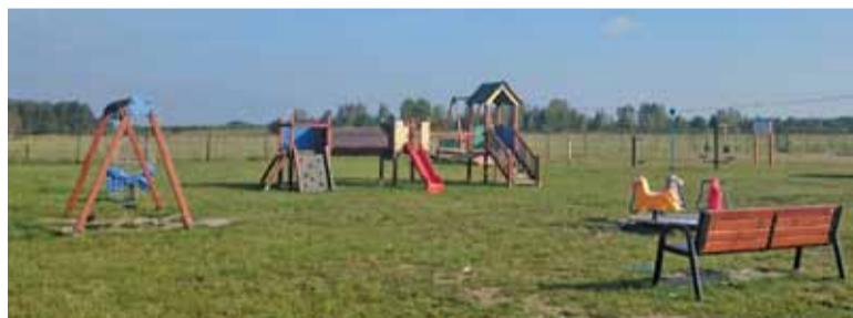
Sołecki plac zabaw

Mamy niewykorzystane fundusze sołeckie, dlatego organizuję spotkanie, by ludzie mogli zdecydować, co chcą z tymi pieniędzmi zrobić. Czasem jednak trudno zmobilizować mieszkańców do uczestnictwa w spotkaniach wiejskich.