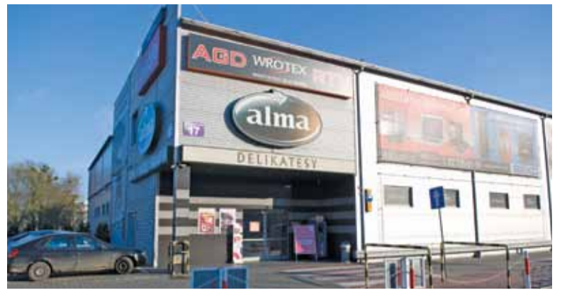
Optymalnym rozwiązaniem będzie stworzenie w tym miejscu marketu