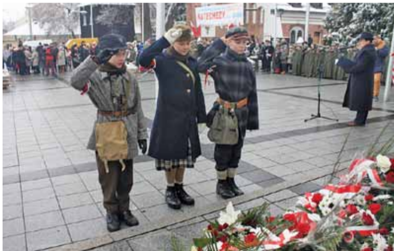
Jedna z delegacji składająca kwiaty pod Ratuszem