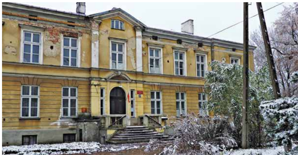
Pałac (szkoła) w Chyliczkach w 11.11.2016 – Narodowe Święto Niepodległości