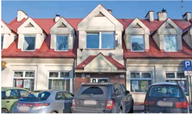
Przesyłkę łatwiej odebrać samemu niż czekać na listonosza