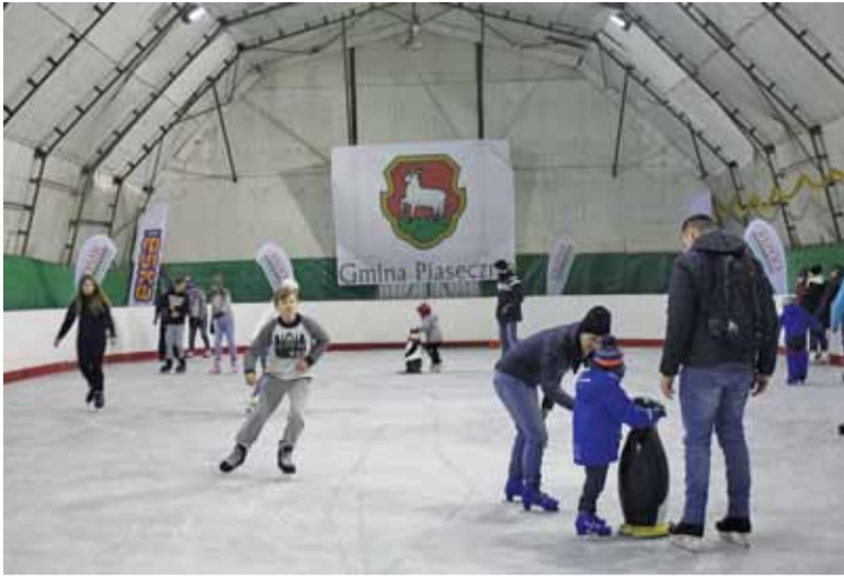
Pierwsi chętni do wypróbowania lodowiska mogli skorzystać z niego za darmo