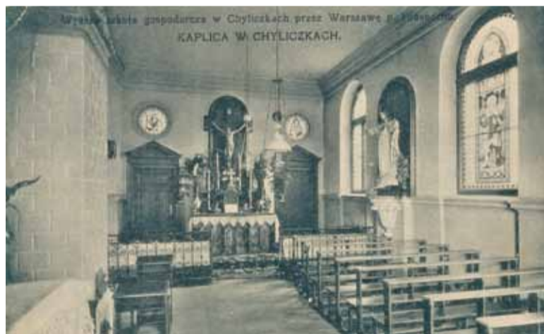
Pocztówka: kaplica w pałacu w Chyliczkach

niej już pyta, czy są tu pokoje, gdzie by można przenoćować, i zapowiada, że za godzinę osiemnaście osób przyjdzie na obiad. Kazał zaraz napalić w piecach, a ponieważ mało już było czasu żeby zrobić obiad mięsny, kazał przygotować jajecznicę i kakao. Gdy przybyła