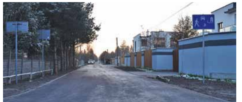
Pieszy może poruszać się swobodnie

J.Z.: Położenie jest niezłe – blisko do Góry Kalwarii, a jedna na uboczu. Mamy niedaleko Pęcław z parkiem linowym i Czersk z zamkiem. Wiele osób korzysta z naszych dróg, jeżdżąc rowerami czy chodząc z kijkami. Może nie mamy zbyt wielu atrakcji, ale widać, że ludziom się tu podoba, skoro ciągle powstają nowe domy i przeprowadzają się tu nowe osoby.