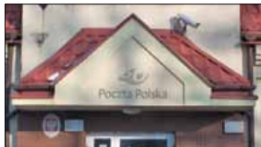
|| Piaseczno - Gołębiew szybciej s. 4