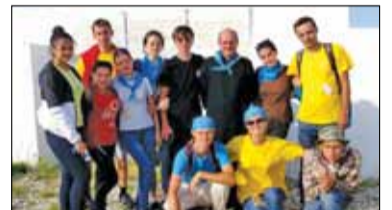
|| Góra Kalwaria - Marianin w Karagandzie s. 11