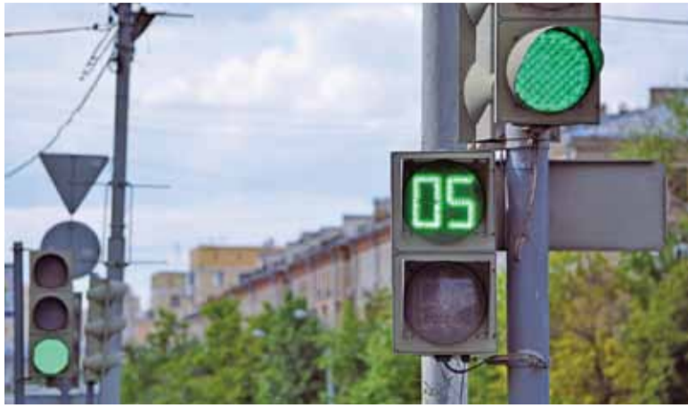
Zegary odmierzające czas do zmiany światła