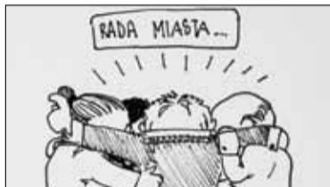
|| Powiat - Co zrobili radni podczas dwóch lat swojej kadencji? s. 5