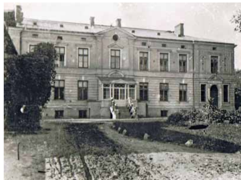
Szkoła w Chyliczkach w roku 1921

cała zapowiedziana kompania i zasiadła do jedzenia, nie mogłam nadażyć ze smażeniem jajecznicy, tak bardzo znać im smakowała. Na wieczór zamówili sobie 10 kur. Ale pani gospodyni nie posłuchała tego rozkazu i kazał zabić tylko pięć kur. Oficera jednak zaciekawi-