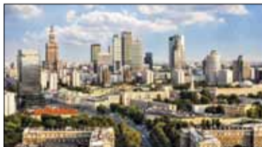
|| Powiat - Warszawa z aglomeracją osobno s. 2

PIASECZNO || GÓRA KALWARIA || KONSTANCIN-JEZIORNA || LESZNOWOLA || PRAŻMÓW || TARCZYN