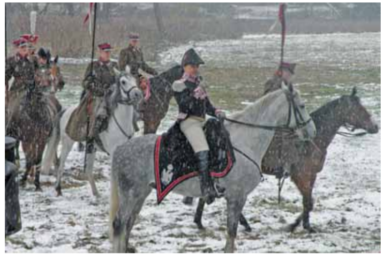
Pokaz kawaleryjski w Parku Ikara