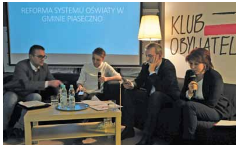
Żaden z debatujących nie jest zwolennikiem reformy

– My Nobla z historii Polski nie przyznajemy. Przyznajemy go z chemii, fizyki, biologii – zauważył. Podkreślił, że w takich gminach jak Piaseczno, które funkcjonuje na obrzeżach dużej aglomeracji i samo się intensywnie rozwija, reforma nie będzie miała aż tak drastycznych skutków. Uderzy bowiem przede wszystkim w małe wiejskie szkoły, które stanowią w Polsce większość, zaprzeczając szansę na rozwój uczących się w nich dzieci.