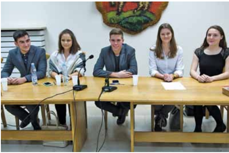
Pełni zapału do pracy i samorozwoju