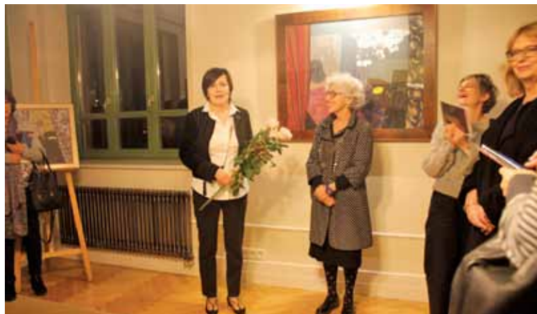
Niedzielny wernisaż w Kolonii Artystycznej