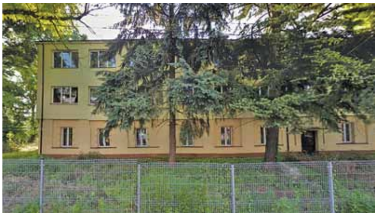
Budynek łączności na terenie dawnej jednostki wojskowej