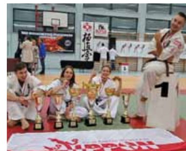
Szczęśliwi zawodnicy klubu Ippon