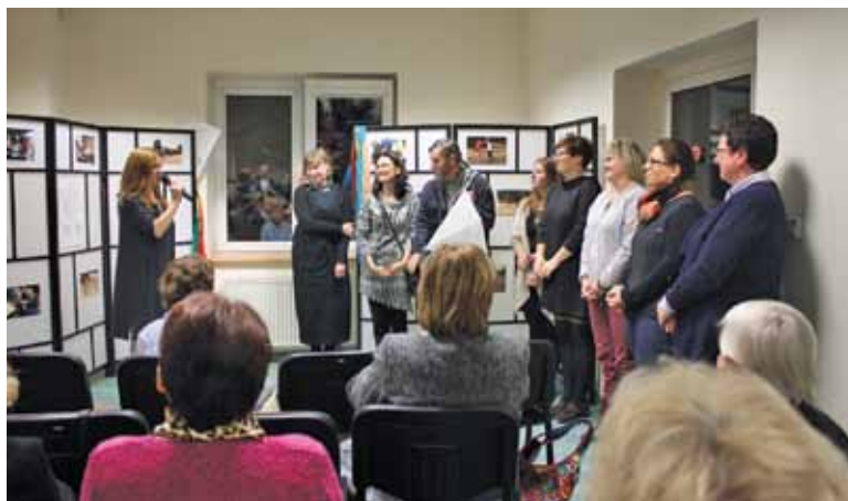
Podsumowanie projektu Dom Kultury+ Inicjatywy lokalne 2016

Po oficjalnym otwarciu nastąpiło podsumowanie projektu Dom Kultury+ Inicjatywy lokalne 2016, który realizowany był od marca do lipca 2016 roku.