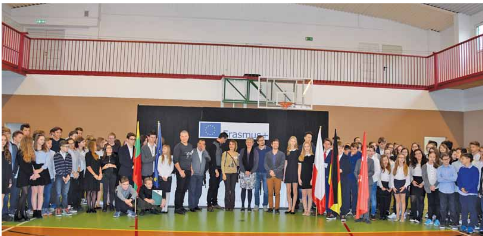
Nauczyciele z Niemiec, Turcji oraz Litwy w Szkole Marzeń