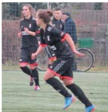
Mecz odbył się na boisku ze sztuczną nawierzchnią