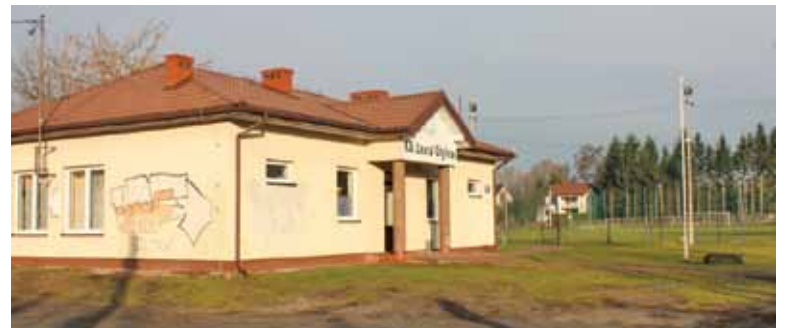
Budynek KS Laura Chyllice

W.M.: To jest dobre pytanie. Powiem szczerze, że chyba położenie sołectwa – jego otoczenie, sąsiedztwo lasu Chojnowskiego, rzeki Jezioroki, ale też terenów rekreacyjnych. Jesteśmy na granicy Piaseczna i Konstancina. Rozwój infrastruktury idzie w dobrym kierunku. Chyllice się zmieniają w tym pozytywnym słowa znaczeniu. Nie jesteśmy już typową wsią i chyba to właśnie przyciąga tu nowych mieszkańców.