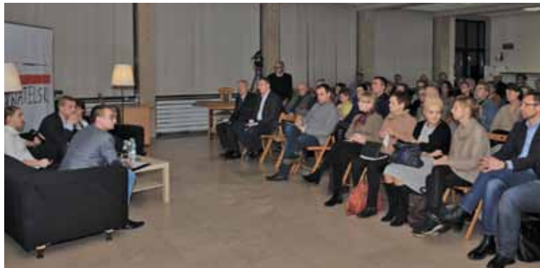
Reforma oświaty budzi ogromne zainteresowanie