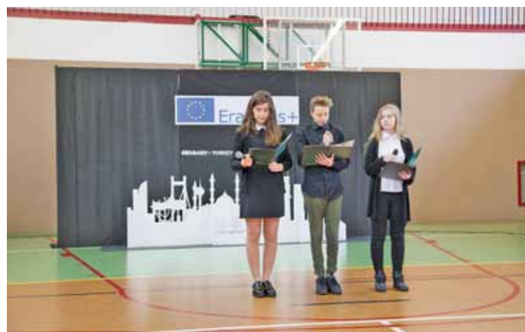
Uczniowie Szkoły Marzeń witają uczestników Erasmus

Uczniowie „Szkola Marzeń” są obcy z językiem angielskim. Oprócz bowiem rozszerzonego programu nauczania języka Szekspira, elementów