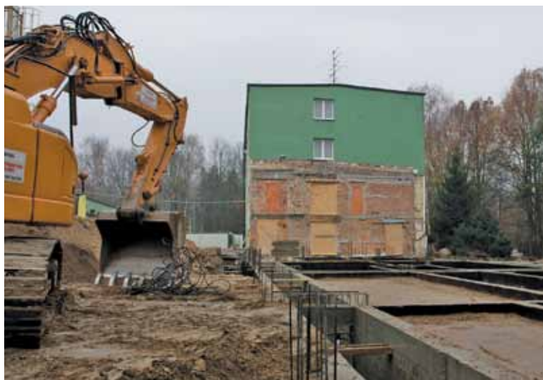
Przyszła wielkość budynku SOSW zapowiada się imponująco