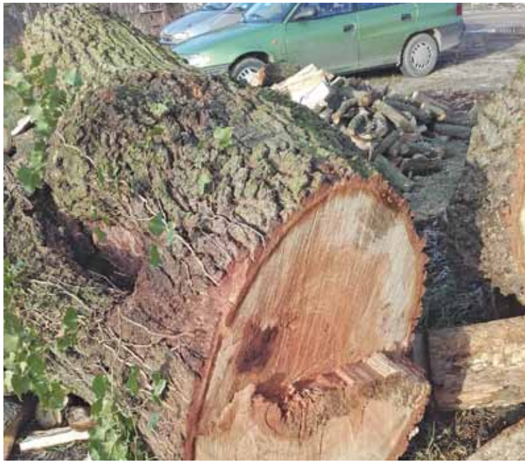
Zdjęcie wyciętego dęba