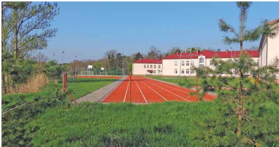
Teren gimnazjum, miejsce gdzie był pagórek, z którego zrobiono zdjęcie

dach landrynkowego gimnazjum przy al. Kalin na rzekę Jeziorką. Dlaczego tam? Otóż w tym miejscu było kiedyś wzgórze, starsi mieszkańcy Piaseczna pamiętają górkę, z której zjeżdżali na sankach. Wzgórze to było w latach 1933-1939 niwelowane. Niektórzy pamiętają nawet betonowe płyty na szczycie, być może położone na potrzebę strzelnicy. Teren był pagórkowaty, postanowiono przed wojną w tym miejscu zrobić teren rekreacyjny, miała tu być strzelnica, korty tenisowe,