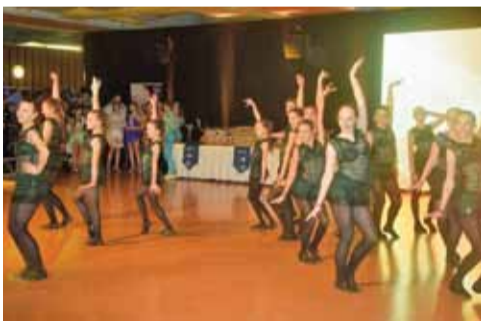
Poziom był niezwykle wysoki