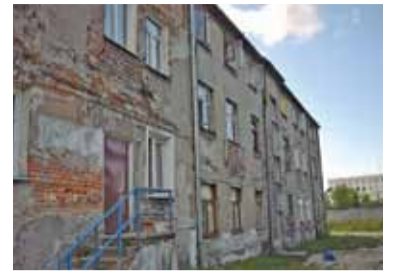
Zdegradowana przestrzeń na Nadarzyńskiej może stać się w przyszłości wizytówką miasta

▮ Modernizacja obiektu „Stara mleczarnia” przy ul. Jana Pawła II oraz ul. Dworcowej wraz z modernizacją targowiska miejskiego. Zadanie zakłada kompleksową rewitalizację zdegradowanego obszaru przemysłowego położonego pomiędzy torami linii radomskiej, ul. Jana Pawła II, Dworcową oraz Nadarzyńską. Obejmuje budowę nowego obiektu szkolnego (...), modernizację targowiska miejskiego (...) oraz wykreowania wielofunkcyjnej ogólnodostępnej przestrzeni do organizacji wydarzeń kulturalnych i sportowych. Projekty będą uzupełnione o nowe połączenia komunikacyjne: budowę ul. Żytniej oraz jej przedłużenie do ul. Nadarzyńskiej, budowę ul. Towarowej zapewniając połączenie z Dworcem PKP i stacją kolejową oraz budowę fragmentu