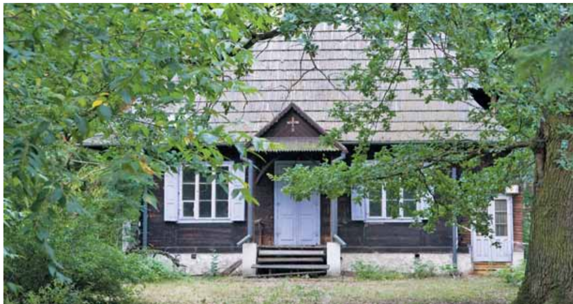
Czy ktoś uratuje zabytek przed zniszczeniem?