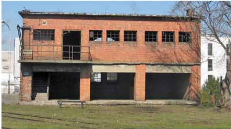
Budynek magazynu na stacji Piaseczno Miasto