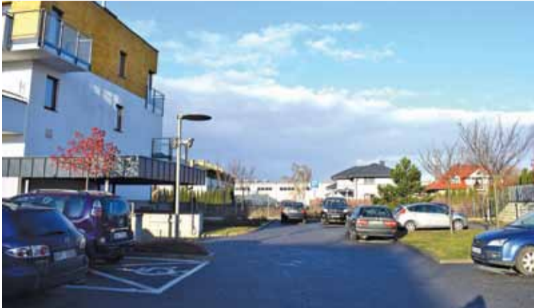
Projektowana droga ma prowadzić do terenów dla zabudowy wielorodzinnej, które jeszcze są terenami przemysłowymi.