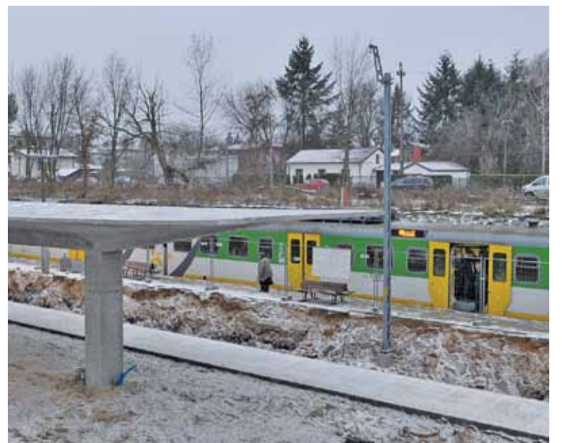
Pierwszy peron niedługo będzie gotowy