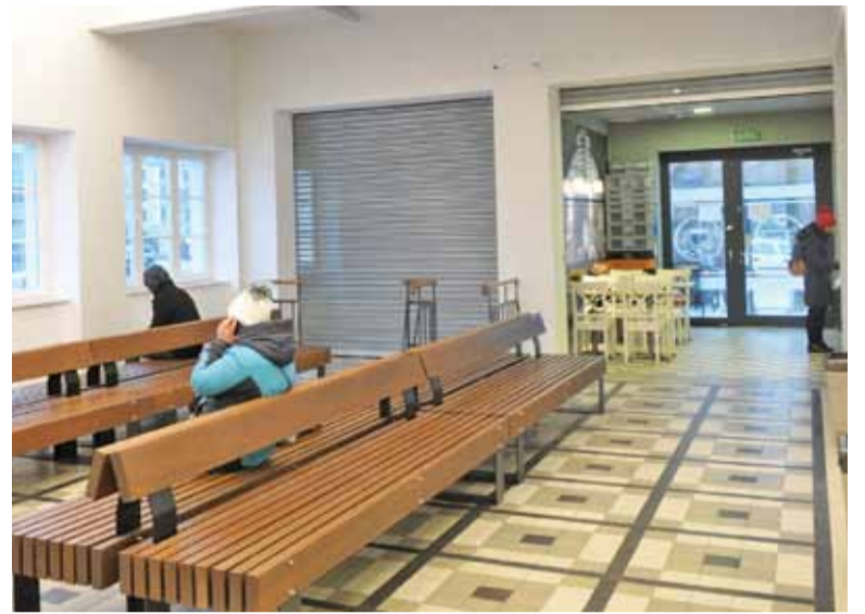
Niektóre lokale na dworcu czekają na otwarcie