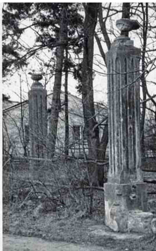
Resztki bramy wjazdowej z ul. Świętojańska 23 (nr przedwojenny)

napisz do autorki m.szturowska@przekladpiaseczynski.pl