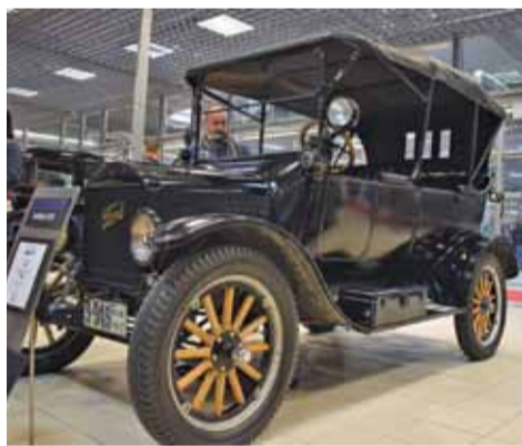
Ford T rocznik 1917 z Muzeum Motoryzacji