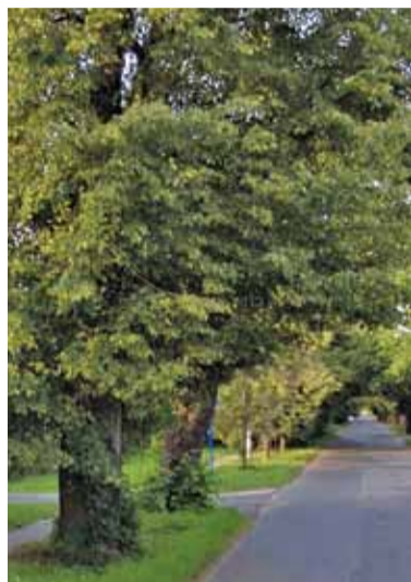
Ulica Lipowa w Konstancinie

nowienie alei lipowej pomnikiem przyrody. Ochroną miałyby zostać objęte łącznie 45 drzew składających się na