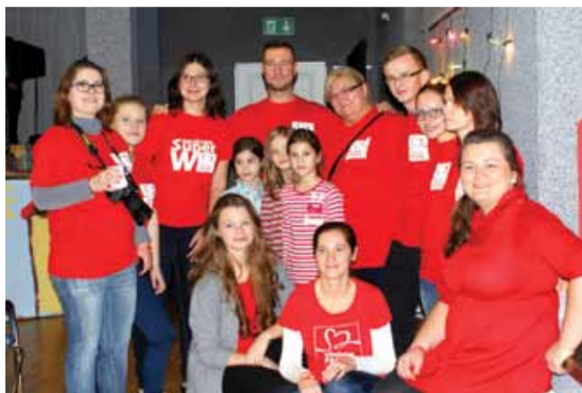
Drużyna SuperW - wolontariusze z Góry Kalwarii

darczyńców. Otwarte serca darczyńców wprowadziły do naszego rejonu nową wartość – jedność i współpracę, otwarcie na los innych ludzi i radość płynącą z pomagania.