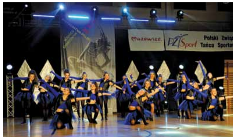
Formacja Dance Show „Hero” grupy GRW High Class 1 (dziewczyny obroniły tytuł Mistrzów Polski)

mistrzostwach zdobyli oni aż 38 medali! Składa się na nie 19 tytułów mistrzów Polski, 11 srebrnych medali oraz 8 tytułów drugich v-ce mistrzów. Ponadto tancerze piaseczyńskiego klubu wielokrotnie dochodzili do ścisłych finałów.