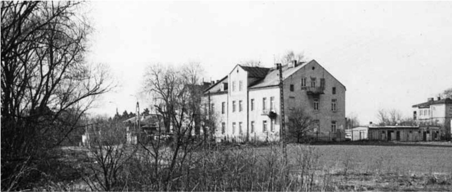
Ul. Zdjęcie zrobione z ul. Świętojańskiej