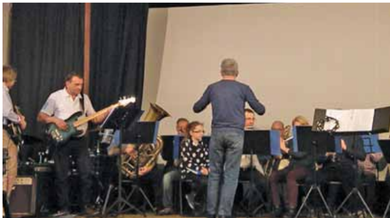
Muzycy z pasją w Kinie Uciecha