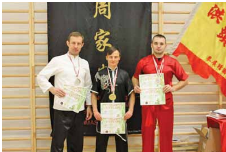
Bardzo dobry występ „Złotych Lwów” na międzynarodowym pucharze