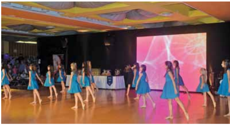
Mistrzostwa Świata odbyły się w czeskim Libercu