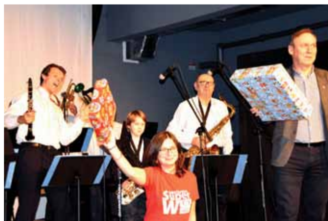
Koncert w Ośrodku Kultury

Docieramy do prawdziwej biedy – tej ukrytej, a nie tej, która krzyczy i żąda pomocy. Naszym celem jest mądra pomoc, czyli taka, która daje szansę na prawdziwą zmianę. Do Paczki trafiają te rodziny, dla których kontakt z wolontariuszem oraz wsparcie materialne będą impulsem do takiej zmiany. Szlachetna Paczka działa na terenie kraju już 16 lat, a w Górze Kalwarii 3 lata. Przy pomocy wolontariuszy udało się połączyć 73 rodziny w potrzebie z taką samą ilością