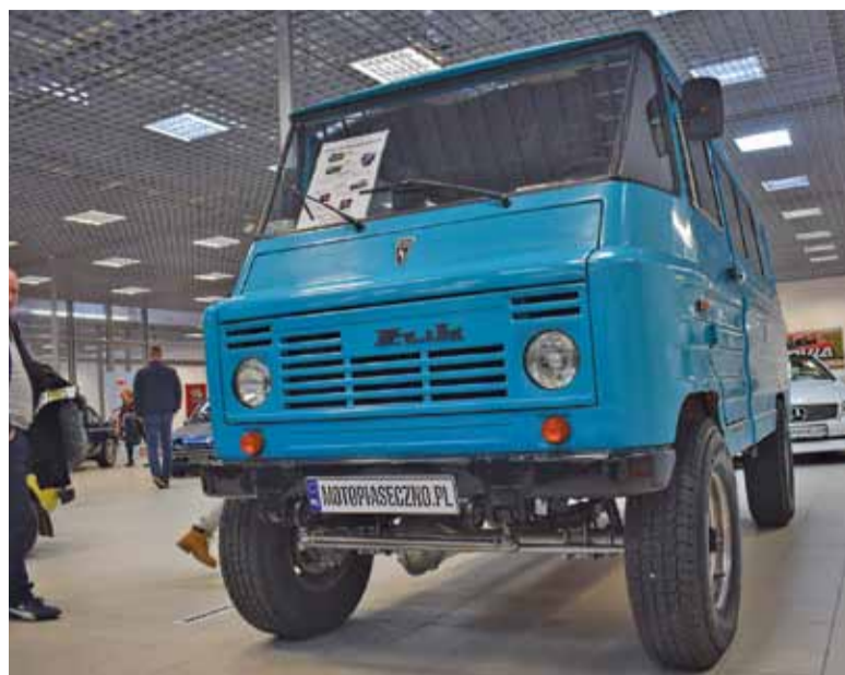
Odrestaurowany Żuk z Piaseczna

Rezultatem pracy leśników jest nowe pokolenie lasu – wielogatunkowego i różnowiekowego, który tworzą piękne dęby i buki w otoczeniu wysokich sosen i modrzewi.