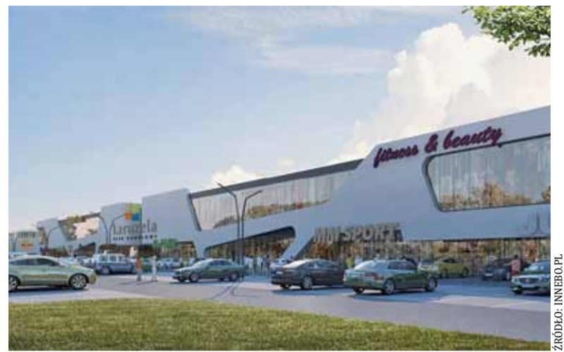
Karuzela ma wystartować pod koniec roku