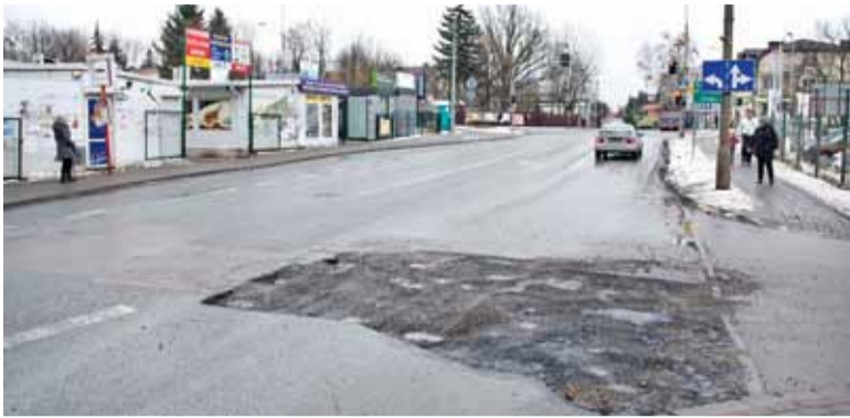
Przerwa w asfalcie zajmuje cały pas ruchu przy ul. Jana Pawła II