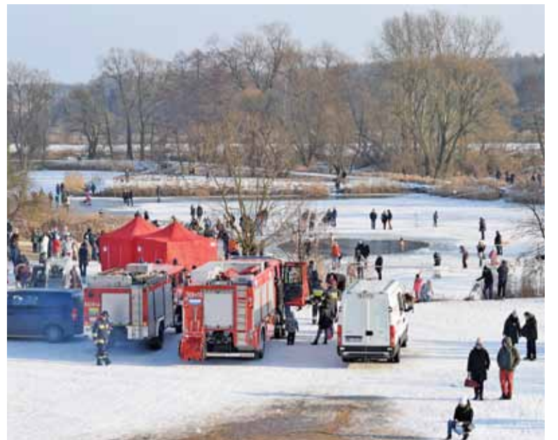
Na pikniku obecna była Straż Pożarna