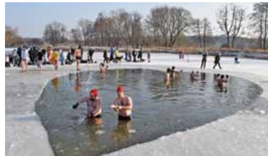
Piaseczyńskie morsy dzień przed piknikiem, wycięły w stawie przerębel w kształcie serca