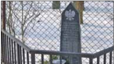
|| Lesznowola - Uniewinnieni s. 4

PIASECZNO || GÓRA KALWARIA || KONSTANCIN-JEZIORNA || LESZNOWOLA || PRAŻMÓW || TARCZYN