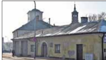
|| Piaseczno - Remiza oczami studentów s. 5