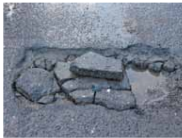
Najnowsza myśl techniczna – zabezpieczenie dziury w ul. Sikorskiego

Uszkodzenie opony gwarantowane, o czym przekonałam się osobiście kilka miesięcy temu (sic!), kiedy ubytek był jeszcze dużo mniejszy i trudny do zauważenia po zmroku. Na tym nie koniec, bo na środku pasa również pojawiła się asfaltowa „dolina”. A kawałek dalej, na skrzyżowaniu ul. Jana Pawła II z ul. Kniaziewiczza mamy do czynienia z „nawierzchnią tymczasową” – pozostałością po jakimś drobnym remoncie, prawdopodobnie związanym z uszkodzeniem którejś podziemnej instalacji.