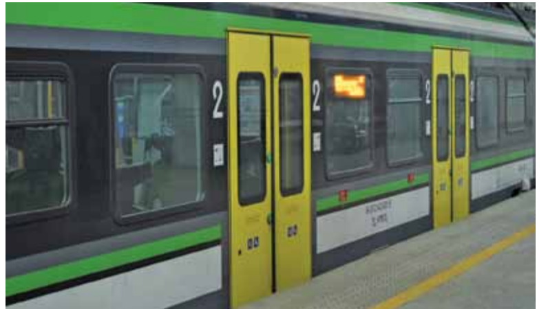
Park taborowy Kolei Mazowieckich powiększy się o kolejne nowoczesne składy