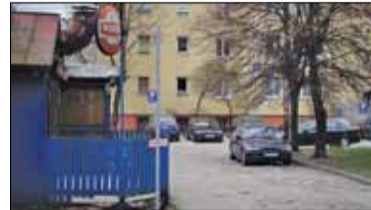
|| Góra Kalwaria - Boks przy Wyszyńskiego s. 8