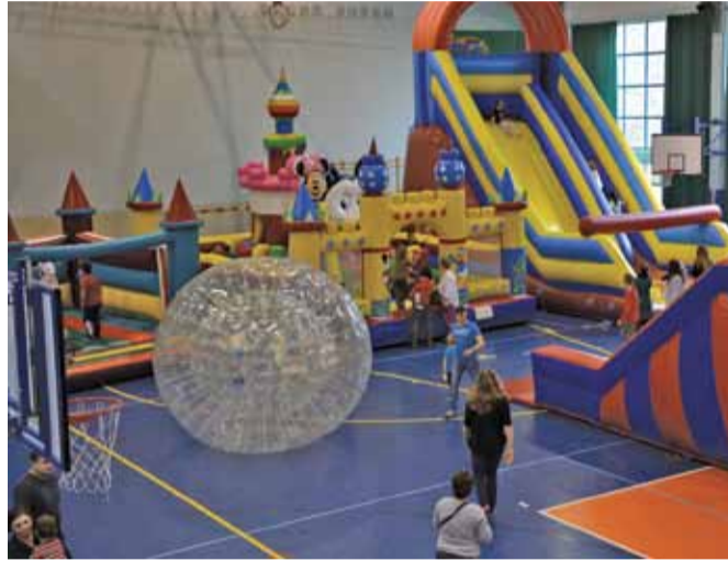
Na wielkich kolorowych dmuchawcach będzie można szaleć również w tym roku

Aktywne ferie zimowe dla młodych mieszkańców gminy Lesznowola proponuje Centrum Sportu w Gminie Lesznowola. Dzieci i młodzież będą mogły bezpłatnie skorzysta z lodowiska w Lesznowoli oraz z cieszących się ogromną popularnością w zeszłym roku „dmuchańców” rozstawionych na gminnych halach sportowych. W tym roku olbrzymie dmuchane zamki pojawią się w trzech lokalizacjach: w obiektach sportowych ZSP Mroków w terminie od 13 do 15 lutego, od 16 do 18 lutego w Centrum Edukacji i Sportu w Mysiadle, a w drugim tygodniu ferii (od 23 do 25 lutego) na hali sportowej w Zespole Szkół Publicznych w Łazach. Wstęp otwarty dla wszystkich, mniejsze dzieci muszą przyjść z opiekunem.