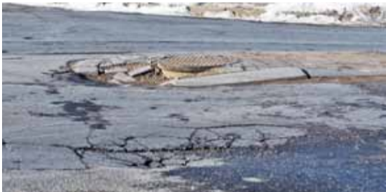
Z kostki otaczającej studzienkę u wylotu ul. Jarząbka niewiele już zostało

dziury są tak poważne, że zagrażają bezpieczeństwu lub powstały bez związku z aurą. Takie właśnie „niespodzianki” kierowcy mogą spotkać między innymi na ulicach: Jana Pawła II i Jarząbka w Piasecznie. Jeszcze w ubiegłym tygodniu straszyla kolejna dziura przy ul. Sikorskiego w okolicach „Orlika”. Ta akurat mogła powstać jako skutek uboczny zimy. Ktoś postanowił zabezpieczyć to miejsce kawałkami płyt, zmuszając tym samym kierowców do sporej gimnastyki mającej na celu ominięcie dziury, bowiem wysokość tego „zabezpieczenia” wydaje się zbyt niebezpieczna dla zawieszenia większości samochodów. Kolejna dziura to już właściwie dwie dziury – na skrzyżowaniu ul. Jarząbka z ul. Jana Pawła II.