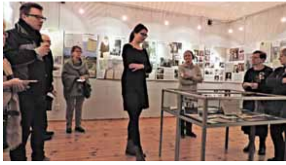
Wystawa „Maria Dąbrowska z wizytą w Piasecznie”