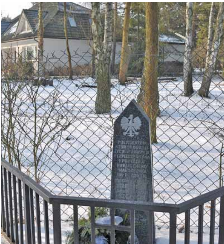
W miejscu tragedii w Magdalence stoi pomnik upamiętniający poległych policjantów