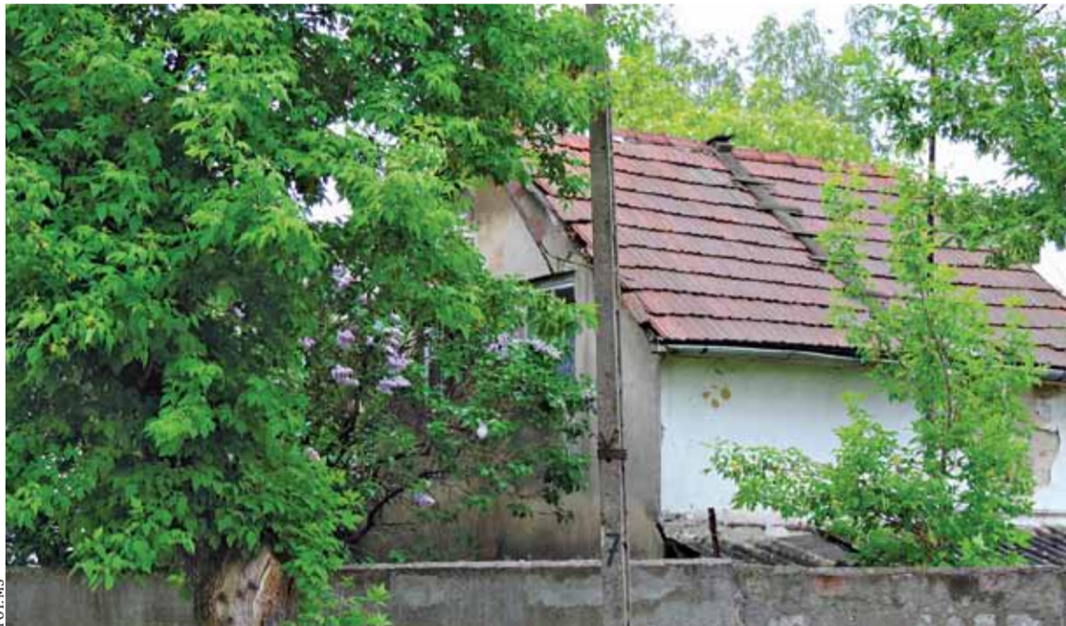
Widok ogrodów „Reytany” od ul. 17 Stycznia, stara stróżówka