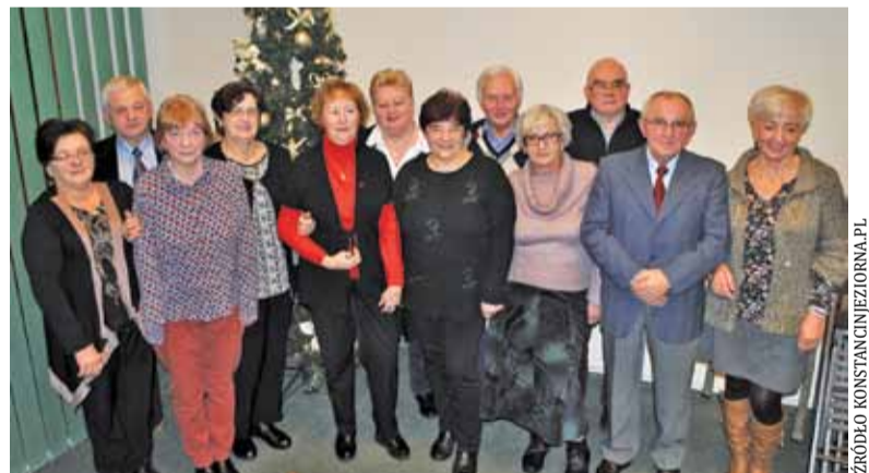
Członkowie I kadencji Rady Seniorów Gminy Konstancin-Jeziorna