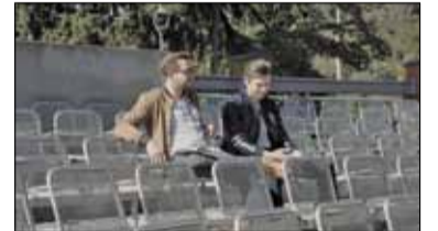
|| Konstancin-Jeziorna - „Rozmowa” w parku s. 8