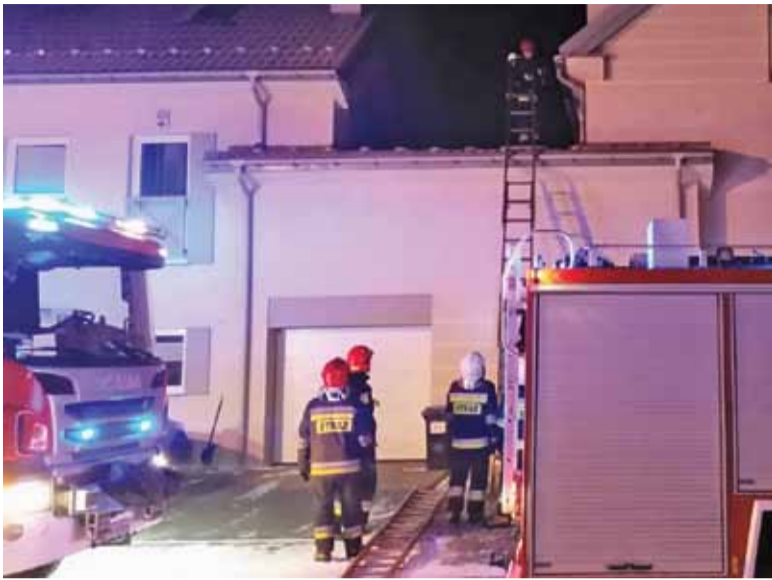
Interwencja Straży Pożarnej w Zgorzale