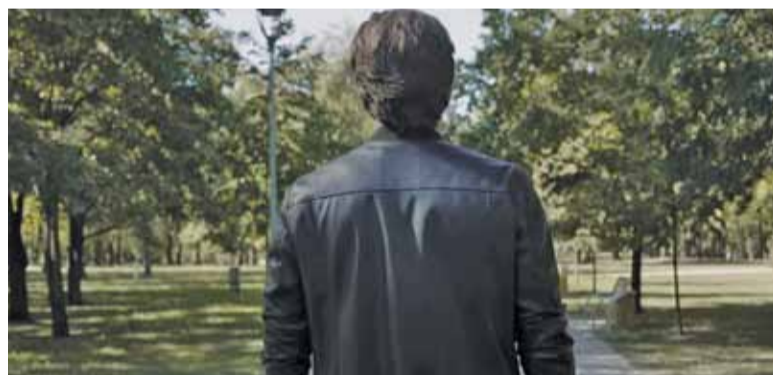
Park Zdrojowy w Konstancinie na teledysku do utworu „Rozmowa”