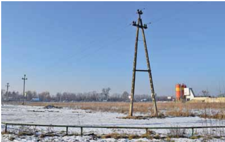
Teren po dawnym KPGO w Mysiadle