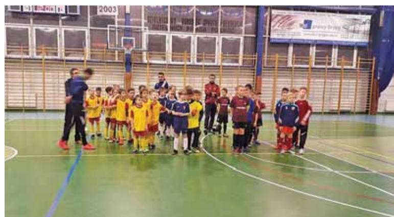
Turniej „Błyskawica CUP” rocznika 2008