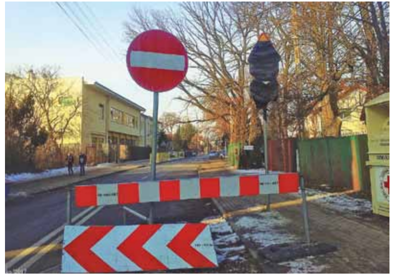
Wygląda na to, że Świętojańska pozostanie jednokierunkowa do wiosny