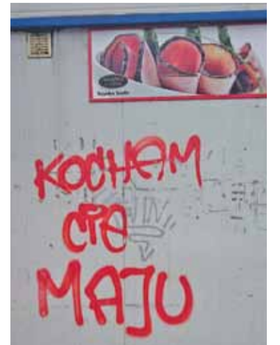
Grffiti z wyznaniem

W ubiegłym roku z okazji walentynki prezentowaliśmy w gazecie m.in. graffiti z wyznaniem miłosnym umieszczone na budynku na ul. Jarzabka. I choć napis zdążył do tego czasu zniknąć, znaleźliśmy jego kopię na bazarku w Piasecznie.