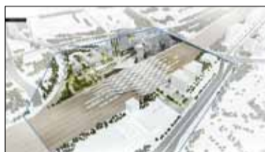
|| Nowa Zachodnia w 2021 r. s. 2