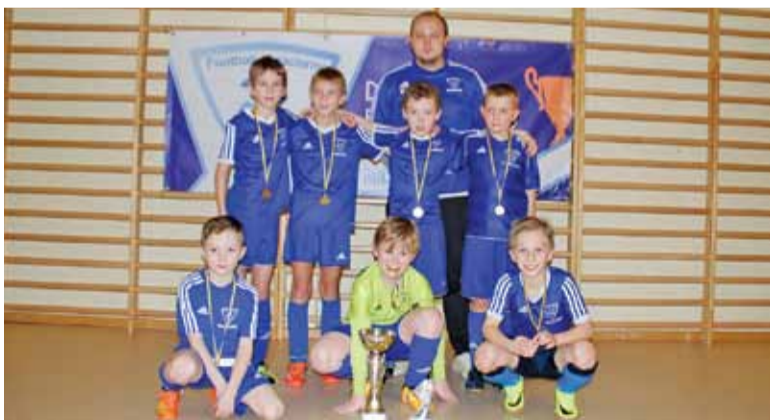
Młodzi piłkarze z trenerem