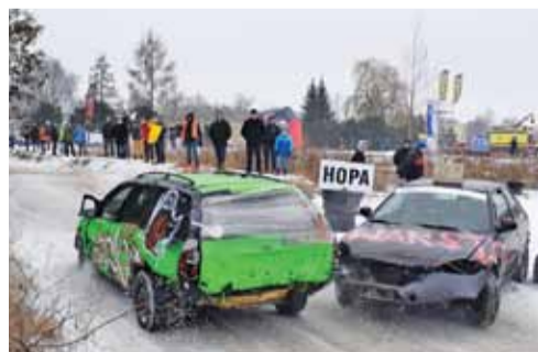
Ford Mondeo, który jechał 4 edycję

Zapięłam kask, pasy, pomyślałam, że nigdy nikt nie zginął i że będzie super. Przed startem kierowca pociągnął jednak