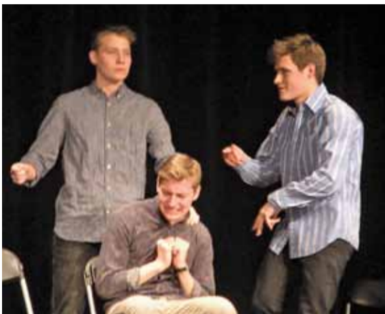
W tym przedstawieniu to widownia pełniła funkcję reżysera

Teatr improwizowany kolejny raz dostarczył konstancińskim widzom wiele rozrywki.