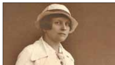
|| Maria i Emilia, czyli opowieść o pewnym sporze - część 2 s. 7