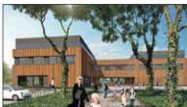
|| Szkoła za 50 milionów s. 2

PIASECZNO || GÓRA KALWARIA || KONSTANCIN-JEZIORNA || LESZNOWOLA || PRAŻMÓW || TARCZYN