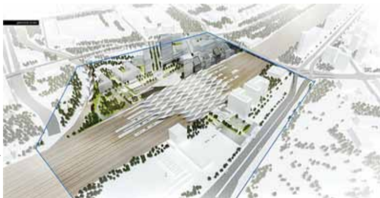
W lewym górnym rogu wizualizacji stacji znajduje się peron 8, z którego po przebudowie Zachodniej będą korzystać pasażerowie z Piaseczna