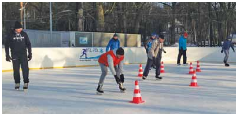
Konstancińscy nauczyciele doskonalili swoje umiejętności