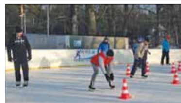
|| Nauczyciele na łyżwach s. 8