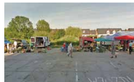
Obecne targowisko przy ulicy Mariańskiej

A co z terenem, na którym obecnie znajduje się targowisko? Na jego części dalej powinien być prowadzony handel. O szczegółach zapewne dowiemy się w najbliższym czasie. RL