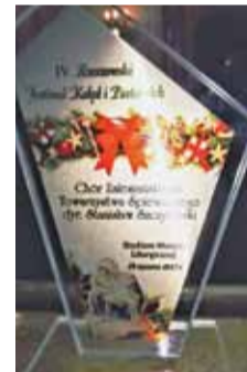
ZRÓBIO: FACEBOOK ZALESIAŃSKIEGO TOWARZYSTWA ŚPIEWACZEGO

Chór Zalesiańskiego Towarzystwa Śpiewaczego został doceniony przez jury podczas IV Rzeszowskiego Festiwalu Kolęd i Pastoralek. Festiwal odbył się 28 stycznia. Wystąpiło podczas niego 30 chórów. Występ chóru z Zalesia Górnego został oceniony bardzo wysoko. Jury przyznało Zalesiańskiemu Towarzystwu Śpiewaczemu złoty dyplom. Chór uplasował się na trzecim miejscu w ogólnym rankingu, zdobywając 95 punktów na 100. Gratulujemy i życzymy kolejnych sukcesów!