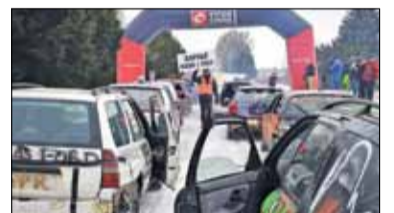
|| Walentynkowy Wrak Race s. 10