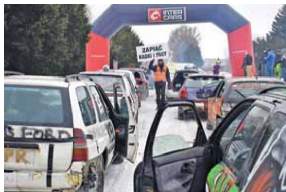
Przygotowania do startu

za moje pasy, czy na pewno są dobrze naciągnięte. Wtedy pomyślałam, że jestem jednak matką trójki dzieci, ale ciekawość zwyciężyła z rozsądkiem.