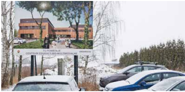
Został tylko krok do rozpoczęcia budowy – podpisanie umowy z wykonawcą

Po tym jak radni zdecydowali się „dorzucić” brakujące 14 milionów złotych, by trwający 8 miesięcy przetarg miał szansę zakończyć się sukcesem, urzędnicy sprawdzili prawidłowość wszystkich dokumentów złożonych przez oferenta, który zaproponował najniższą stawkę. Pozytywna weryfikacja pozwoliła na ogłoszenie wyniku przetargu – wybór padł na lokalnego przedsiębiorcę – firmę POLAQA Sp. z o.o. z Wólki Kozodawskiej, który zaofiarował wybudowanie Centrum Edukacyjno-Multimedialnego za kwotę 49,7 mln złotych. Cały czas wszystkie zainteresowane tematem budowy nowej