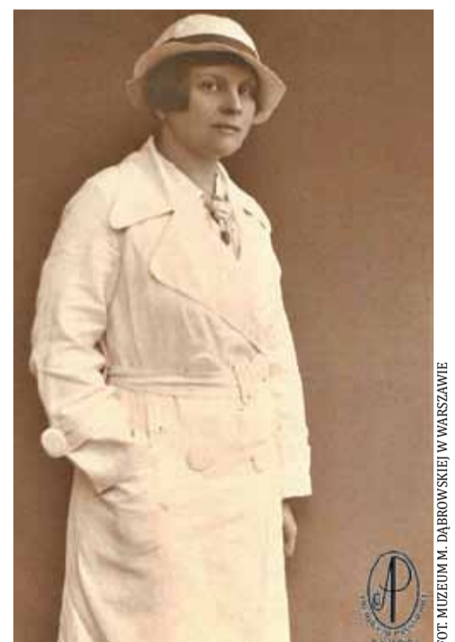
Pisarka Maria Dąbrowska w 1927 roku

się namiętności, które w końcu zostaną uwiecznione w „Nocach i dniach”, a pierwsza ich część „Bogumił i Barbara” spowodują rozstanie i konflikt dwóch kobiet. (cdn.)