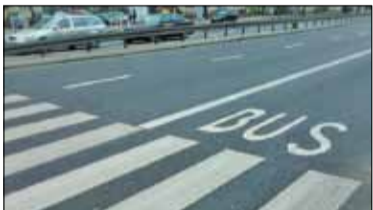
|| Konstancin-Jeziorna - Buspas do Warszawy s. 2

PIASECZNO || GÓRA KALWARIA || KONSTANCIN-JEZIORNA || LESZNOWOLA || PRAŻMÓW || TARCZYN