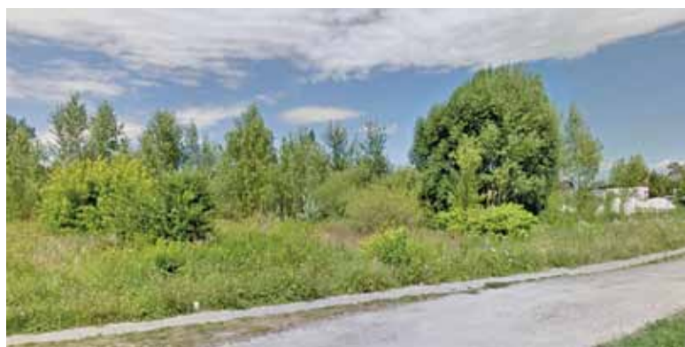
Czy przy ulicy Kościelnej w Baniosze stanie przedszkole?