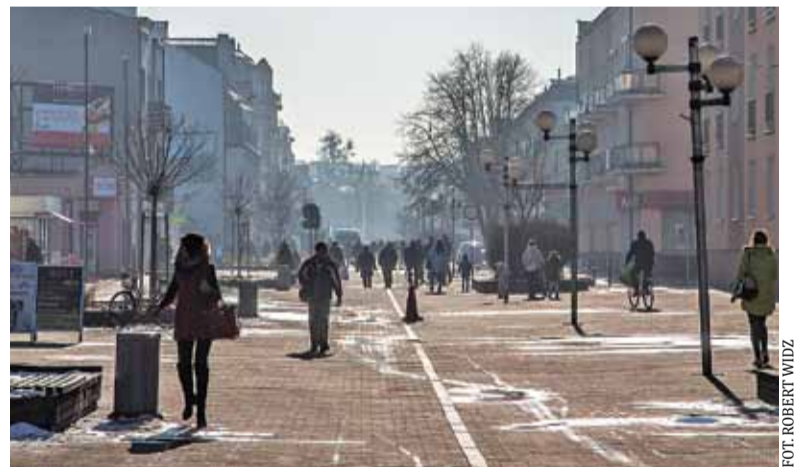
Ulica 11 Listopada w Grodzisku, zamieniona w latach 90. na deptak