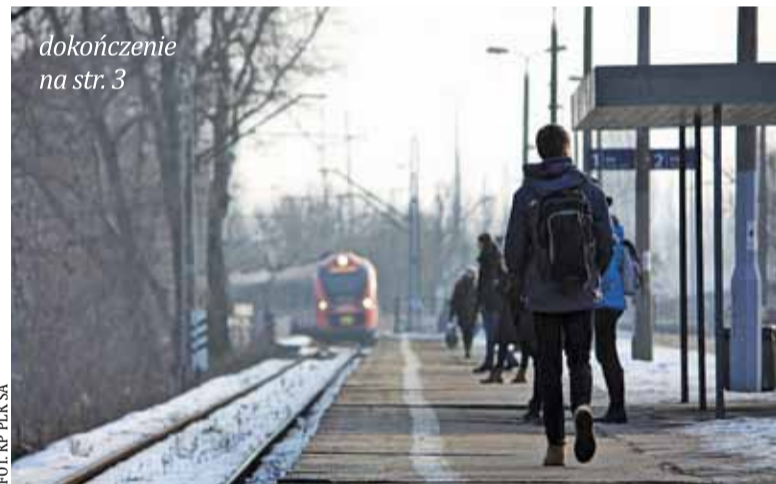
dokończenie na str. 3

Linia obwodowa w Warszawie zostanie w ciągu roku przebudowana