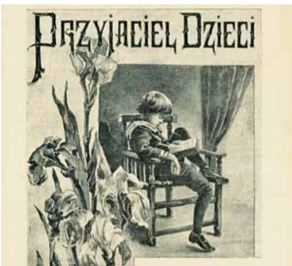
Okładka tygodnika dla dzieci z 3 marca 1900 roku