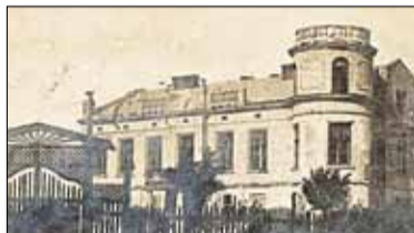
|| Historia - Belle Epoque s. 7