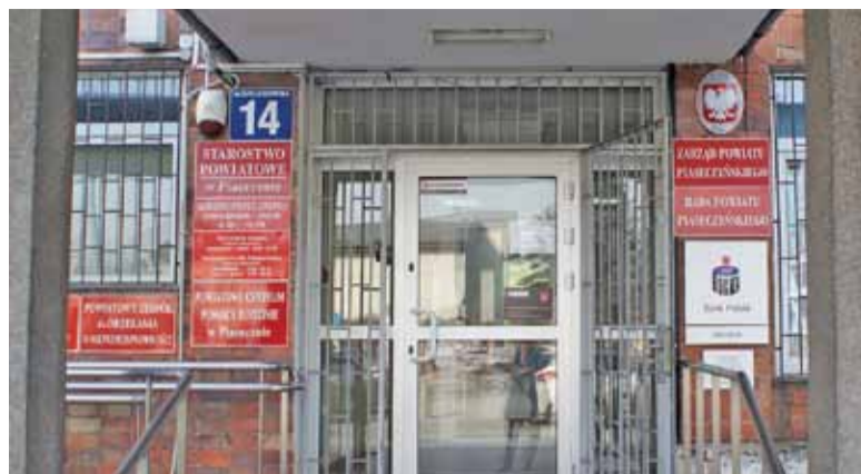
Nasz powiat prawie najbogatszy