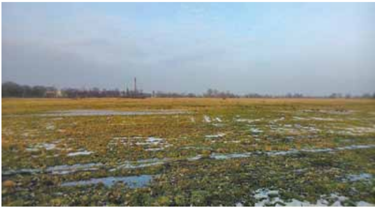
Roboty geologiczne wykonano na obszarze Łąk Oborskich