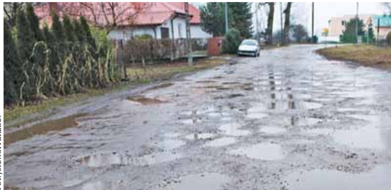
„Bajeczna” nawierzchnia czeka na zmiany