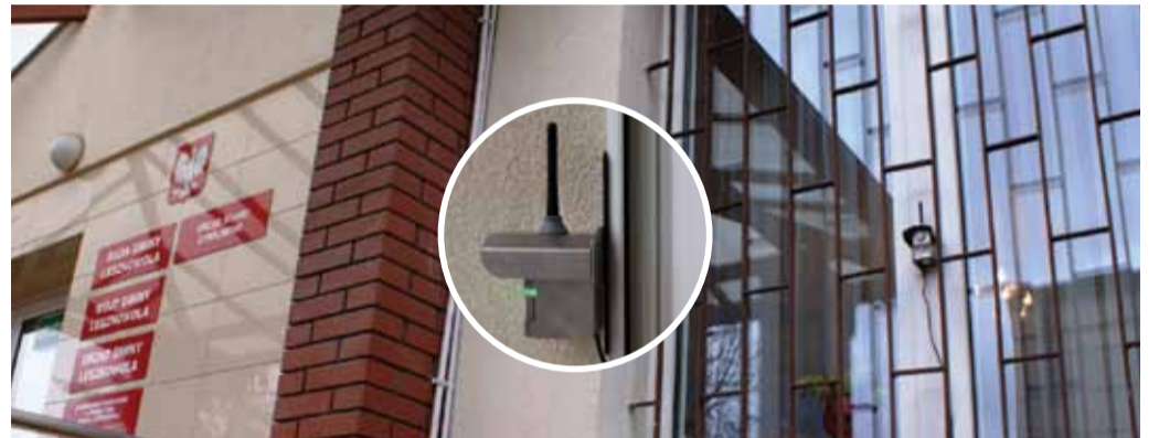
Jeden z dziesięciu sensorów

Według corocznych raportów Europejskiej Agencji Środowiska (EEA) Polacy oddychają powietrzem bardzo złej jakości. Wojewódzki Inspektorat Ochrony Środowiska w Warszawie jest odpowiedzialny za badanie i ocenę jakości powietrza na terenie Mazowsza. Najbliżej położone Lesznówoli stacje pomiarowe, należące do systemu monitoringu jakości powietrza w Województwie Mazowieckim, znajdują się w znacznej odległości od Gminy (Warszawa – Ursynów, Konstancin – Jeziorna, Otwock, Piastów).