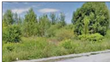
|| Góra-Kalwaria - Przedszkole po raz drugi s. 5