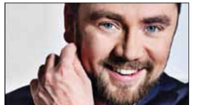
|| Konkurs - Zgaduj i wygrywaj s. 10