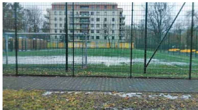
Orliki cieszą się ogromną popularnością