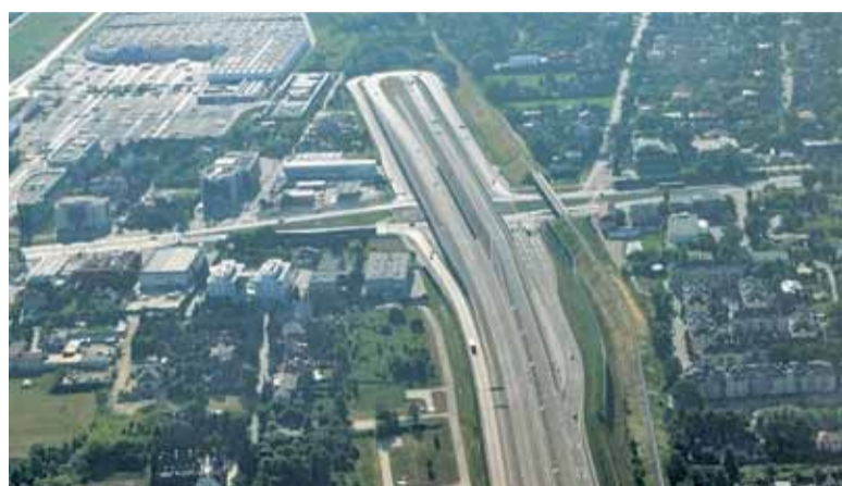
Obecny wygląd węzła Puławska

Pod koniec grudnia ubiegłego roku Wojewoda Mazowiecki wydał pierwszą decyzję zezwalającą na rozpoczęcie robót w rejonie przyszłej POW. Pozwole-