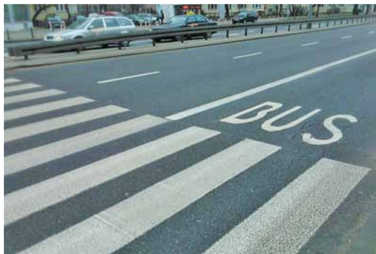
Czy buspas połączy Konstancin z Warszawą?

– Pan Burmistrz dąży do tego, by po zbudowaniu i oddaniu do eksploatacji nowej ulicy Nowokabackiej, łączącej warszawskie dzielnice Wilanów i Ursynów, przebudowie uległ też system komunikacji publicznej łączącej nasze miasto i Warszawę. Utworzona byłaby nowa linia autobusowa między osied-