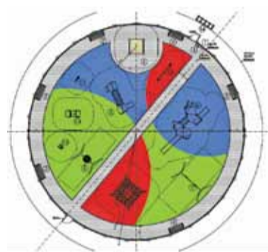
Projekt nowego placu zabaw przy ul. Jaworskiego

Pod koniec stycznia gmina ogłosiła przetarg nieograniczony na przebudowę i remont placu zabaw przy ulicy Jaworskiego w Mirkowie. Władze gminy pragną, by na otoczonym budynkami mieszkalnymi okrągłym placu zabaw dzieci mogły jeszcze weseleje spędzać czas.