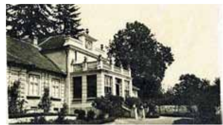
Pałac w Gołkowie, siedziba rodziny Bauerfeindów 1900