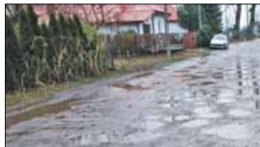
|| Bobrowiec - Po suchych latach s. 9