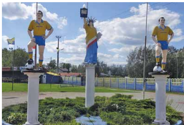
W gminie Góra Kalwaria największą dotację otrzyma Nadstal Krzaki Czaplinkowskie

Znacznie większe kwoty dofinansowań przyznawane są w gminie Piaseczno. Zdecydowanym liderem pod tym względem jest miejscowy MKS Piaseczno, który na rozwój i szkolenie w zakresie piłki nożnej łącznie dostał 440 tysięcy złotych (170 na seniorów i 270 na młodzież), czyli o 70 tysięcy więcej niż rok temu. Z przekraczających 100 tysięcy dotacji cieszyć się mogą również inne kluby piłkarskie takie jak: Jedność Żabieniec (120 tysięcy), Victoria Głoków (110 tysięcy), Sparta Jazgarzew (100 tysięcy, o 30 mniej niż rok temu) i KS GOSiRki Piaseczno (łącznie 210 tysięcy na seniorki i młodzież). MUKS Julianów i FCB Akademia Bobrowiec otrzymają tylko po 20 tysięcy złotych.