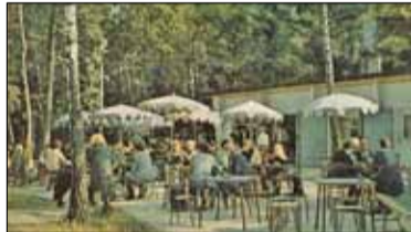
|| Zalesie Górne - Ośrodek Wisła wydzierżawiony s. 6