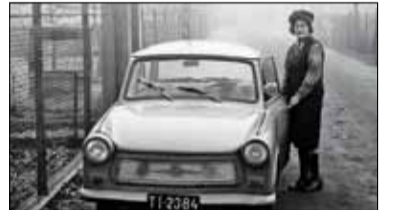
|| Historia - Piaseczno w latach mrocznych tajemnic s. 9