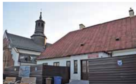
W plebanii dalej będzie mieścić się Muzeum

Plebania została wydzierżawiona miastu na 25 lat. W umowie z parafią zapisane jest, że przeznaczenie budynku pozostanie to samo. Dzisiaj mieści się tutaj Muzeum Regionalne i tak ma pozostać. Muzeum, któremu zdecydowanie brakuje dzisiaj miejsca, po przebudowie budynku będzie miało do dyspozycji 400 m kw. powierzchni. Niestety przebudowa będzie gruntowna, czego z uwagi na stan budynku nie udało się uniknąć. Plebania w zasadzie zosta-