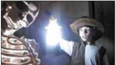
|| KONKURS!!! Wspaniałe nagrody, graj i wygrywaj s. 5

PIASECZNO || GÓRA KALWARIA || KONSTANCIN-JEZIORNA || LESZNOWOLA || PRAŻMÓW || TARCZYN