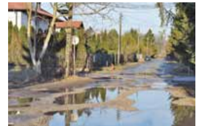
Ulica zdecydowanie wymaga remontu

Chociaż te trzy dzielnice Piaseczna, które łączy ulica, powstały w międzywojennej parcelacji i nie mogą narzekać na sieć dróg, to jednak ich jakość