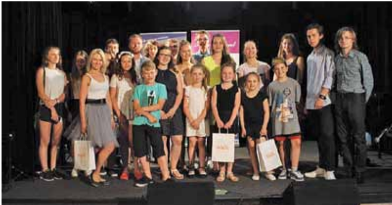
Ubiegłorocznymi finaliści konkursu