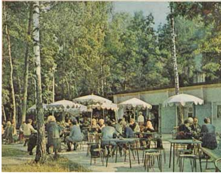
Czy restauracja „na górcę” znów będzie tętnić życiem?

– W pierwszej kolejności, zaraz po podpisaniu z powiatem umowy dzierżawy, weźmiemy się za basen, bo w obec-