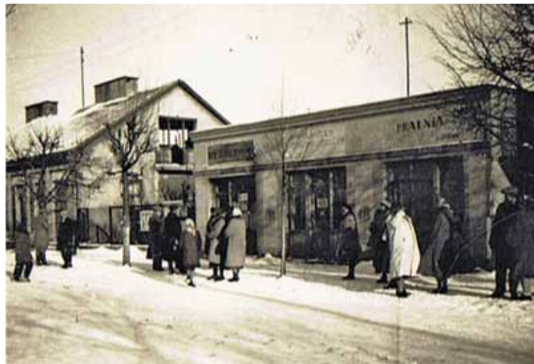
Piaseczno ul. Tadeusza Kościuszki, pierwszy budynek od lewej to UB i MO

niała inna sfera życia, której symbolem były Urzędy Bezpieczeństwa, budynki tajemnicze, w których rezydowali panowie z UB i NKWD. I tak naprawdę dopiero po 1989 roku powoli ujawniano prawdę o tym, co się w nich działo.