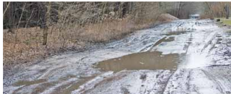
Gigantyczne kałuże i koleiny to rzeczywistość mieszkańców Al. Kasztanów

Rzeczywiście obie równoległe drogi, zwłaszcza teraz po opadach deszczu i roztopach, są nieprzejezdne dla przeciętnego samochodu osobowego. Koleiny i dziury są tak głębokie, że, jak donosi nasz czytelnik z ulicy Cisowej, droga stała się trudna do pokonania nawet dla ciężarówek, w związku z czym w niektórych miejscach wysypały nieco