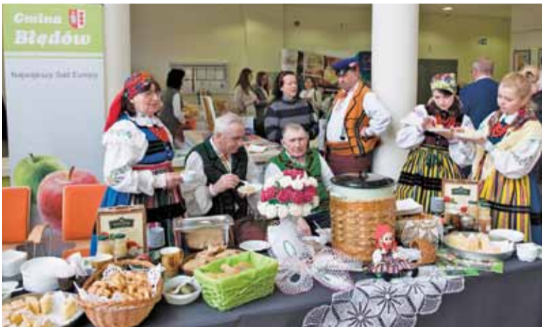
Stoły uginają się od lokalnych smakołyków