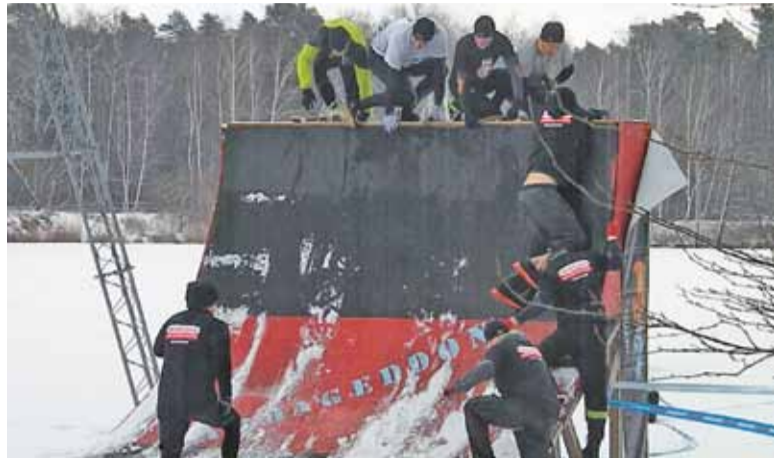
Jak zwykle wiele trudności dostarczyła rampa