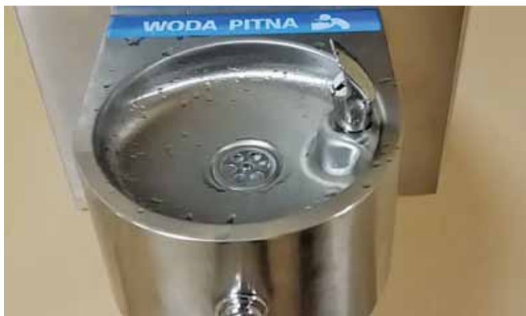
Poidelko z wodą pitną w Zespole Szkół Nr 2 w Konstancinie-Jeziornie

prawa (między innymi Rozporządzenie Ministra w sprawie jakości wody przeznaczonej do spożycia przez ludzi z dnia 13 listopada 2015 roku), a także normy Unii Europejskiej. W każdej z gmin prowadzone są badania próbek wody, po czym powiatowy inspektor sanitarny stwierdza jej przydatność do spożycia. Woda kranowa posiada bardzo wiele