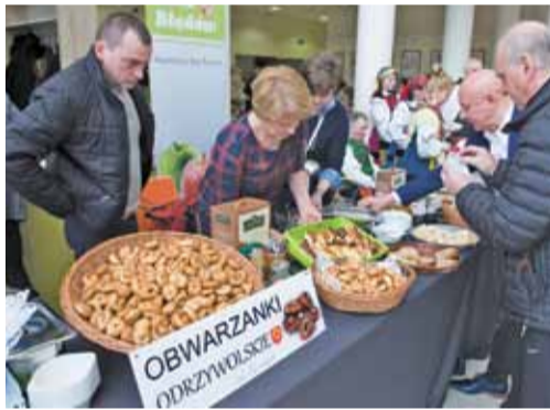
Każdy znalazł coś dla siebie