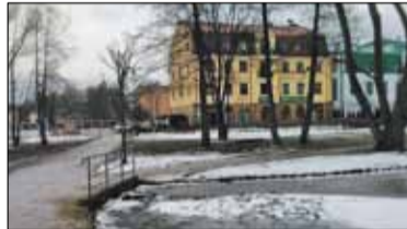
|| Konstancin-Jeziorna - Boisko przy oczku s. 5