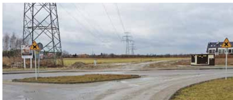
To nie rondo, to skrzyżowanie dróg równorzędnych

W rejonie ulicy Kukułki powstało w ostatnich latach wiele osiedli mieszkalnych, zastępując istniejące w tym miejscu pola uprawne. Pomimo zwartej zabudowy mieszkalnej, z punktu widzenia administracyjnego występują w tym miejscu aż trzy sołectwa: Zgorzała, Nowa Wola i Nowa Iwiczna. Cały czas powstają tu kolejne osiedla, a wraz z nimi kolejne drogi. Obecnie na granicy tych trzech miejscowości zbiega się sześć ulic: Kukułki (tzw. Nowa Zgorzała), Frezji (Nowa Wola), Przepiórki (Zgorzała), Kielecka (Nowa Wola), aleja Zgody (Nowa Iwiczna), Jaskółki (Zgorzała). Historycznie główną drogą była ul. Kielecka (zaczynająca się jeszcze przy ul. Słonecznej), która „przekształca się” następnie w ulicę Kukułki, do