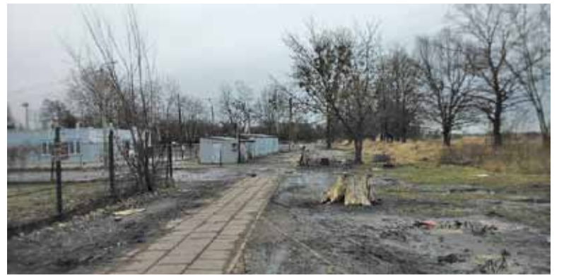
Obecny plac handlowy znajduje się naprzeciwko Starej Papierni