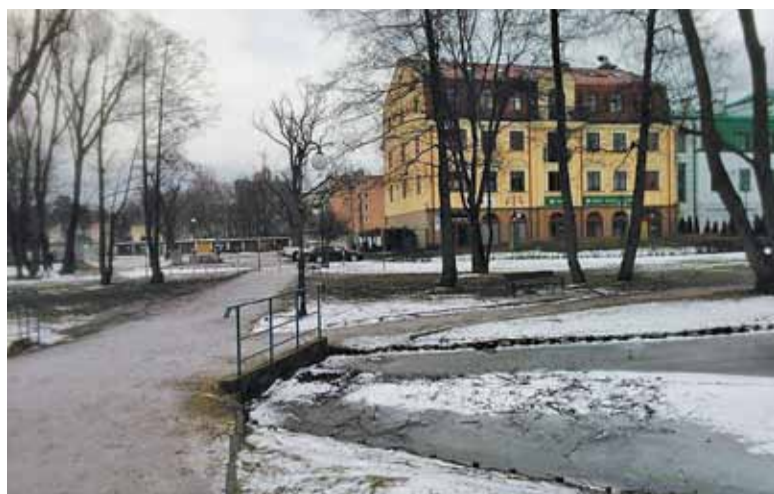
W piłkę będzie można pograć na terenie po lewej stronie od oczka