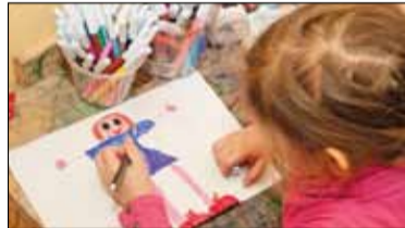
|| Piaseczno - Oszukani rodzice s. 8