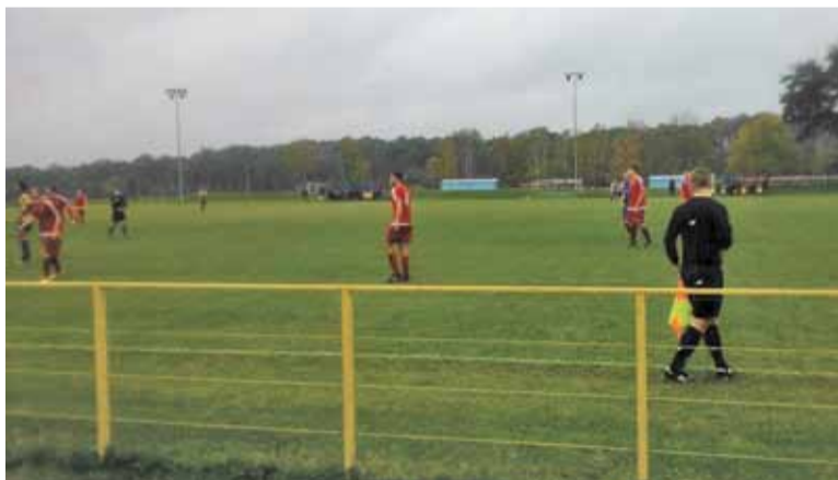
Od soboty piłkarscy fani wracają na trybuny lokalnych stadionów