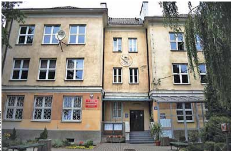
Prace rozpoczną się od termomodernizacji starego budynku szkoły