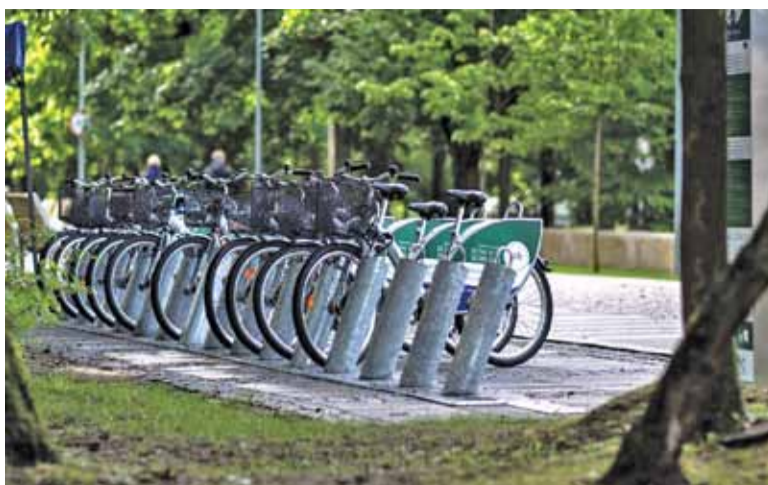
Konstanciński Rower Miejski

Konieczne jest także, aby przedyskutować z mieszkańcami lokalizację stacji oraz ich liczbę. Pierwszym punk-