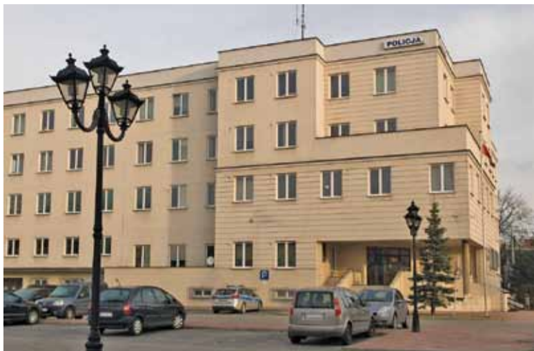
Policja potrzebuje wsparcia mieszkańców