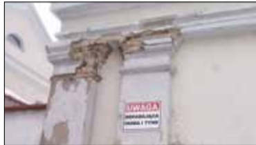
|| Góra-Kalwaria - Wyremontują mury kościoła s. 7