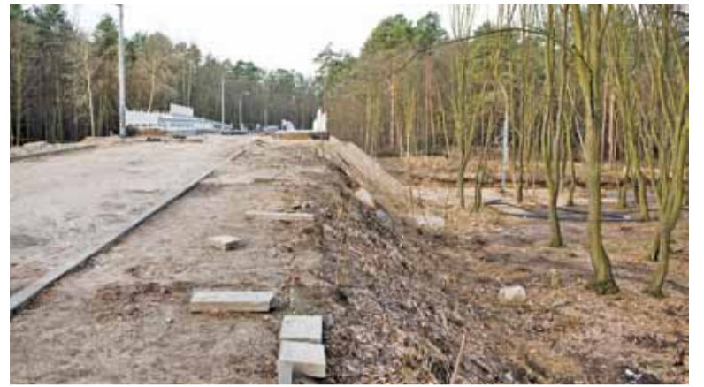
Trzeba jeszcze poszerzyć nasyp i uzupełnić nawierzchnię drogi

Jak dowiedzieliśmy się przed miesiącem od przedstawiciela firmy „Trakcja” S.A., aby wiadukt został oddany do użytku, firma musi jeszcze poszerzyć nasyp nowego wiaduktu o 2-3 metry,