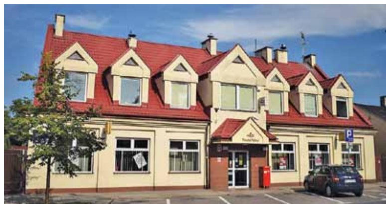
Przed pocztą pusto jest tylko poza godzinami pracy