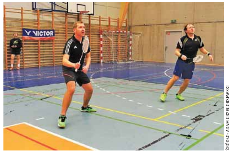
Zawody odbywają się w hali GOSiR w Konstancinie

W innych spotkaniach IV Ligi MKS Piaseczno zremisował 1:1 z Błonianką Błonie (bramka: Igor Korczakowski), a Sparta Jazgarzew uległa Mazurowi Karczew 0:1. Tekst i zdjęcie RL