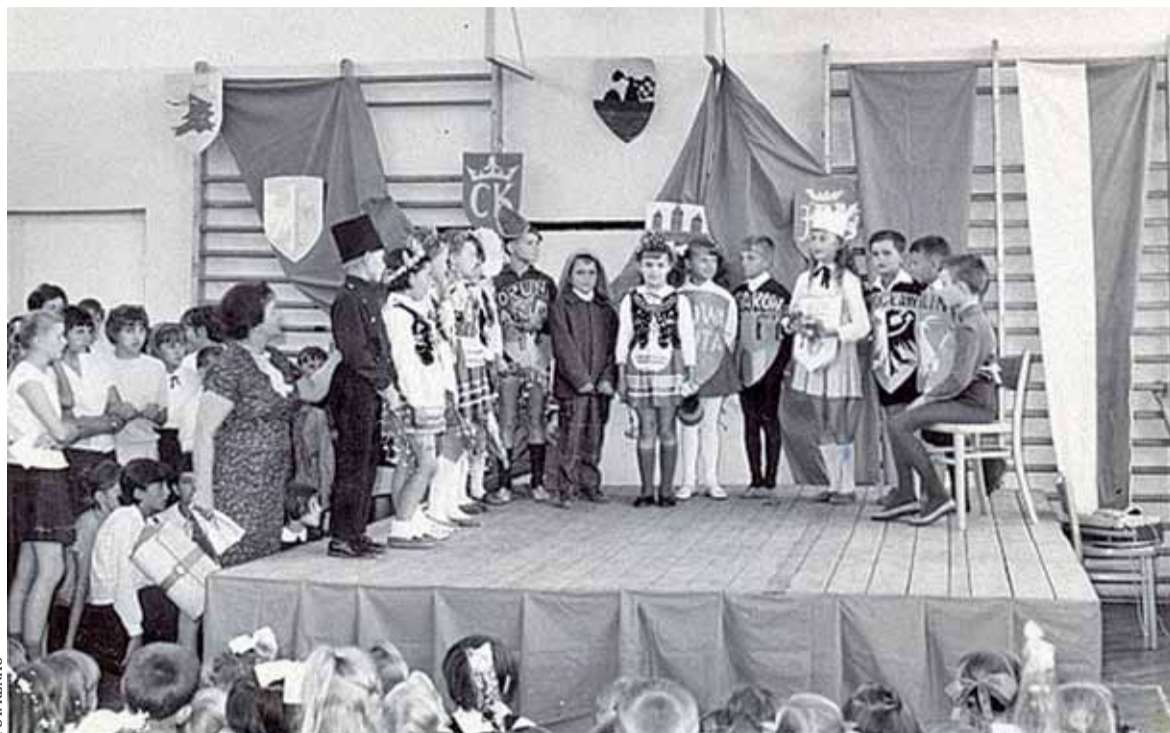
Akademia w szkole nr 5 w Piasecznie rok szkolny 1967/68. Pierwsza od lewej autorka wspomnień

D zień 8 marca 1968 roku godz. 17.00 z minutami – przyjazd pociągu podmiejskiego na stację PKP Piaseczno. Z pociągu wychodzi tłum pasażerów i przemieszcza się w stronę centrum ulicą Sienkiewicza, sądząc po ilości idących osób można wysnuć wniosek, że większość mieszkańców miasta pracuje w zakładach umieszczonych na trasie pociągu. Panie niosą bukiety kwiatów, panowie w nastrojach, nazwijmy je, „świętecznych”.