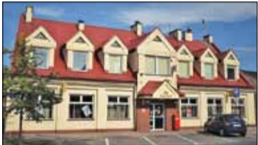
|| Piaseczno - Blokada poczty s. 4

PIASECZNO || GÓRA KALWARIA || KONSTANCIN-JEZIORNA || LESZNOWOLA || PRAŻMÓW || TARCZYN