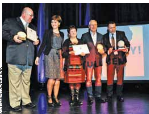
Zdobywcy nagród z gminy Lesznowola