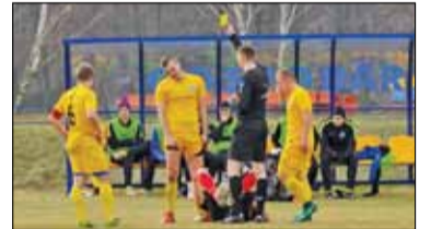
|| Sport - Ciężko o powody do optymizmu s. 13