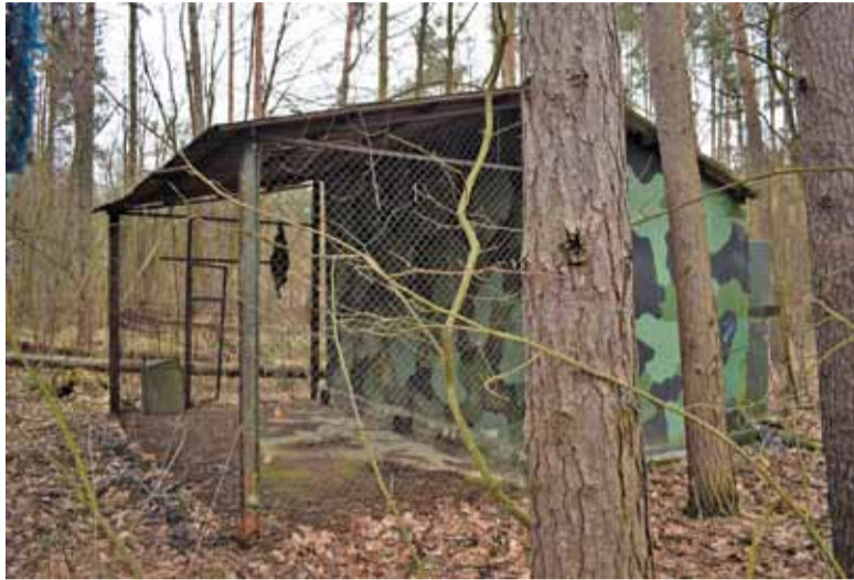
Opuszczona jednostka wojskowa w Tomicach