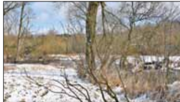
|| Henryków-Uroczę - O jeden most za dużo s. 5