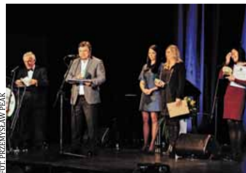
Zdobywcy Perły z gminy Konstancin-Jeziorna

Tegoroczna, druga edycja konkursu cieszyła się ogromnym zainteresowaniem zarówno podczas etapu zgłoszeń, jak i głosowania. Drugi etap, którego finałem była uroczysta Gala, rozpoczął się 23 listopada. Od tego dnia mieszkańcy mogli głosować na nominowane firmy, wydarzenia i sportowców. Głosowanie zakończyło się 12 lutego. Łącznie oddano aż 21 996 głosów!