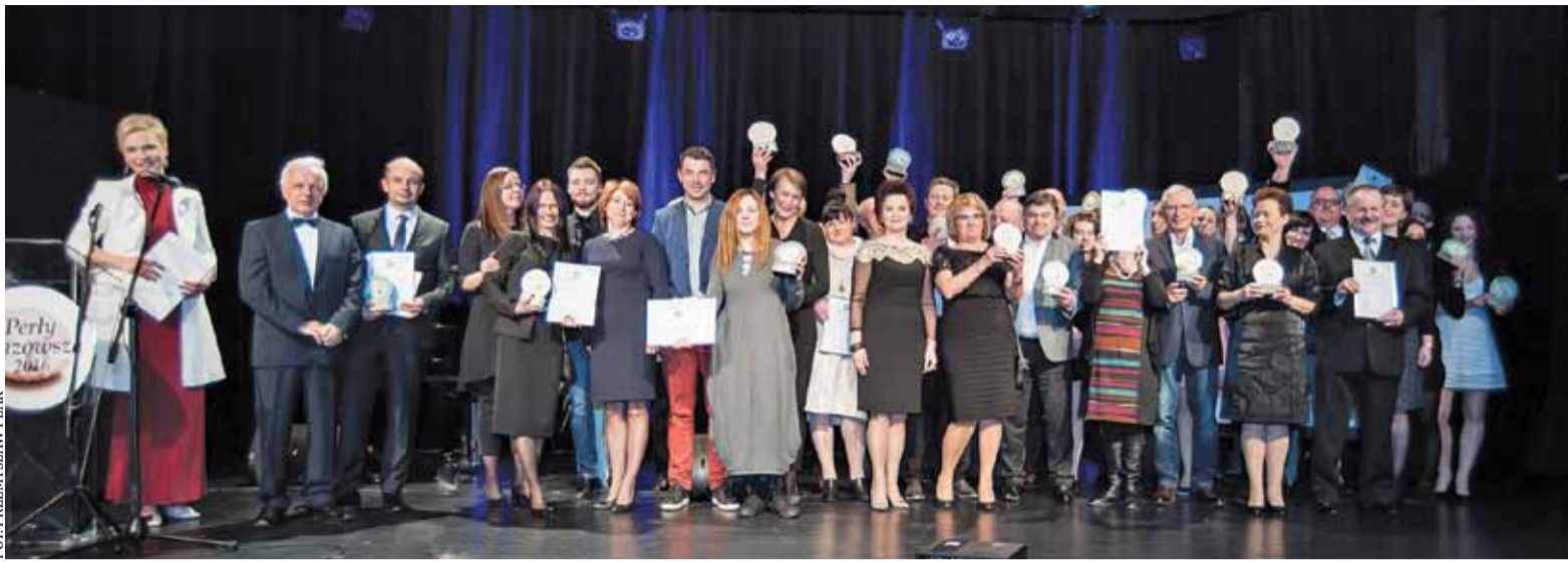
Wszyscy nagrodzeni w konkursie Perły Mazowsza 2016