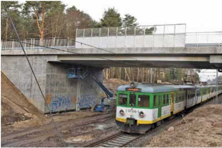
Na placu budowy wiaduktu od dawna nie dzieje się nic

wo zwłaszcza kierowcom stojącym w korkach na ul. Sienkiewicza/Pod Bateriami. A im bliżej kolejnego zamknięcia przejazdu przy ul. Orężnej/Jana Pawła II, tym istotniejsza staje się dodatkowa droga pozwalająca odciążać nieco jedyny dostępny w okolicy przejazd przez linię kolejową.