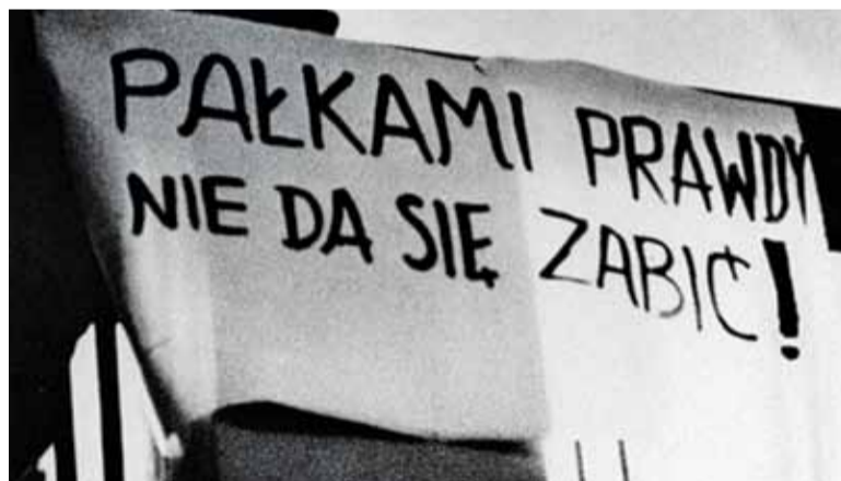
Transparent z 9 marca 1968 roku

Cytat: „W dniu 8 marca pojawiła się na terenie Uniwersytetu duża ilość ulotek z napisem „WIEC”. [...] Jako