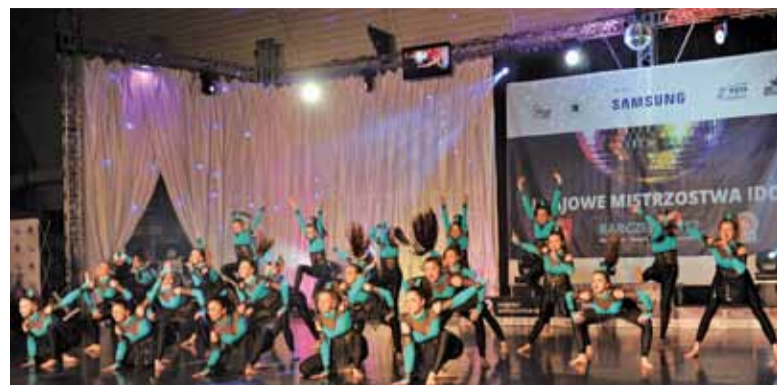
Formacja High Class Two