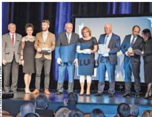
Laureaci Perły Powiatu i Perły Popularności

Podczas uroczystej Gali Perły Mazowsza, która odbyła się 2 marca w Konstancińskim Domu Kultury, ogłoszono zwycięzców konkursu.