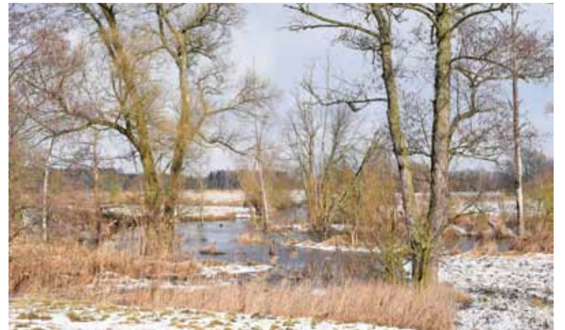
Miejsce, w którym przebiegnie planowany most

ARUP uzasadnia planowaną drogę tak: „Ulica Społeczna stanowi oś komunikacyjną miejscowości Złotokłos. Planowana trasa przechodzi nad rzeką Jeziorką, a następnie przez tereny leśne w kierunku planowanego skrzyżowania z drogą wojewódzką nr 722. Trasa umożliwi