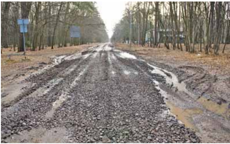
Kasztanów w końcu przejezdna