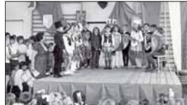
|| Historia - Dzień Kobiet s. 9