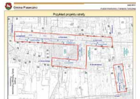
Planowana strefa płatnego parkowania