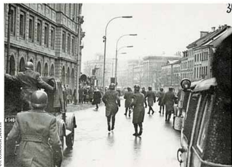
Odziały ZOMO przed UW 8 marca 1968

napisz do autorki m.szturowska@przekladpiaseczynski.pl