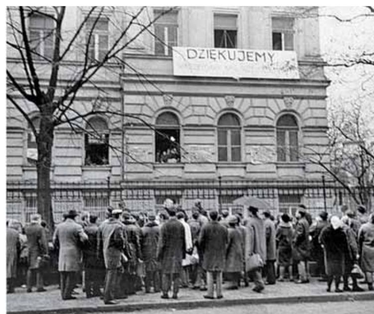
Strajk okupacyjny na Politechnice Warszawskiej

warszawskiego kuratorium i dyrektor szkoły ma obowiązek ogłoszenia decyzji. Nikt nie wyjaśnia sytuacji. Nikt też nie egzekwuje tego zarządzenia.