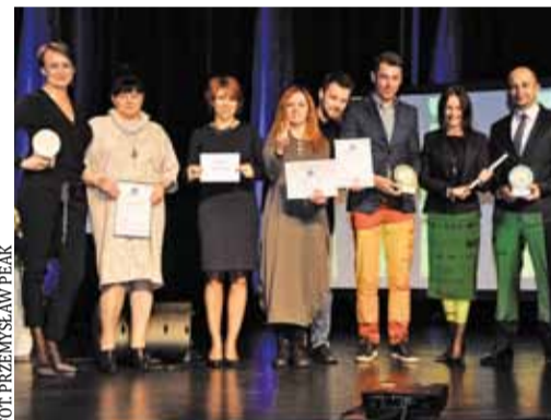
Perły Mazowsza 2016 z gminy Piaseczno