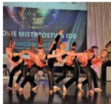
Grupa High Class One

Pierwsze Krajowe Mistrzostwa Polski 2017 rozegrane zostały w