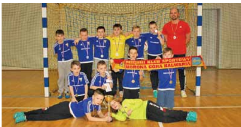
Zwycięzcy z Góry Kalwarii