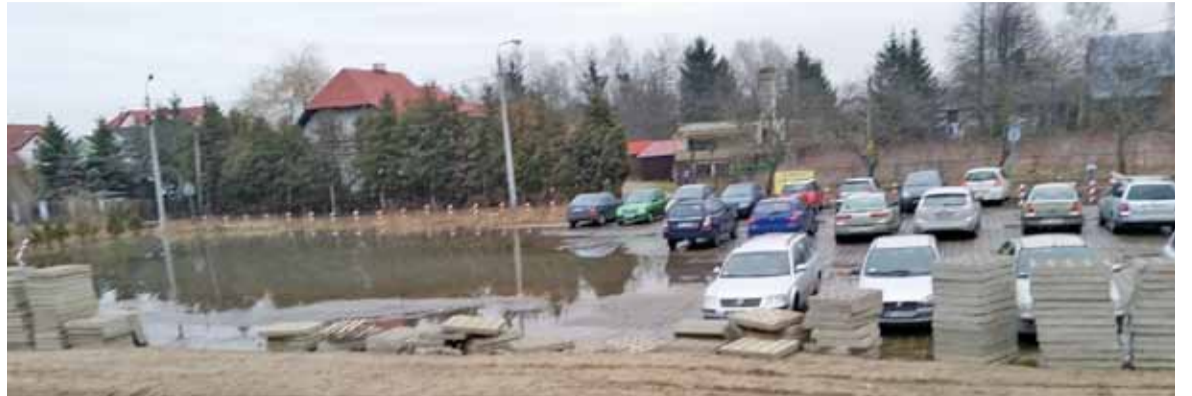
Problem z nadmiarem wody wraca jak bumerang