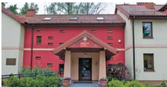
Rekrutacja w tym roku jest opóźniona o kilka tygodni

Postępowanie uzupełniające, z pominięciem rekrutacji elektronicznej, potrwa od 28 do 30 czerwca, ogłoszenie listy nastąpi 5 lipca. Oficjalna lista pojawi się 12 lipca.