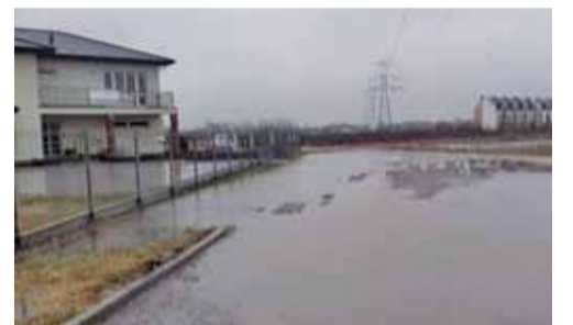
Ulica przypomina jezioro

w przyszłości wyeliminować problemy z utrzymaniem drogi. Ulica Cisowa posiada odwodnienie poprzez system