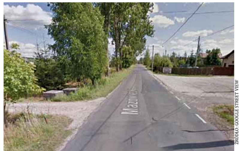
Przy ulicy Mazowieckiej w Dobieszu wreszcie powstanie chodnik

W zeszłym roku został stworzony projekt przebudowy jezdni i budowy chodnika przy ulicy Mazowieckiej. Powiat Piaseczyński zrealizuje inwestycję w 2017 roku w ramach zadania: