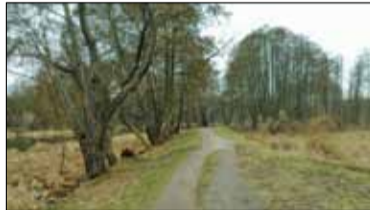
|| Konstancin-Jeziorna - Od mostu do tamy s. 6