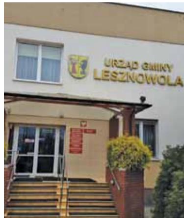
Mieszkańcy mają wątpliwości co do podatku

W związku z pojawiającymi się wątpliwościami Gmina poinformowała na swojej stronie internetowej, że jeżeli ktoś nie otrzyma w terminie decyzji o podatku, jest proszony o kontakt z Referatem Realizacji i Egzekucji Podatków