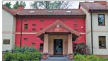
|| Piaseczno - Rekrutacja ruszy w kwietniu s. 5