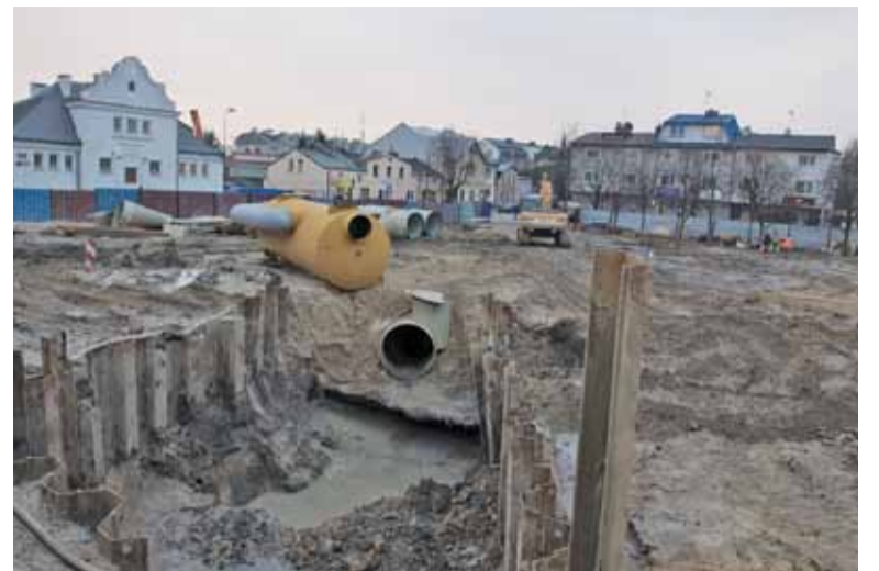
Na skwerze na razie wykonano wyłącznie prace podziemne