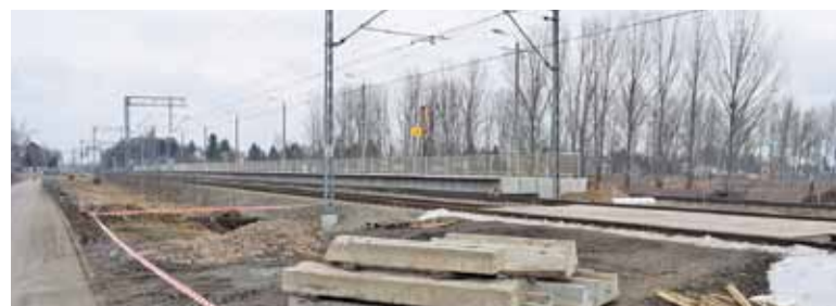
Tymczasowy przejazd będzie pilnowany przez dróżnika