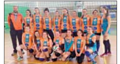
|| Sport - Zbierają na wyjazd na mistrzostwa s. 10