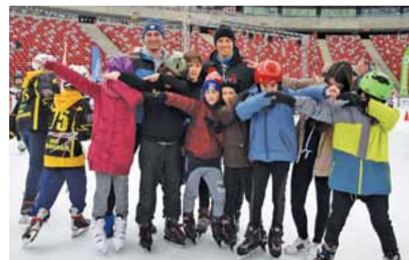
Konstancińska młodzież na Stadionie Narodowym

Konstancin zdołał bez problemów przejść do drugiego etapu, jednak na nim zakończył swój udział w rywalizacji. Młodzi uczniowie z całą pewnością mogą być dumni z tego, co pokazali. Pierwszą lokatę zajęła ekipa z Mikołowa, drugą Oleśnica, a trzecią Elbląg. Każdy zawodnik, bez względu na miejsce, otrzymał medal. Rafał Lipski