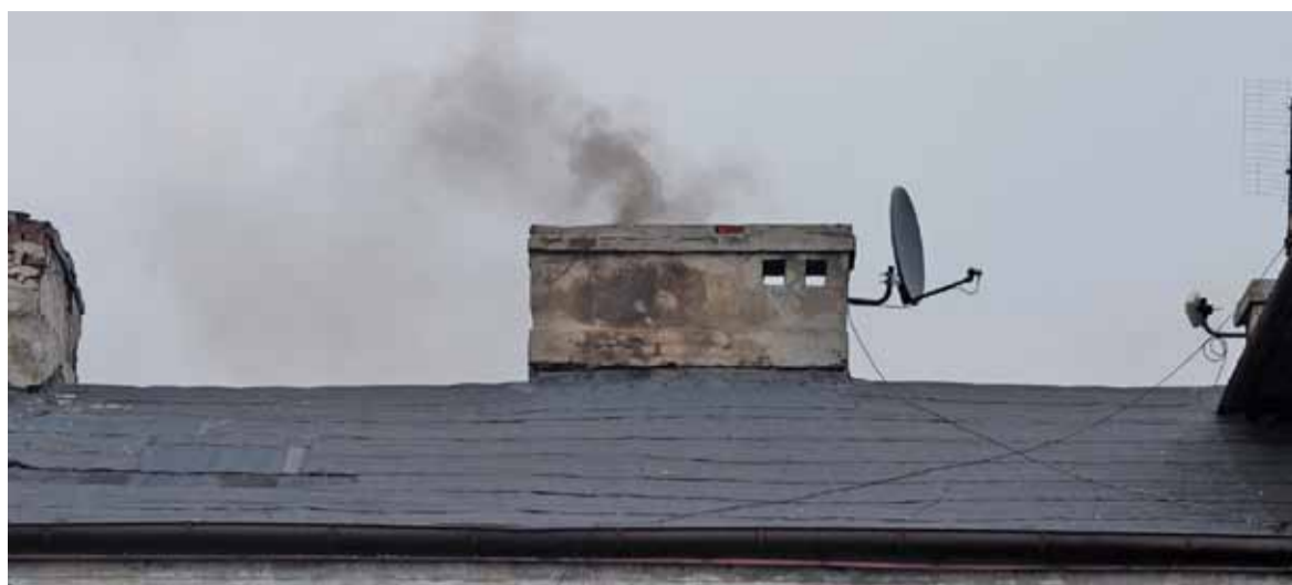
Niska emisja to główny winowajca zanieczyszczonego powietrza

Przychodnia specjalistyczna, ul. A. Mickiewicza 39, tel.: 22 735 41 00