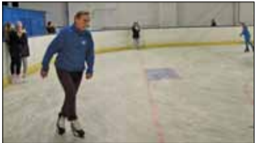
|| Góra Kalwaria - Stolica łyżew i curlingu s. 4

PIASECZNO || GÓRA KALWARIA || KONSTANCIN-JEZIORNA || LESZNOWOLA || PRAŻMÓW || TARCZYN