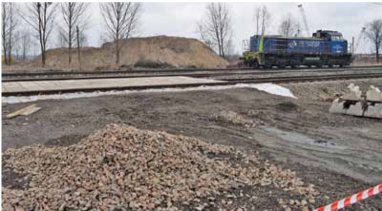
Budowa tymczasowego przejazdu koło stacji Warszawa Jeziorki