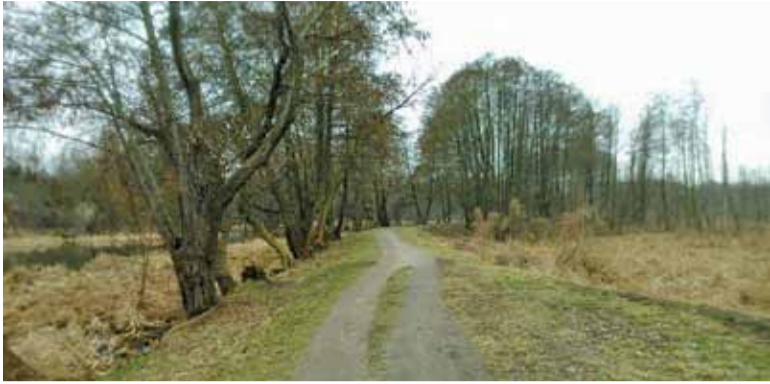
Droga zostanie oświetlona, pojawią się ławki i kosze na śmieci