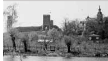
|| Historia - Twierdza Czersk s. 7