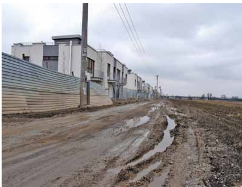
Mieszkańcy Plonowej nie mają alternatywnego dojazdu do domów