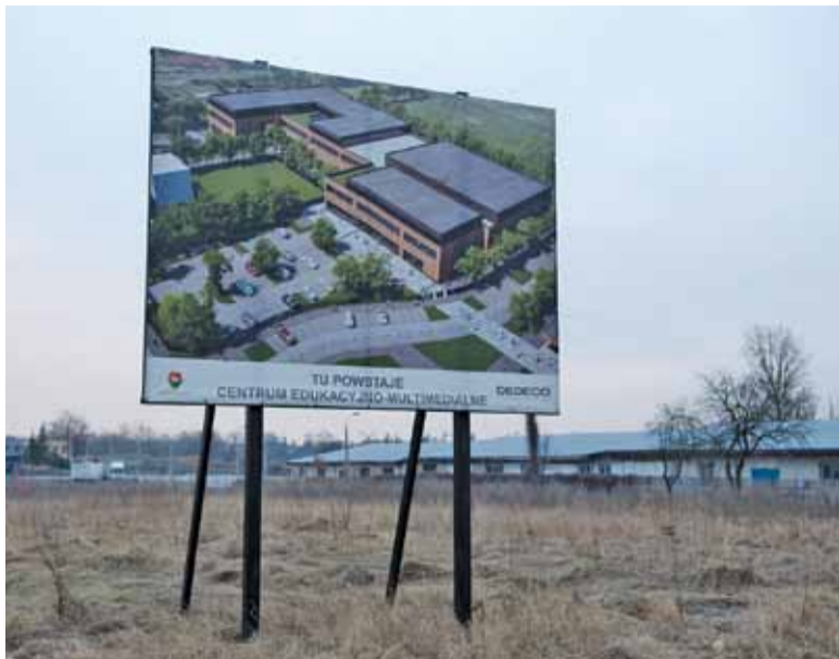
Tablica informacyjna stoi samotnie przy ul. Jana Pawła II już drugi rok