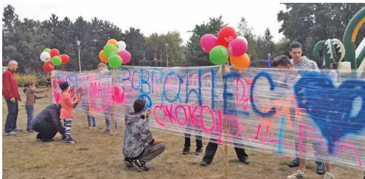
Mieszkańcy podczas pikniku