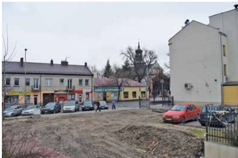
Teren po dawnym MGOPS

– Wykorzystana zostanie różnica poziomów terenu, dzięki czemu w utworzonej wielofunkcyjnej strefie publicznej znajdują się scena z widownią, przestrzeń ekspozycyjna oraz pawilon