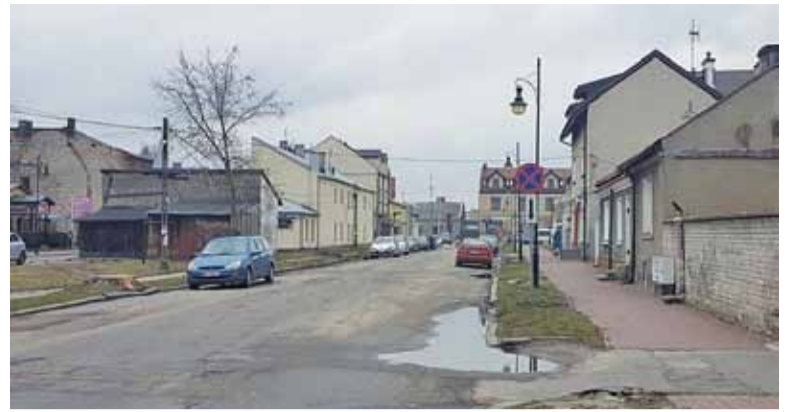
Przy ulicy Wierzbowskiego gmina posadzi nowe drzewa