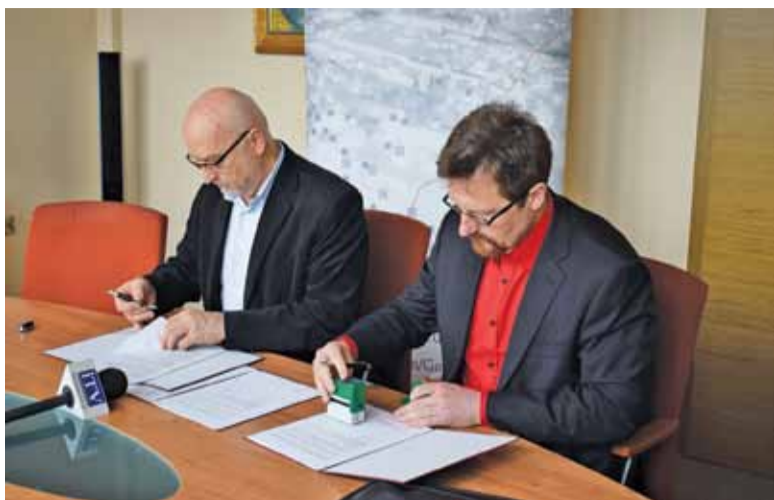
Podpisanie umowy pomiędzy Gminą a Wykonawcą, firmą Polaqua