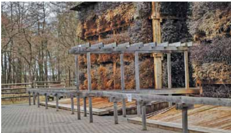
Czy tężni faktycznie grozi likwidacja?