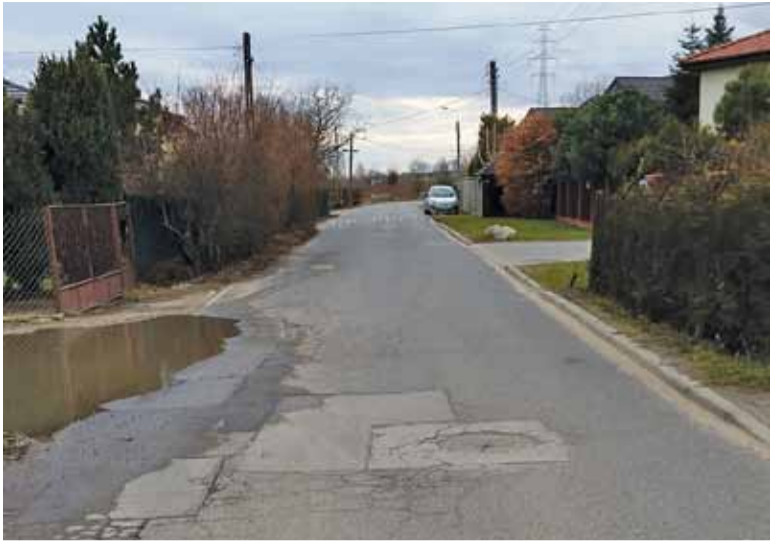
Obecny stan Kieleckiej nie jest najlepszy