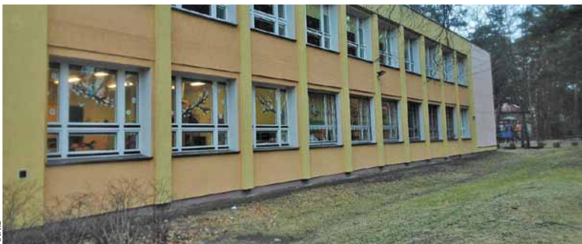
Przy Zespole Szkół nr 1 w Konstancinie powstanie nowa hala sportowa