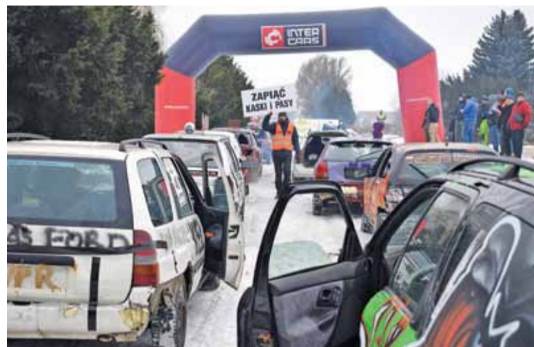
Zimowa edycja Wrak Race