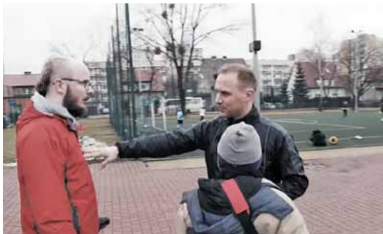
Scena z filmiku mającego edukować rodziców

Powyższa scena dotyczy uruchomionej niedawno wspólnej kampanii ekstraklasowego klubu Piast Gliwice