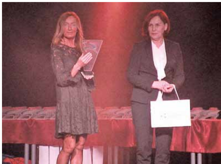
Statuetki wręczała między innymi pani wójt