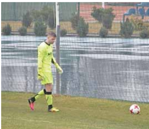
Ulewny deszcz nie sprzyjał grze w piłkę nożną