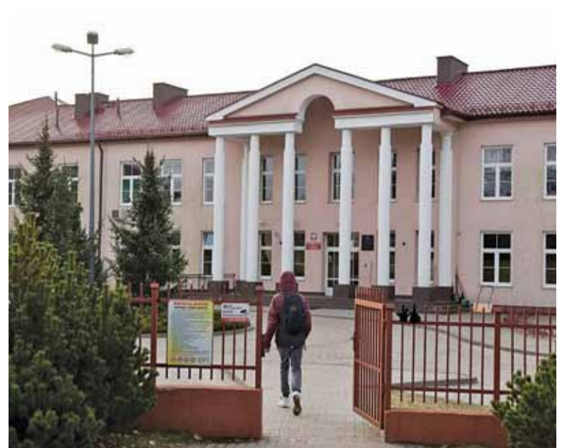
Gimnazjum w al. Kalin stanie się od września częścią SP nr 1