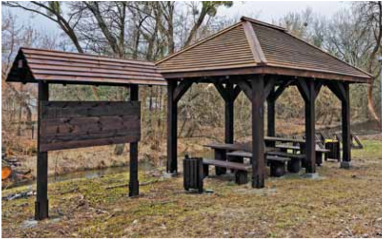
Drewniana wiata w Konstancinie-Jeziornie