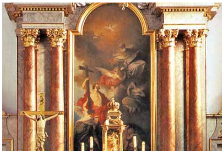
Ołtarz główny w kościele św. Anny, obraz Święta Trójca Pellegriniego

napisz do autorki m.szturowska@przeглядpiaseczynski.pl