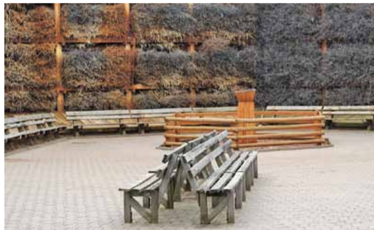
Radni wolą dmuchać na zimne

– Chociaż na posiedzeniu komisji Prezes Zarządu Spółki zapewniał, że nie ma planów sprzedaży czy ewentualnej likwidacji działalności tężni solankowej lub wydobycia solanki z odwiertu w Parku Zdrojowym, to musimy mo-