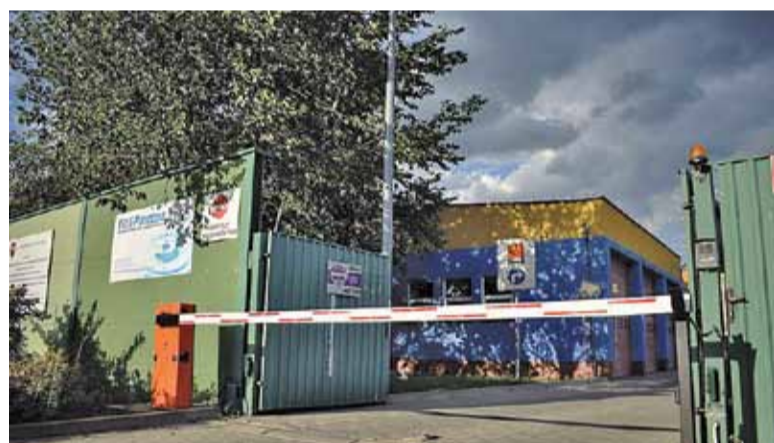
PWiK zachęca do podłączania się do miejskiej kanalizacji

– W trakcie kontroli właściciele nieruchomości zostaną poinformowani o obowiązku przyłączenia posesji do sieci kanalizacyjnej i o sankcjach grozą-