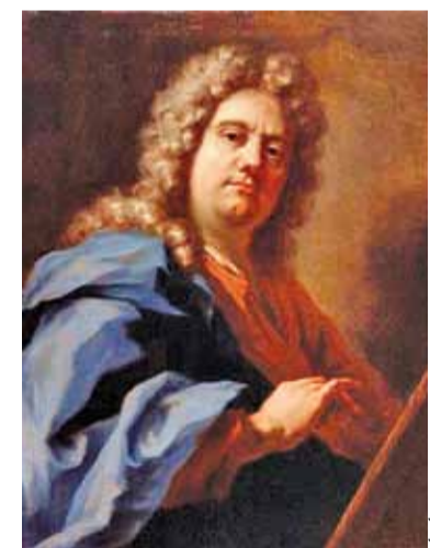
Giovanni Antonio Pellegrini

zane z pałacem piaseczyńskim, co się tu wydarzyło w czasach dla Polski niebawale dramatycznych zakończonych rozbiarami, kim był starosta piaseczyński Henryk Brühl? Kto odwiedzał pałac za czasów ostatniego króla Polski Stanisława Augusta Poniatowskiego? Co się