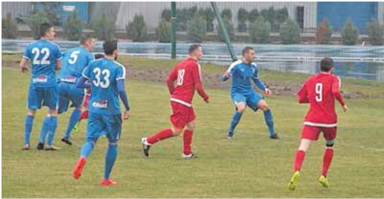
Obie drużyny stworzyły sobie sytuacje strzeleckie