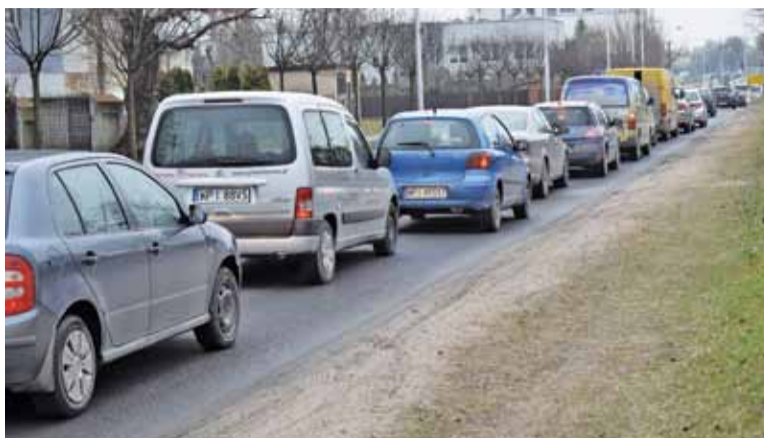
Korek na Wojska Polskiego w Piasecznie