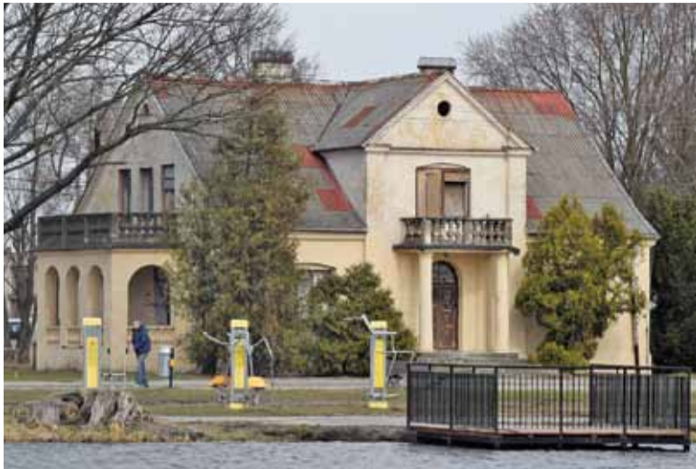
Dworek rodziny E., do czasów powojennych otoczony był założeniem parkowym

Po wojnie 75 ha zostało im odebranych na mocy reformy rolnej PKWN z 1944 r. Właściciele udali się do Wojewódzkiego Urzędu Ziemskiego (WUZ) i ten stwierdził w 1947 r., że ich ziemia nie podlega reformie. Właściciele, bracia E., bowiem chwilę przed rozpoczęciem II wojny światowej podpisali u notariusza umowę przeniesienia własności. W ten sposób jeden z braci miał 29 ha, a drugi 45 ha. Reforma rolna PKWN natomiast zabierała majątki ziemskie, które przekraczały w swej powierzchni 50 ha użytków rolnych. Dwa lata po decyzji WUZ Minister Rolnictwa i Reform Rolnych uznał jednak, że ziemia te pod-