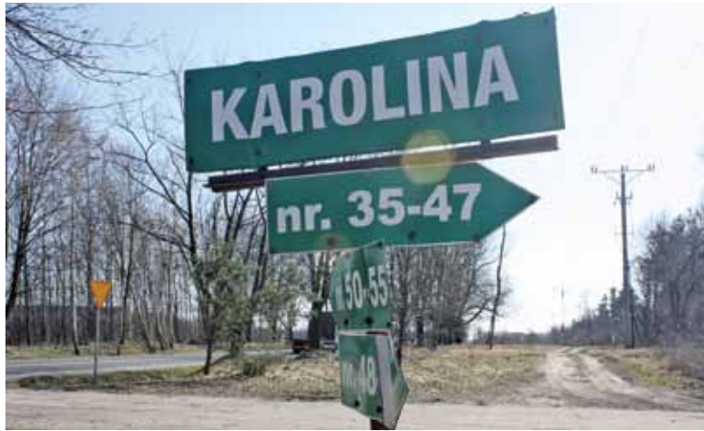
Przyjezdnych ratują tabliczki z informacjami