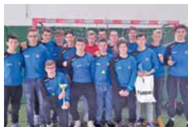
Drużyna Wybrzeża Gdańsk

W ostatni weekend odbył się II Ogólnopolski i Międzynarodowy Turniej Piłki Ręcznej Dziewcząt i Chłopców Piaseczno Cup 2017. Zawody rozgrywano na czterech halach sportowych w Piasecznie: w Gimnazjum nr 2 im. Jana Pawła II, Szkole Podstawowej nr 1, Szkole Podstawowej nr 5 im. Krzysztofa Kamila Baczyńskiego oraz w hali w Gminnego Ośrodka Sportu i Rekreacji. Od piątku do niedzieli na boiskach rywalizowało łącznie 36 zespołów (550 uczestników), a wśród nich między innymi: Kadra Województwa Lubelskiego, AZS AWF Warszawa, ukraiński Łuck, Vive Tauron Kielce, Wisła Płock oraz gospodarze turnieju, czyli KS