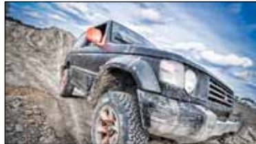
|| Piknik Rodzinny na czterech kółkach. Zapraszamy s. 9