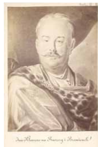
Jan Klemens Branicki hetman koronny

zakupi 1745, a wiemy z lustracji, że Aleksander Sułkowski zaczął budowę pałacu kilka lat wcześniej. Na razie wiadomo tyle, że Sułkowski stracił łaskę króla w 1738, że Jan Klemens Branicki miał ziemię w Piasecznie, że Henryk Brühl, jeden z najpotężniejszych grafów osiemnastowiecznej Europy, był w pałacu w Piasecznie z królem Augustem III na polowaniach. Co więcej?! W Piasecznie rozegrały się ważne wydarzenia z czasów sejmu 1764 roku.