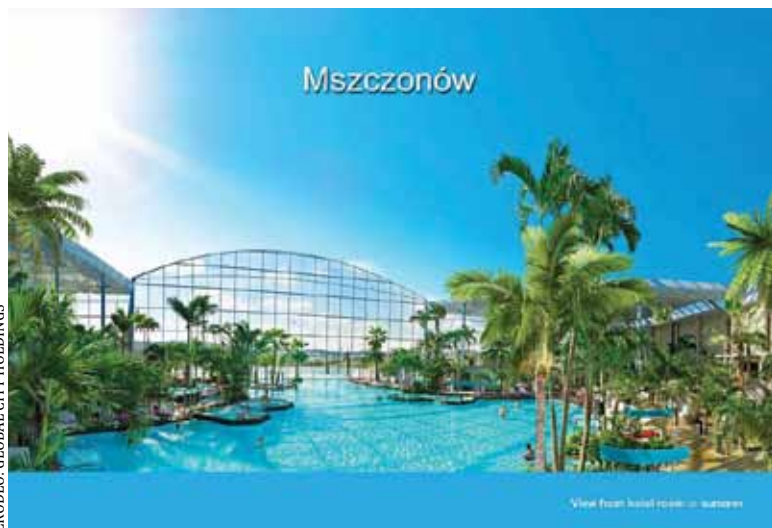
Tak ma się prezentować kompleks

Global City Holdings, spółka zajmująca się budową parku, na swojej stronie internetowej pisze, że jej celem jest „zapewnienie rozrywki milionom gości z Polski oraz innych krajów Europy Środkowo-Wschodniej i Europy Zachodniej, w parku oferującym atrak-