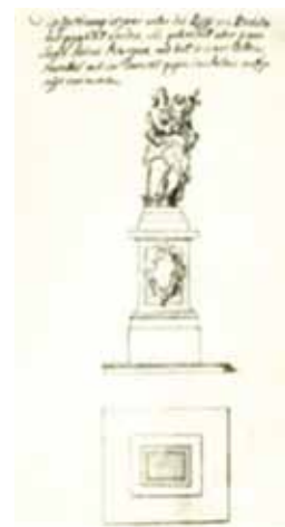
Postument z figurą św. Franciszka trzymającego małego Jezusa, figura z pałacu w Piasecznie

Pałac Stanisławów; zespół pałacowy podmiejskiej rezydencji, której właścicielem był król Stanisław August Poniatowski. Znajduje się na końcu obecnej ul. Timiriaziewa w Grodnie. Ten pałac i piaseczyński często się porównuje jako podobne