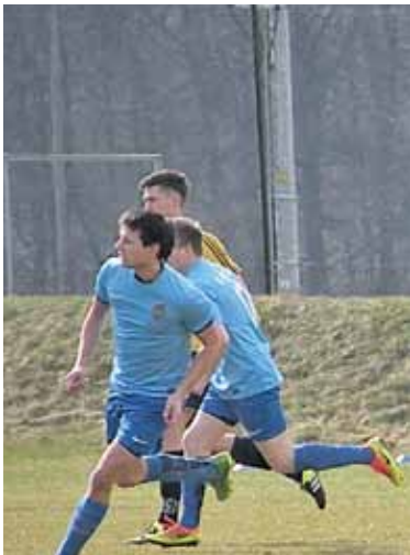
W Oborach piłkarze zaprezentowali kawałek dobrego futbolu

W sobotę na stadionie w Oborach pojawiło się wielu fanów piłki nożnej, żeby obejrzeć spotkanie dwóch lokalnych, czwartoligowych rywali. Gospodarze KS Konstancin podejmowali Spartę Jazgarzew. Ostatecznie górą byli ci pierwsi.