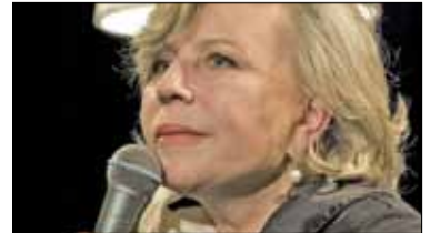
|| Kultura - „Pani zyskuje przy bliższym poznaniu” s. 12