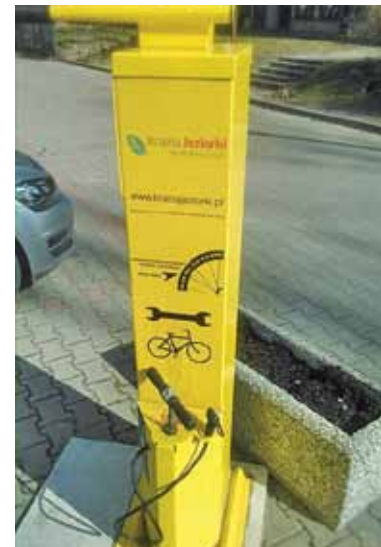
Stowarzyszenie inwestuje między innymi w stacje naprawy rowerów

W tym roku uruchomiony zostanie kolorowy magazyn, który będzie miał na celu promocję regionu. Każdy z samorządów mógłby traktować go jako materiał promocyjny, promocja gmin i powiatów byłaby zintegrowana i wzajemna. Niedawno wystartowała nowa strona internetowa Krajinę Jezioroki, a już niedługo pojawi się aplikacja na telefon