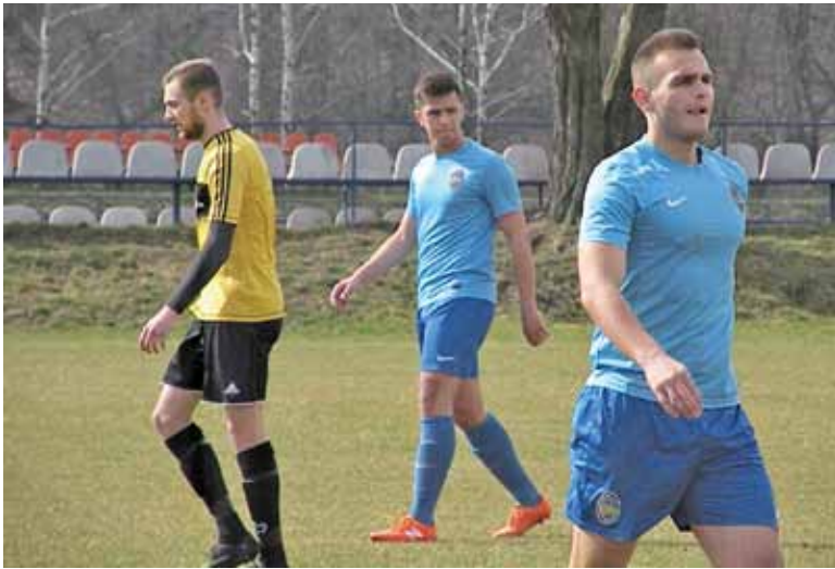
Ostatecznie trzy punkty zgarnął Konstancin