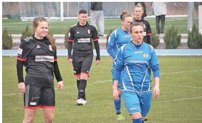
W spotkaniu z Sosnowcem górą były zawodniczki ekipy gości