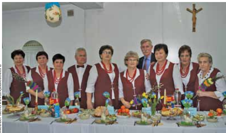
Gmina wspiera kultywowanie lokalnych tradycji