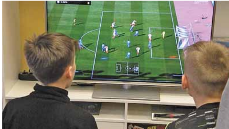
Młodzi gracze rozgrywali mecze z zapartym tchem