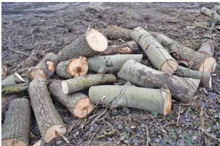
Ruszyła masowa wycinka drzew