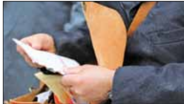
|| Listonosz - gatunek rzadki s. 10