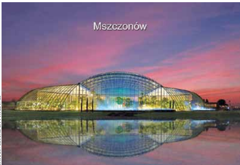
Projekt robi wrażenie