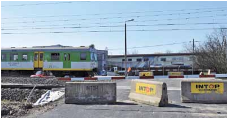
Przejazd tymczasowy przy PKP Jezioraki fizycznie jest już gotowy