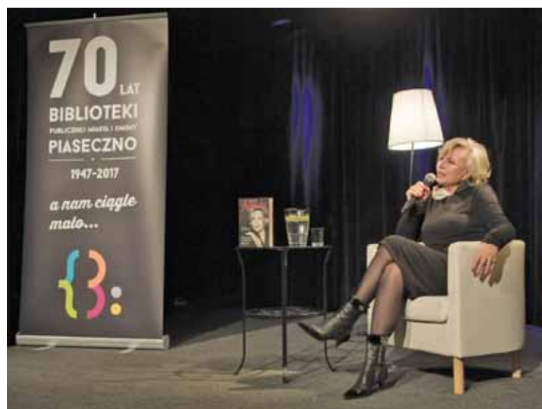
Spotkanie autorskie z Krystyną Jandą

Czy są szanse na to, że w 2019 roku spędzimy Wielkanoc w tropikach w