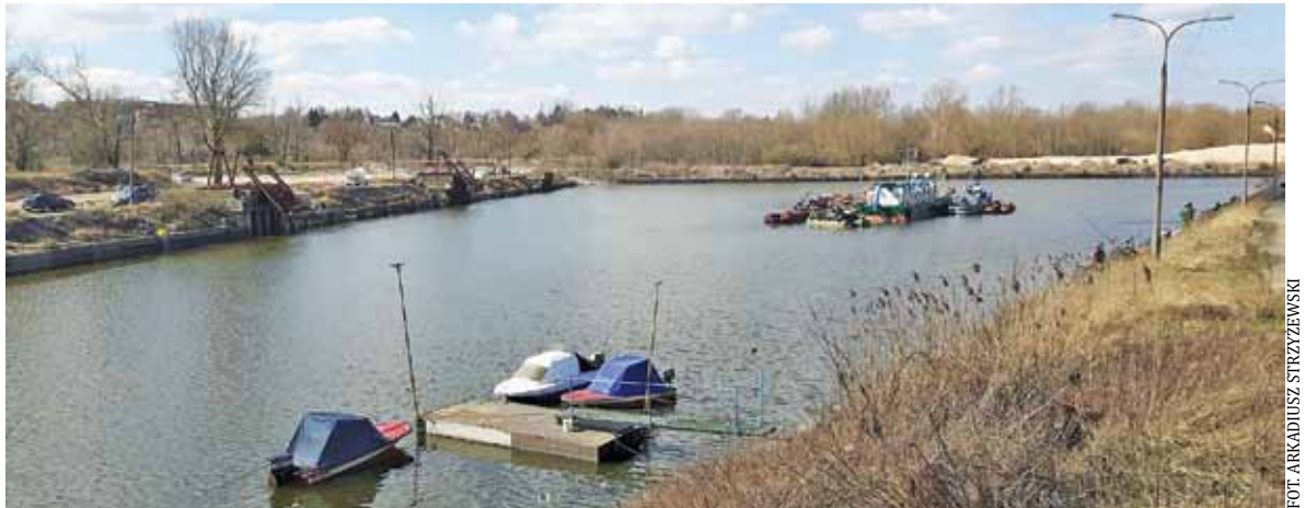
Port w Górze Kalwarii