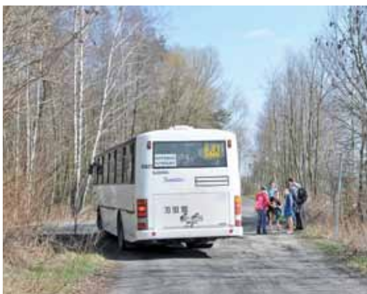
W nowej lokalizacji autobus bez problemu zawraca na wirażu drogi