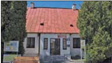
|| Mieszkanie gratis s. 7

PIASECZNO || GÓRA KALWARIA || KONSTANCIN-JEZIORNA || LESZNOWOLA || PRAŻMÓW || TARCZYN