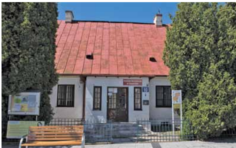
Obecny budynek plebanii w praktyce zostanie rozebrany