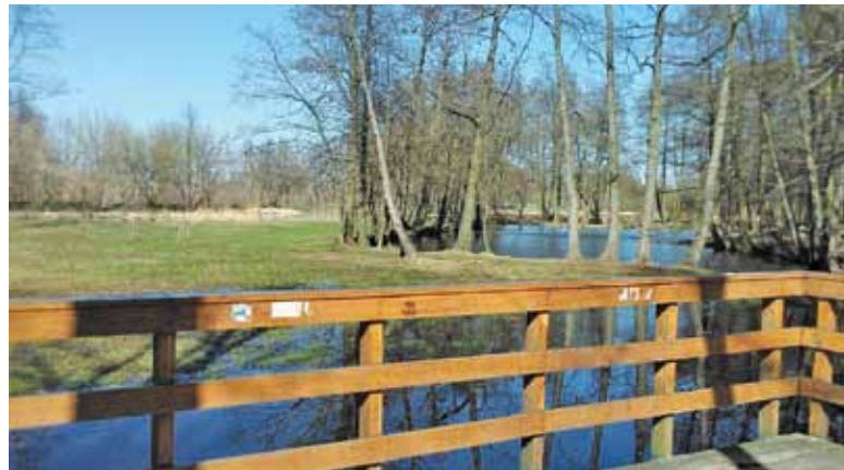
Włodarze zamierzają uczynić Konstancin jeszcze bardziej atrakcyjnym

Ogółem zostaną wybudowane łącznie cztery tego typu obiekty. Następnym z nich będzie duży pomost rekreacyjno-widokowy, który stanie w rejonie Hugonówki przy ulicy Mostowej. Na koncepcję, projekt oraz jego wykonanie gmina planuje przeznaczyć 400 tysięcy złotych.