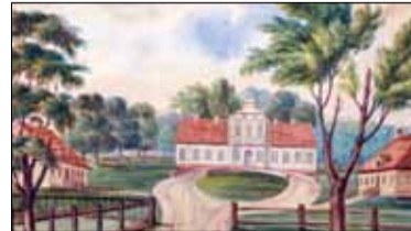
|| Historia - Jan Klemens Branicki, magnat całą gębą s. 11