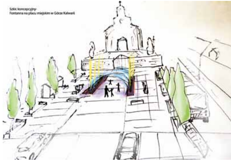
Szkic uwzględniający fontannę na placu miejskim w Górze Kalwarii