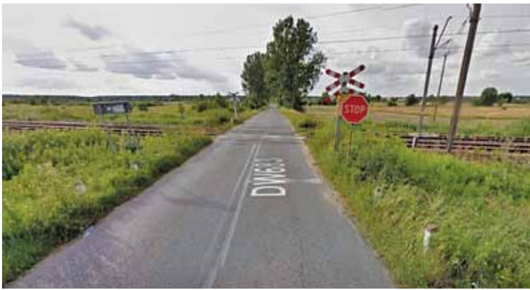
Przejazd między Uwielinami a Gabryelinem