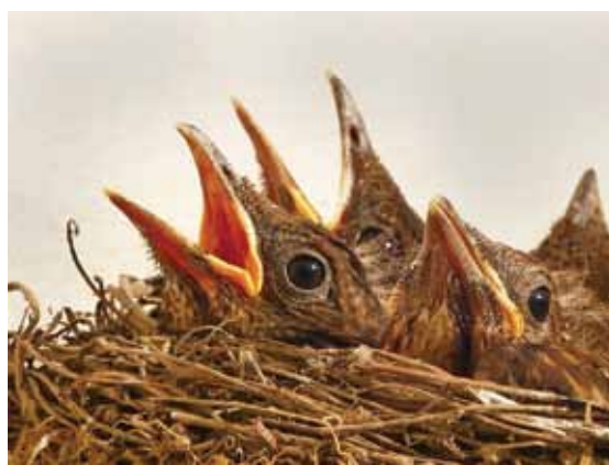
Od 1 marca do 15 października w całej Polsce obowiązuje okres lęgowy ptaków

Jak pisał ostatnio portal newsbook.pl w Grodzisku Mazowieckim naliczono ponad milion złotych kary za wycięcie kilkuset drzew, ponieważ działka należała do osoby prawnej, nie fizycznej, a wycinkę prowadziła bez zezwolenia.