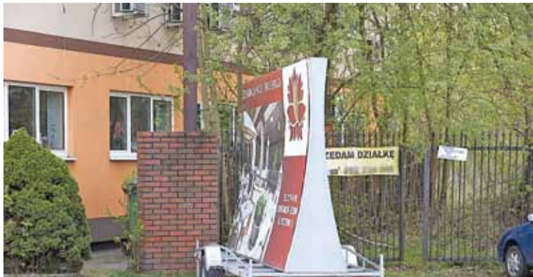
Jedna z przyczep znajdujących się przy Urzędzie Gminy