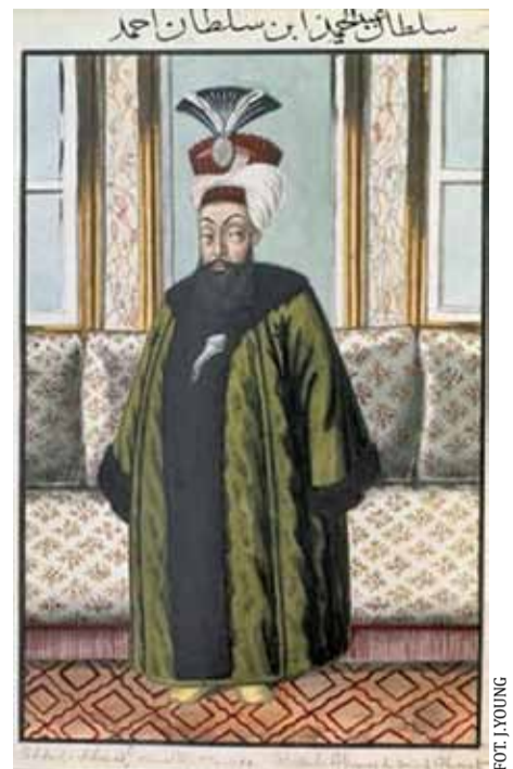
Sułtan Abdul Hamid I