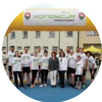
IX BIEG PAPIESKI