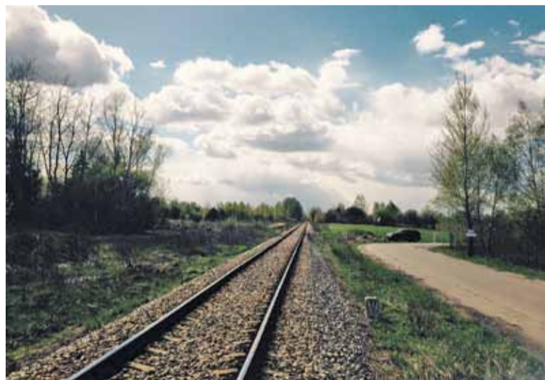
Droga 10 KDL pobiegłaby prosto przy torach, by połączyć się z planowaną ulicą Cyranczki.