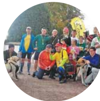
BIEG ŚW. FRANCISZKA