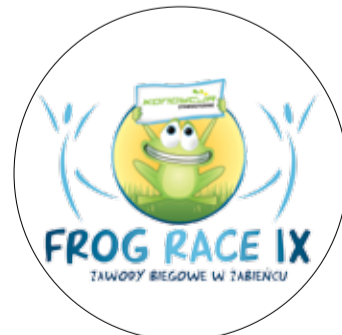
IX FROG RACE