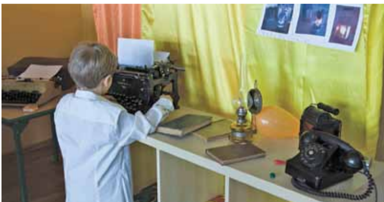
Odkrywanie funkcji starych urządzeń było bardzo absorbujące