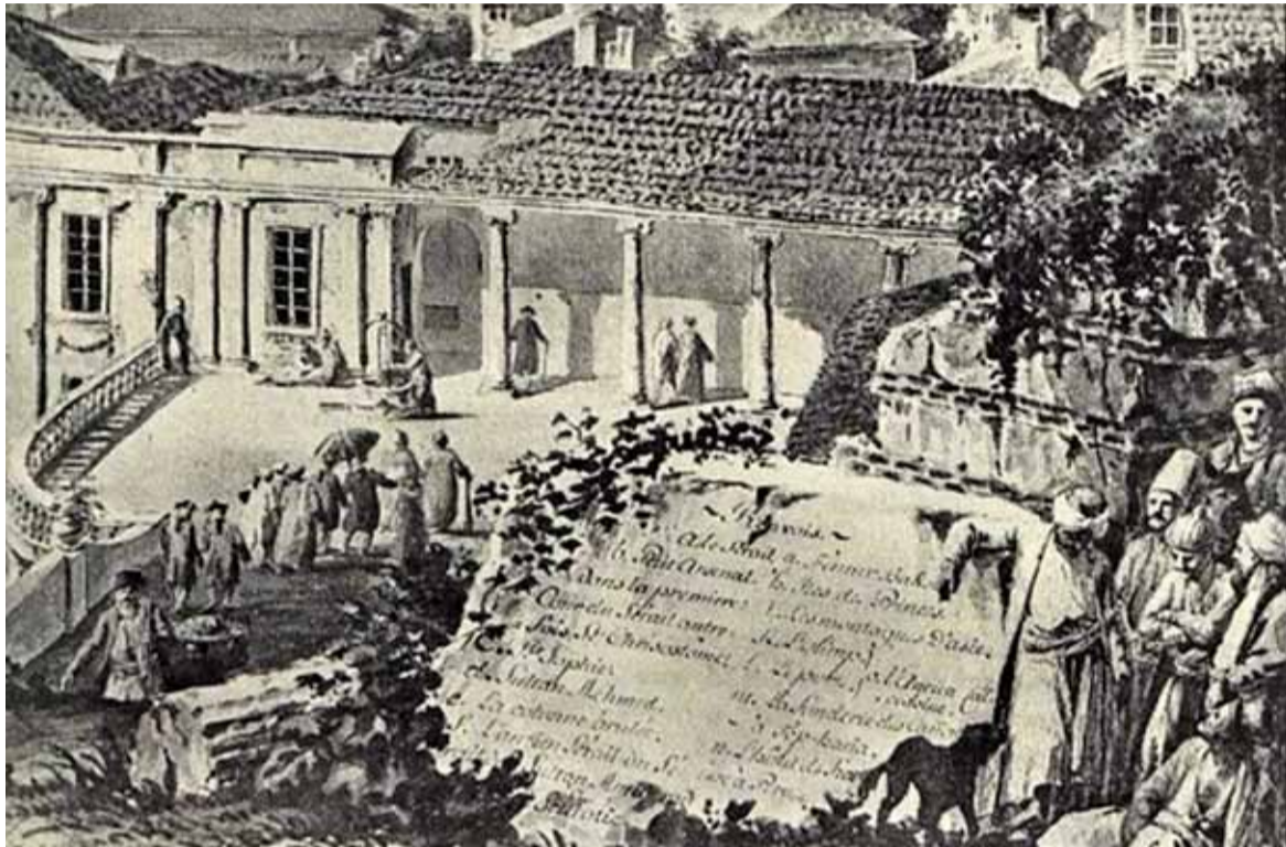
Widok Konstantynopola w około 1777 roku