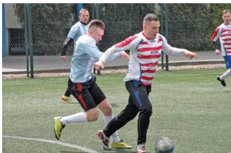
Na boisku nie brakowało walki