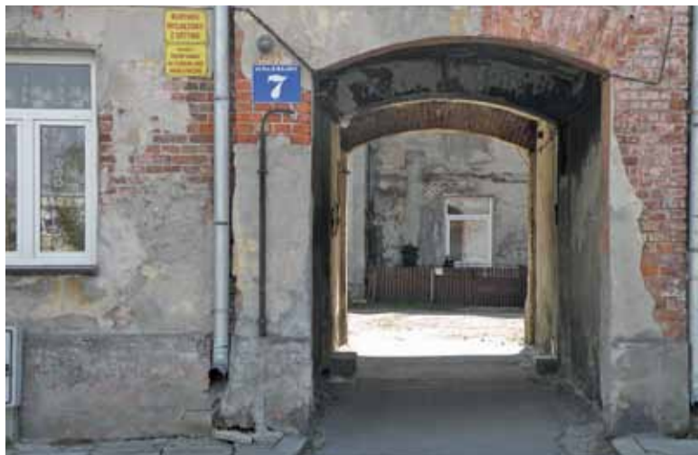
Kamienica przy ulicy Księdza Sajny 7