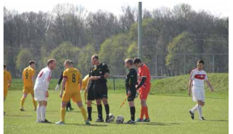
Zawód sędziego w A-klasie nie dość, że niezbyt opłacalny, to i niezwykle niewdzięczny

Ekstraklasa, początek drugiej połowy spotkania Górnik Zabrze – GKS Bełchatów (2007 rok). Sędzia mija się z jednym z zawodników ekipy gości i... nagle wyjmując z kieszeni czerwoną kartkę.