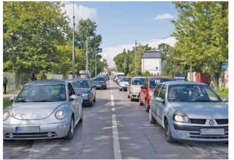
Ulica Chyliczkowska ma stać się ponownie dwukierunkowa