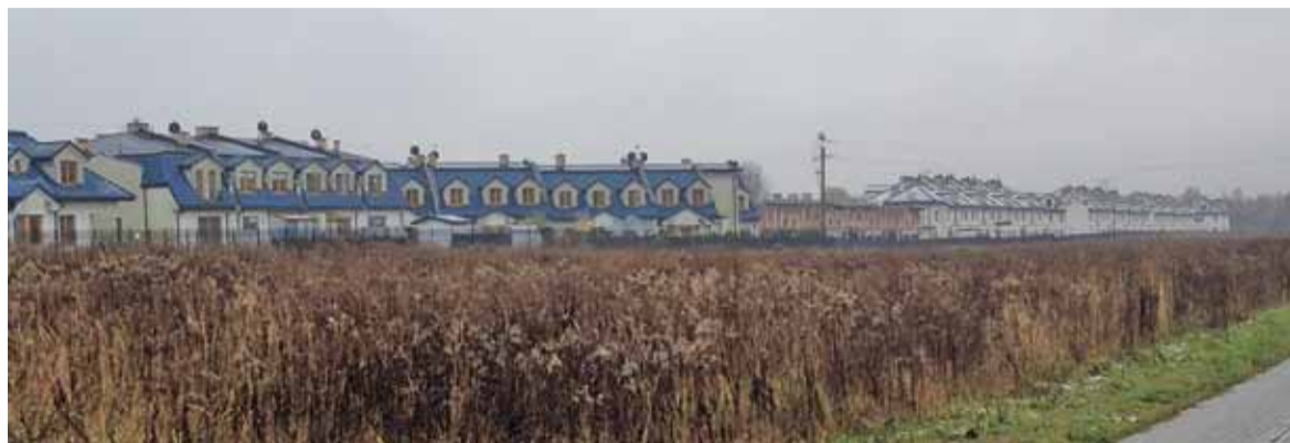
Osiedla nadal rosną

W Józefosławiu rosną domy i osiedla. Już niemal wszystkie pola zostały wykupione przez deweloperów i są zabudowywane. Rosną kilometry tzw. szeregowców, do tego ogrodzonych i zamkniętych szlabanami. Czy to jest spełnienie naszych marzeń o mieszkaniu pod miastem? Szczególnie wtedy, gdy z tych osiedli nie ma jak wyjechać?