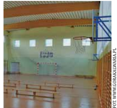
Kolejna szkoła doczeka się sali sportowej

Kiedy najmłodszy ruszą na salę, by pograć w piłkę? Termin realizacji zamówienia przypada na 30 czerwca