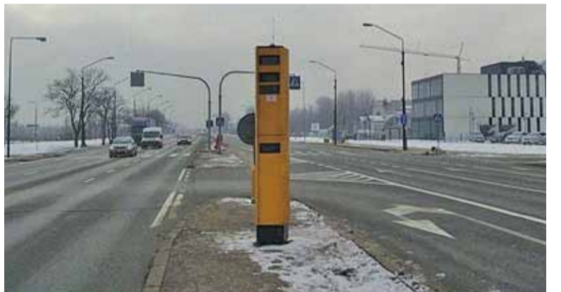
Fotoradar na ul. Puławskiej