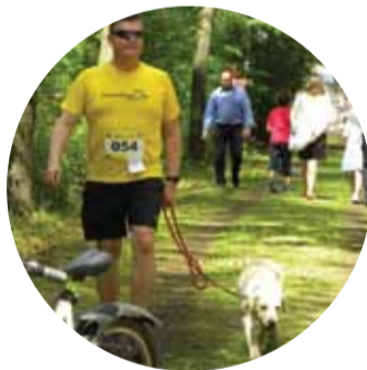
I BIEG Z PASJĄ I BIEG Z PUPILEM