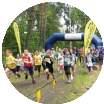
BIEG ŚW. JANA