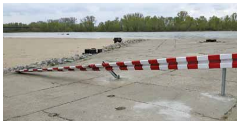
Bariera utrudniająca dostęp do Wisły już została zniszczona