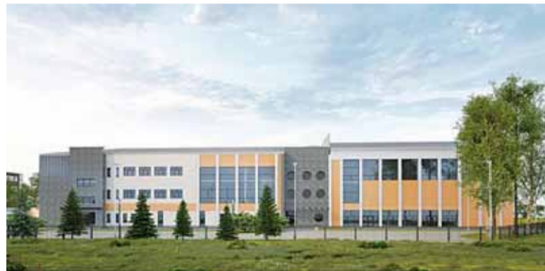
Wizualizacja szkoły w Zamieniu robi wrażenie