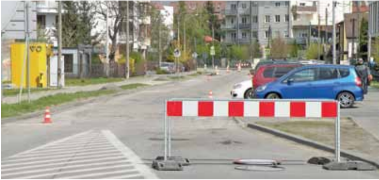
Ulica Bielawska w Konstancinie