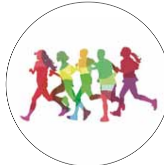
IV BIEG ULICZNY JÓZEFOSŁAWIA I JULIANOWA