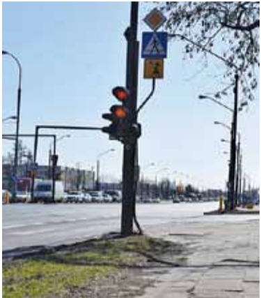
Czy można szybko zlikwidować korki na Puławskiej?