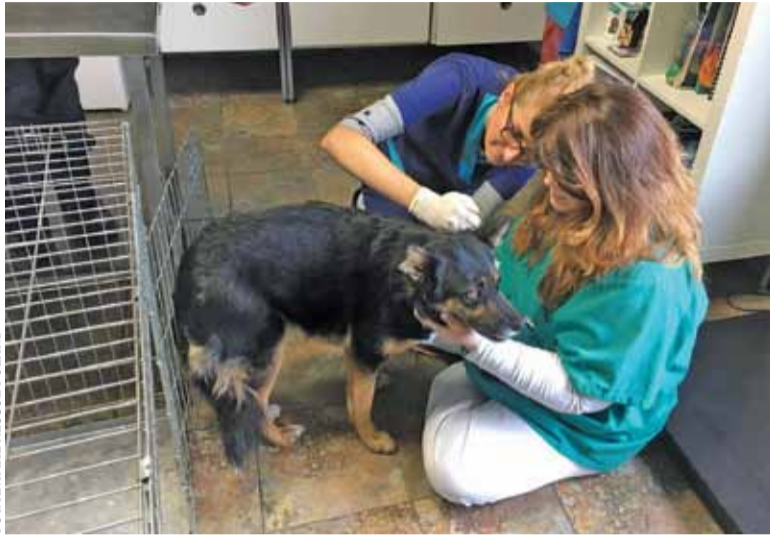
Wycieczonego i spragnionego psa inspektorzy uratowali i odczytali jego chipa