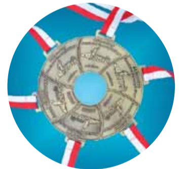
EKIDEN - II MARATON POWIATU PIASECZYŃSKIEGO SZTAFET