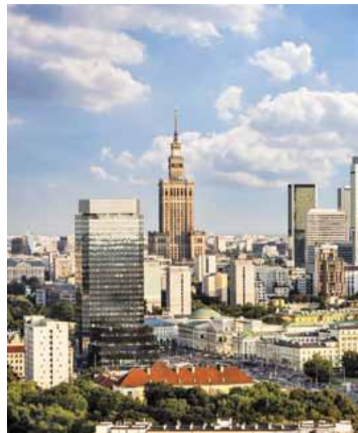
4 czerwca odbędzie się Referendum Gminne w Piasecznie