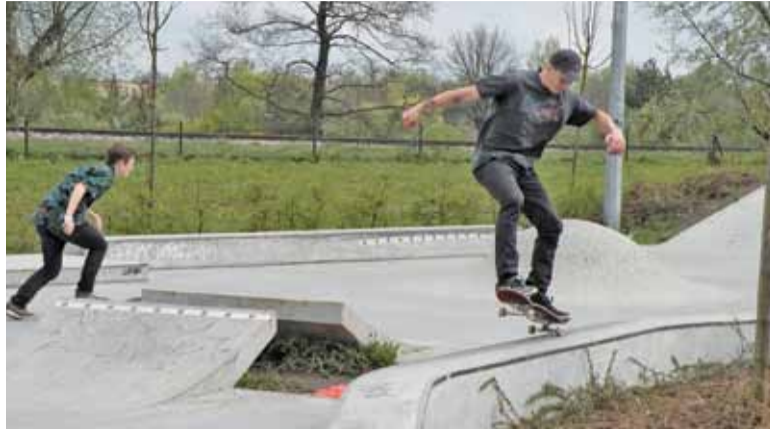
Zawodnicy „grindowali” na potęgę

Zawodnicy rywalizowali w trzech konkurencjach: przejazd, kung-fu skate oraz najwyższe ollie. Do wygrania były deski, kółka, łożyska, a także koszulki. Mogliśmy obejrzyć między innymi: grindy (ślizg po murku, krawędzi elementu skateparku) – zarówno te najprostsze, czyli 50-50, jak i również te trudniejsze typu Salad Grind, Nosegrind – ollie (podskok z deskorolką) czy też kilka innych sztuczek. Niezwykle efektownie wyglądały skoki nad tzw. „stonerem”.