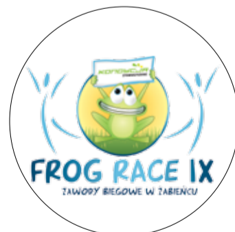
IX FROG RACE