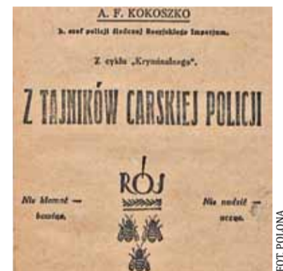
Okładka książki o pościgu za złodziejami z początku XX wieku