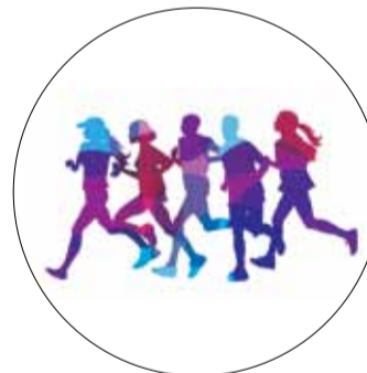
IV BIEG ULICZNY JÓZEFOSŁAWIA I JULIANOWA