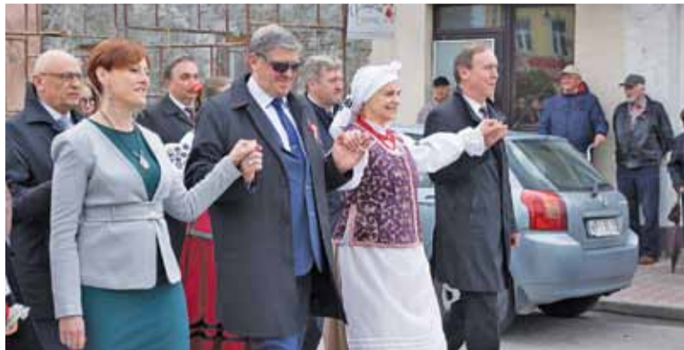
Wspólny taniec władz gminy i mieszkańców