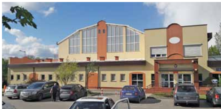
Rosnąca liczba uczniów z okolicznych wsi oraz reforma edukacji wymuszają rozbudowę