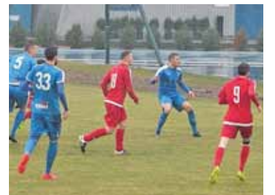
Wiedza dotycząca stałych fragmentów często jest na wagę złota

Tak właśnie wyglądała analiza rywala przed meczami Lecha Poznań w Pucharze UEFA – „groźny jest Makaay”. Dziwi więc, dlaczego trenerzy najlepszych klubów świata poświęcają wiele godzin na ten aspekt, skoro w ich przypadku wiadomo, że w ich ligach każdy zawodnik jest groźny... Nie umniejsza-