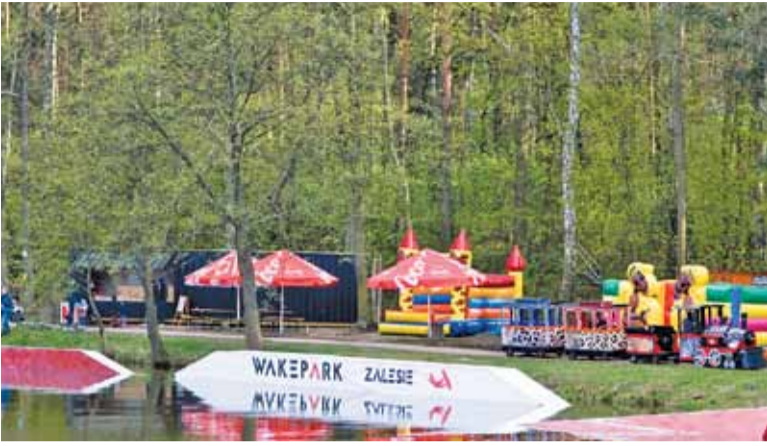
Planeta Zalesie nabiera kolorów