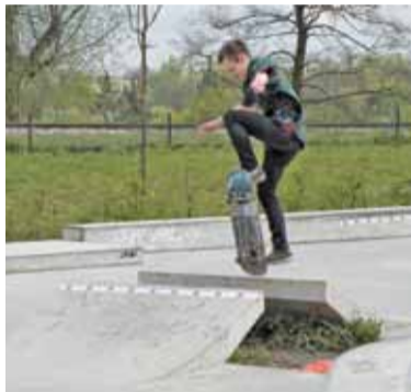
Skok nad stonerem

W ostatnim dniu kwietnia na terenie znajdującego się przy ulicy Bielawskiej w Konstancinie-Jeziornie skateparku odbyły się zawody deskorolkowe o nazwie „3-Riple Contest”. Choć był to turniej dla amatorów, to jednak poziom uczestników zdecydowanie robił wrażenie, a całemu wydarzeniu towarzyszyła bardzo ładna pogoda.