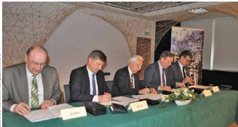
Podpisanie umowy przez przedstawicieli 5 gmin nadwiślańskich