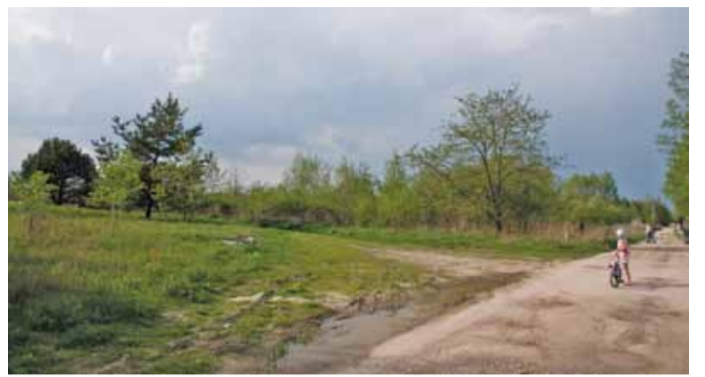
Na razie trudno sobie wyobrazić, że kiedyś miałyby tu stanąć szkoły