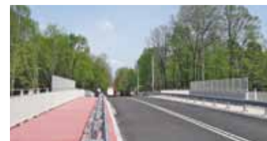
Na wiadukcie trwają ostatnie prace

– Wykonawca w ciągu najbliższych kilku dni przekaże nam dokumenty,