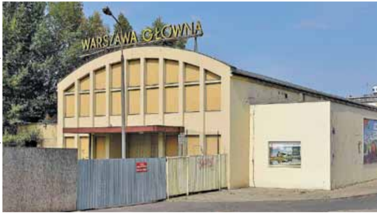
Budynek dworca Warszawy Głównej