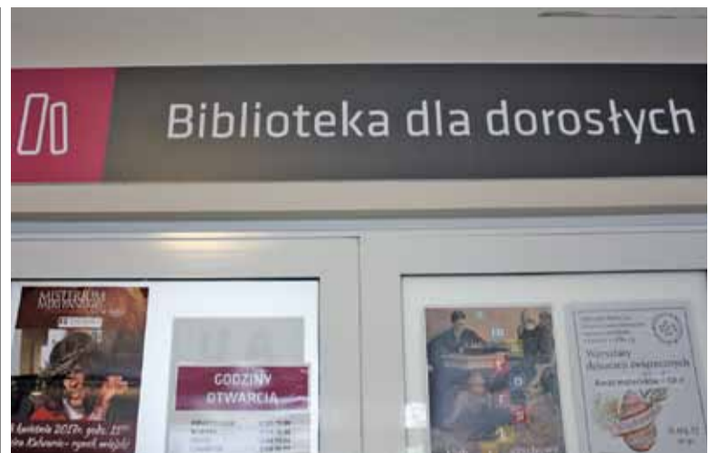
Biblioteka czeka na zwrot książek