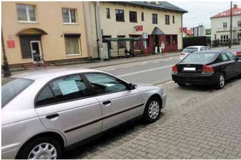
Samochody wystawione na sprzedaż blokują miejsca parkingowe