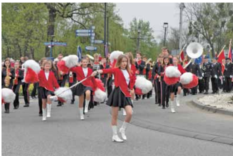
Parada orkiestr dętych