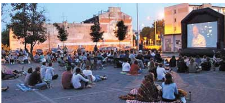
Ruszyło głosowanie. Jakie filmy zobaczymy w tym roku w kinie plenerowym?