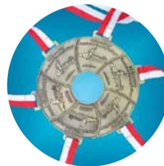
EKIDEN – II MARATON POWIATU PIASECZYŃSKIEGO SZTAFET