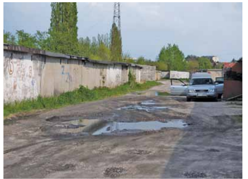
Najgorzej sytuacja wygląda po opadach deszczu

nansowej otrzymywanej od Urzędu do Spraw Cudzoziemców. Od początku pobytu w Polsce cudzoziemcy przechodzą kursy informacyjne na temat obowiązujących w kraju praw, zasad i obyczajów oraz kultury. Otrzymują także specjalne informatory mające na celu łatwiejsze odnalezienie się w polskich realiach. Małoletni cudzoziemcy objęci wnioskami o udzielenie ochrony uczęszczają do szkół publicznych. Najmłodsze dzieci mają natomiast zapewnione zajęcia przedszkolne w ośrodkach. Dorośli mogą korzystać z bezpłatnych lekcji języka polskiego. W ramach działań preintegracyjnych Urząd do Spraw Cudzoziemców współpracuje z organizacjami pozarządowymi, które pracują z cudzoziemcami przebywającymi w ośrodkach. Organizowane są także dni otwarte dające lokalnej społeczności możliwość poznania cudzoziemców oraz sposobu funkcjonowania placówek.