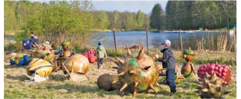
Najmłodsi chętnie bawili się wśród nietypowych figurek

Przed sezonem ma zostać oczyszczony basen. Przygotowywana jest też instalacja pod kilka zjeżdżalni.