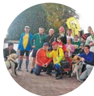
BIEG ŚW. FRANCISZKA