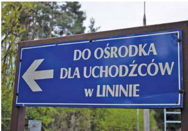
Ośrodek dla Cudzoziemców w Lininie znajduje się w środku lasu