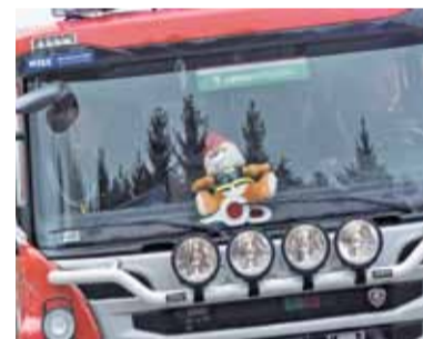
Strażacy hucznie obchodzili swoje święto

Punktualnie o godzinie 13.30 spod Centrum Handlowego „Stara Papiernia” wyruszyła parada orkiestr dętych i na pewien moment miasto zostało sparaliżowane. Za muzykami, którzy w swoim repertuarze mieli takie utwory jak „Party Rock” LMFAO czy „I Feel Good” Jamesa Browna, równym krokiem podążali