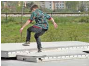
Latania nie było końca

Zawodnicy rywalizowali w trzech konkurencjach: przejazd, kung-fu skate oraz najwyższe ollie. Do wygrania były deski, kółka, łożyska, a także koszulki. Mogliśmy obejrzyć między innymi: grindy (ślizg po murku, krawędzi elementu skateparku) – zarówno te najprostsze, czyli 50-50, jak i również te trudniejsze typu Salad Grind, Nosegrind – ollie (podskok z deskorolką) czy też kilka innych sztuczek. Niezwykle efektownie wyglądały skoki nad tzw. „stonerem”.