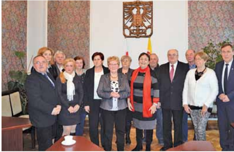
Gminna Rada Seniorów w Górze Kalwarii