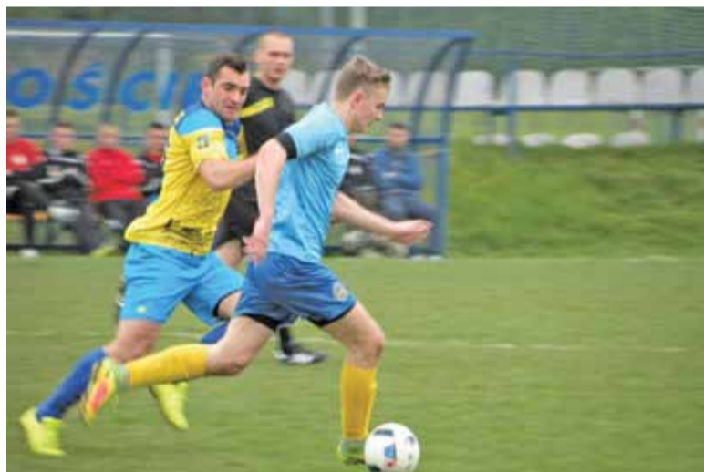
Obie drużyny dobrały się kolorystycznie