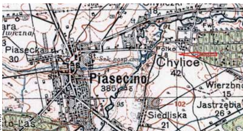
Mapa z 1934 roku z zaznaczoną wsią Pólko