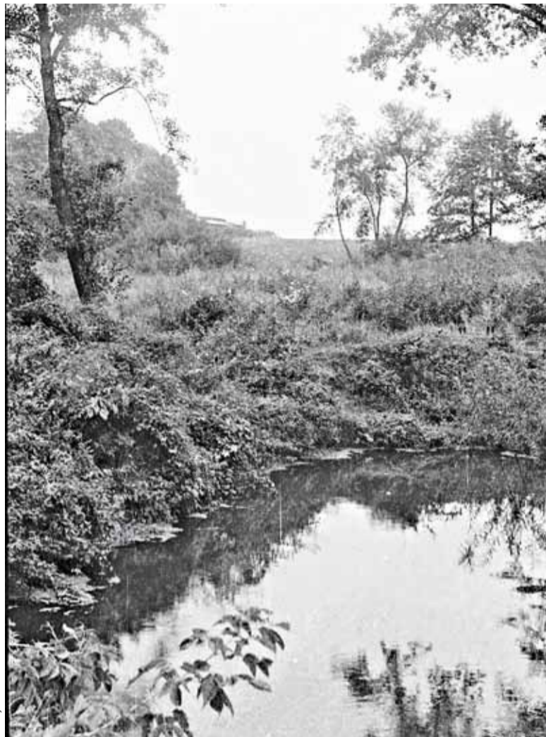
Widok glinianki, pozostałości po cegielni – Pólko