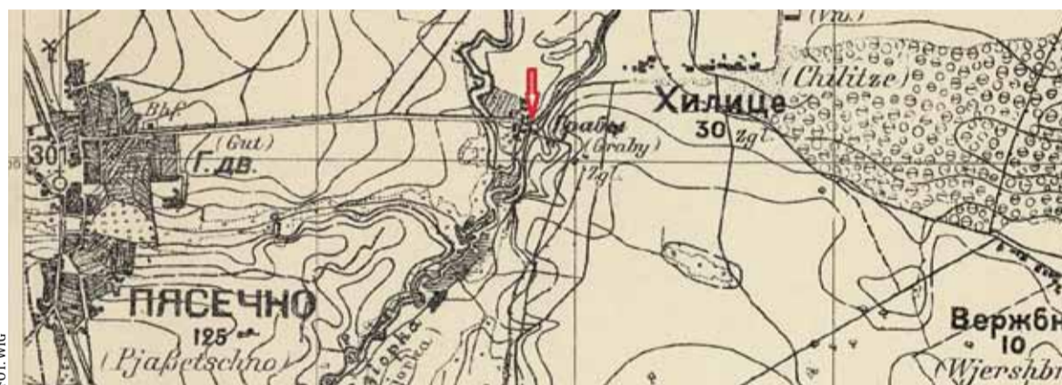
Mapa z 1914 roku: objaśnienia znaków: zgł – cegielnia, czerwona strzałka wskazuje młyn Gabau'a, Gut – dwór, Bhf – stacja kolejowa kolejki waskotorowej

Opowieści kryminalne przedstawione w tym tekście to relacje ze spraw sądowych i śledztw kryminalnych prowadzonych na prawdy. Wszystkie szczegóły tych mrocznych opowieści są faktami, a fakty te zostały opublikowane w artykułach prasowych zamieszczonych w dziennikach z początku wieku XX. Sprawy tego typu przerażały mieszkańców miasteczka, ale też intrygowały, były powodem rozmów mieszkańców i ocen postępowania sprawców zbrodni. Czy powinny znaleźć się w dziale tygodnika zatytułowanym „Ocalić od zapomnienia”? To mnie zastanowiło. Znalazłam uzasadnienie ponownej publikacji tych zdarzeń w ich szczegółach, w tle historycznym, w analizie ciekawej mentalności społeczeństwa początku XX wieku, w opisie pracy stróżów porządku, w sumie w interesującym studium socjologicznym. W tej opowieści przedstawiam dwie mroczne sprawy, w których dzisiejszy psychiatra policyjny poradziłby sobie bez problemu, podając policji oczywisty motyw zbrodni i profil psychologiczny sprawcy, co ułatwiłby