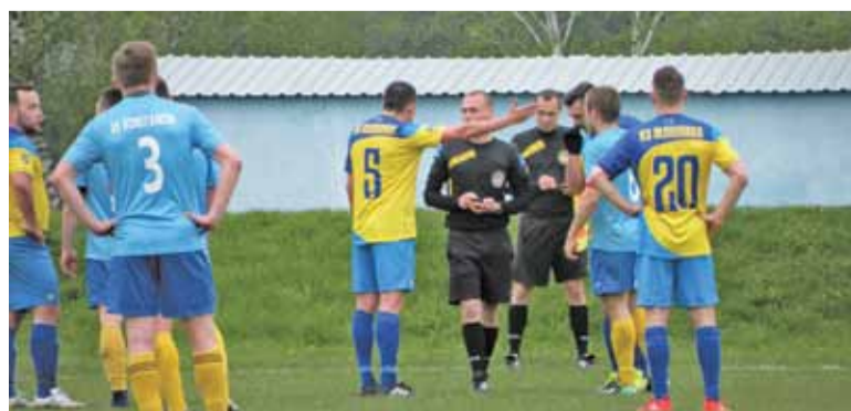
Sędzia meczu z Błonianką pokazał aż trzy czerwone kartki