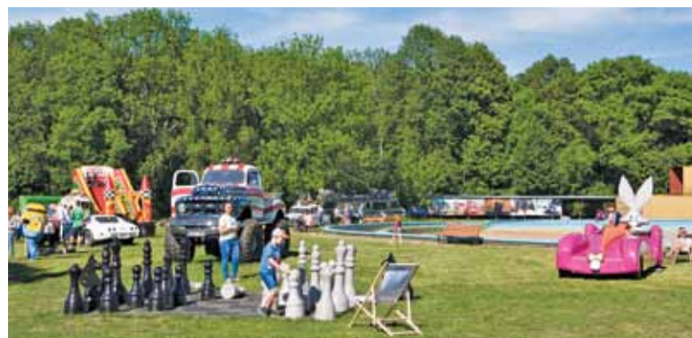
Każdy miał szansę znaleźć dla siebie coś interesującego