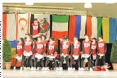
Mistrzowska Formacja Teens&Skills