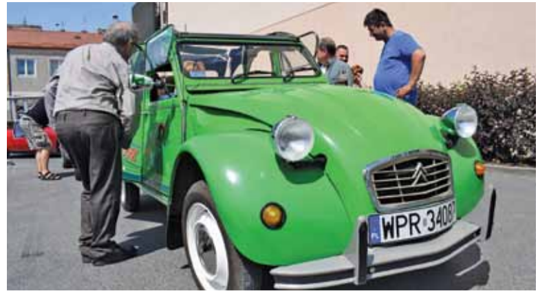
Citroënem 2CV jechali dziadkowie z trójką wnuczków

– Oczywiście żadne z aut nie posiadało klimatyzacji, a niektóre miały problem z ponownym rozruchem silnika, jednak wśród zawodników panowała atmosfera bardziej przypominająca piknik niż rywalizację znaną choćby z wyścigów wraków, które również organizujemy – mówi Łukasz Cabaj z motopiaseczno.pl, organizator.