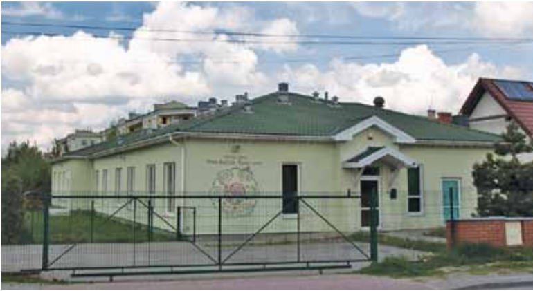
Przedszkole przy ul. Nadarzyńskiej stanie się administracyjnie „filią” przedszkola nr 10 przy ul. Sierakowskiego