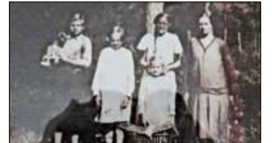
|| Historia - Był uwielbiany przez mieszkańców...