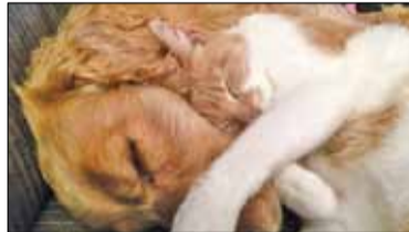
|| Lesznawola - Ruszyła kastracja