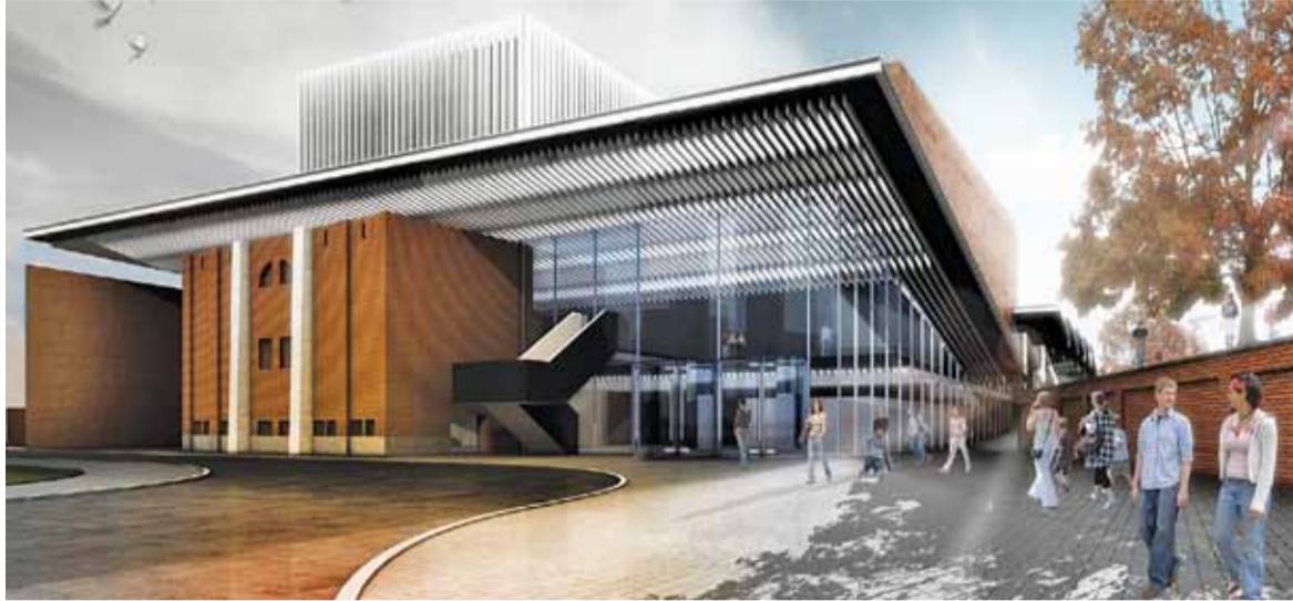
Częściowo przeszklony budynek ma szansę stać się wizytówką miasta