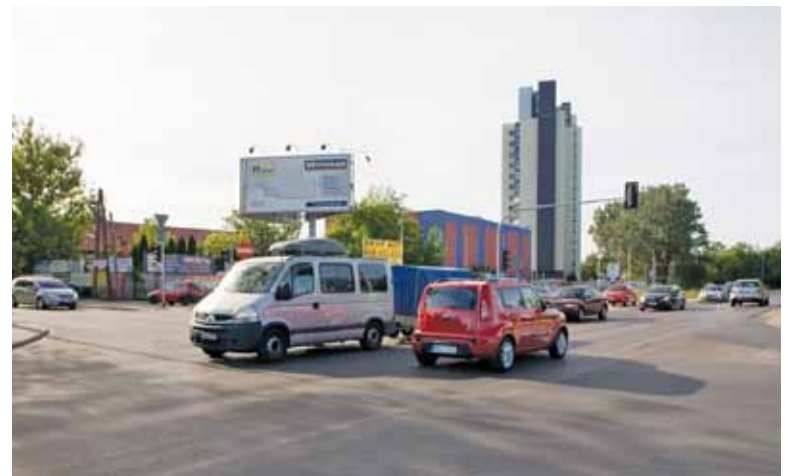
Po przebudowie kierowcy będą musieli się przyzwyczaić do nowej organizacji ruchu na skrzyżowaniu