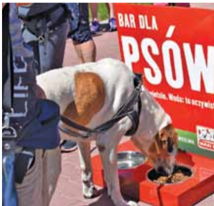
Dzięki sponsorom psy miały swój open bar

– To jest bardzo fajne, że te biegi organizowane są w różnych miejscach. Widać wielu okolicznych mieszkańców, pewnie nie jeżdżą na wszystkie biegi