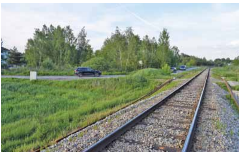
10 KDL będzie łączyć się z Działkową przy torach bocznic