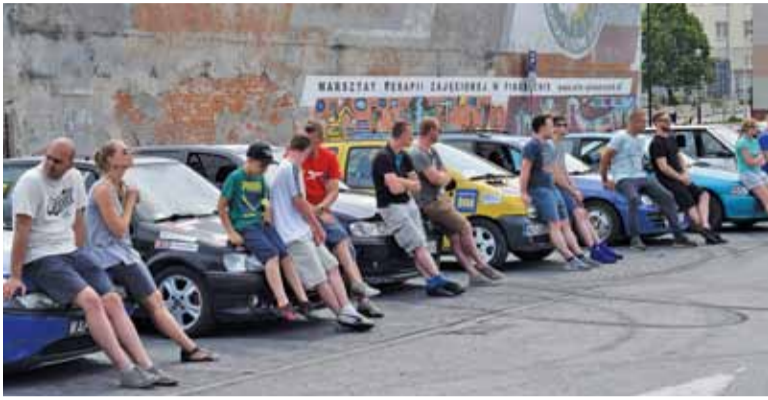
Zawodnicy Rally Piaseczno czekają na rozdanie nagród