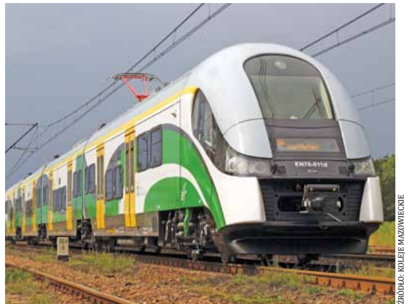
EzT z Pesy w barwach Kolei Mazowieckich