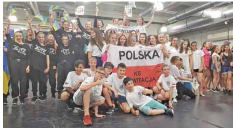
Mistrzowska Formacja Teens&Skills