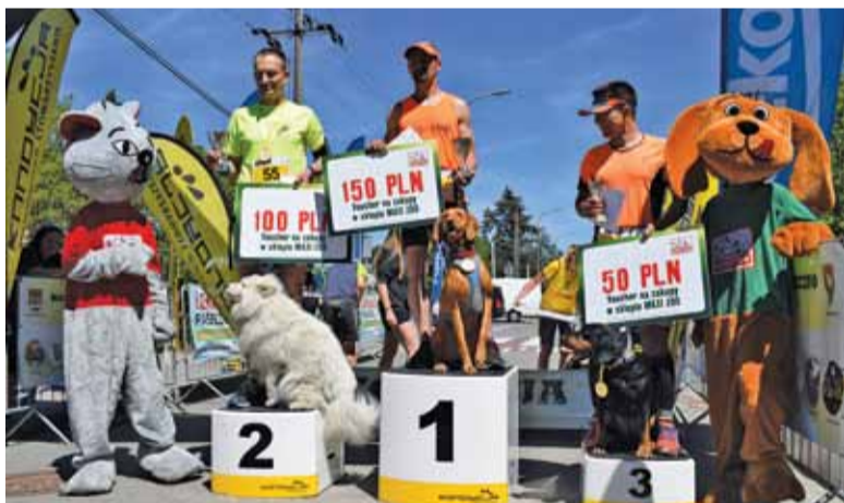
Zwycięskie pupile były przyzwyczajone do podium i do pozowania