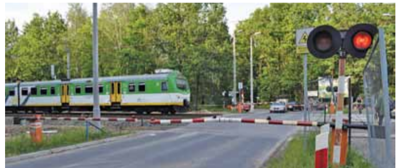
Przejazd w Zalesiu Górnym