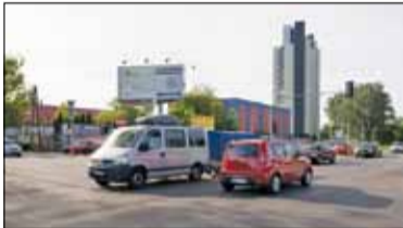
|| Piaseczno - Skrzyżowanie od nowa

PIASECZNO || GÓRA KALWARIA || KONSTANCIN-JEZIORNA || LESZNOWOLA || PRAŻMÓW || TARCZYN