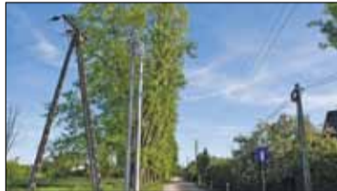
|| Góra Kalwaria - Bareizmy wicznie żywe