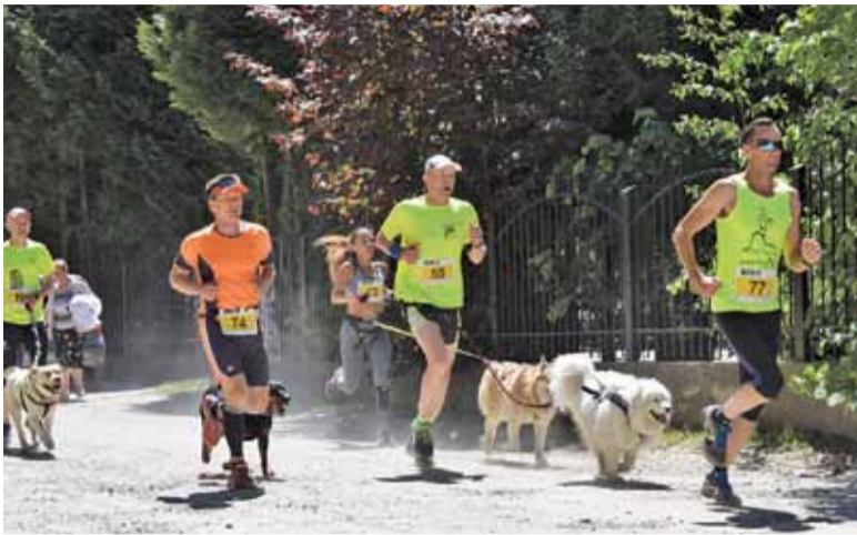
Pomysł biegu z pupilem chwycił