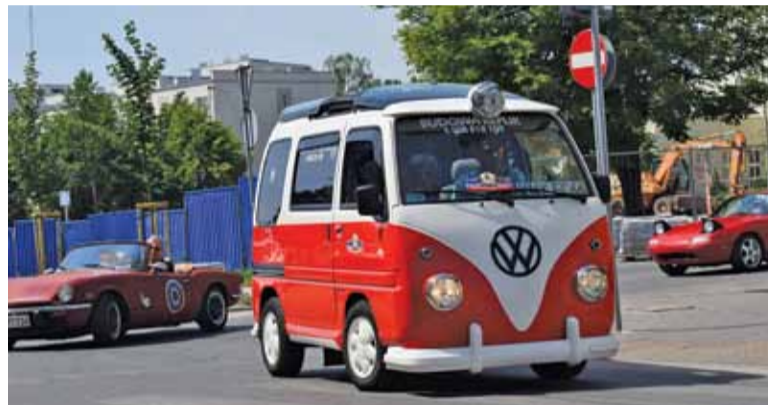
Mini replika VW T1 z Subaru Libero, z Góry Kalwarii