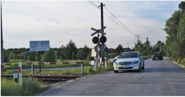
Skrzyżowanie Działkowej z Prawdziwka