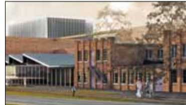
|| Piaseczno - Czy kulturalne marzenia się spełnią? s. 6