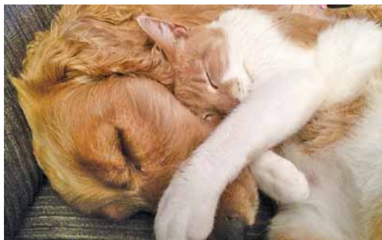
Dofinansowanie do kastracji