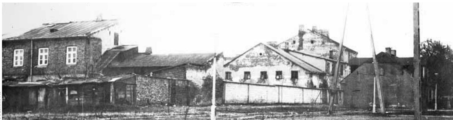
Widok Piaseczna z ulicy Zgoda, zachowany klimat lat 30. XX wieku

napisz do autorki m.sztuomska@przekladpiaseczynski.pl