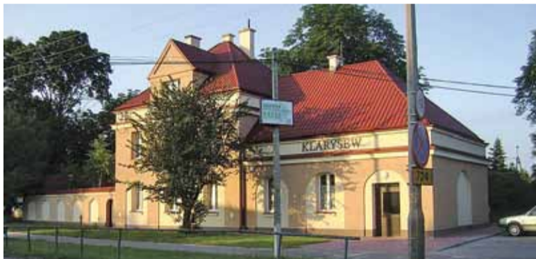
Klarysew (przystanek kolejowy)