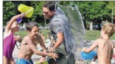
||| Lato w mieście s. 6