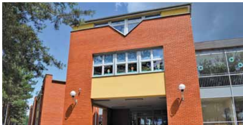
Kto zostanie dyrektorem szkoły przy Kameralnej?