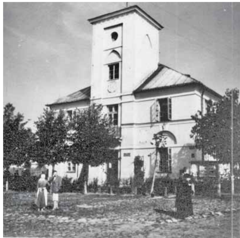
Ratusz, w którym był magistrat miasta

i powtarzał scenę na innej stacji. „Dzień Dobry” pisze: „W sobotę był na stacji w Piasecznie, w niedzielę w Żabieńcu”. Gdy