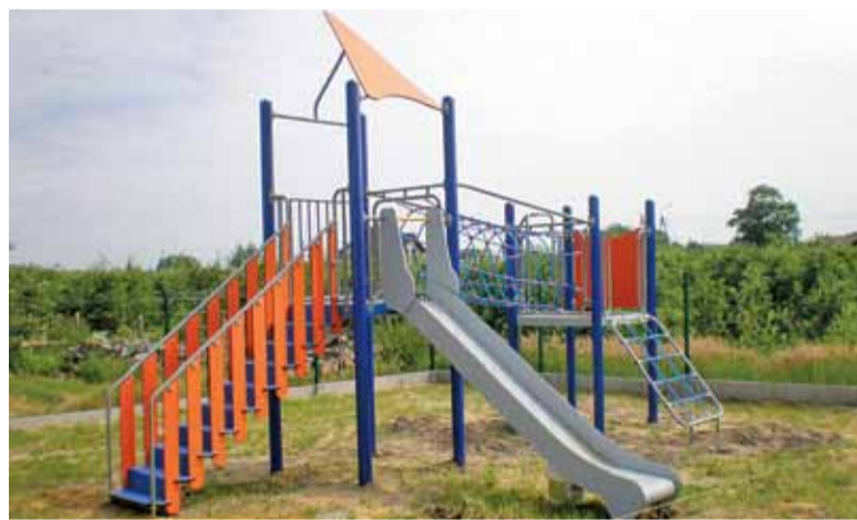
Plac zabaw w Pęcławiu

24 kwietnia do użytku została oddana altana w Szymanowie. Drewniana konstrukcja składa się z części wypoczynkowej oraz części przeznaczony na drobny sprzęt gospodarczy. Kolejny tego typu obiekt powstał w Wólce Dworskiej.