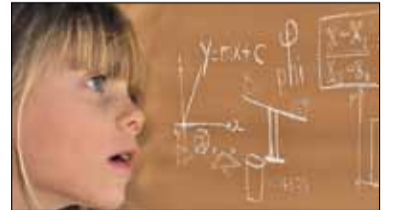
||| Praca domowa do lamusa? s. 9