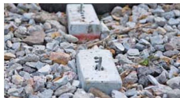
Wejście na taką śrubę nie należałoby do przyjemności

przyspieszenia przez PGE prac związanych ze skablowaniem. – Tam, gdzie to możliwe, alejki mają być wykonywane, tam, gdzie konieczny jest przestój ze względu na prowadzone przez zakład energetyczny prace, finał nastąpi dopiero po ich zakończeniu – poinformował. Teoretycznie wykonawca sieci powinien skończyć prace do sierpnia. Urzędnicy gminy przekonują, że działania związane z rewitalizacją idą zgodnie z harmonogramem i mimo wszystko powinny się zakończyć w połowie sierpnia. Na