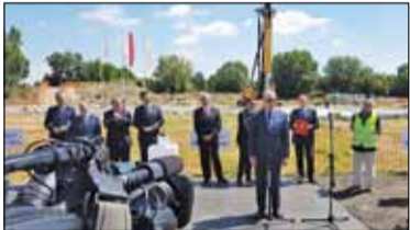
||| Budowa Południowej Obwodnicy Warszawy rozpoczęta s. 4

PIASECZNO ||| GÓRA KALWARIA ||| KONSTANCIN-JEZIORNA ||| LESZNOWOLA ||| PRAŻMÓW ||| TARCZYN