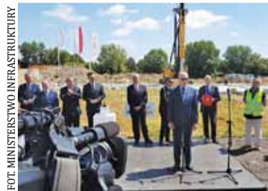
Symboliczne wbijanie pala

– Wojewoda mazowiecki prowadzi postępowania zmierzające do wydania ZRID dla pozostałych odcinków POW – czytamy w komunikacie GDDKiA.