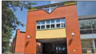
||| Dlaczego unieważniono konkurs na dyrektora? s. 5