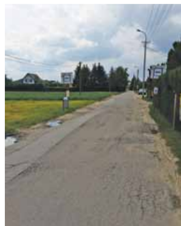
GRN – będą zmiany