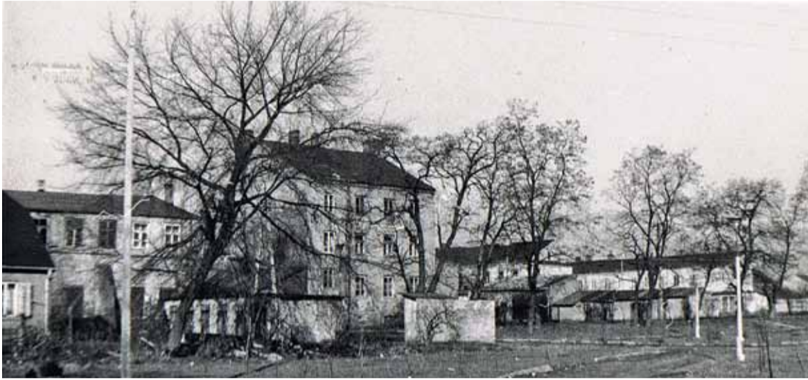
Widok z parku na ulicę Zgoda