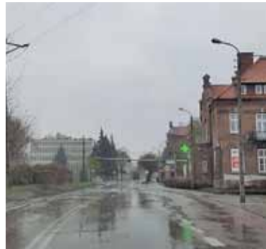
Okolice papierni w Konstancinie