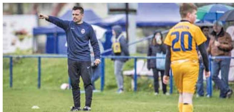
Nowy trener KS Konstancin