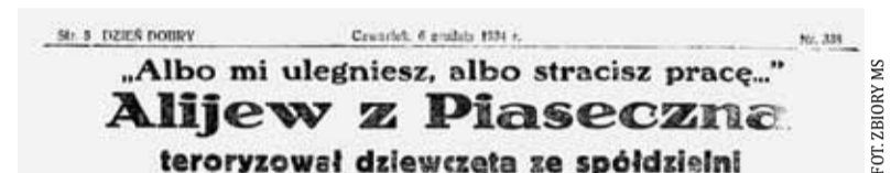
„Dzień dobry” z 1934 roku