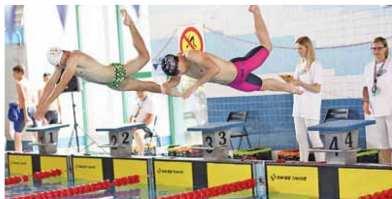
Zawody pływackie w Piasecznie

Gratulujemy i życzymy kolejnych sukcesów! AD