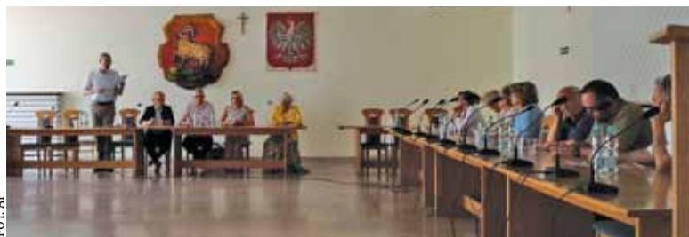
Mieszkańcy narzekali na długi czas oczekiwania na przesyłki