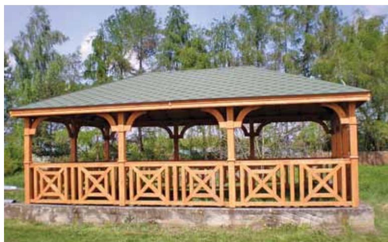
Altana w Wólce Dworskiej

Zawiedziony fan bezpiecznego szlaku pieszo- (nazwisko i adres znane redakcji)