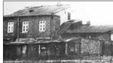
||| Amant z Piaseczna s. 7