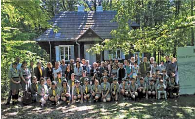
Dom „Zośki” zostanie wykupiony przez Gminę oraz Chorągiew Stołeczną ZHP