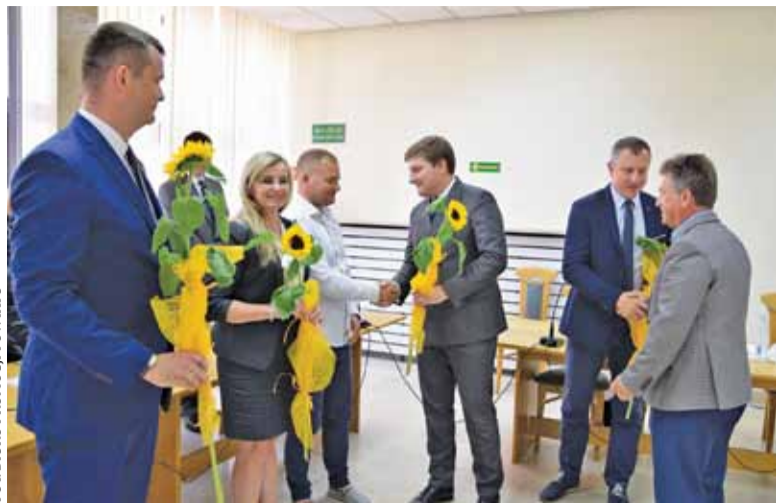
Przewodniczący i wiceprzewodniczący Rady Powiatu wręczyli Zarządowi kwiaty