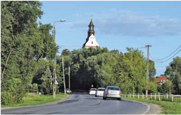
Czy za dwa lata będzie tu chodnik?