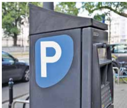
Czy podobne urządzenia staną również w Piasecznie?