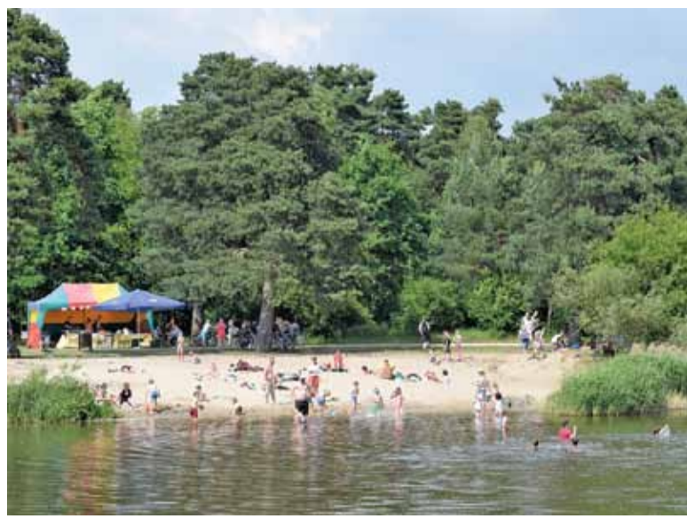
Mimo zakazu na Górkach w ciepłe dni zawsze są chętni do kąpeli