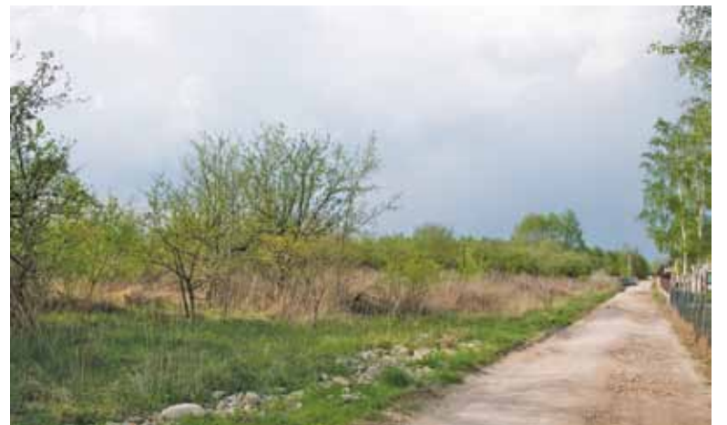
Studenci architektury w wyobraźni i programie graficznym postawili w tym miejscu dużą szkołę

– Chciałbym, żeby kiedyś było głośno o tym, że Piaseczno to miasto zapro-