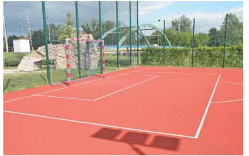
Boisko będzie z nawierzchni poliuretanowej