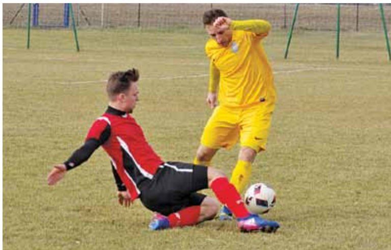
W następnym sezonie KS zagra w lidze okręgowej

Do dalszej przygody z IV ligą zabrakło 10 punktów.