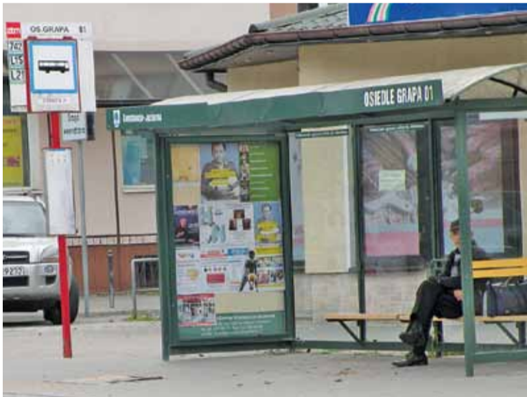
Na Grapie może powstać nowa pętla