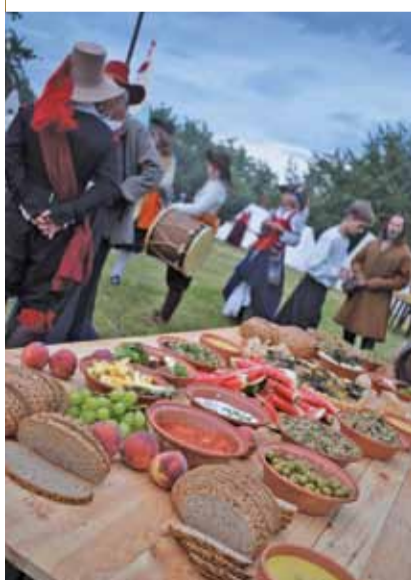
Po bitwie w obozie odbywa się prawdziwa uczta dla rekonstruktorów. W tym roku podano nawet raki