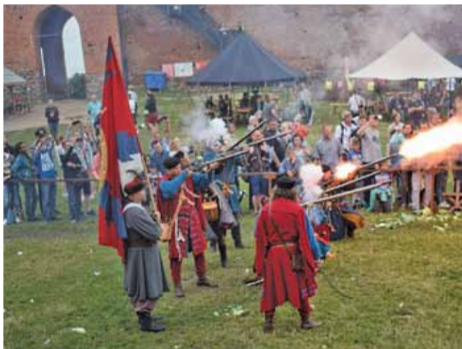
Bitwa na Zamku to zacięta walka z wykorzystaniem broni palnej

ORGANIZATORZY: OŚRODEK KULTURY W GÓRZE KALWARII, SMOCZA KOMPANIA.