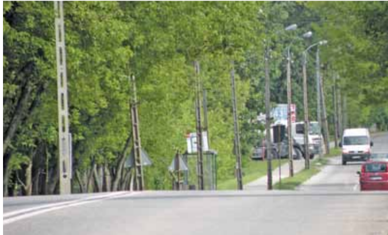
Kto zajmie się przebudową ulicy Mirkowskiej?