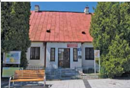
Projekt przebudowy zakładu w gruncie rzeczy postawienie nowego budynku w miejsce zabytku

leń wynika, że znaczącą część planowanych robót GDDKiA zrealizuje w formie remontu drogi ze środków własnych”.