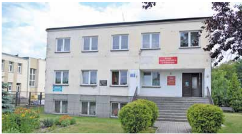
Biblioteka funkcjonuje w piwnicy Domu Nauczyciela obok siedziby Starostwa Powiatowego