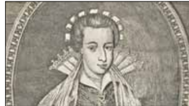
|| Historia - Opowieść o Annie z Radziwiłłów s. 7