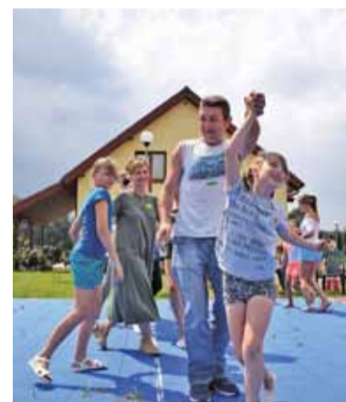
ŹRÓDŁO: POWIATOWE BIURO PROMOCJI

ników stworzył swój własny papierowy dom, a symboliczne miasteczko zostało ustawione na placu obok Krzyża Papieskiego w Piasecznie.