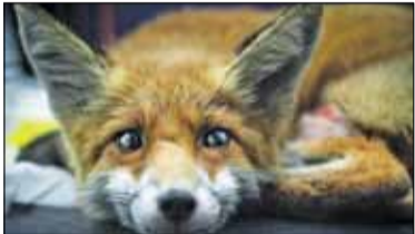
|| Konstancin-Jeziorna - Kto zapłaci za lisa? s. 3

PIASECZNO || GÓRA KALWARIA || KONSTANCIN-JEZIORNA || LESZNOWOLA || PRAŻMÓW || TARCZYN