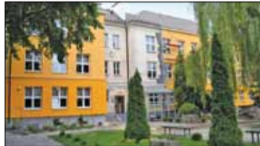
|| Piaseczno - „Chyliczkowska” najlepsza! s. 4