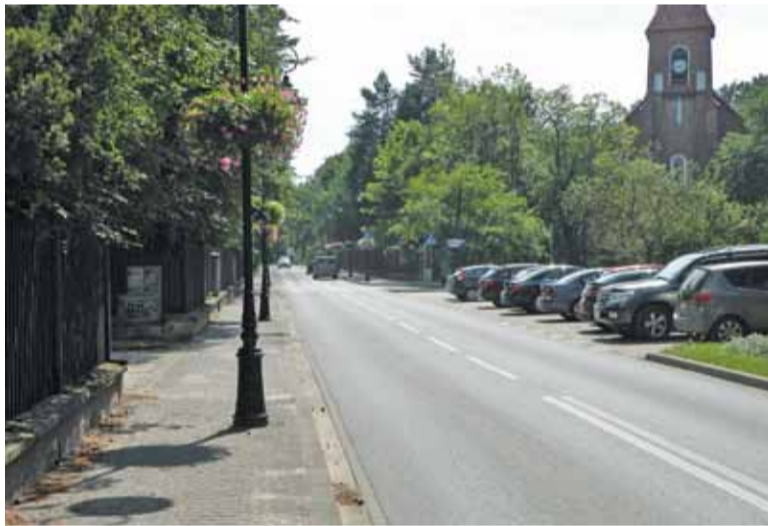
Ulica Piłsudskiego w Konstancinie

– W ostatnim czasie kilkakrotnie mieszkańcy ścisłego centrum Konstancina zwracali się do mnie z prośbą o interwencję w sprawie zwiększonego istotnie ruchu tranzytowego ulicy Piłsudskiego. Dotyczy to również ruchu ciężarówek, które przejeżdżają przez centrum uzdrowskiego Konstancina. Zdaję sobie sprawę, że zarówno ulica Piłsudskiego, jak i ulica Prusa są drogami powiatowymi, a co za tym idzie, organizacja ruchu na nich nie leży w kompetencjach naszej gminy. Z drugiej strony jednak ulice te są niewyalnizalne dla centrum i jego charakteru uzdrowi-