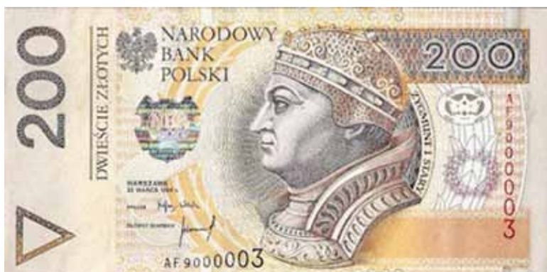
Zygmunt I Stary na banknocie 200 zł

napisz do autorki m.szturowska@przegladpiaseczynski.pl