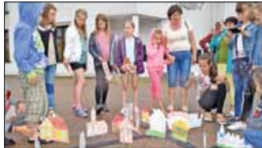
|| Powiat - Wizyta dzieci i młodzieży z Ukrainy s. 4