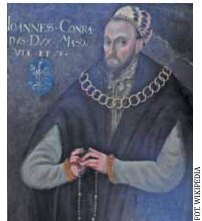
Konrad III Rudy książę mazowiecki

cydowanie okresem rozwoju. Miasto otrzymało szereg przywilejów, między innymi przywilej odbywania jarmarku i wyznaczenia dnia targowego (dokument z czerwca 1513 roku). Anna chętnie przebywała we dworze księżęcym w Piasecznie, świadczą o tym dokumenty pisane i datowane w różnych okresach jej w mieście bytności. Dwór w Piasecznie traktowała jako rezydencję księżęcą, co dawało miastu rewerencje. Rozwo-