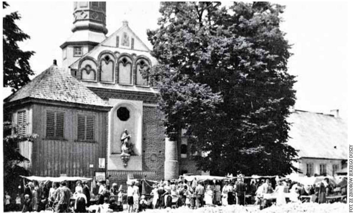
Odpust w Piasecznie lata 60.-70. XX

temu i miejsce, i pogoda. Niestety książę nagle traci siły, czuje uciekające z niego życie. Do Osiecka przybywa żona z dziećmi. Ku rozpaczy obecnych Konrad III umiera 28 października. Żona Konrada, Anna, córka Mikołaja II Radziwiłła i Zofii Monwidówny, w chwili śmierci męża ma 27 lat i pozostaje samotna z czworgiem dzieci. Synowie: trzyletni Stanisław i Janusz niemowlę zaledwie roczne są dziedzicami władzy nad Mazowszem i jak pisze o nich Felicjan Antoni Kozłowski w „Dziejach Mazowsza za panowania książąt” – „to dwie wątłe gałązki z bujnego niegdyś rodu Piastów”. Linia męska rodu Piastów mazowieckich jest zagrożona. Córki: Anna i Zofia, starsze od braci, odegrają też w