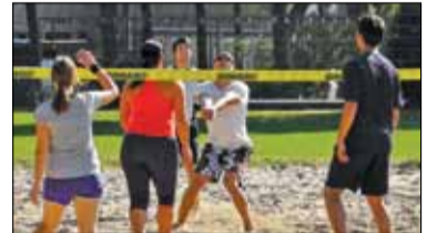
|| Sport - Siatkówka plażowa s. 8