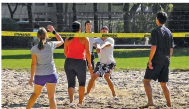
Powalczą o tytuł mistrza plażówki

W niedzielę 6 sierpnia na boiskach OSiR przy ulicy Pijarskiej (obok basenu) w Górze Kalwarii odbędzie się II Grand Prix Góry Kalwarii 2017 w siatkówce plażowej mikstów. Organizatorami imprezy będą: Ośrodek Sportu i Rekreacji w Górze Kalwarii oraz Uczniowski Klub Sportowy „Budowlani” Góra Kalwaria. Turniej ma trwać od godziny 9.00 do 17.00.