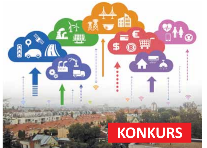
Konkurs to szansa dla miast stworzenia przyjaznej przestrzeni

W I etapie konkursu MR wybierze 50 tzw. fiszek projektowych, które mają składać do 16 października 2017 r. zainteresowane samorządy. W niej musi