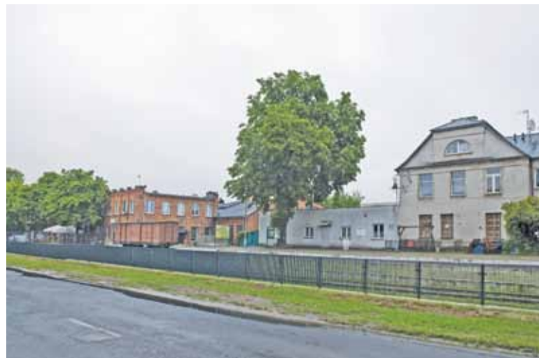
Prace modernizacyjne gmina rozpoczęła od wymiany ogrodzenia

Jako pierwsza ma być zrealizowana budowa hali głównej. To tu oprócz kas i informacji ma się znaleźć nowa, duża sala widowiskowa dla Piaseczna. Druga część projektu to budynki, w których mieszczą się obecnie restauracje, biuro