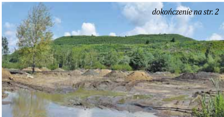
dokończenie na str. 2

Marek Rutowicz przyznał, że nie wie, kto nakręca taką atmosferę, że te-