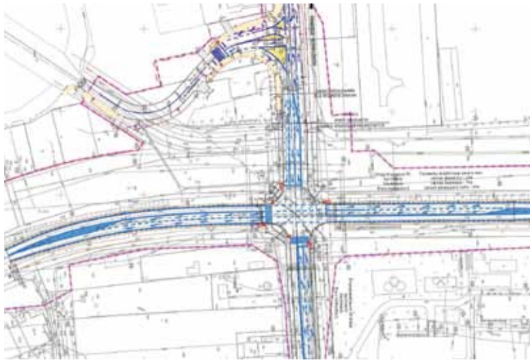
Ostateczny kształt skrzyżowania zaproponowany przez GDDKiA