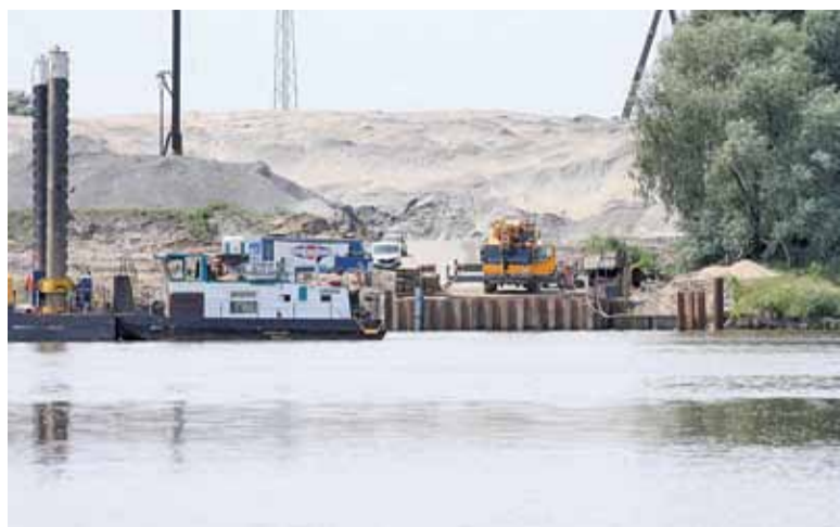
Budowa mostu na Wiśle