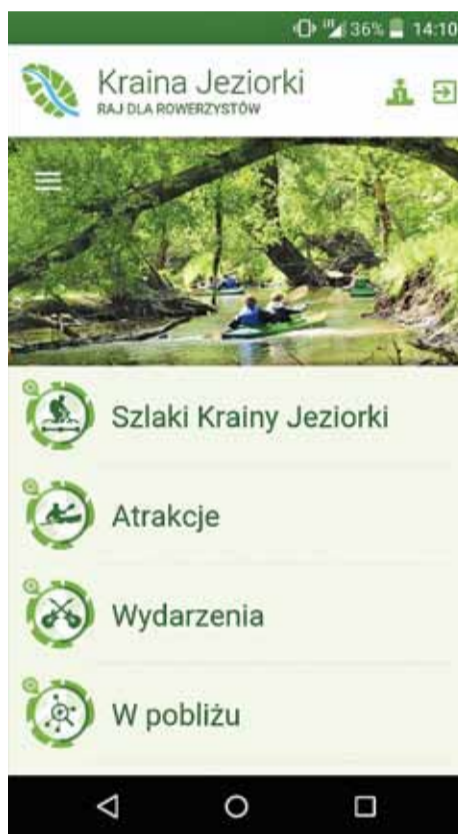
Aplikacja Kraina Jeziorki