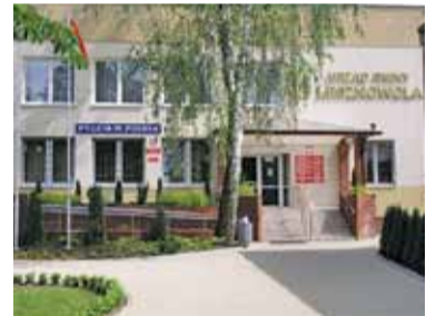
W Urzędzie Gminy Lesznowola od 10 lat można zapłacić kartą

Próbowaliśmy się dowiedzieć, czy jakieś urzędy z naszego powiatu wyra-