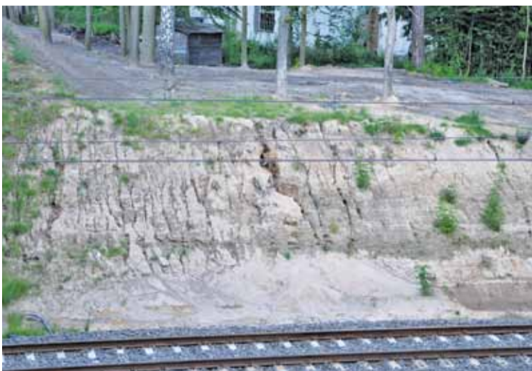
Nowe nasypy nie najlepiej znoszą opady deszczu