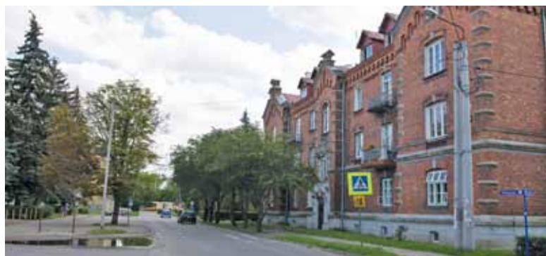
Mirkowską czekają niebawem dwie budowy