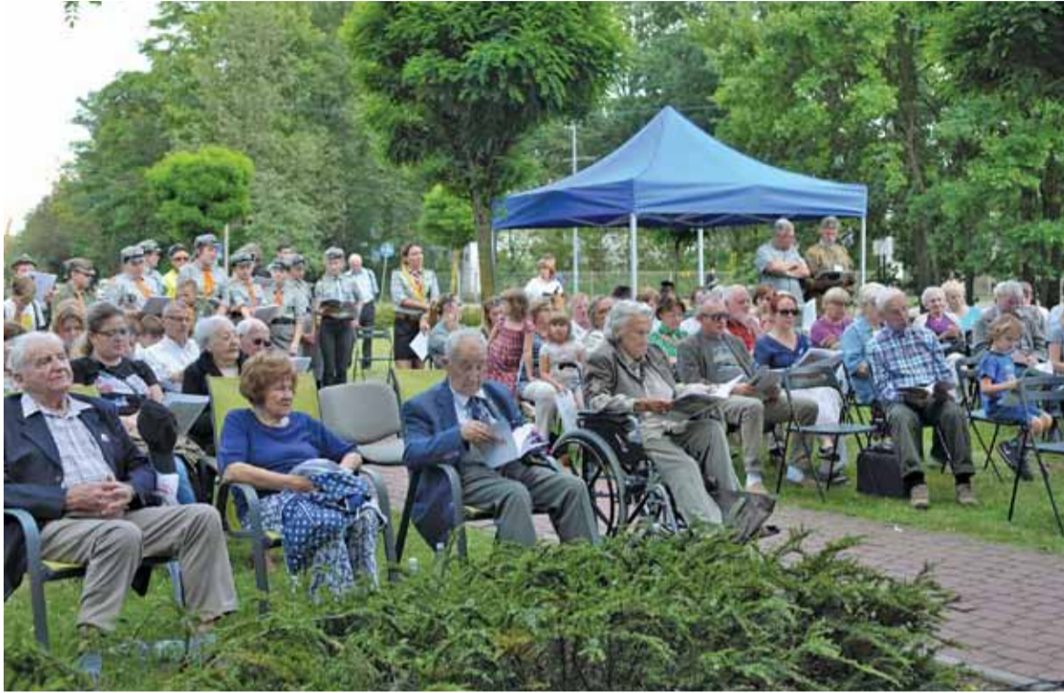
Muzyka łączy pokolenia