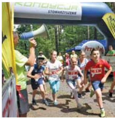
Jeden z biegów organizowanych przez Stowarzyszenie – Bieg św. Jana

jest upowszechnianie i popularyzacja szeroko rozumianej aktywności sportowej i zdrowego stylu życia wśród mieszkańców regionu. Cel ten realizujemy poprzez: czynny udział w życiu sportowym, kulturalnym i społecznym regionu, wyszukiwanie talentów lekkoatletycznych wśród młodzieży i wspieranie ich rozwoju sportowego, szkolenie zawodników w różnych grupach wiekowych i na różnych poziomach zaawansowania, propagowanie biegania oraz nordic walking wśród mieszkańców jako elementu zdrowego stylu życia oraz organizację imprez sportowych i rekreacyjnych.