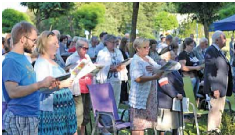
Zalesianie włączyli się we wspólne śpiewanie