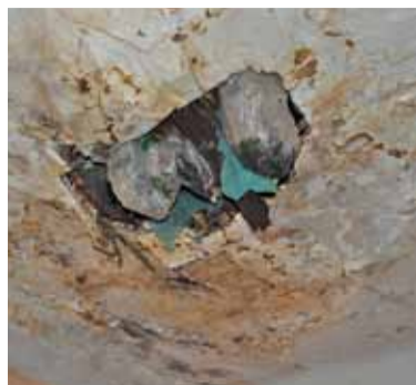
Przez sufit w czasie deszczu woda leje się wiadrami

Jeżeli nie, pani D. będzie mogła wypowiedzieć im umowę dożywotniego użytkownika z 3-miesięcznym okresem wypowiedzenia. W umowie nie ma wzmianki o stanie budynku. Sugeruje ona także, że mają remontować cały budynek, chociaż prawo dożywotniego mieszkania mają wyłącznie na parterze.