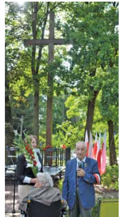
Hołd poległym złożył jeden z żyjących powstańców

częściach Polski, zostali następnie przez harcerzy obdarowani parą goździków w barwach narodowych, po czym przyszedł czas na koncert „Magii Muzyki Kameralnej”.