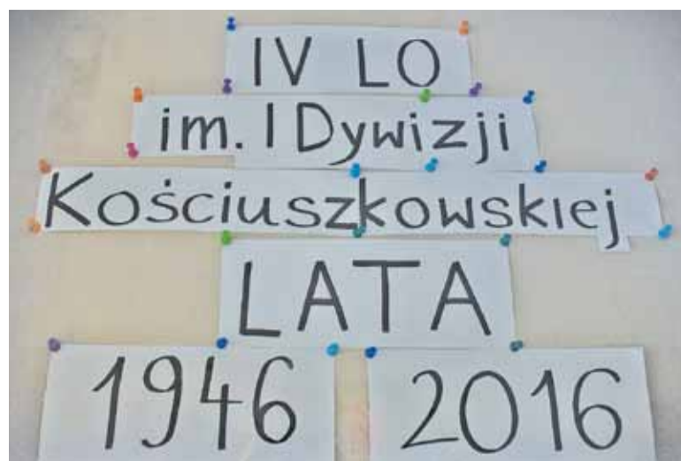
Czy nazwa LO kwalifikuje się do dekomunizacji?