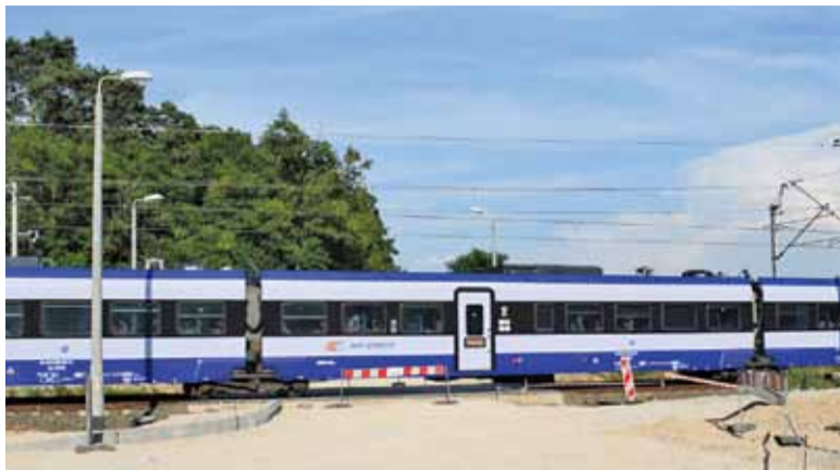
Przejazd jest zamknięty od 9 czerwca