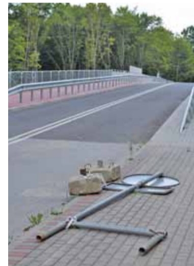
Zniecierpliwieni użytkownicy przewrócili znaki