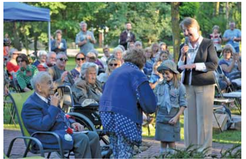
Harcerze wręczyli kwiaty seniorom

Ostatnia z nich dotyczyła historii, którą opowiedział mu niegdyś jeden z członków Szarych Szeregów o spotkaniu ze starszym panem, który podlewał pelargonie, zapytał: „Kiedy ten naród będzie mógł nareszcie spokojnie podlewać pelargonie?”