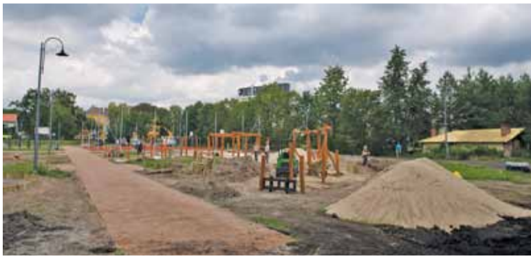
Miejmy nadzieję, że utwardzenie poprawi jakość nawierzchni alejek