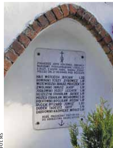
Tablica pamiątkowa ku czci poległych w bitwie w Pęcicach

Jednak wydarzenia z 2 sierpnia 1944 roku w Pęcicach są dla mnie tak dramatyczne, że wracam co rok myślami do nich i zadaję pytanie – „Kto podjął tak ryzykowną decyzję?”. Nikt nie został rozliczony z tych postanowień, nikogo oficjalnie nie zapytano o strategię bitwy. Kilka osób biorących udział w tej bitwie znałam osobiście, znałam piaseczyńskie rodziny, które straciły swoich bliskich w tym strasnym boju. Pokolenie Powstańców Warszawskich jeszcze do lat 90. XX wieku brało udział w obchodach rocznic bitwy w Pęcicach, ale powoli weterani walki odchodzili do wieczności i dziś niewiele osób pamięta, aby