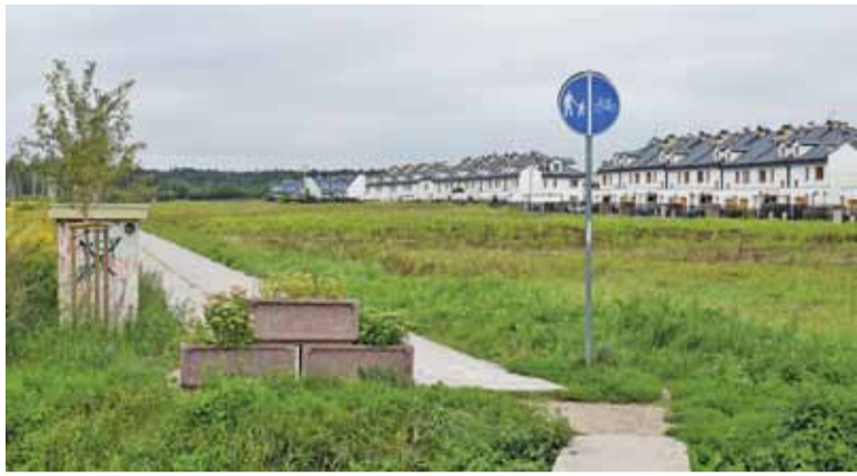
Według projektu planu po obydwu stronach „deptaka Hanki” nie powstaną już monstralne domy