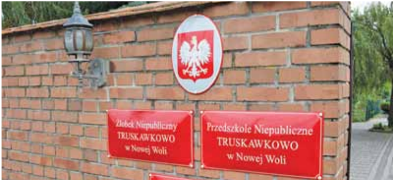
Rodzice chcą, aby ich dzieci uczęszczali do Truskawkowa