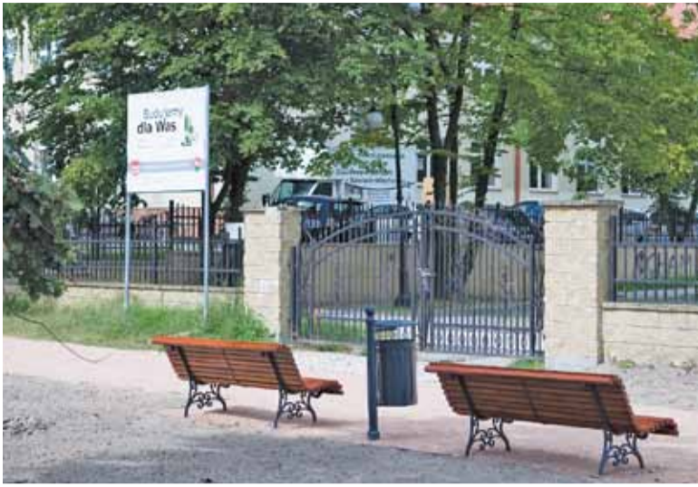
Widok z kilku parkowych ławek na ogrodzenie i parking wydaje się spacerowiczom nieco absurdalny