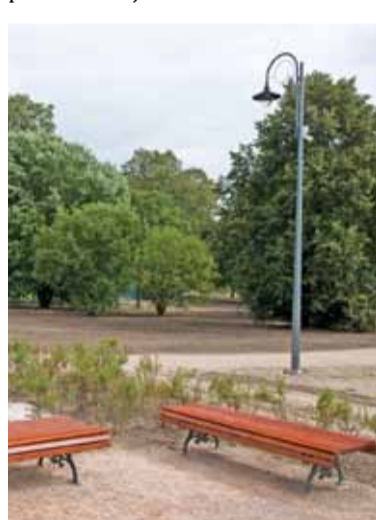
W parku pojawiają się pierwsze krzewy i młode drzewka

– Wkrótce (za tydzień, może dwa) zostaną uruchomione, czekamy na przyłącze energetyczne – informuje Łukasz Wyleziński z Biura Promocji. – Na początku kamery będą tylko rejestrowały obraz (zakupiony jest już rejestrator), w kolejnym etapie zostaną podłączone do centrum monitoringu i będzie wtedy możliwy podgląd online na sytuację w parku – dodaje.