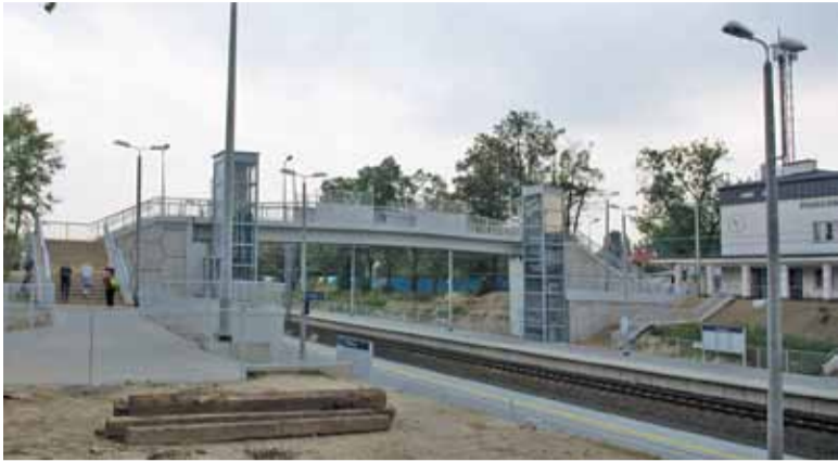
Mieszkańcy już korzystają z nowej kładki