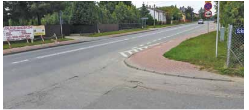
Już niedługo będą tu światła