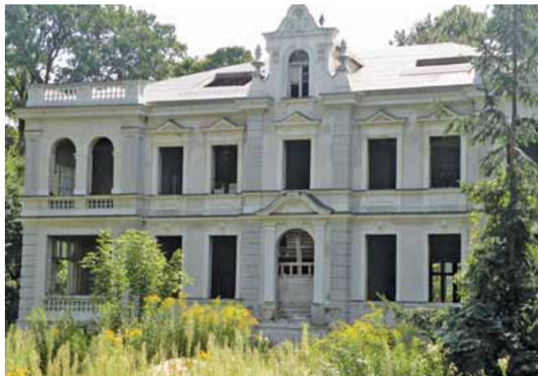
Od pewnego czasu na budowie nie dzieje się nic

Faktycznie kierujący działalnością firmy członek rady nadzorczej spółki