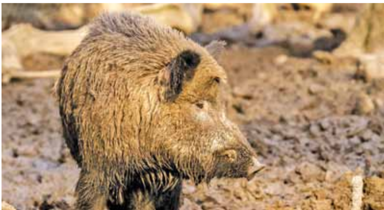
Mieszkańcy narzekają na pojawiające się w centrum miast dziki