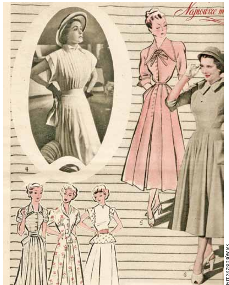
„Moda i życie” z 1949 roku

Lata czterdzieste to też oczywiście długie spodnie. Najczęściej z lnu, pojawia się też gabardyna w czasie wojny niedostępna. Jak moda to i fotograf, i jego