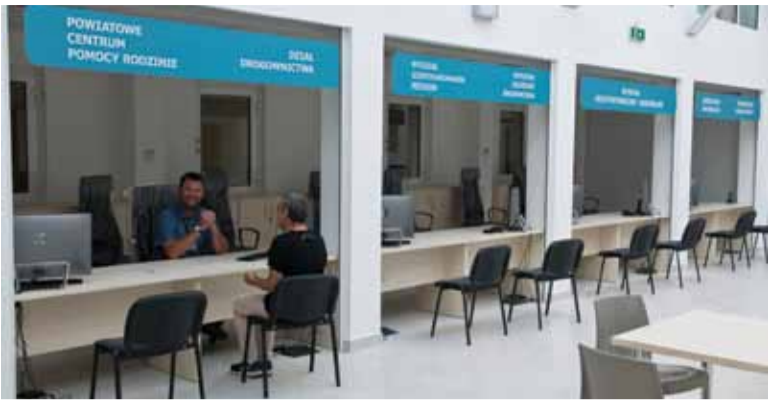
Na mieszkańców czeka już 8 stanowisk obsługi