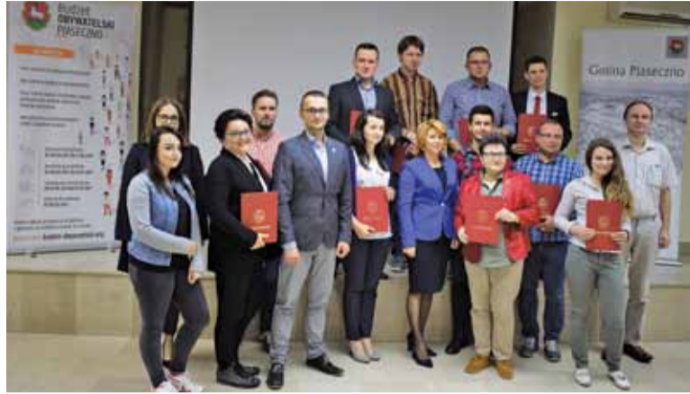
Pomysłodawcy na prezentacji projektów w Urzędzie Gminy