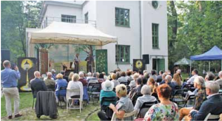
Spektakl „Podkowianin aktorem”

W weekend 26-27 sierpnia odbyła się X edycja Festiwalu Otwarte Ogrody w Zalesiu Dolnym.