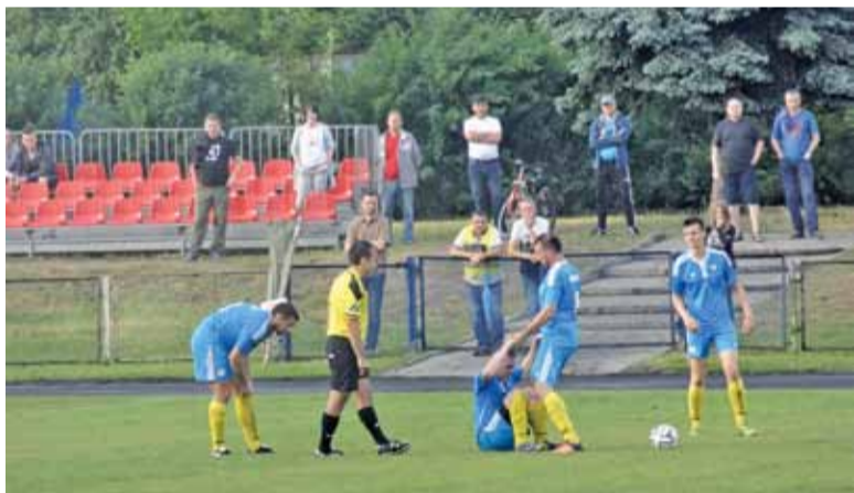
Kibice liczą na to, że piłkarze wreszcie wstaną z kolan