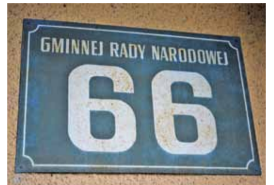
Ulica Gminnej Rady Narodowej to bardzo długa nazwa. Gminna ulżyłaby mieszkańcom