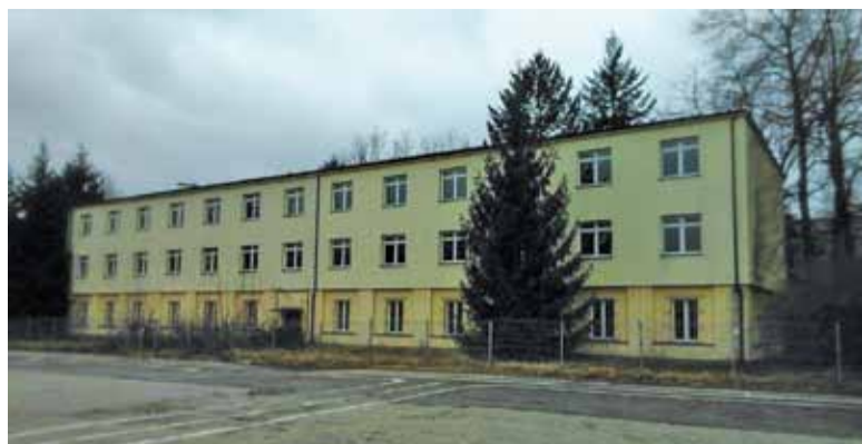
Starostwo ogłosiło kolejny przetarg