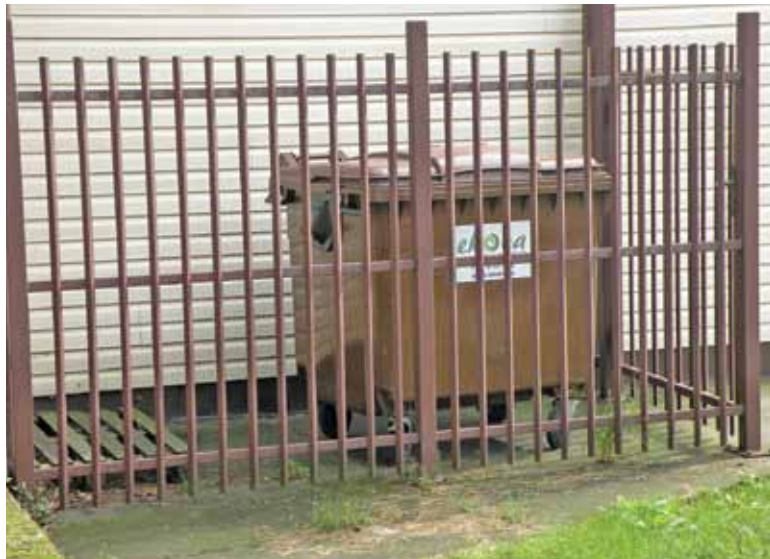
Złodziej może na tym nieźle zarobić

– Stało się to w nocy pomiędzy 14 a 17 lipca. Naszą reakcją było zgłoszenie kradzieży na policji. Sprawca niestety nie został złapany, chociaż udało nam się ustalić, kto to prawdopodobnie był, przekazaliśmy informację policji. Te śmietniki zostały skradzione w kilkunastu miejscach, kilkunastu osobom