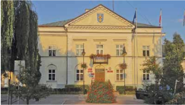
Ratusz nie może sobie pozwolić na ceny proponowane przez wykonawców