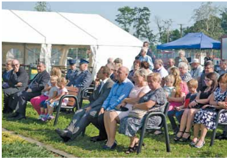
Na widowni zasiedli między innymi samorządowcy i reprezentanci lokalnych instytucji

odbyły się w ostatnią sobotę. Oprócz dziękczynnej Mszy Świętej tradycyjnie nastąpiło dzielenie się chlebem.