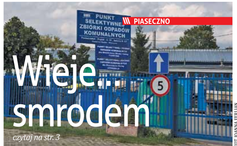
Na niewielki plac przy ul. Technicznej trafiają różne odpady. Najbardziej spektakularny fetor wydzielają organiczne