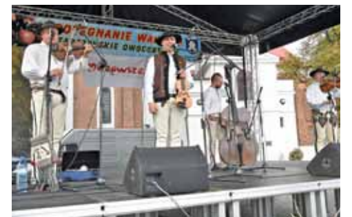
...i formacji Góralska Hora