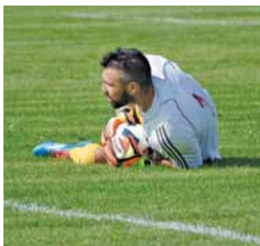
Jedna z niewielu interwencji bramkarza Gromu w tym spotkaniu

Dość szybsze tempo gry, dokładne podania, szybkie ataki skrzydłami i dobrze bite stałe fragmenty gry poskutkowały aż pięcioma trafieniami warsza-