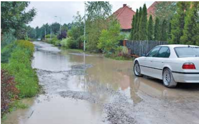
Ulice Jaskółcza i Kukułcza w Jastrzębie zdecydowanie potrzebują remontu