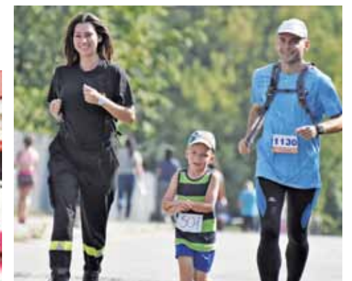
Uczestnicy Biegu Rodzinnego cieszyli się ze wspólnego uczestnictwa w zawodach