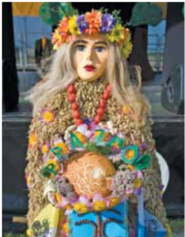
Pannę Prażmowską wykonała jedna z mieszkanek

Jak co roku pod koniec lata rolnicy świętowali koniec plonów i dziękowali za zbiory. Prażmowskie dożynki