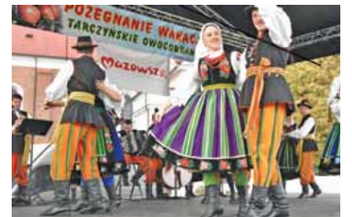
Artystycznym zwieńczeniem Owocobrania były pełne góralskiego temperamentu występy Ludowego Zespołu Artystycznego Promni...