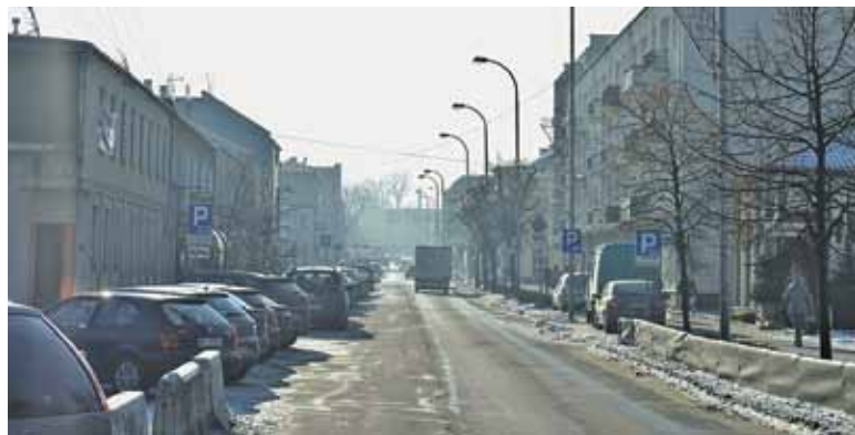
Potrzebne jest rozporządzenie abyśmy sami przestali się truć