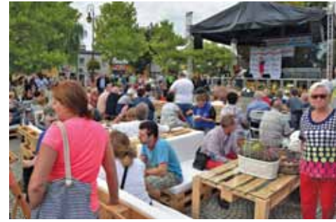
Rynek miasta wypełniony był różnymi atrakcjami