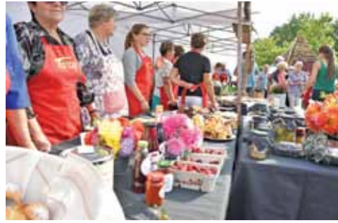
Podczas Owocobrania można było skosztować m.in. aromatycznych, świeżych wędlin, pieczywa, różnego rodzaju dań na gorąco czy też upieczonych po mistrzowsku ciast