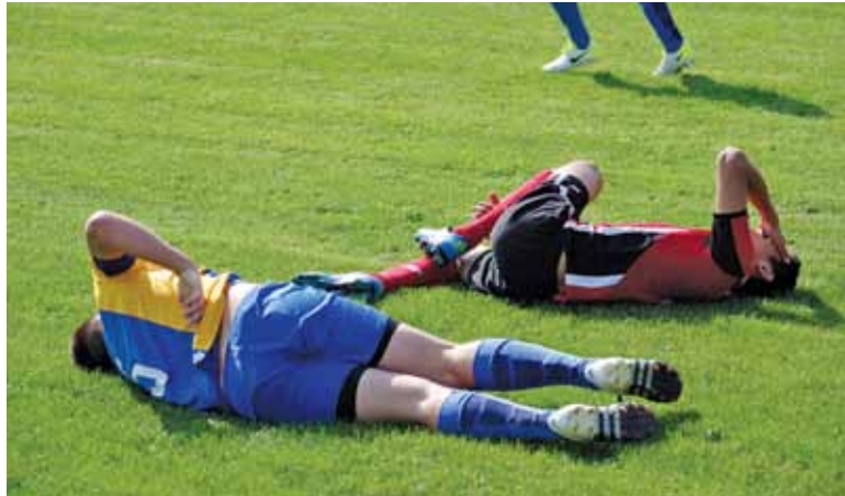
Rannych nie brakowało, ale całą bitwę wygrał Grom