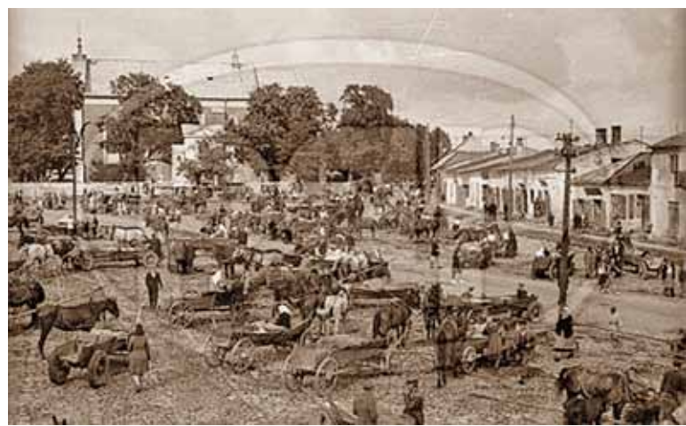
Tarczyn, targ na rynku w 1967 roku