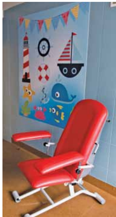
Gabinet przyjazny dzieciom w publicznej placówce

pacjentów, ale też izolację pacjentów dorosłych, którzy mogą być nosicielami zupełnie innych drobnoustrojów niż te dotykające najmłodszych.