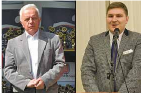
Kto w tym sporze ma rację?