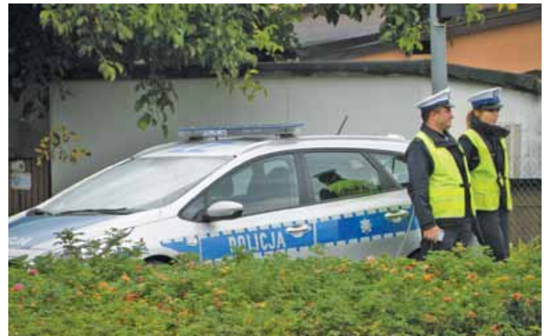
Światła na rondzie przy ulic Borowej