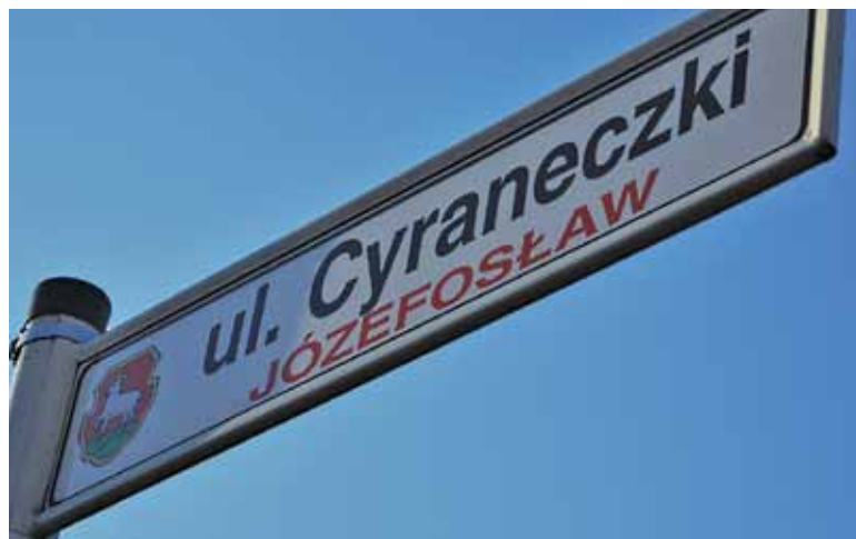
Ulica Cyraneczki zostanie w końcu połączona z Puławską?

Niedoszła główna ulica miejscowości nie miała szczęścia od początku. Brakowało jej m.in. 70 metrów asfaltu, od ulicy Julianowskiej w stronę osiedla La Village. Ten odcinek udało się gminie wybudować rok temu. Teraz gmina dostała zezwolenie na realizację inwestycji drogowej (ZRID) na budowę odcinka od ulicy Ogrodowej do granicy gminy Lesznowlą, czyli nowa droga będzie przecinać Osiedlową