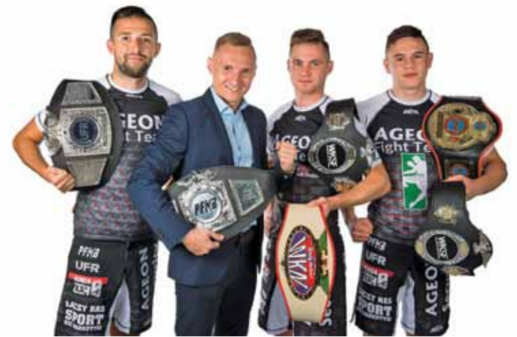
„Jako sportowiec jestem świadom potrzeb zawodników i ich trudnej sytuacji finansowej oraz idei społecznej odpowiedzialności biznesu”

Dość szybsze tempo gry, dokładne podania, szybkie ataki skrzydłami i dobrze bite stałe fragmenty gry poskutkowały aż pięcioma trafieniami warsza-