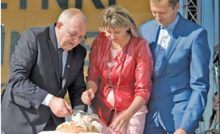
Chleba pokrojonego przez wójta wystarczyło dla wszystkich zebranych na placu przy UG