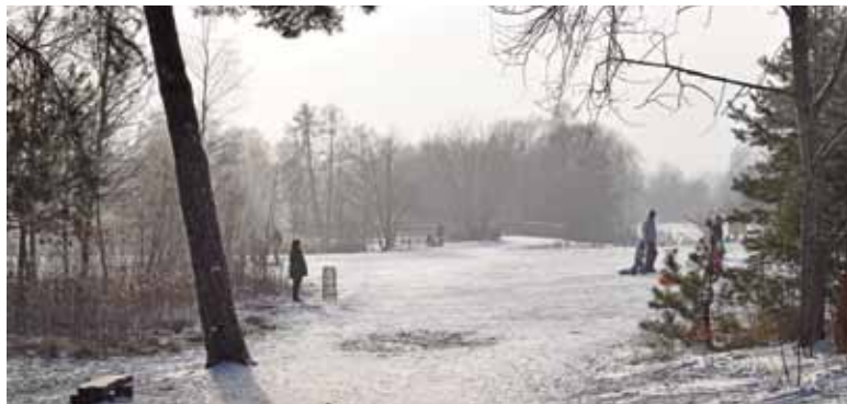
W poprzednim sezonie jesienno – zimowym, trudno było w Piasecznie zaprzeczyć istnieniu smogu

Rozporządzenie w sprawie wymagań dla kotłów nie rozwiąże problemów ze smogiem, chociaż tak jak wyżej