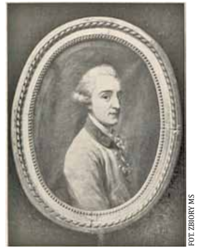
Książę Andrzej Poniatowski