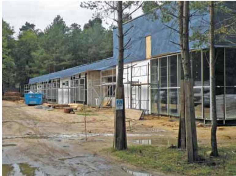
Przedszkole rośnie jak na drożdżach