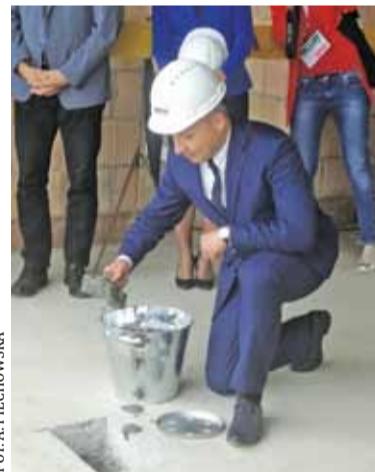
Przedstawiciele gminy wmurowali kamień węgielny

Ta długo wyczekiwana inwestycja zapewni nowe miejsca nauki dla około 600 uczniów, a także 250 dzieci w zaplanowanym przedszkolu. Dzieci zyskają również dostęp do dużej hali sportowo-widowiskowej oraz zaplecza sportowo-rekreacyjnego na świeżym powietrzu. Centralna część budynku przeznaczona będzie na ogólnodostępne Centrum Multimedialne z biblioteką,