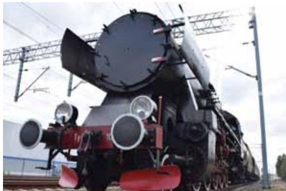
Seria Ty42 była budowana po wojnie, na podstawie dokumentacji, którą pozostawili po sobie Niemcy