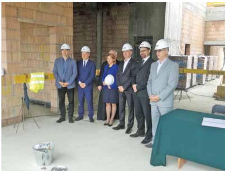
Z CEM będą mogli korzystać wszyscy mieszkańcy

Termin zakończenia budowy planowany jest na koniec 2018 r.