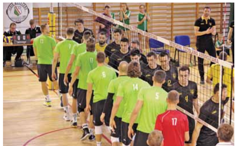
Początek meczu w Piasecznie

– Zaczęliśmy bardzo dobrze, naskoczyliśmy na nich i ten set kontrolowaliśmy od początku do końca. Dobrze zagrywaliśmy, dobrze graliśmy na kontrze, drugi set także, tylko że oni nam uciekli w końcówce i gdzieś tam troszkę się pogubiła ta gra. Trzeci i czwarty set był już zupełnie pod ich kontrolą, straciliśmy panowanie nad nimi.