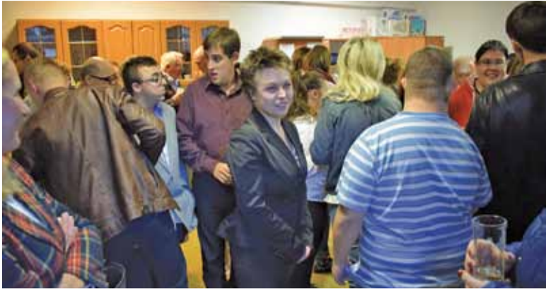
Na otwarciu Klubu gości było tak dużo, że się nie mieścili