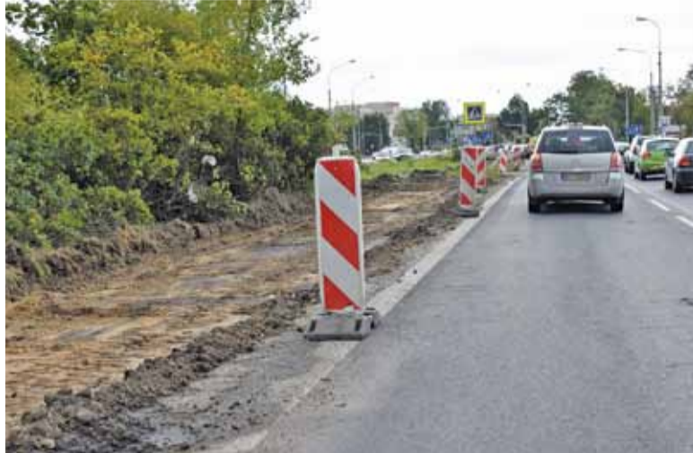
Wjazd od strony Puławskiej

Gmina Piaseczno stwierdziła, że w takim razie dołoży odpowiednią sumę, by zwiększyć zakres prac, bo chociaż nie jest zarządcą, to nie ulega wątpliwości fakt, że każdy jej mieszkaniec skorzystałby z takiego rozwiązania.