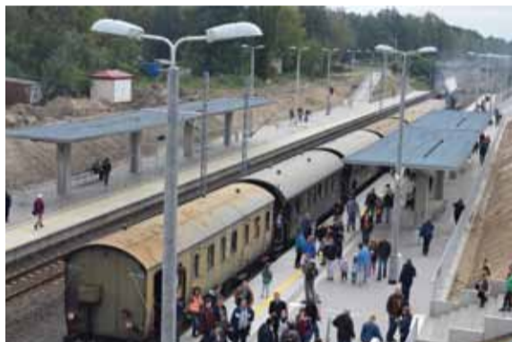
Dymiący parowóz wraz z pociągiem retro stojący przy nowym peronie stacji Piaseczno robił niezwykłe wrażenie