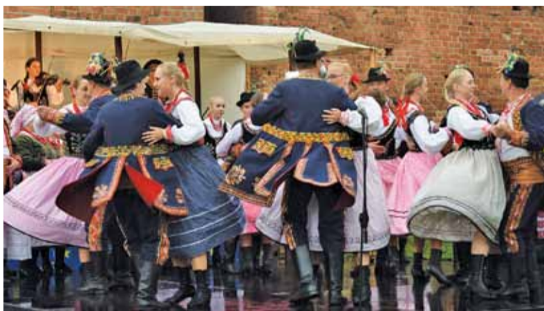
Regionalny Zespół Pieśni i Tańca „Podegrodzie” na tle murów zamku prezentował się wspaniale

Jedną z atrakcji Europejskich Dni Dziedzictwa było otwarcie komnaty tronowej w wieży bramnej