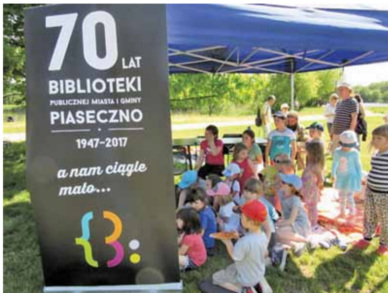
Baner biblioteki podczas Świąta Latawca