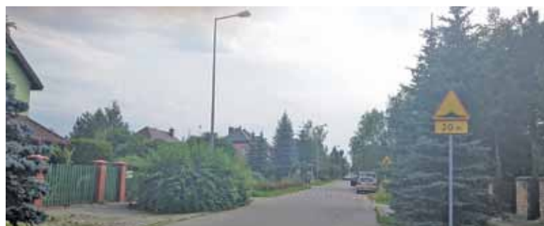
Jedna z ulic w sołectwie

A.P.: Mocną stroną jest na pewno położenie. Myślę, że ludzie są zadowoleni z mieszkania tu. Jest cicho i spokojnie. Mamy mikroklimat – wkoło leje, a u nas nie, jest dużo zieleni. Na dodatek jest u nas bardzo bezpiecznie, nie ma kradzieży. Nie ma awantur, stosunki sąsiadzkie są dobre. Wydaje mi się, że właśnie to mocne strony – cisza, spokój i zieleń, czyli to, czego ludzie potrzebują do życia.