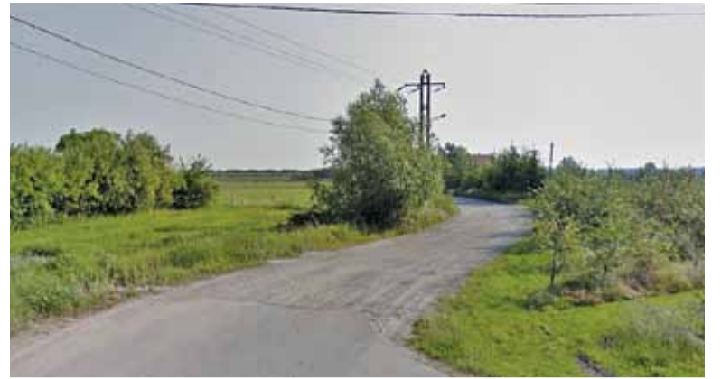
Wjazd od strony drogi wojewódzkiej