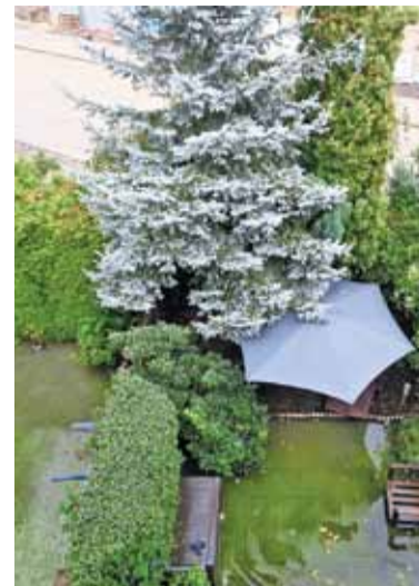
Ogródki na Saturna w poniedziałkowy poranek były kompletnie zalane