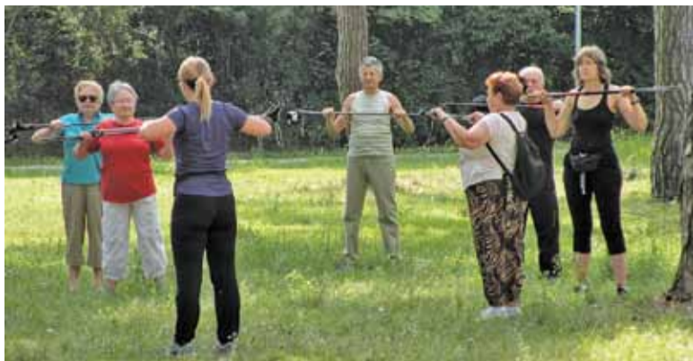
W Konstancinie seniorzy się nie nudzą