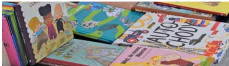
Piękne książki to dobra treść, ale także świetna grafika