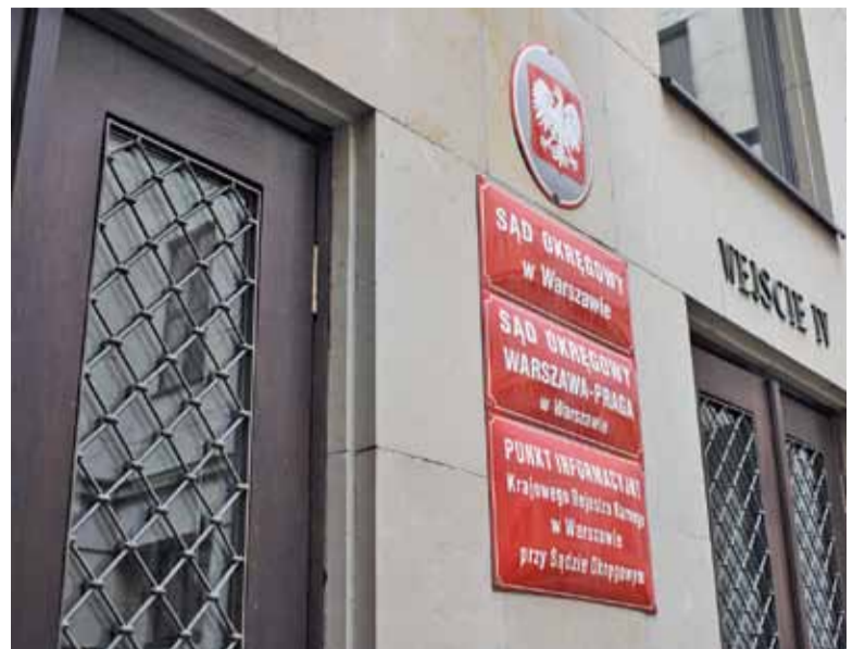
Kolejna rozprawa 3 października

Pełnomocnik Stowarzyszenia odpowiedział, że raport zawiera bardzo