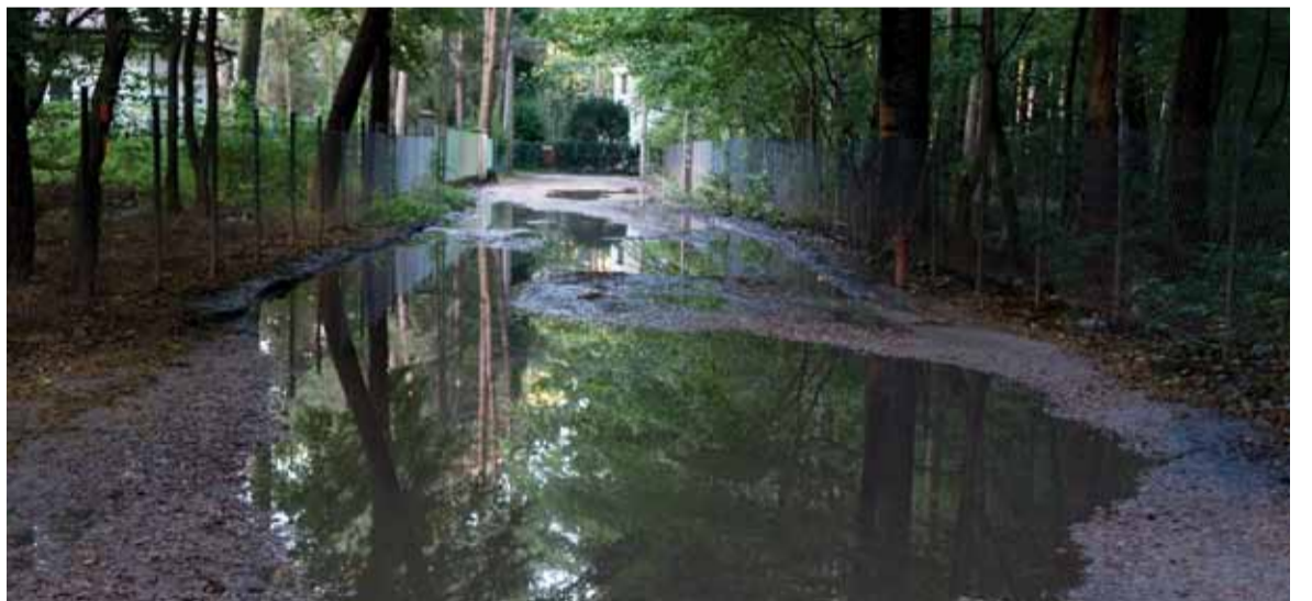
Kałuża na ul. Jodłowej zajmuje całą szerokość drogi

rozwiązuje problemu w dni deszczowe, czyli wtedy, kiedy jest on istotny. Na moje pytanie o planowany remont