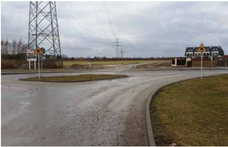
Absurd drogowy do likwidacji