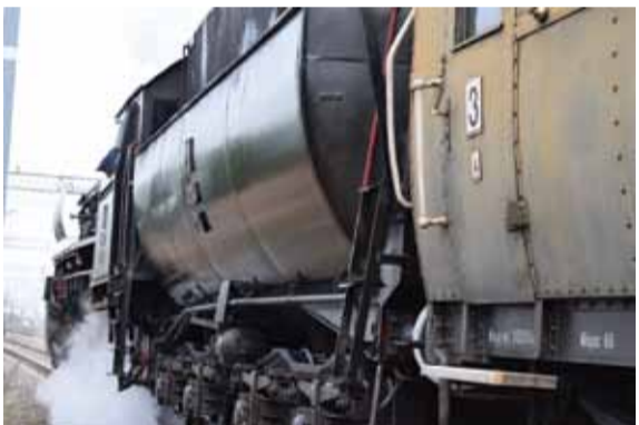
Stare wagony i spory parowóz to w każdych okolicznościach niesamowity widok