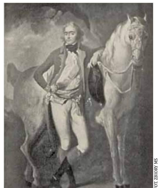
Książę Józef Poniatowski w 1786 r. w mundurze austriackim

Młody książę Józef, skłonny do hysterii, depresji, nie przejawiał chęci do nauki, do książek trzeba go było zaganiać, ale był zręczny i uwielbiał wszystko co się wiązało z wojskiem. Młodzieńca uwiel-