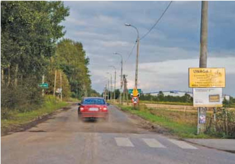
Przez ponad tydzień kierowcy jeździli drogą pozbawioną asfaltu