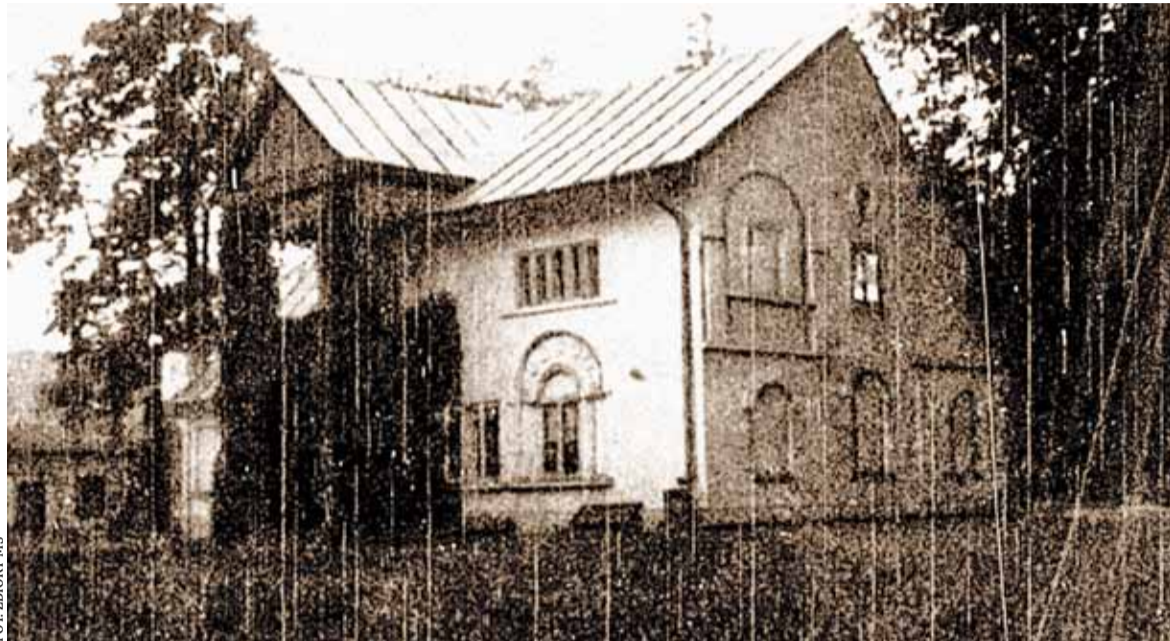
Poniatówka w 1939 r.

Czy książę Józef Poniatowski był w Piasecznie i mieszkał w budynku zwanym dziś na jego cześć „Poniatówką”? Fakty historyczne od zawsze nie miały dla mieszkańców Piaseczna większego znaczenia, a ostatnio przyszła moda na walkę o nazwy. Być może lokalni politycy, nie mając wiele do zaproponowania w swoich inicjatywach przedwyborczych, robią sporo zamieszania wokół nazw utrwalonych w tradycji miasta. Na pierwszy ogień poszła nazwa liceum i jeszcze sprawa z LO się nie zakończyła, gdy wybrzmiała propozycja nazwania Parku Chyliczki imieniem księcia Józefa Poniatowskiego. Wieść niesie, że bratanek króla Stasia był w „Poniatówce” i w parku, a w ogóle bohaterski to książę. Czy na pewno? Zaczniemy od budynku. „Poniatówka” to urokliwa willa, stojąca w parku Chyliczki, która wchodzi w skład zabudowań dawnej szkoły stworzonej przez hrabiankę Cecylię Plater-Zyberkównę. Co o tym budynku wiemy? O tym kto jest projektantem czy wykonawcą, nie wiemy nic, nie zachowały się