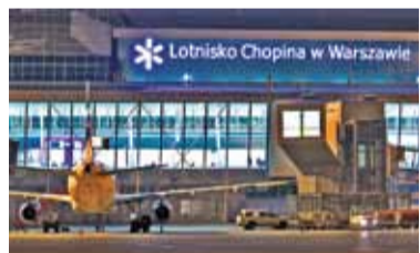
FOT. LOTNISKO CHOPINA

– Cisza nocna miałyby być wprowadzona wraz z nowym rozkładem letnim na przełomie marca i kwietnia przyszłego roku – informuje przedstawiciel lotniska. – Zakaz miałyby obowiązywać we wszystkie dni tygodnia między godz.