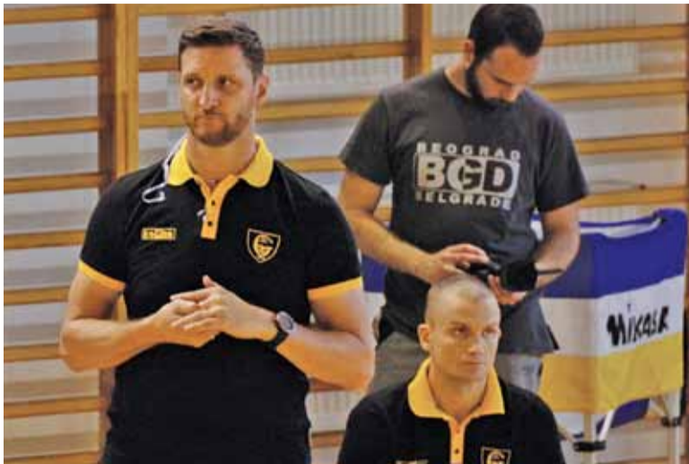
Podopieczni trenera Gruszki wygrali pierwszego seta, ale potem szło im gorzej