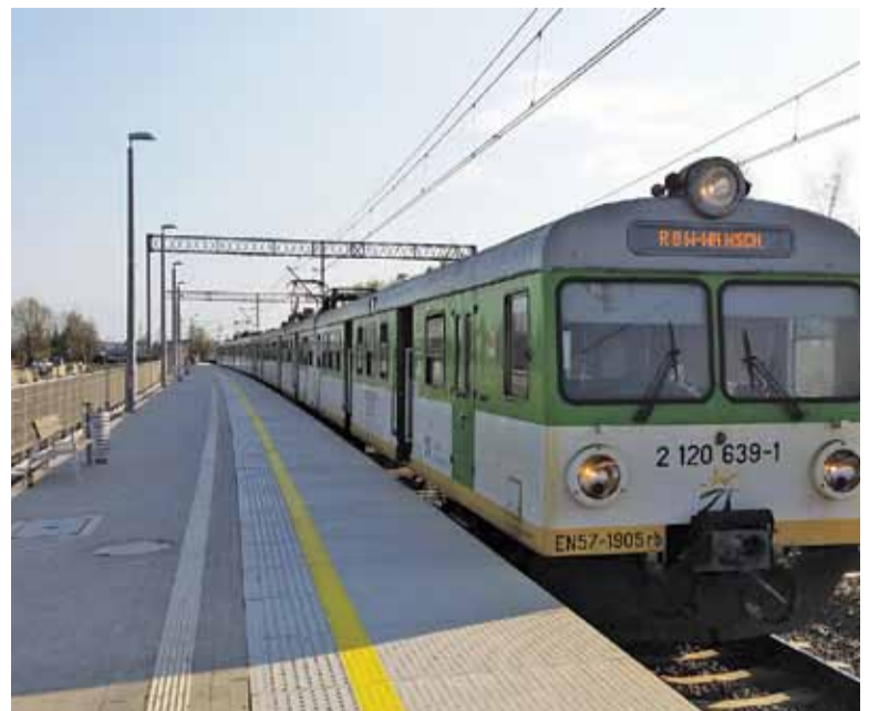
Pociągami zamiast samochodu