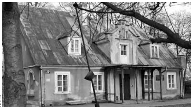
Poniatówka w 2014 r.

napisz do autorki m.szturomska@przeładpiaseczynski.pl