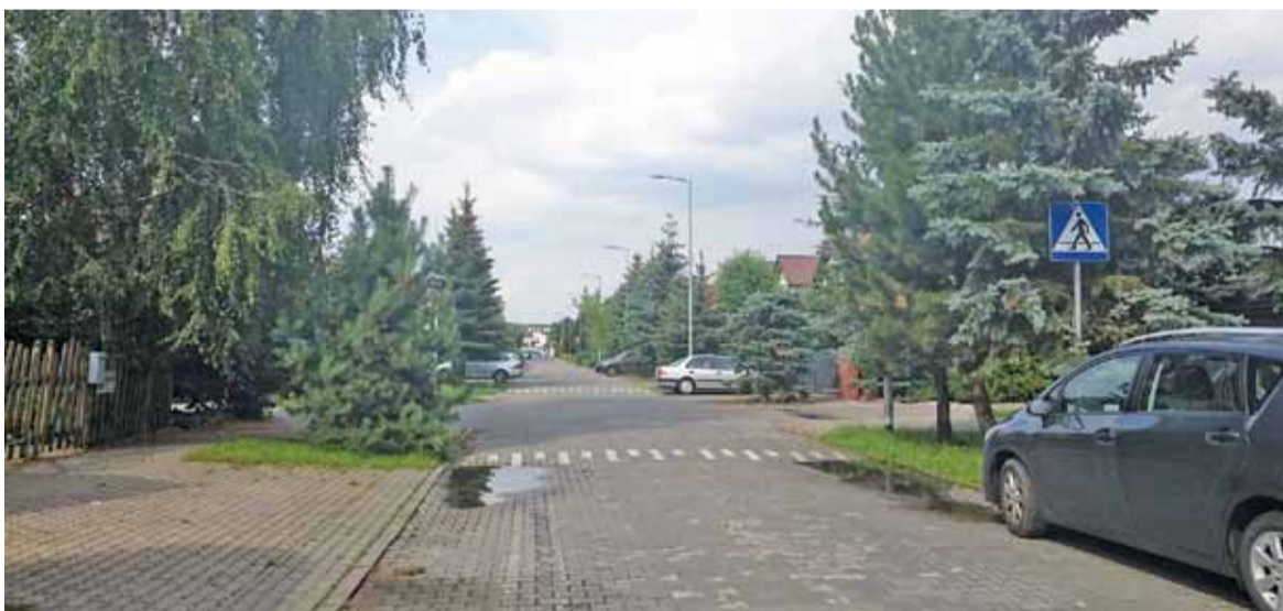
Julianów to wieś nietypowa – pełno tu domów jednorodzinnych i osiedli mieszkaniowych