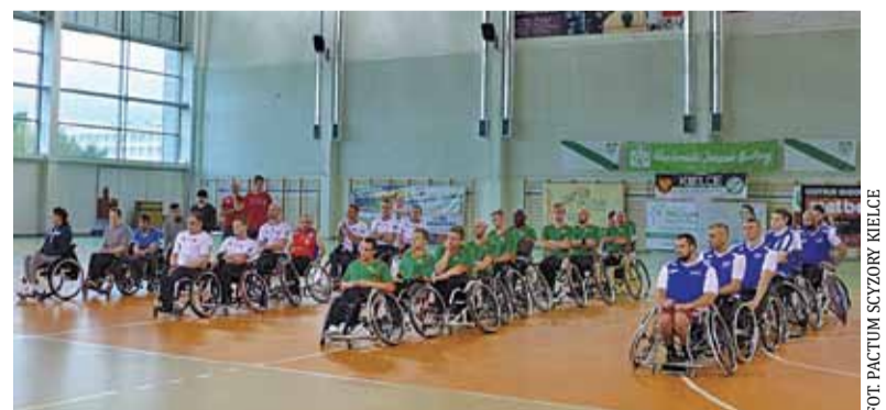
Turniej odbył się w hali w Kielcach

Pierwszego dnia imprezy IKS pokonał kielczan 64:63. Po minimalnym