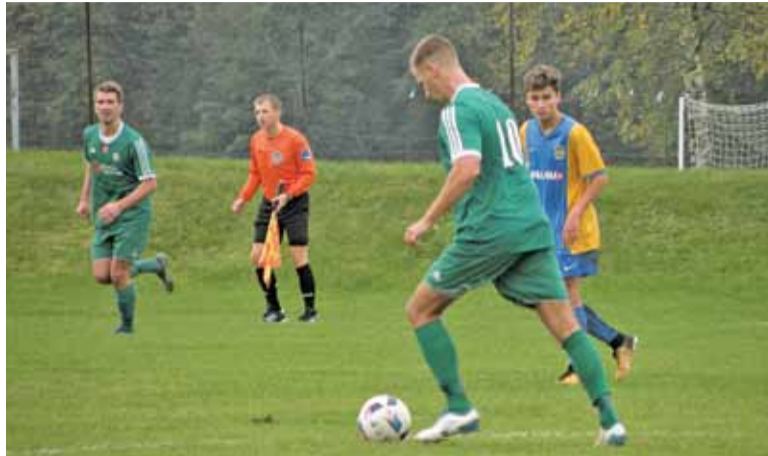
Piłkarze Konstancina przegrali mecz 2:5