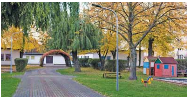
Przedszkole jest zlokalizowane w środku dużego osiedla w centrum miasta

– Wystąpiła istotna zmiana okoliczności powodująca, że prowadzenie postępowania lub wykonanie zamówienia nie leży w interesie publicznym, czego nie można było przewidzieć – wyjaśnia UMiG w dokumencie odwołującym procedurę przetargową. – Zamawiający jest w trakcie budowy Centrum Edukacyjno-Multimedialnego, gdzie będzie mieścić się 11-oddziałowe przedszkole (większe niż pierwotnie zakładano), jednocześnie została podjęta decyzja o zakupie przedszkola przy ul. Nadarzyńskiej. W związku z powyższym budowa kolejnego przedszkola w rejonie centrum miasta, nie leży w interesie pub-