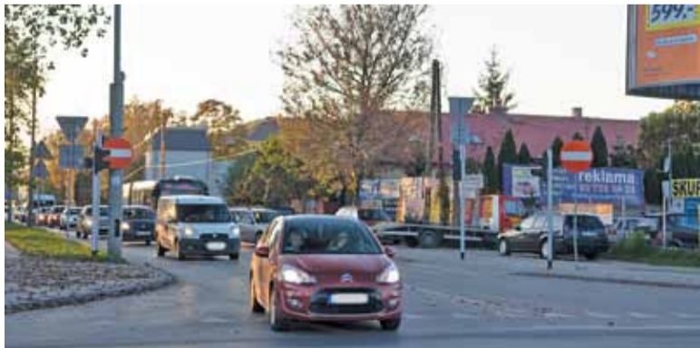
Wprowadzenie ruchu dwukierunkowego w ul. Chyliczkowskiej będzie ostatnim etapem modernizacji