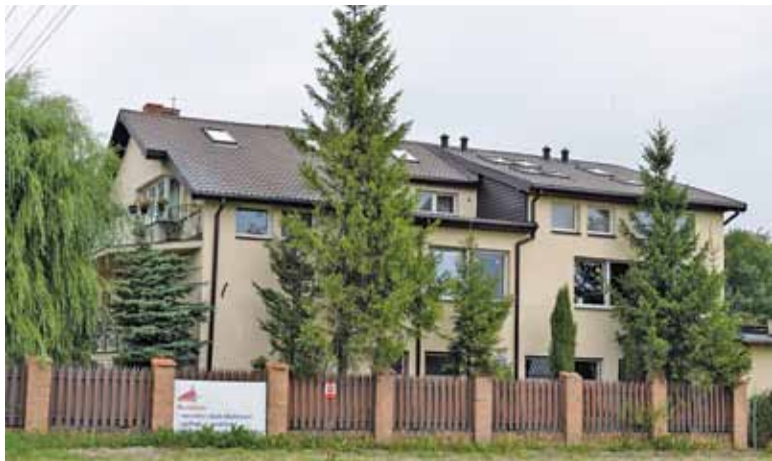
Czy dzieci z orzeczeniem będą musiały jeździć do innych gmin?