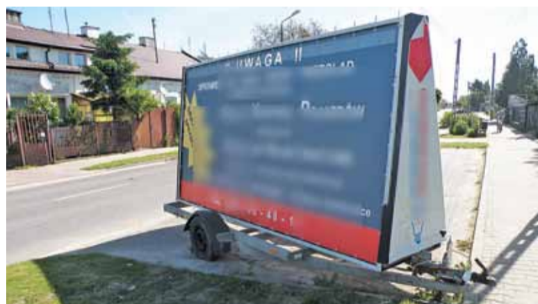
Gmina próbuje zrobić porządek z reklamami