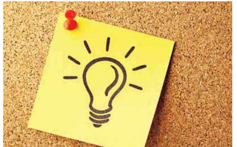
Powiat oszczędza na energii elektrycznej

Korzystne ceny wynikają z faktu, że Mazowiecka Agencja Energetyczna, która organizowała zbiorowy przetarg, negocjuje nie tylko w imieniu wszystkich jednostek należących do Powiatu Piaseczyńskiego, ale również innych