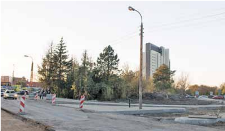
Budowa nowego wylotu ul. Julianowskiej jest już na ostatnim etapie prac