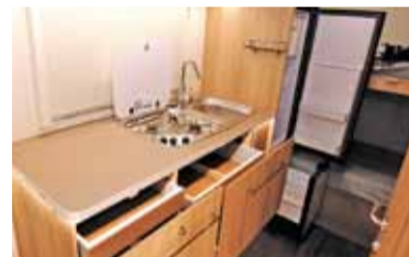
Kuchnia, w której powstanie wiele filmów