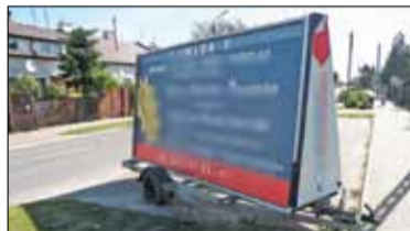
|| Góra Kalwaria - Wyeliminować chaos s. 4