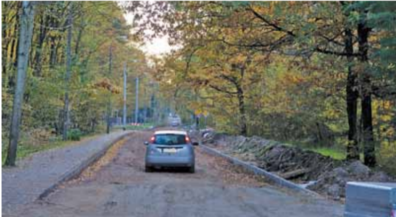
Kierowcy na razie korzystają z gruntowej nawierzchni ulicy