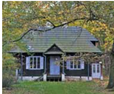
Każda kolejna zima nadwyreża stan nieogrzewanego drewnianego domu

Po blisko czterech miesiącach od podpisania listu intencyjnego z ZHP w sprawie zakupu Domu „Zośki” nadciągają zmiany. Gmina chce kupić nieruchomość samodzielnie.