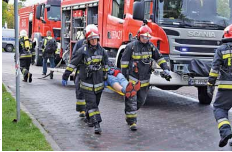
Ćwiczenia pokazały dobrą współpracę między służbami

Następnego dnia, w ramach ćwiczeń, władze powiatu oraz część urzędników ewakuowano do dawnej bazy dywizjonu raketowego w Tomicach, gdzie utworzono zapasowe miejsce pracy. Podłączono komputery, przywieziono dokumenty, stworzono punkt medyczny i miejsca do spania.