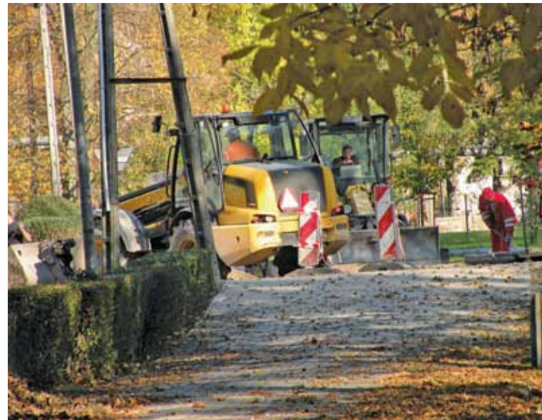
Každy remont wiąże się z pewnymi uciążliwościami