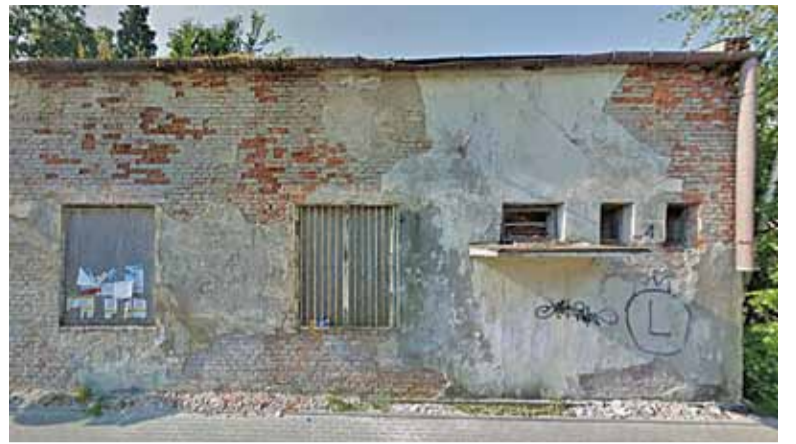
Dawna hydrofornia w Górze Kalwarii

Oczywiście sytuacja nie była kryzysowa, o czym wszyscy wiedzieli, jednak ćwiczenia pokazały dobrą współpracę między służbami oraz prawidłowe działania Biura Bezpieczeństwa, Zarządzenia Kryzysowego i Spraw Obronnych Powiatu. JG