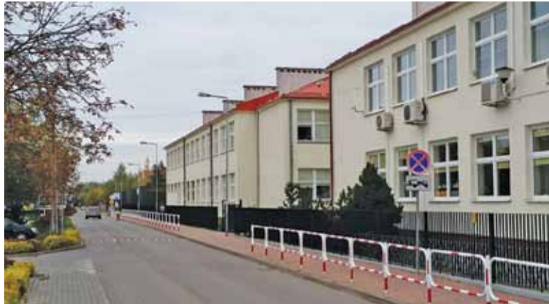
Szkoła będzie też po drugiej stronie ulicy

Rozbudowa szkoły to wieloetapowa, złożona inwestycja gminy Lesznów. Na początku gmina musiała nabyć za 2,3 mln zł działkę o powierzchni 4781 m 2 , znajdującą się po drugiej stronie ulicy Szkolnej, za skateparkiem. Na potrzeby inwestycji w maju br. zmieniono plan zagospodarowania przestrzennego. Prace projektowe mają potrwać do końca tego roku, a w styczniu gmina planuje złożyć do starostwa dokumentację, na podstawie której zostanie wydane pozwolenie na budowę. W maju gmina planuje ogłosić przetarg na wykonawcę inwestycji, natomiast sama rozbudowa ma potrwać 14 miesięcy od momentu rozpoczęcia prac. Przygotowanie dokumentacji technicznej pochłonęło ponad 115 tys. zł. Rozbudowa szkoły ma kosztować 12 mln zł, a