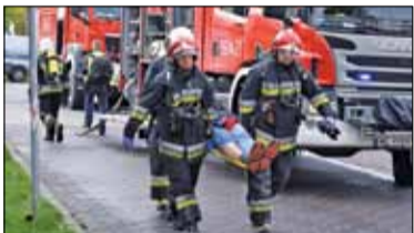
|| Powiat - Wybuch i strzelanina s. 2

PIASECZNO || GÓRA KALWARIA || KONSTANCIN-JEZIORNA || LESZNOWOLA || PRAŻMÓW || TARCZYN