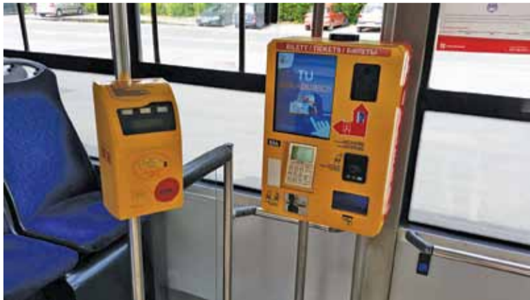
Biletomat znajduje się na wysokości drugich drzwi autobusu