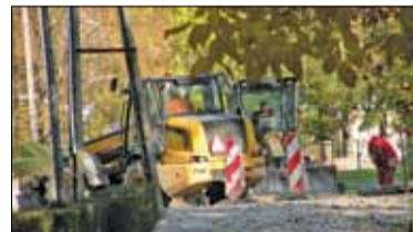
|| Konstancin-Jeziorna - Trudny czas remontu s. 7