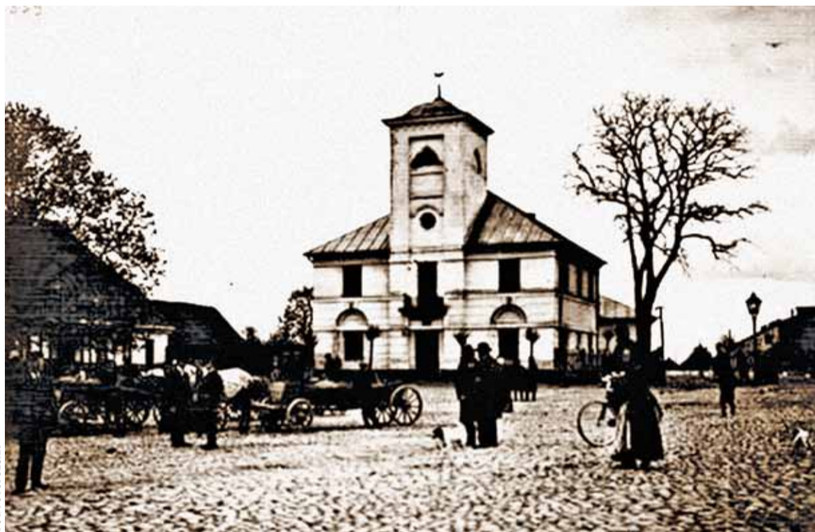
Ratusz w Piasecznie sprzed 1914 r.

O godzinie piątej rano 11 marca 1856 r. z piaseczyńskiego magistratu mieszkańcy Piaseczna usłyszeli głos obwieszczający smutną wiadomość – Burmistrz nie żyje!