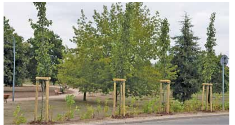
W Parku Miejskim posadzono między innymi nowe drzewa