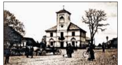
|| Historia - Gdzie jest grób burmistrza Bartłomieja? s. 9