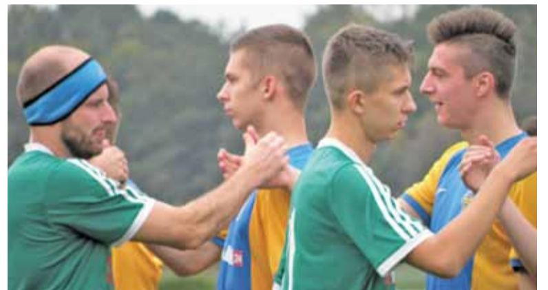
Sobotni rywale KS-u zajmują aktualnie 5 miejsce w tabeli

Po pierwsze brak napastnika. Kontuzjowany jest Tomasz Folwarski, więc na tej pozycji pojawia się ogromny kłopot. Niektóre sytuacje stuprocentowe były całkowicie zaprzepaszczone właśnie z powodu braku wykończenia. Zagłębiamy w statystyki – tylko 13