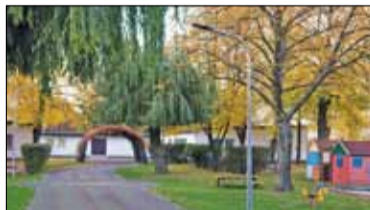
|| Piaseczno - Problemy decyzyjne s. 5