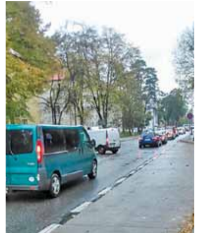
Sznur samochodów na Grapie

– W związku z trwającą przebudową niestety konieczne było zamknięcie ulicy Mirkowskiej, tym bardziej, że równoległe prowadzone są roboty związane z budową sieci kanalizacji sanitarnej, której inwestorem jest Gmina Konstancin-Jeziorna. Roboty prowadzone są eta-