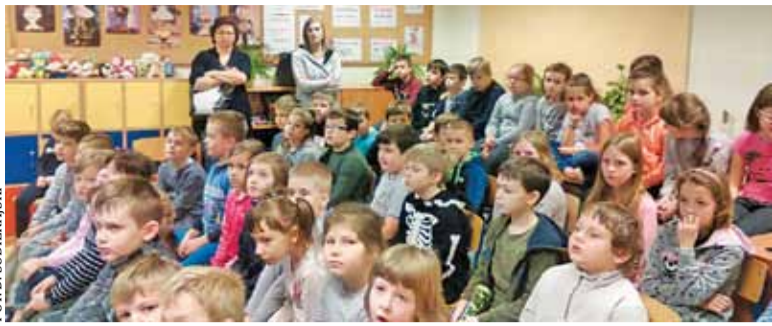
Strażacki autorytet z pewnością pomaga w przekazywaniu wiedzy