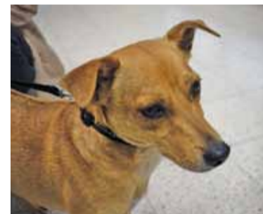
Pies miał dużo szczęścia. Przeżył