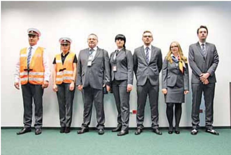
Nowe stroje pracowników ZTM