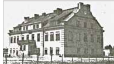
|| Historia - Szkoła w Pamięce cz. 2 s. 9