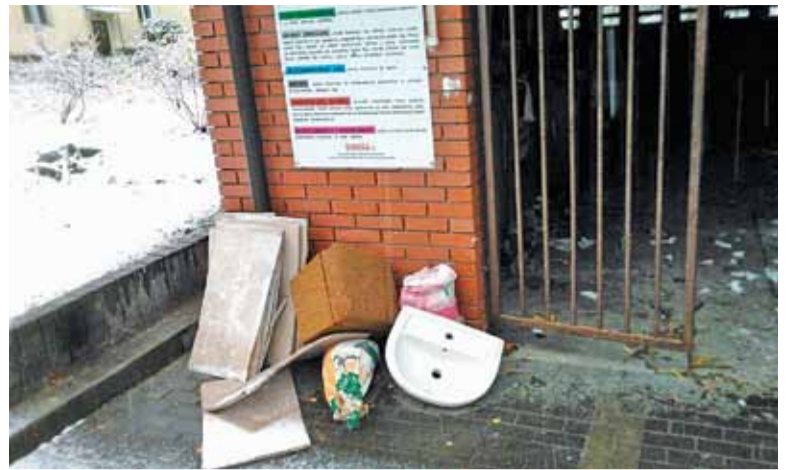
Jak zakończy się sprawa przetargu na odbiór odpadów?