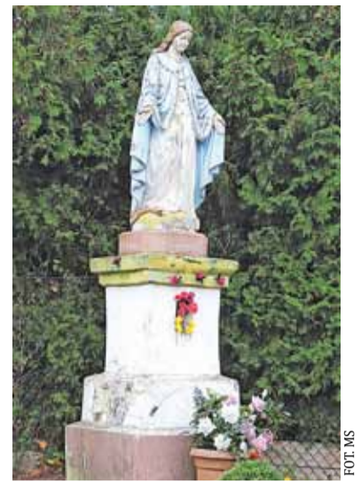
Kapliczka w Kopanej

Dom Ludowy wyposażono w aparat radiowy, gramofon, fortepian i – co