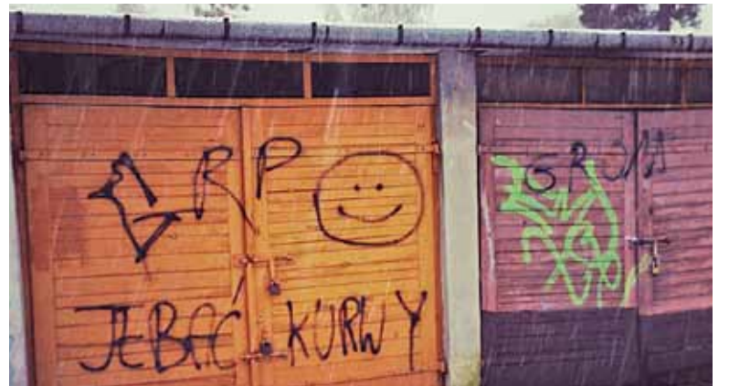
Szkodnicy na ogół czują się bezkarni

„Szanowni Mieszkańcy. W ostatnich dniach października na terenie naszego sołectwa doszło do niszczenia mienia naszej wspólnoty. Przewrócono znak przystanku autobusowego, zbito szybę tablicy informacyjnej, powyrzucano odpady komunalne z koszy na śmieci, zniszczono kosz na śmieci na ryneczku i próbowano wyrwać jedną z ławek, a ponadto dokonano zniszczenia pojazdu jednego z mieszkańców naszej wsi.