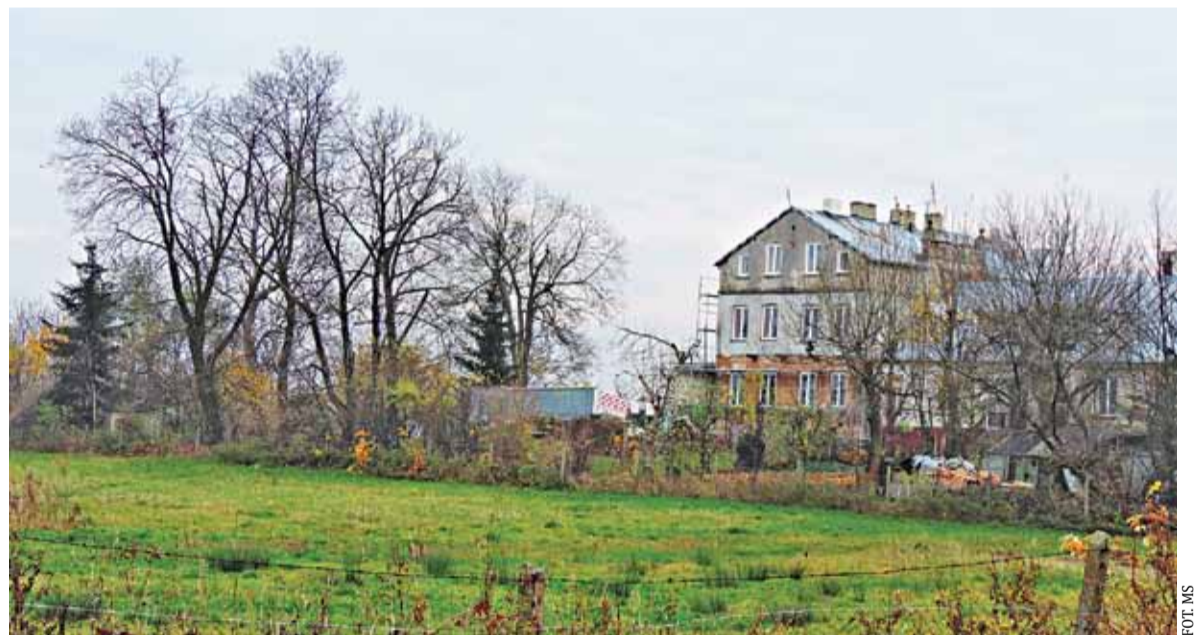
Dwór w Kopanej