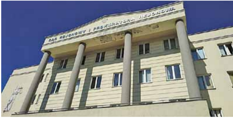
Decyzje Sądu Rejonowego zweryfikuje Sąd Okręgowy w Warszawie