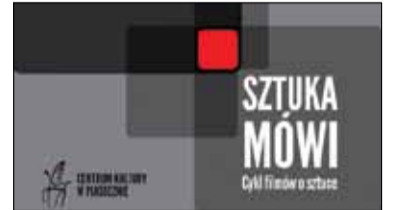
|| Kultura - „Sztuka Mówi” do kinomana s. 12