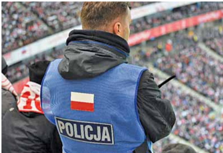
Spotter podczas meczu