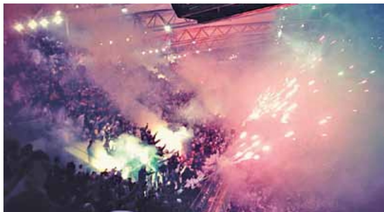
Fajerwerki na meczu Legii z Górnikiem