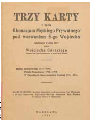
„Trzy karty” strona tytułowa książki Wojciecha Górskiego

napisz do autorki m.szturowska@przekladpiaseczynski.pl