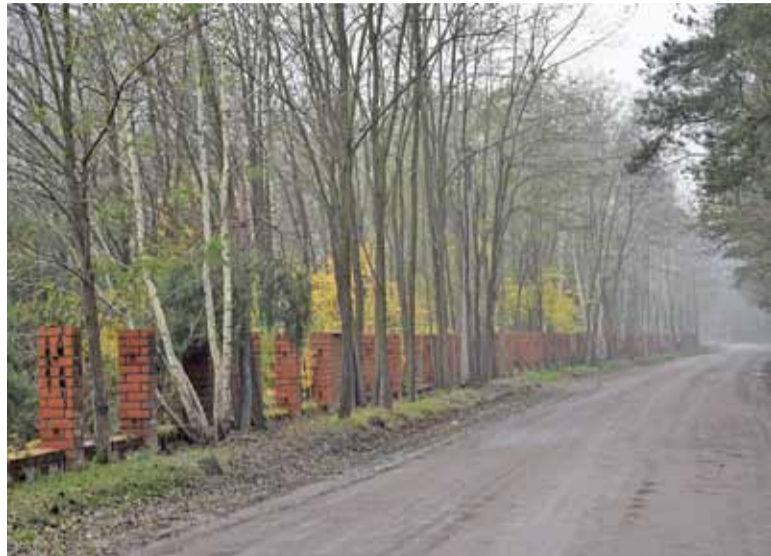
Zadrzewiony teren, koło lasu, może się stać polem do popisu dla fanów intensywnej zabudowy