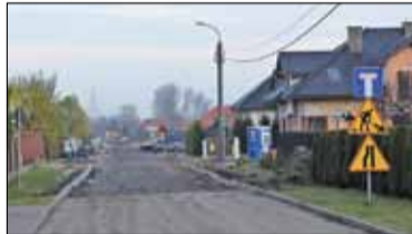
|| Piaseczno - Za wysoka oferta s. 7