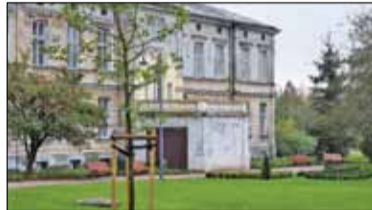
|| Piaseczno - Park dostanie oficjalną nazwę? s. 5