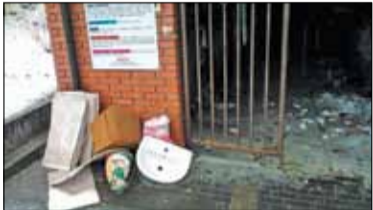
|| Konstancin-Jeziorna - Co ze śmieciami? s. 2

PIASECZNO || GÓRA KALWARIA || KONSTANCIN-JEZIORNA || LESZNOWOLA || PRAŻMÓW || TARCZYN