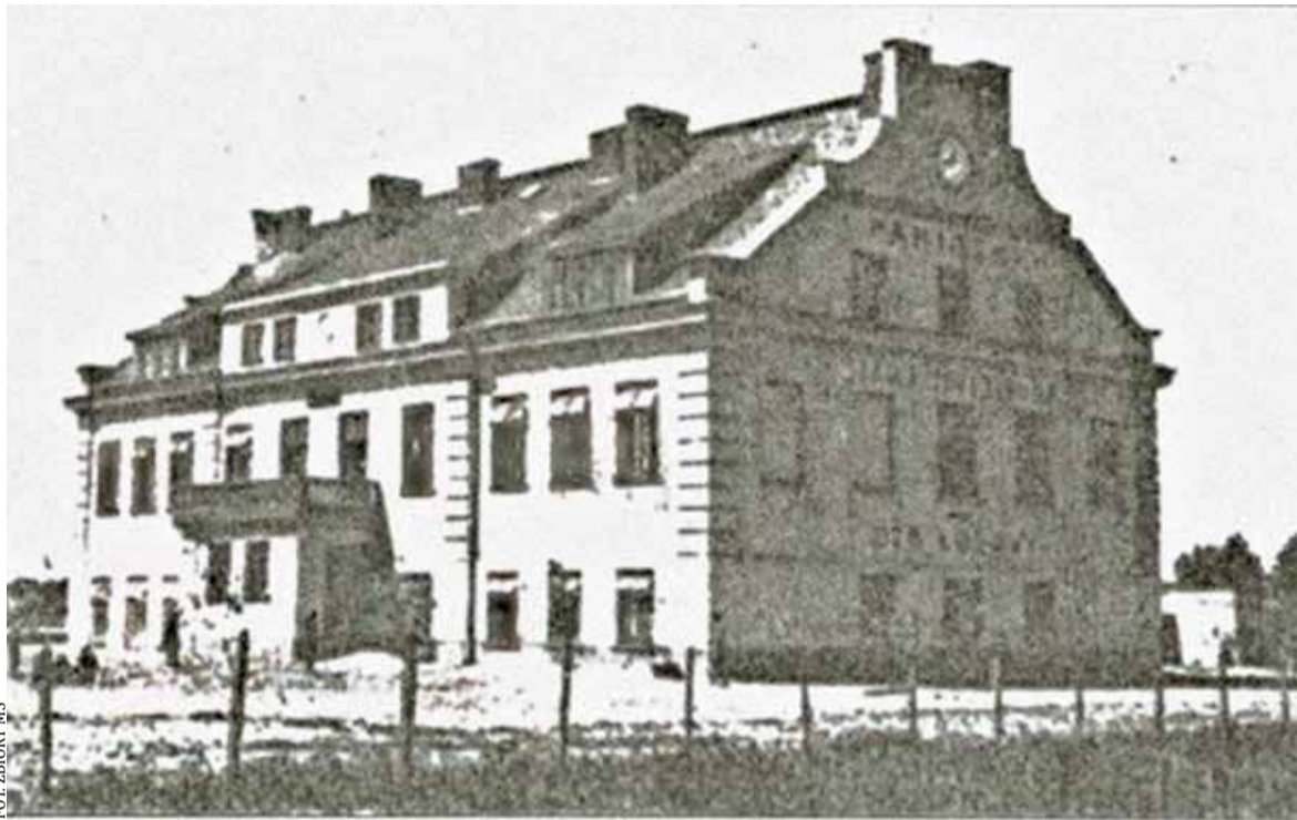
Szkoła w Pamiątce w roku 1928