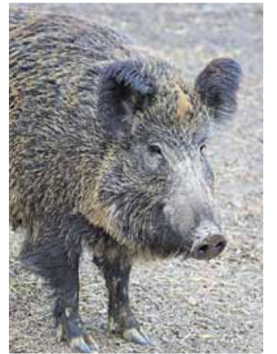
ASF to zakaźna i zaraźliwa choroba świń domowych oraz dzików

– Komenda Powiatowa Policji w Piasecznie tel. (22) 756-75-01.