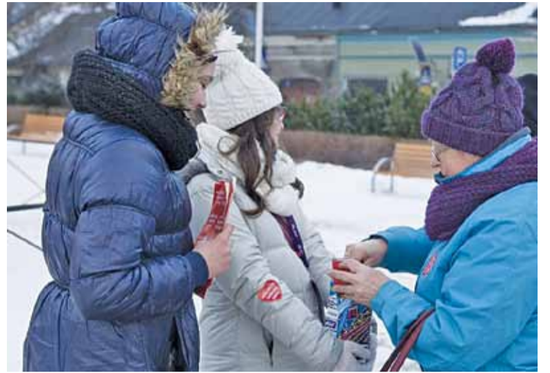
WOŚP łączy kilka pokoleń w jednym wspólnym celu

napaczka.pl lista rodzin z określonymi potrzebami. Każdy darczyńca może wybrać rodzinę, której chce pomóc. Założeniem akcji jest dobrze ukierunkowana pomoc, która ma na celu sprawić, żeby „ruszyli do przodu” dzięki wsparciu innych. To mogą być porządne buty na zimę, opał, laptop, który pozwoli matce chorego dziecka podjąć pracę zdalną, czy pomoc prawnika. Jeśli chcemy podarować rzeczy dla wybranej rodziny, należy dostarczyć je do regionalnego magazynu. W tym roku Piaseczyńska