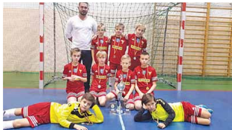
Zawodnicy Korony z medalami