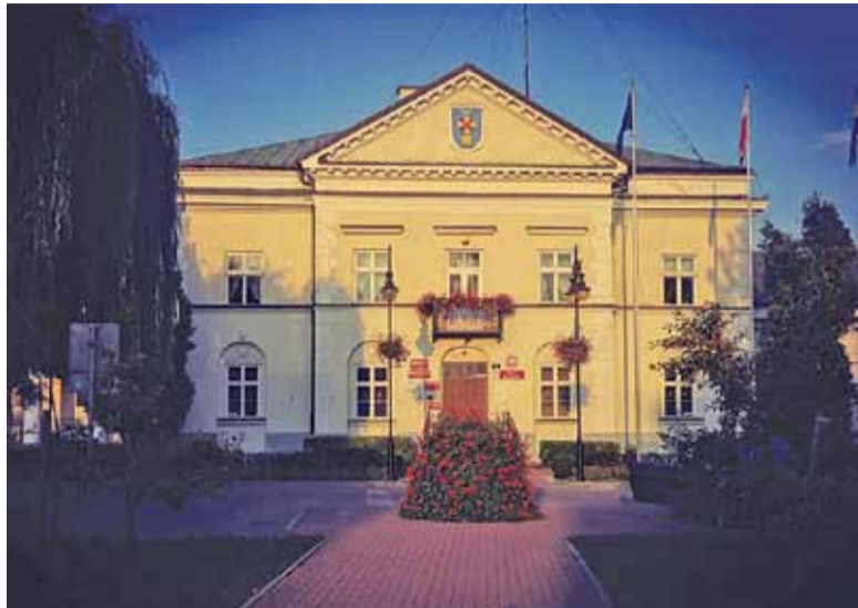
Zdaniem burmistrza Góra Kalwaria to bezpieczne miejsce