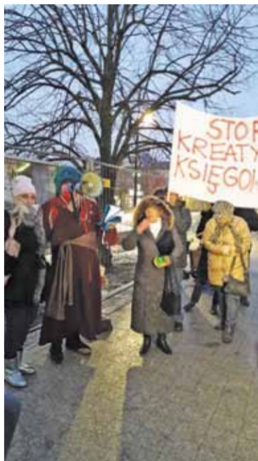
Protestujący zarzucają gminie kreatywną księgowość

Kilkadziesiąt osób protestowało w poniedziałek w sprawie przedszkolnych dotacji. Na dwie godziny zablokowano ruch na ul. Kościuszki w Piasecznie.