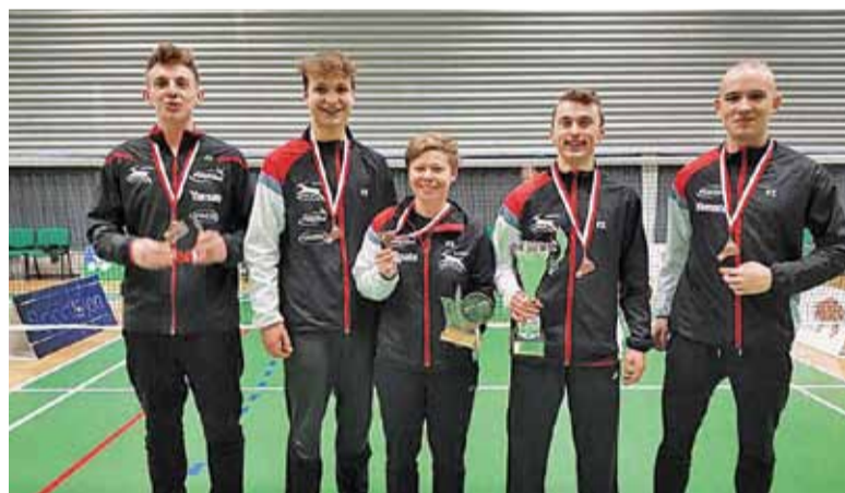
Zwycięski skład KS Hubertusa