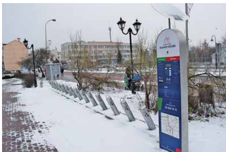
Stacja pod Sądem Rejonowym w Piasecznie