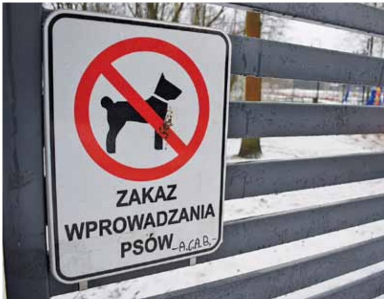
Psi zakaz w dolnośląskim jest bezprawny, a w Józefosławiu?