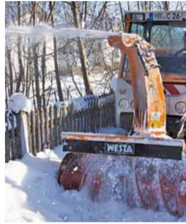
Odśnieżanie chodnika to obowiązek właścicieli nieruchomości

Uprzątnięcie błota, śniegu, lodu czy innych zanieczyszczeń z chodników położonych wzdłuż nieruchomości stanowi obowiązek właściciela nieruchomości – stwierdził Sąd Najwyższy.