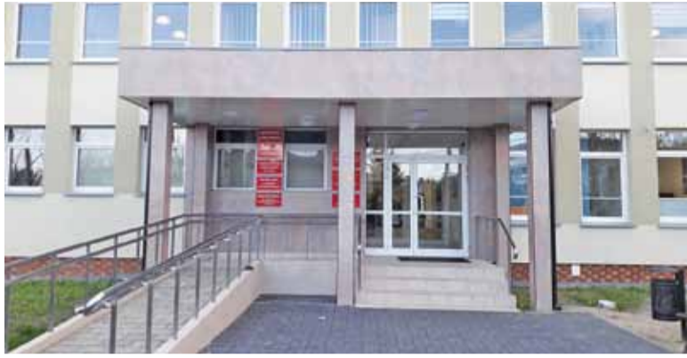
Jedną z zakończonych w 2017 roku inwestycji była modernizacja budynku starostwa