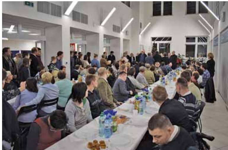
Tylu przyjaciół w jednym miejscu musiało poskutkować niezwykłą i radosną atmosferą