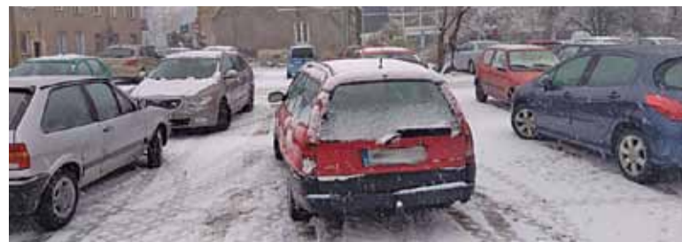
To ile będzie miejsca na nowych parkingach zależy od nas