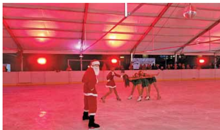
Mikołaj zawitał na lodowisko