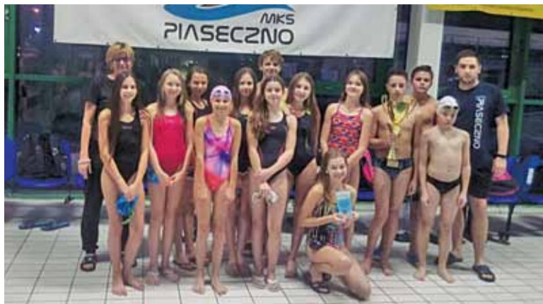
Piaseczno z pucharem